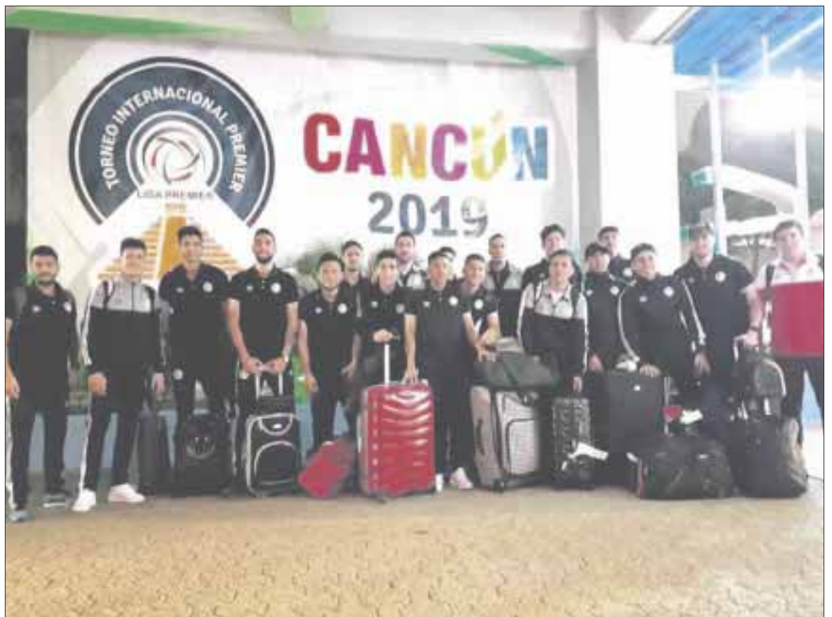
El juego Inaugural se realizará entre Mineros de Zacatecas y Antigua de Guatemala este lunes 9 de diciembre en el Estadio “Cancún 86” a las 15:00 horas.

Los equipos internacionales arribaron a Cancún, encabezados por Paranaense, de Brasil, quienes llevaron a cabo su primer entrenamiento en las paradisíacas playas del Caribe mexicano.