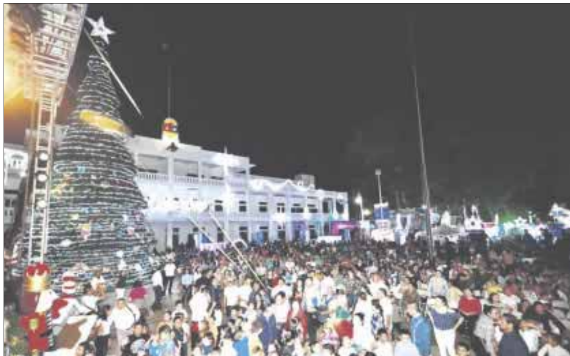
Acuden más de mil 500 personas al encendido del árbol navideño, de más de 25 metros de altura, en la villa del DIF, frente al Palacio de Gobierno