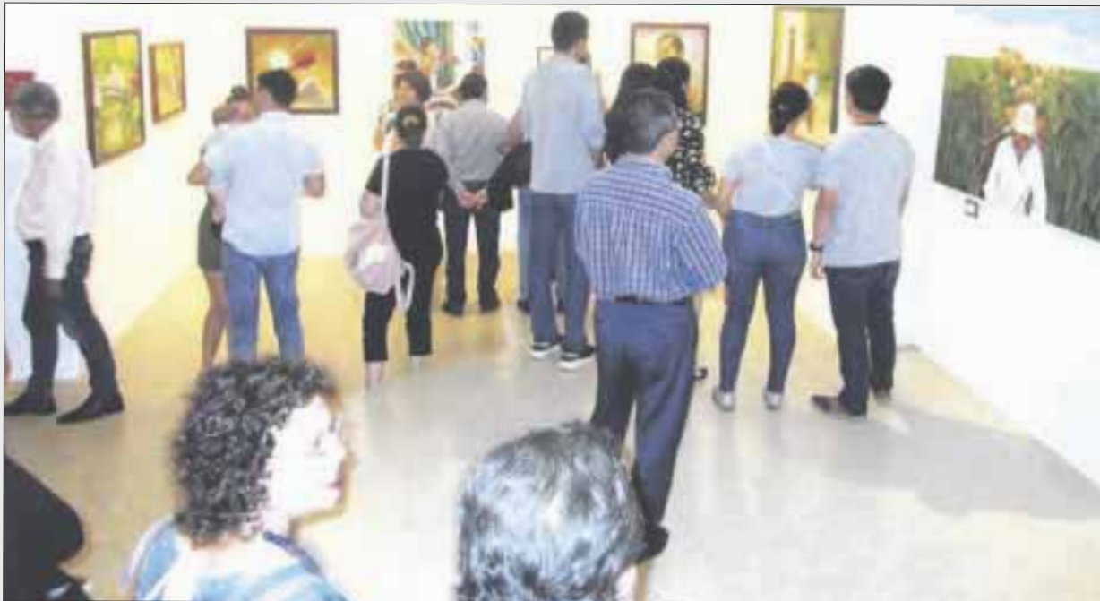
La exposición colectiva denominada "Punto y Croma", en el museo de la Cultura Maya.

Chetumal.- Comparten artistas plásticos chetumaleños, en coordinación con el Instituto de Cultura y las Artes de Quintana Roo, que dirige la maestra Jacqueline Estrada Peña, la exposición colectiva denominada "Punto y Croma", en el museo de la Cultura Maya.