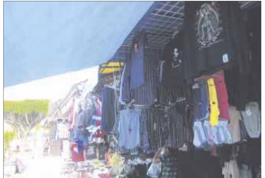
En lo que va del año, alrededor de 100 negocios bajaron sus cortinas, dada la inestabilidad financiera, al no tener las ventas que esperaban.

Coincidió en que este año fue duro para el sector empresarial, por lo que restaurantes, hoteles, comercios, discotecas y bares, principalmente apuestan a las promociones navideñas “Tenemos buenas expectativas para la última temporada del año, el gremio está buscando alternativas para que llegue mayor clientela a los establecimientos y tener números estables”, concluyó.