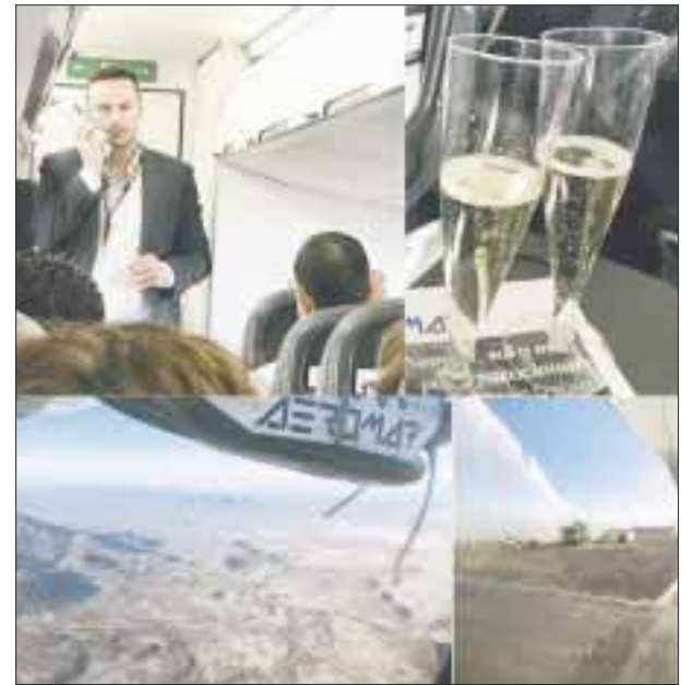
A bordo el CEO de la aerolínea brindó con los pasajeros. Llegando a Ramos Arizpe y el bautizo del avión.

"Todo está bien" es regalo para prepararnos con nueva conciencia: la del amor a nosotros