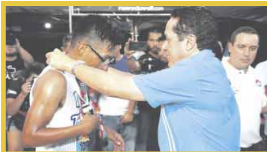
El gobernador Carlos Joaquín González entregó medallas a los atletas más destacados de la justa deportiva.

En el segundo día de competencia cuando se efectuó la edición 35 del Maratón Internacional nocturno, el cierre parcial de calles, y las afectaciones, fueron desde la 05 horas del sábado, sobre la avenida Kabah se montó el arco de salida para los competidores. Se dice que los más afectados fueron empelados de hoteles quienes utilizan transporte público.