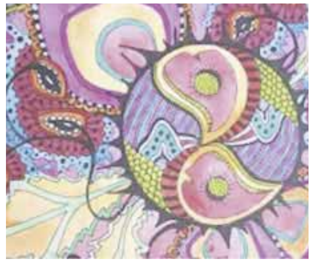
Festival Holístico Navideño "Todo está bien" el próximo domingo.

mismos y a los demás. ¡Estamos Unidos para Sanar! En esta ocasión, el Panel Magistral estará conformado por siete conferencistas expertos en Astrología, Curación energética, Ho'oponopono, Medicina tradicional China, Musicoterapia, Bioneuroemoción, Feng Shui , Kundalini Yoga, Radiestesia, Runas, Árbol Genealógico y Reiki , entre muchas especialidades más. Además, Música, Teatro y Sorpresas, amenizando el evento.