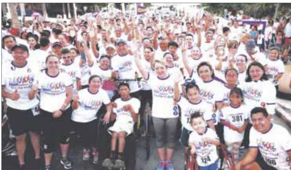
La carrera organizada por el Centro de Rehabilitación Integral Municipal y el Centro de Rehabilitación Integral de Cozumel, se realizó en el marco del Día Internacional de las Personas con Discapacidad.