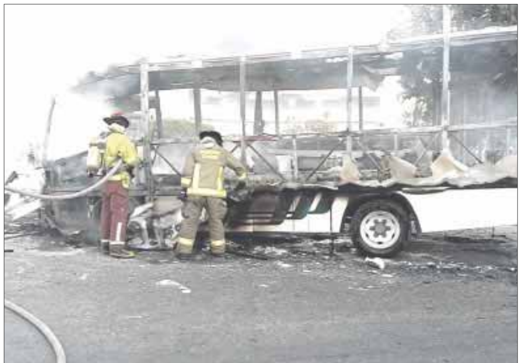
Buscarán someter a las unidades de transporte público a revisiones periódicas para salvaguardar la seguridad de los usuarios y no se repita el caso de la semana pasada.

Una de las mangueras tenía una fuga pequeña que, con el calentamiento del combustible se fue incendiando con más fuerza, provocando un incendio. Se destaca también que la fuga pudo originarse por falta de mantenimiento a la unidad.