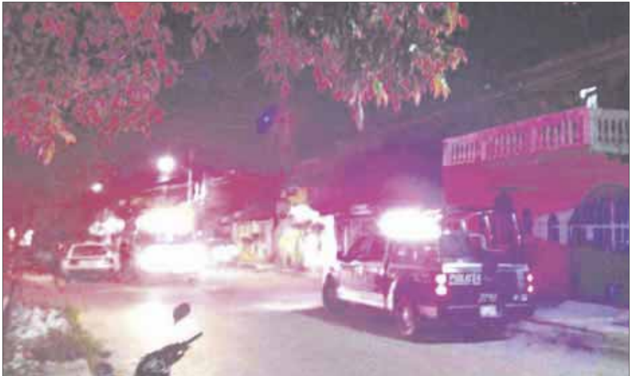
El ahora occiso fue identificado, tenía 23 años de edad y múltiples tatuajes en el cuerpo. Hasta el momento sus homicidas no han sido capturados.

Corporaciones policíacas pusieron en marcha un operativo, con el que se originó una persecución de los agresores hasta la Región 232, en la avenida Leona Vicario, donde las primeras versiones indicaron que los elementos encontraron abandonado un automóvil, tipo Tsuru, de color blanco, con armas en el interior, mientras los presuntos responsables, no pudieron ser capturados.