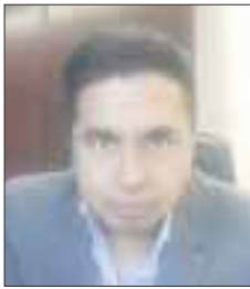
Por Edgar Gómez Flores

Estos claroscuros de nuestro país, en este tema, se acentuaron con el último asilo registrado del presidente de Bolivia, el dirigente indígena, Evo Morales. Este evento boliviano, tuvo diversos yerros por parte de nuestro país.