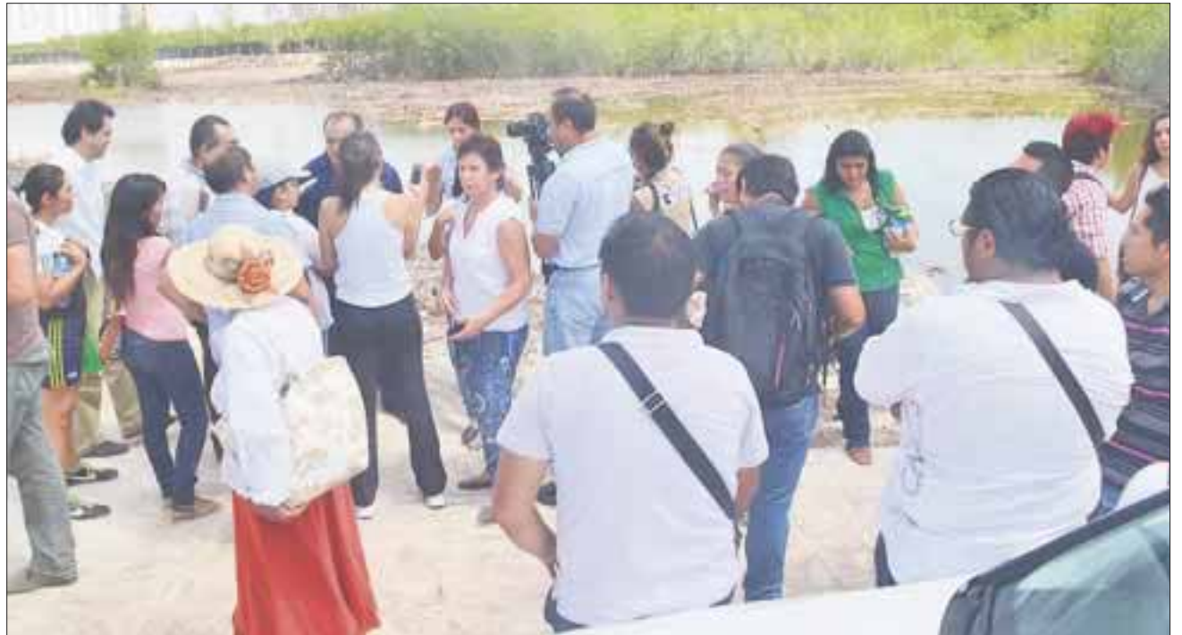
El término Plogging es resultado de una fusión de la palabra inglesa running y de la expresión sueca plocka upp, que significa recoger.

Se desarrollará el próximo 26 de enero a las 12:00 horas en la entrada del malecón.