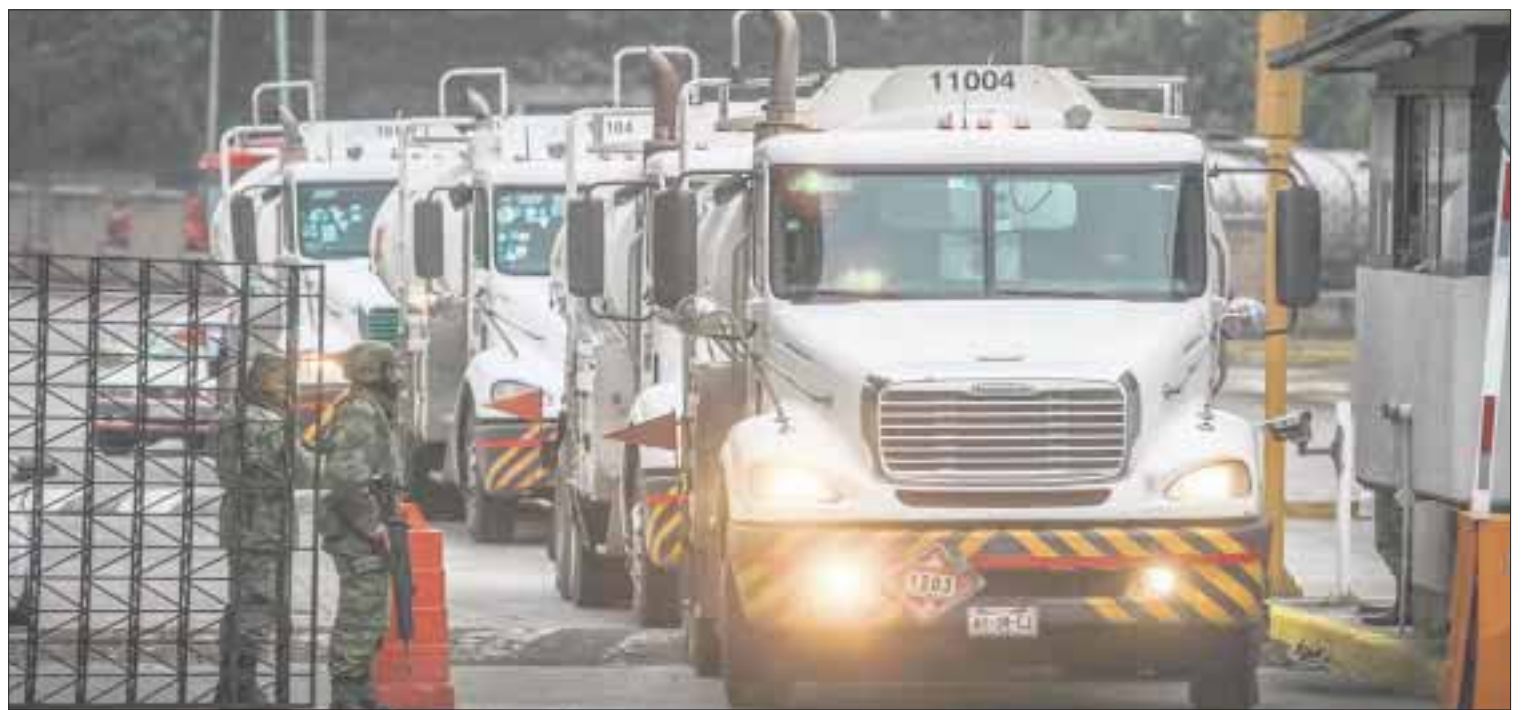
Se han detenido a 435 personas en el marco de la estrategia de combate al robo de hidrocarburos

En el rubro de aseguramientos, expuso que han sido asegurados cuatro millones 321 mil 88 litros de hidrocarburo, 475 mil 121 litros de gas licuado de petróleo, así como 955 vehículos, 32 pipas, 41 remolques, 66 cisternas o tanques, cuatro mil 749 bidones, 29 inmuebles y 11