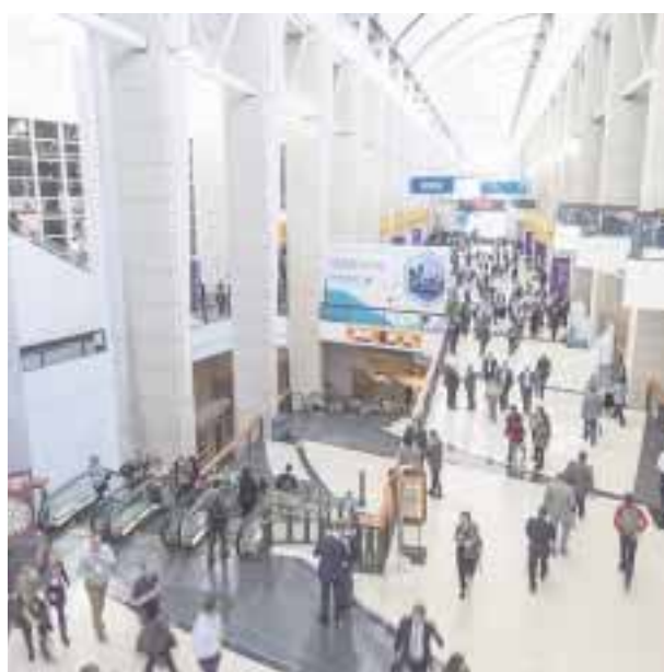
Las convenciones en Chicago, sector de gran importancia.