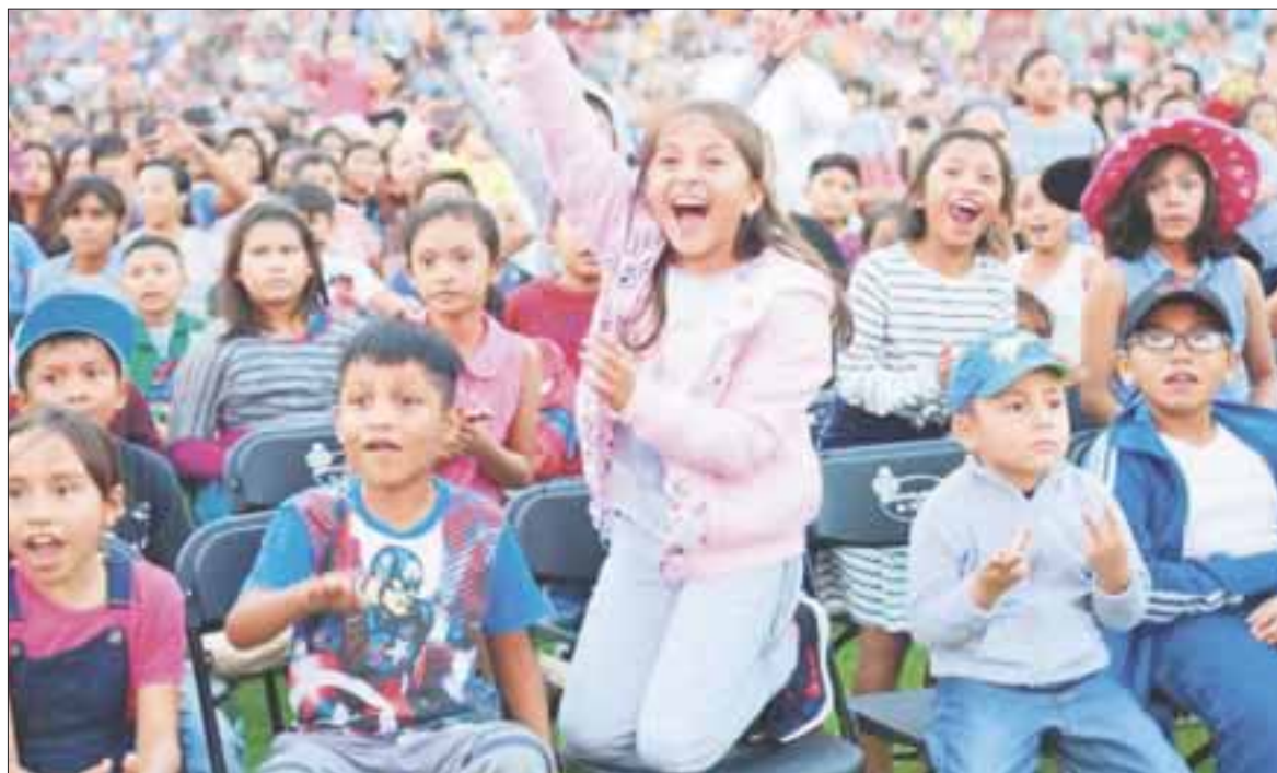
Gaby Rej n festej  a miles de ni os de los 11 municipios de la entidad, con festivales navide os en el 2018 y festivales de D a de Reyes en este 2019.

Chetumal.- Con el objetivo de otorgar a la ni ez y sus familias espacios de sano esparcimiento, recreaci n y de fomentar las tradiciones, el gobierno del estado, a trav s del DIF Quintana Roo, que encabeza la se ora, Gaby Rej n de Joaqu n, festej  a miles de ni os de los 11 municipios de la entidad con festivales navide os en el 2018 y festivales de D a de Reyes en este a o.