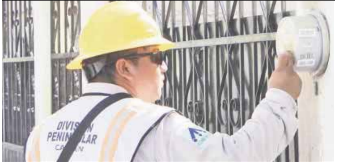
Inconformidad en el sector empresarial de Cancún, ante la imposibilidad de poderse amparar ante el incremento en las tarifas de energía eléctrica en el país.

Explicó que lamentablemente no hay oportunidad de amparo, porque es una Comisión Reguladora y quedaron desprotegidos los usuarios, por ello en lo que se trabaja es en crear los mecanismos para evitar que, el tipo y forma en que se dio este incremento en la tarifa de energía, no se vuelva a dar.