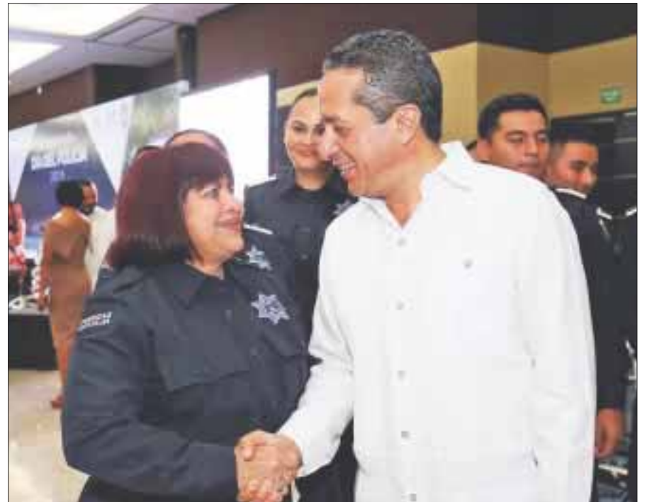
Mejoran las condiciones econ micas de los polic as, para que sus familias vivan mejor, anuncia Carlos Joaqu n.

Genaro Cano, chetumale o de origen, fue reconocido por el gobernador Carlos Joaqu n en el evento conmemorativo del D a del Polic a, en el que se entregaron 17 reconocimientos m s: nueve por a os de servicio, uno por 35 a os de servicio y siete por acciones destacadas