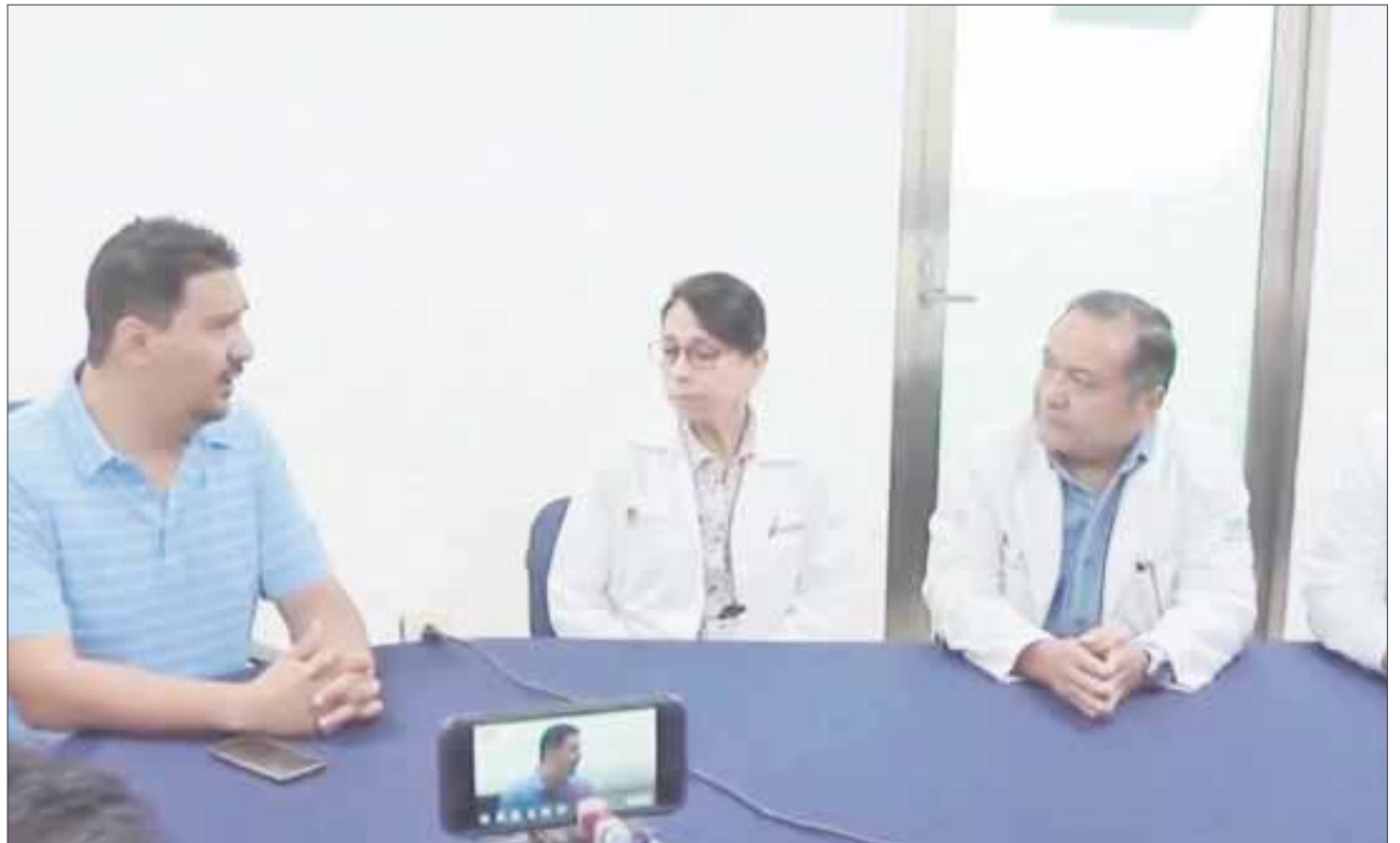
Exhiben la falta de espacios para atender a pacientes con problemas psiquiátricos en Quintana Roo.

En la medida que es posible, dicha situación se suple por las organizaciones no gubernamentales, que dejan ver la falta de atención, capacidad e incluso interés en atender este tipo de casos, de ahí la necesidad de exigir al gobierno una respuesta inmediata.