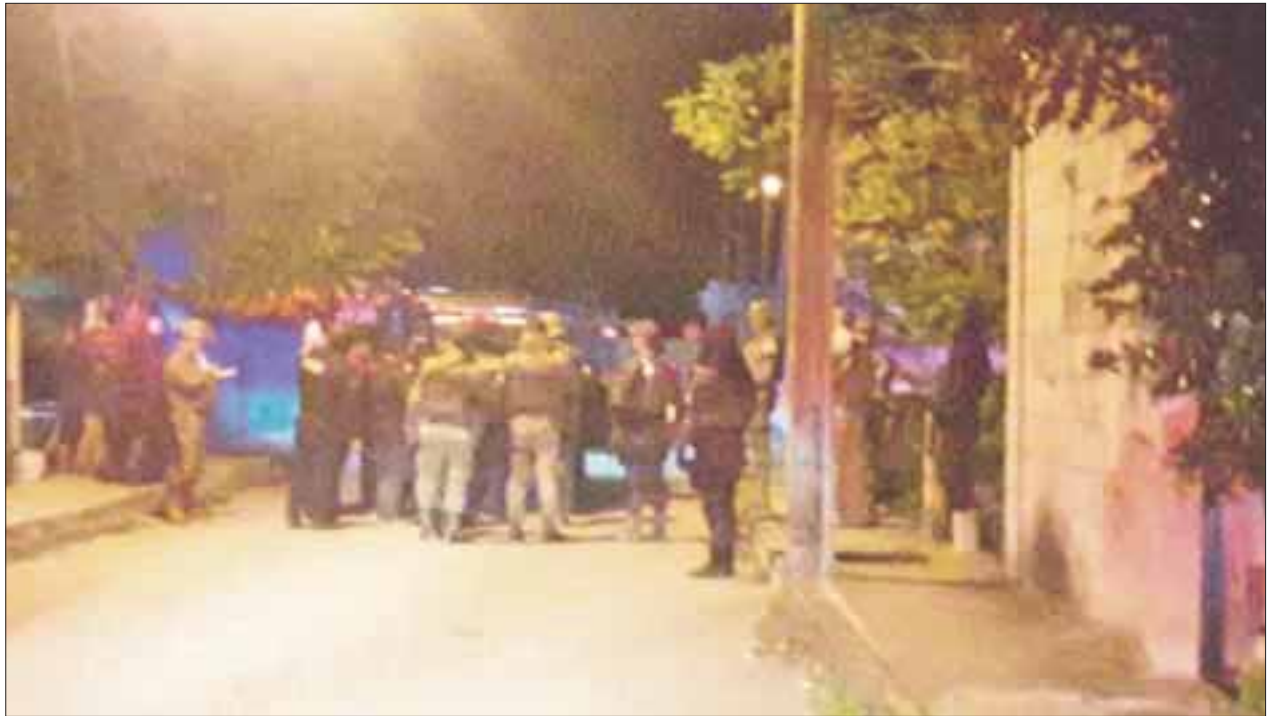
Trascendió que los tres secuestradores se dedican al narcomenudeo.

Los detenidos fueron puestos a disposición de la Fiscalía General del Estado, que se encuentra fuertemente custodiada para evitar pudieran rescatarlos.