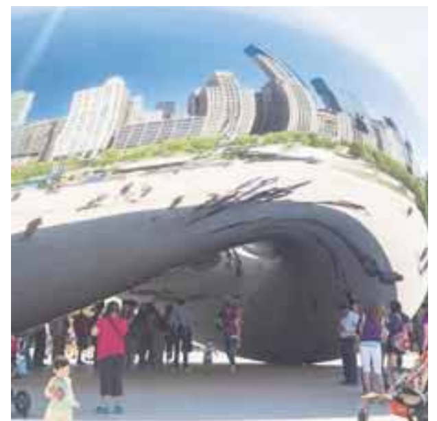
La ciudad rompe récord de visitantes.