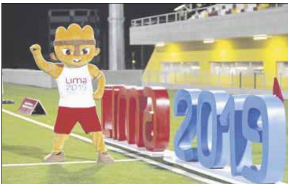
El COM dio a conocer la lista de los 543 seleccionados mexicanos que representarán al país en los Panamericanos de Lima.

El Comité Olímpico Mexicano (COM) dio a conocer la lista de los 543 seleccionados mexicanos que representarán a este país en la XVIII edición de los Juegos Panamericanos, Lima 2019.