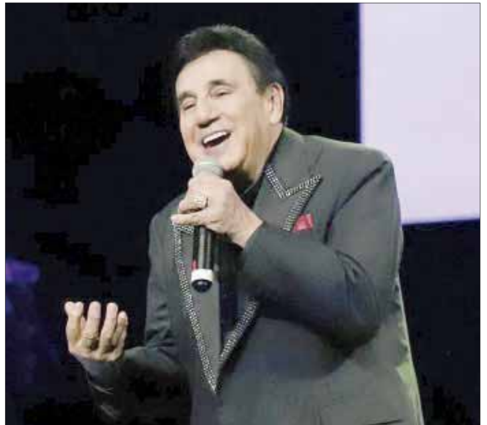
Hasta sus últimos años conservó la voz, hecho que adjudicaba a la disciplina. Realizaba conciertos con otros ganadores del Festival OTI y con sus hermanos, como en sus mejores años.

piezas lo llevaron a ser conocido en toda Hispanoamérica y a conquistar con sus letras el corazón de sus seguidores.