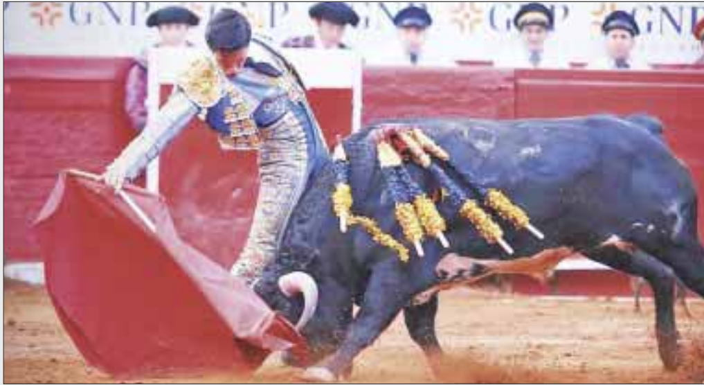
Diputados avalaron una serie de reformas que prohibirán las corridas de toros y las peleas de gallos en la entidad.

Chetumal.- El Congreso de Quintana Roo dio luz verde a una serie de reformas que prohibirán las corridas de toros y las peleas de gallos en la entidad, como parte de los ajustes legales en materia de protección y bienestar animal.