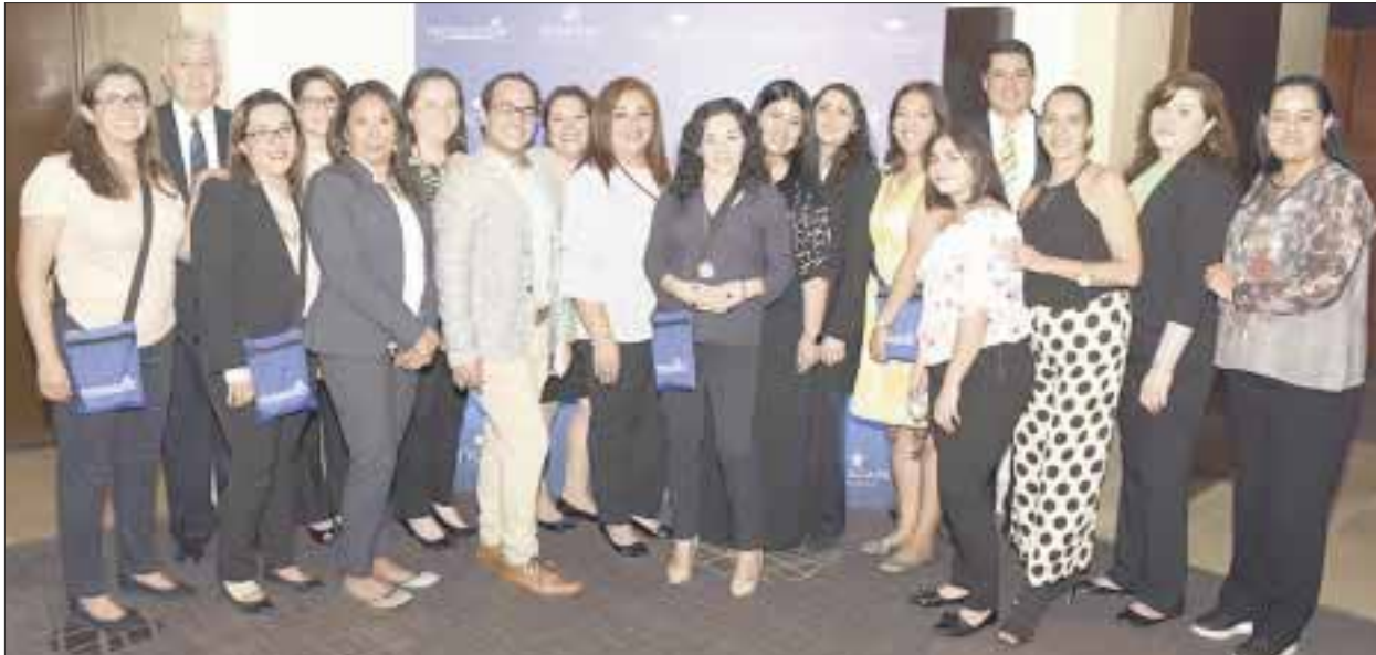
El equipo de AMResorts , en el Road Show en Ciudad de México.

- El primer Road Show de AMResorts , llevará las novedades de los hoteles a Guadalajara, Monterrey, León, Querétaro y Mérida