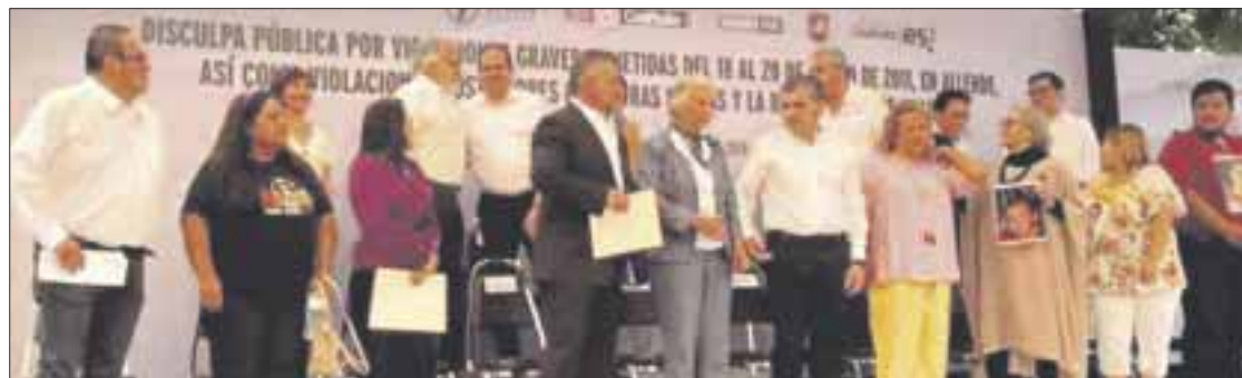
Se ofreció disculpa pública por los abusos y violaciones en el manejo de la masacre en Allende, Piedras Negras y la región norte de Coahuila, en marzo de 2011.