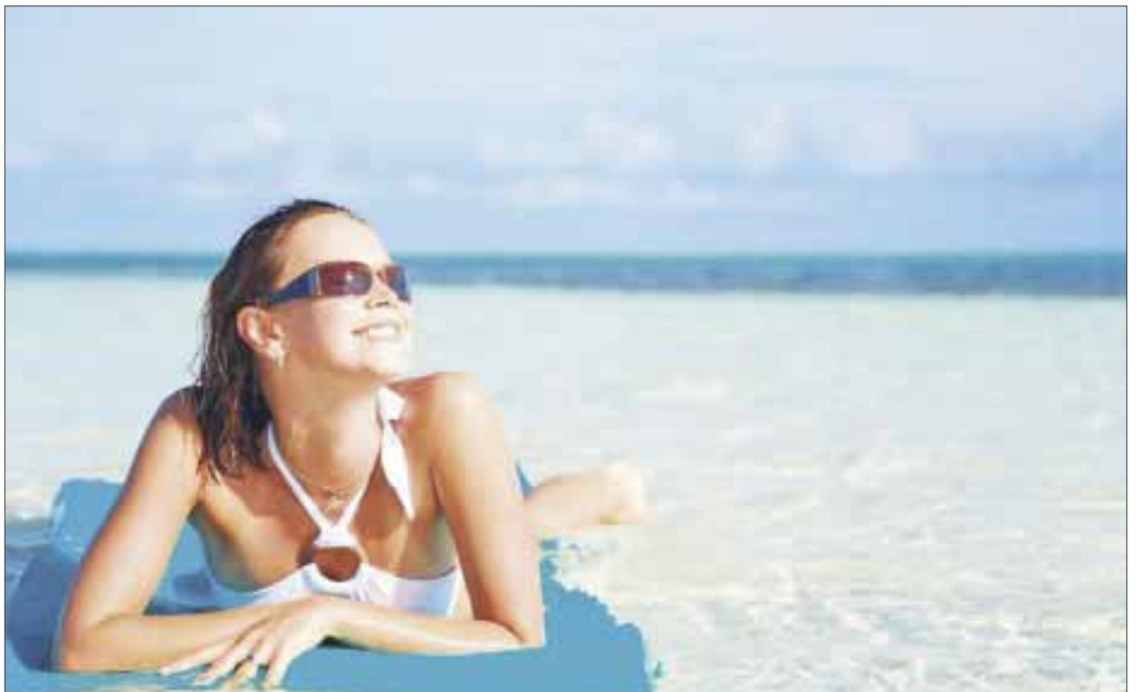
Los trabajadores turísticos son los más expuestos a los problemas visuales por las altas temperaturas.

Aseguró que, el problema se incrementa en Quintana Roo, ya que la mayoría de los trabajadores turísticos no cuentan con los elementos necesarios para su protección, y en algunos casos, la normatividad interna en algunos lugares por imagen de la empresa, les impide hacer uso de elementos de protección, lo que empeora la situación.