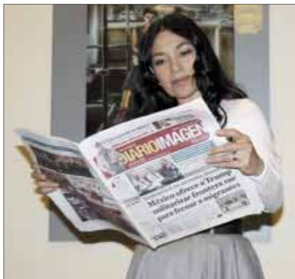
En entrevista exclusiva con DIARIOIMAGEN , la actriz Dolores Heredia.