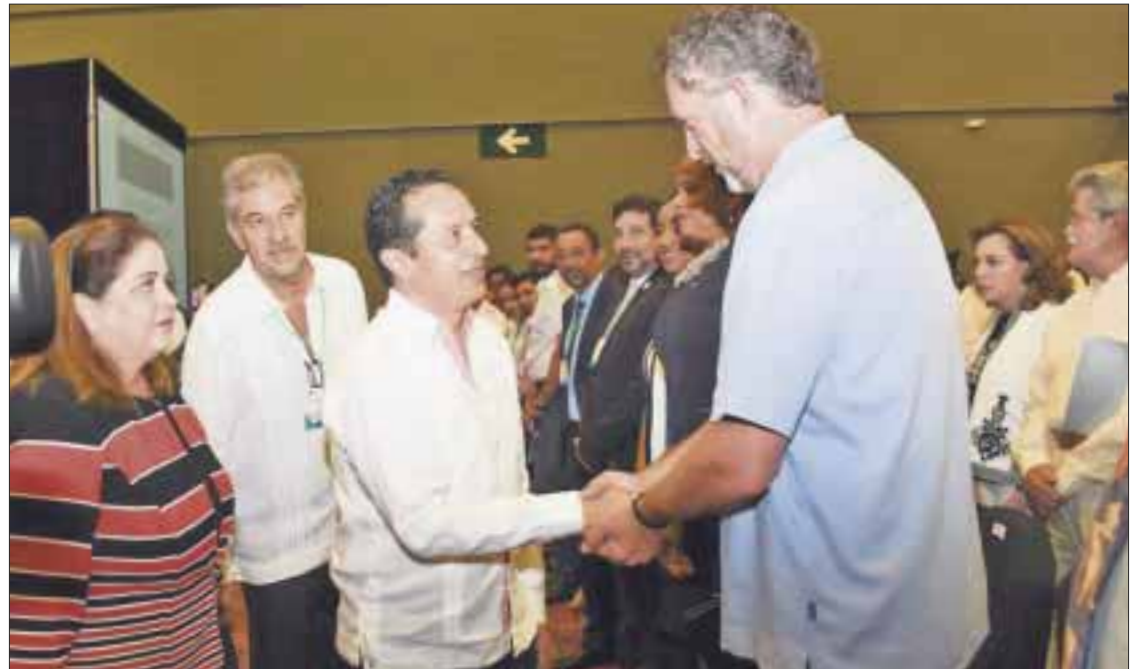
El gobernador de Quintana Roo inauguró el Encuentro de Alto Nivel para la Atención del Sargazo en el Gran Caribe.

Para atender lo inmediato, en 2018 fueron retiradas más de 522 mil 226 to-