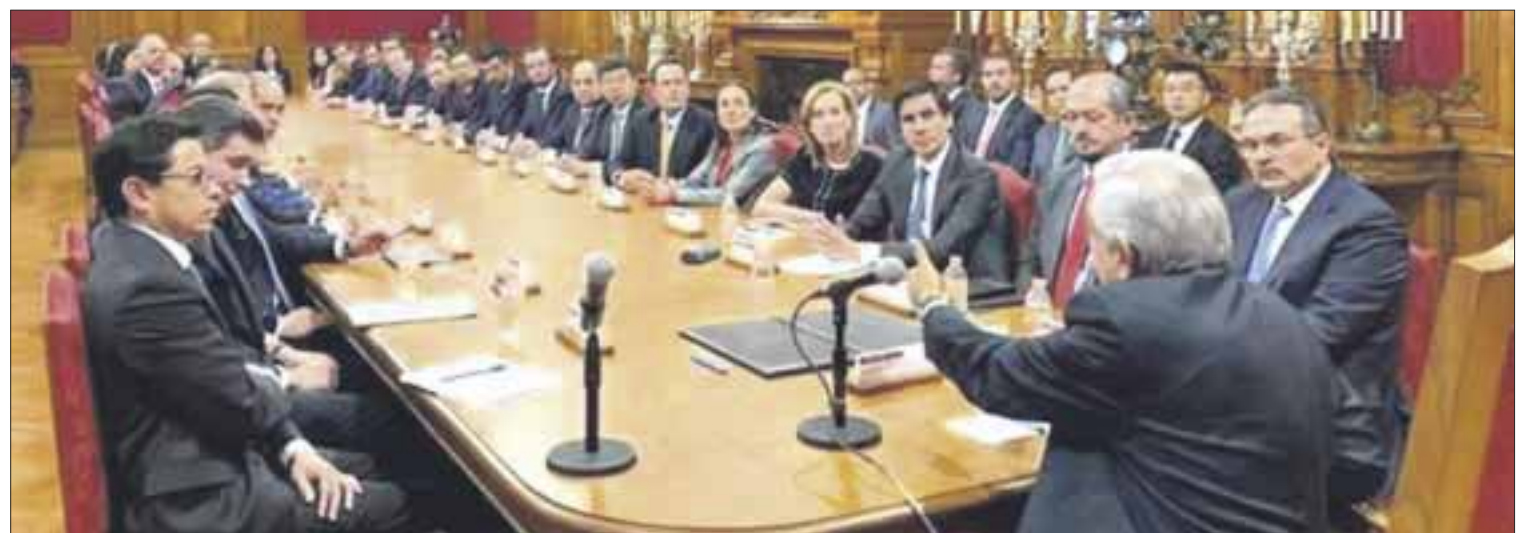
Andrés Manuel López Obrador firmó un acuerdo de refinanciamiento para renovar líneas de crédito revolventes para Pemex.

"Participaron 23 bancos nacionales y extranjeros, entre ellos 14 de los 20 más grandes del mundo. Es la operación de este tipo más importante en la historia de México"