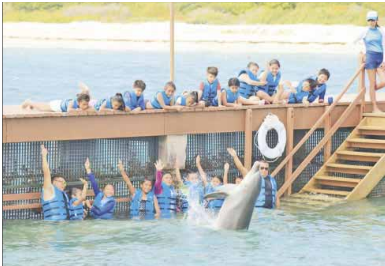
Alumnos y maestros acudieron al programa de Visitas Didácticas en siete hábitats para interacción con delfines.

Acciones, que son parte del programa de Responsabilidad Social Empresarial alineadas al Pacto Mundial y el cumplimiento del Objetivos de Desarrollo Sostenible impulsados por la ONU como parte de la agenda 2030.