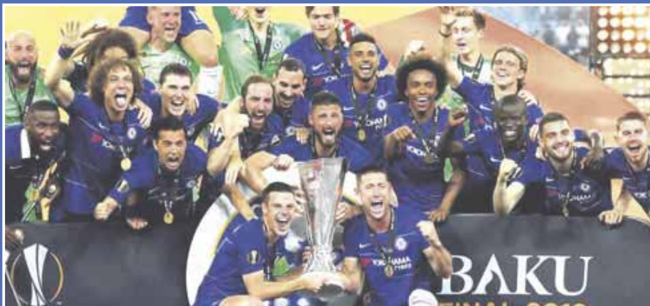
Los Blues vencieron 4-1 a los Gunners en un partido que dinamitó hasta la parte complementaria.

El Chelsea se proclamó ayer miércoles campeón de la Europa League por segunda vez en su historia, tras una clara victoria por 4-1 contra el Arsenal en el estadio Olímpico de Bakú.