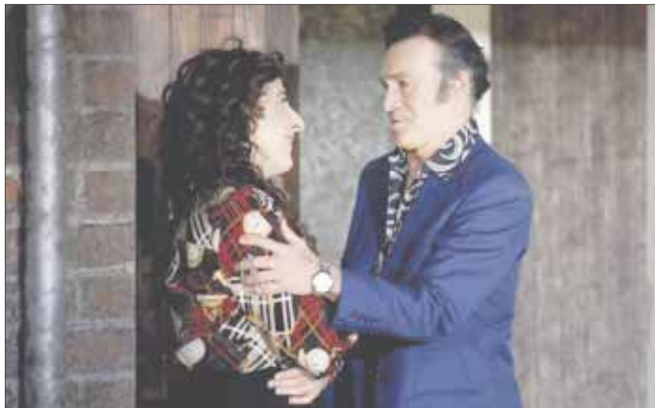
"Pequeña voz" permanecerá en temporada al menos hasta el 14 de julio, con funciones de viernes a domingo.