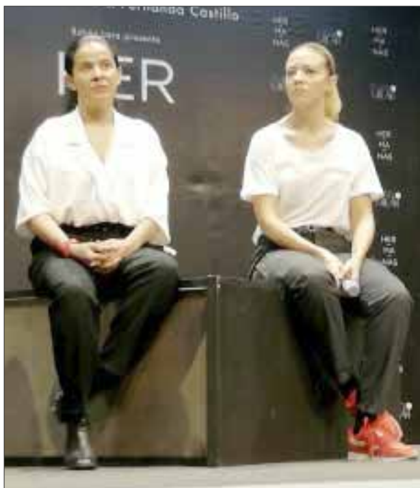
“Hermanas” narra los desencuentros y la relación fracturada de dos hermanas que se reúnen a raíz del deceso de su madre.

destino nos pongamos en contacto, se hablaría de lo que sea, son cosas que deben fluir y ojalá que se dé este puente, empezar a unir fuerzas España/México en una canción o en muchas”, concluyó.