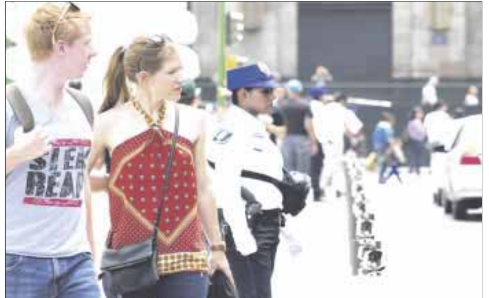
Autoridades británicas pidieron a sus ciudadanos tomar en cuenta las caravanas migrantes, el brote del zika y la inseguridad que se vive en el territorio mexicano.

A través de un comunicado en su sitio web, las autoridades británicas pidieron a sus ciudadanos tomar en cuentas las caravanas migrantes, el brote del zika y la inseguridad que se vive en el territorio mexicano