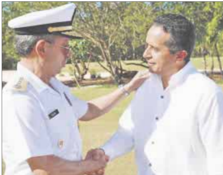
El gobernador Carlos Joaquín lideró la reunión del programa para la atención del sargazo en las costas de Quintana Roo.

En esta reunión --en la que participaron autoridades federales, estatales, municipales, empresarios, hoteleros y representantes de la sociedad--, se revisó el Programa Integrado de Atención al Arribo de Sargazo y se plantearon acciones inmediatas de mediano y largo plazos, los protocolos y lineamientos de manejo del sargazo, el financiamiento para limpieza playas, los accesos a las playas para sacar el alga y los sitios