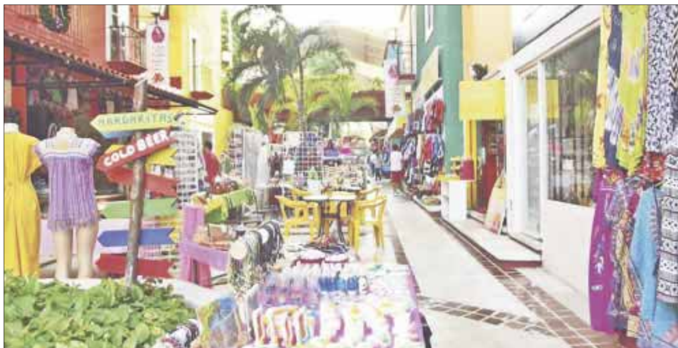
La temporada baja generó la caída de las ventas un 30 por ciento en comercios de Cancún.

Cancún.- La temporada baja en este destino turístico generó la caída de las ventas un 30 por ciento, ante la mínima presencia de visitantes y la merma en derrama económica que se refleja por la mínima presencia de clientes en puntos de venta y plazas comerciales.