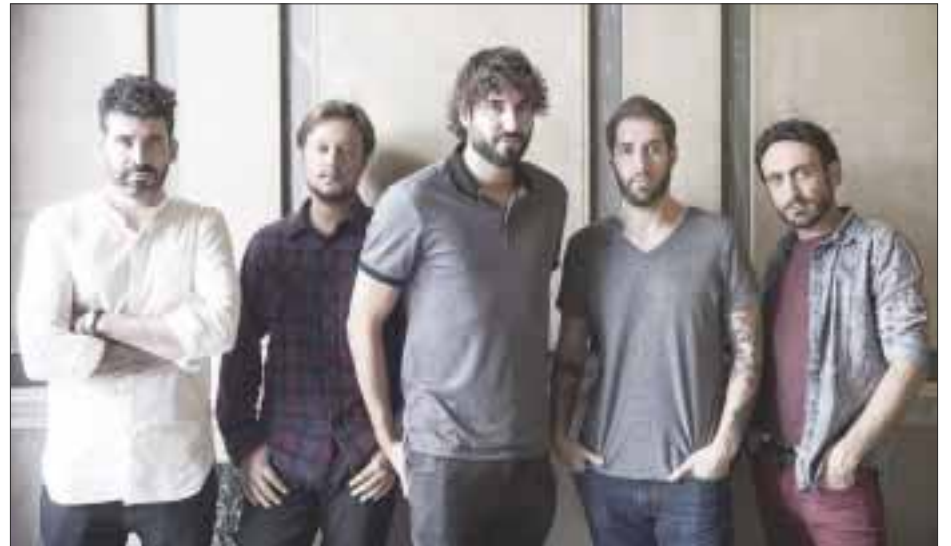
La presentación de Izal en Guadalajara es este 1 de junio, como parte del cartel del festival Cosquín Rock, para luego llegar al Auditorio BlackBerry de la CDMX el 5 de junio.

Adelantan que “el 1 de junio seremos parte del Cosquín Rock, en un formato limitado, ojalá tengamos suerte y el horario sea amable, que no haga tanto calor como en Querétaro. Para que la gente que no nos conoce se encuentre con nosotros de sorpresa y lleven nuestro nombre apuntado en la libreta. Posteriormente ya ofreceremos nuestro concierto solos en BlackBerry, va a ser parecido en set list al que hacemos en España, tenemos todo el tiempo