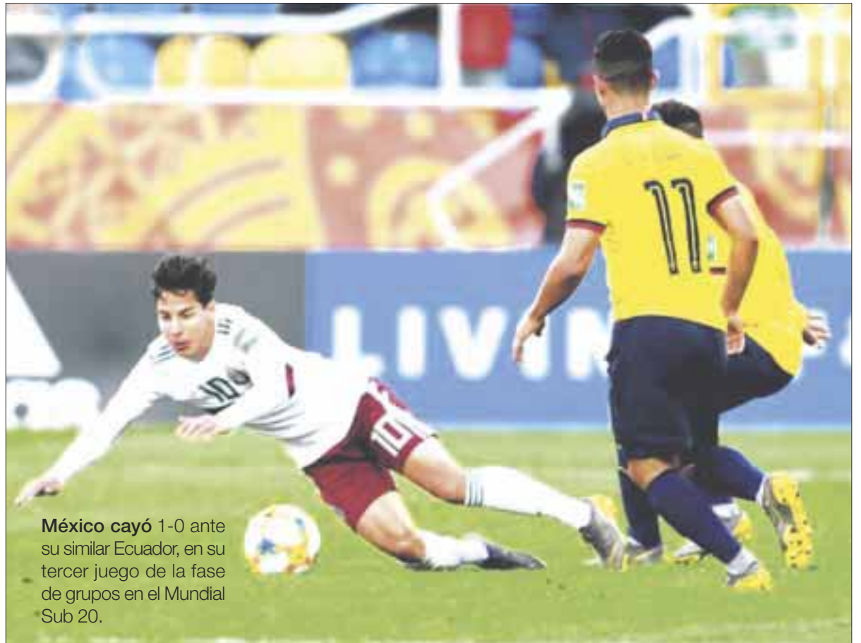
México cayó 1-0 ante su similar Ecuador, en su tercer juego de la fase de grupos en el Mundial Sub 20.

El fracaso del Tri juvenil en el mundial podría poner en riesgo la continuidad de Diego Ramírez al frente de la Sub-20, mientras que el desempeño mostrado por los jugadores no les ayudará en su intento de consolidarse en la Liga MX.