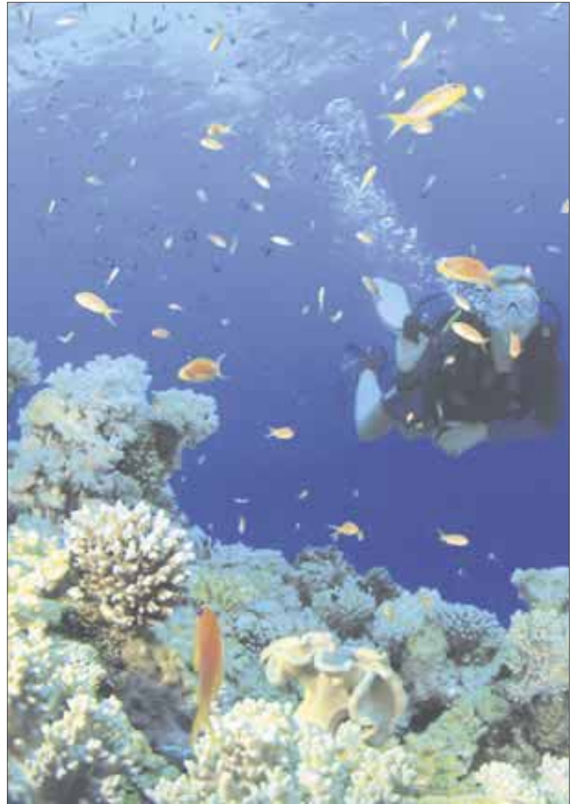
En el Parque Nacional de Arrecifes de Cozumel está el 85% de los arrecifes más visitados por el turismo, la principal actividad en la isla.

El coordinador regional de la Comisión Nacional de Áreas Naturales Protegidas (Conanp), Christopher González, dijo que hay que aclarar que no se está cerrando el área natural protegida. La medida no es en todo el Parque, sino sólo en tres puntos. Los otros 11 quedan abiertos y se pueden realizar las actividades propias que permite el Programa de Manejo. Esto significa que la suspensión aplica en un 30% de toda el área natural.