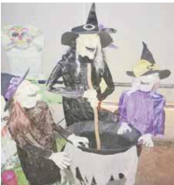
Será la experiencia más terrorífica.

victoriagprado@gmail.com Twitter: @victoriagprado