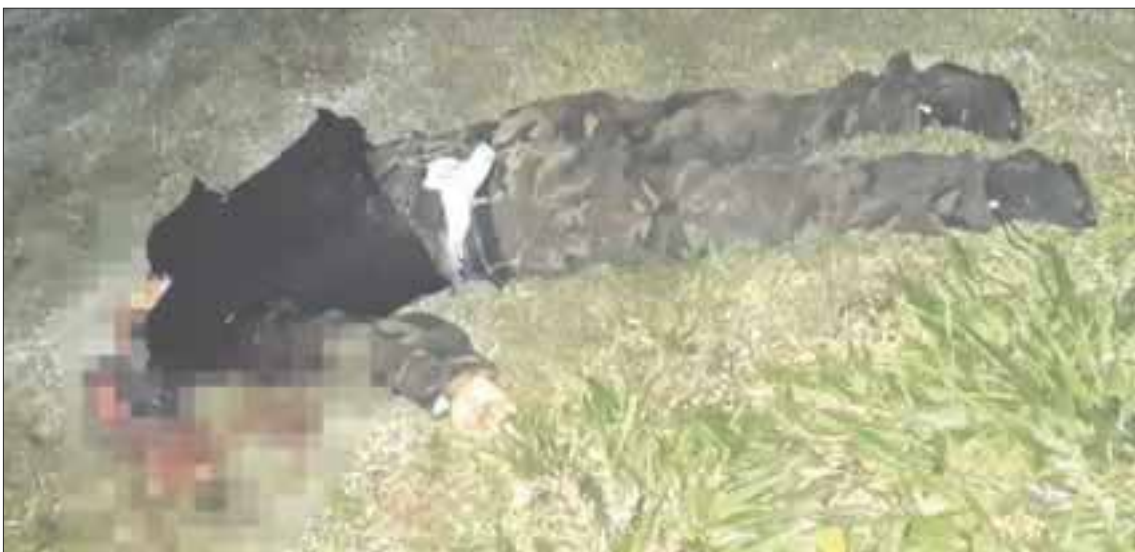
Durante el fuego cruzado, uno de los agresores perdió la vida, mientras portaba un rifle AR-15 y un chaleco antibalas.

Bacalar.- Un grupo de personas armadas atacó a una familia, en un rancho fuera de la cabecera municipal, el sábado pasado.