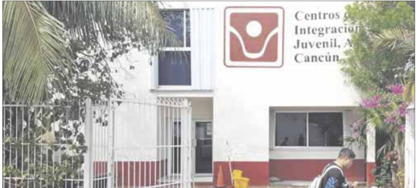
Empantanada la construcción de una clínica de internamiento del Centro de Integración Juvenil.

Aun cuando no se tiene el inicio de una construcción, confió que en breve se pueda hablar más al respecto, con la suma de voluntades, al ser necesario para atender y frenar las adicciones en adolescentes y adultos.