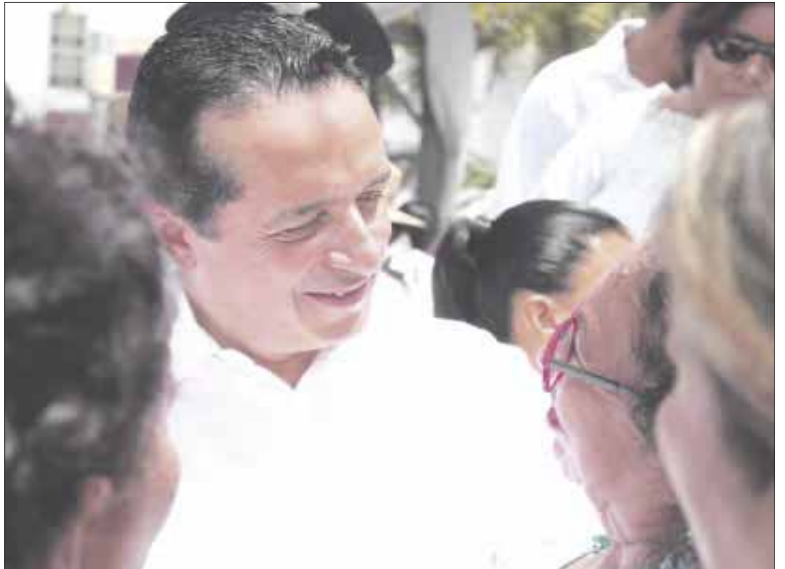
Esperan obtener una estrategia de implementación de proyectos transformadores, alrededor de las áreas de influencia de las estaciones del Tren Maya en la entidad.

El convenio de colaboración entre ONU-Hábitat y el gobierno de Quintana Roo, a través de la Agencia de Proyectos Estratégicos del Estado de Quintana Roo, tiene como objetivo generar una estrategia de implementación de proyectos transformadores, particularmente alrededor de las áreas de influencia de las estaciones del Tren Maya en la entidad, el Puente Vehicular Nichupté y del Parque de la Equidad. Este último funcionará como un vector estructurante del sistema de espacios públicos del municipio de Benito Juárez.