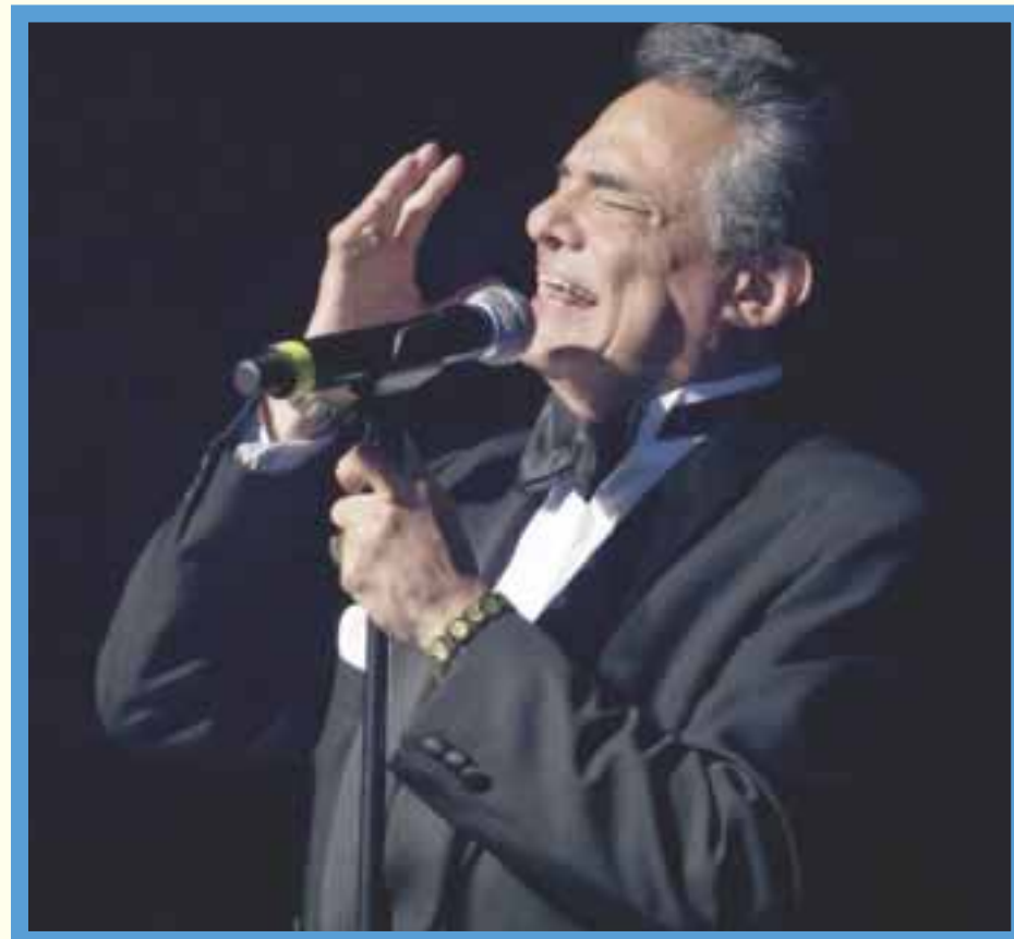
Los detalles del velorio y homenajes previstos en Miami se mantuvieron todos en reserva, pero la familia acordó que después de esta despedida los restos serán trasladados a México.

De acuerdo con algunos de los asistentes, en la sala se escu-