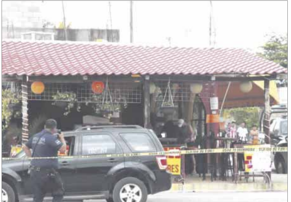
Se presume que la persona muerta sería el dueño del negocio de comida y que el posible móvil del atentado, sería por negarse a pagar derecho de piso.

El reporte narra que el ataque ocurrió cerca de las 12:30 pm en la esquina de la Avenida Cancún con avenida Xel Ha, cuando sujetos a bordo de una camioneta entregaron un arma a los asesinos que a su vez viajaban en motocicleta