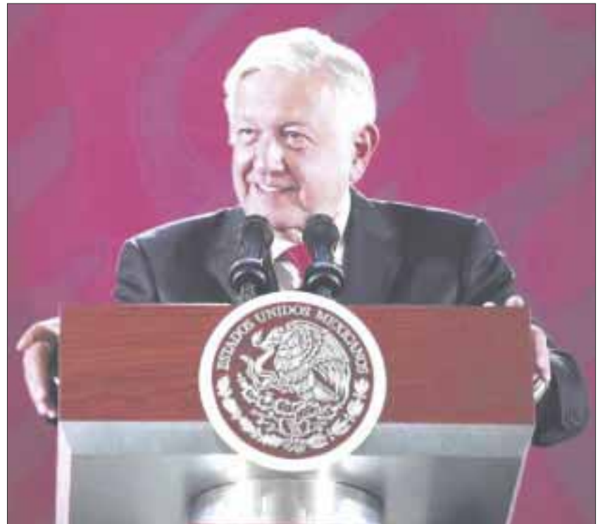
Andrés Manuel López Obrador convocó a los trabajadores a que ya no sigan tolerando a dirigentes que no los representan.

Este lunes se publicó que los líderes sindicales que se han perpetuado en sus puestos se resisten a aceptar los cambios y podrían aprovechar la ambigüedad de la nueva Ley Laboral respecto a la renovación de dirigencias.