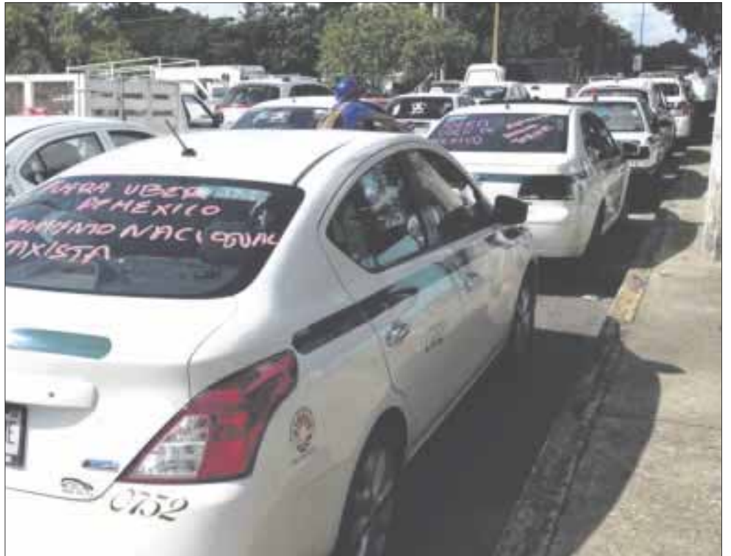
Taxistas del “Andrés Quintana Roo” se unieron a la protesta nacional contra las plataformas digitales de transporte.

Uber está imposibilitado para prestar los servicios en Quintana Roo, debido a candados incluidos dentro de la Ley de Movilidad, como la concesión que no se les ha sido autorizada. Dado que el Imoveqroo aún no concluye la elaboración del Reglamento Interior.