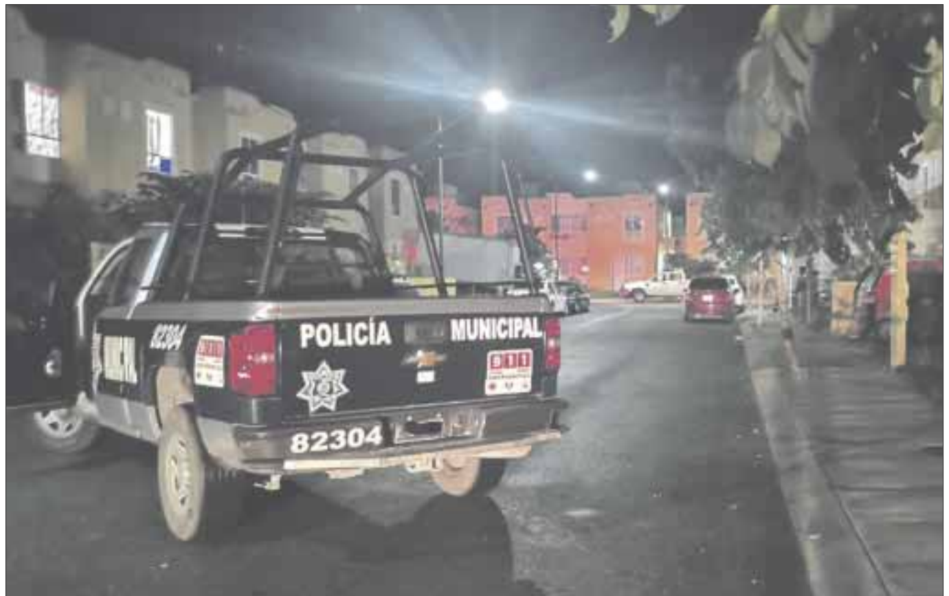
Un hombre fue ejecutado en su domicilio ubicado en el fraccionamiento Villas del Sol, en Solidaridad.

Este caso se reporta como el ejecutado número 160 en Solidaridad, al menos en lo que va del año.