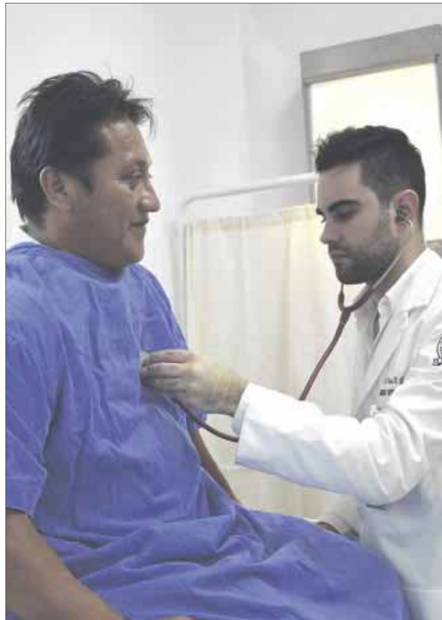
La carencia de personal médico en el estado es a nivel de Sri Lanka o Nigeria.

Quintana Roo, Campeche, Chiapas, Guerrero, Oaxaca, Tabasco, Veracruz y Yucatán requieren de 64 mil 796 doctores (43 mil 198 generales y 21 mil 598 especialistas) para atender las necesidades de 19 millones 635 mil 261 habitantes de una manera óptima, pues de no ser así difícilmente pueden darle seguimiento a cada uno de los pacientes atendidos.