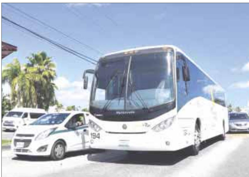
El autotransporte federal tendrá que sujetarse a los lineamientos que marque la Semarnat para aprobar la verificación.

Cancún.- A partir del 31 de marzo de 2020 todos los vehículos de autotransporte federal en Quintana Roo deberán enfrentarse a un proceso de verificación actualizado tecnológicamente, y homologado con la región centro del país. Esto con el interés de reducir la contaminación y mejorar la calidad del aire en el territorio mexicano.