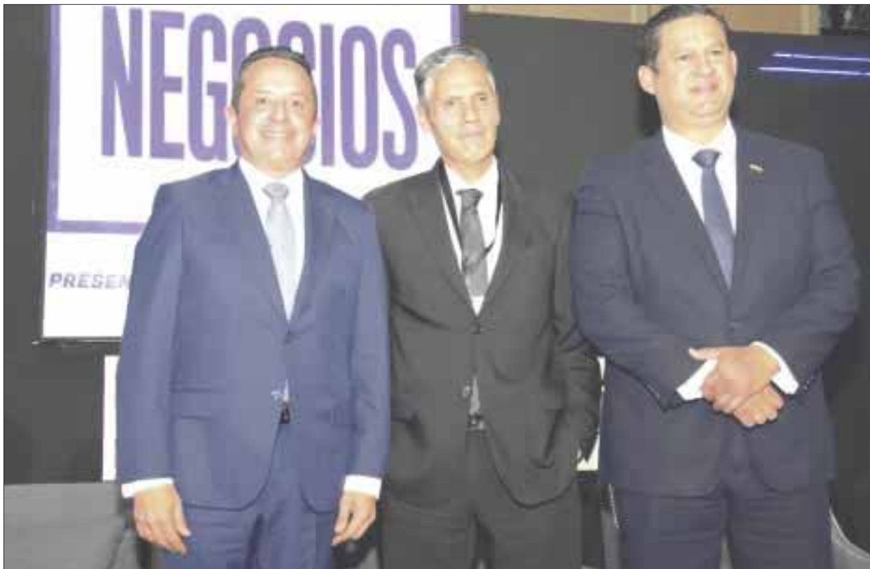
El gobernador Carlos Joaquín señaló que en el primer trimestre del presente año, el estado captó 309 millones de dólares en inversiones extranjeras.

Finalmente, destacó que en Quintana Roo se ha trabajado para dar certidumbre jurídica a los inversionistas, así como combatiendo la corrupción y la impunidad, y fortaleciendo la transparencia para recuperar la confianza de inversionistas, de empresarios y de la sociedad en su conjunto