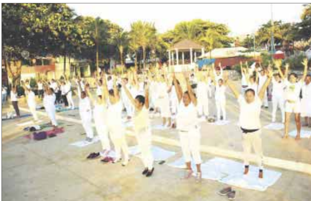
Se llevarán a cabo actividades lúdicas y de sensibilización en los 11 municipios del Estado.

Chetumal.- En el marco del Día Internacional de la Paz, que se conmemora el 21 de septiembre, el DIF Quintana Roo promueve con acciones de difusión, sensibilización y concientización la cultura de paz en niñas, niños, adolescentes, adultos y personas mayores.