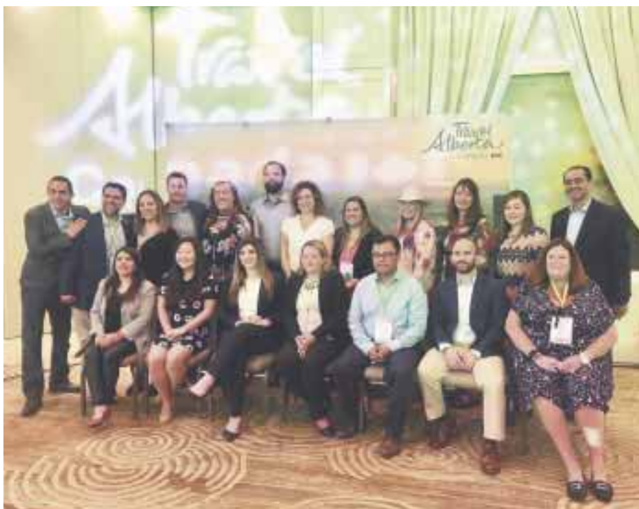
La Misión de Alberta en la reunión de clausura.

Aseguró: “otro de sus valores agregados es que tiene autopistas seguras y está a corta distancia de parques nacionales de las ciudades de Calgary y Edmonton, lo que se traduce en seguro y fácil viajar dentro de Alberta y, estamos trabajando con los prin-