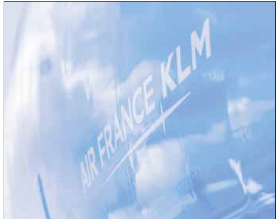
El grupo nuevo líder del índice Dow Jones Sustainability.

“los mexicanos que nos visiten este invierno, harán de Alberta uno de sus destinos favoritos cuando vivan el esplendor de las montañas Rocosas, esquíen en alguno de nuestros resorts, realicen caminatas entre cascadas de hielo, degusten un buen bisonte acompañado de una copa de vino en alguno de los restaurantes de autor”.