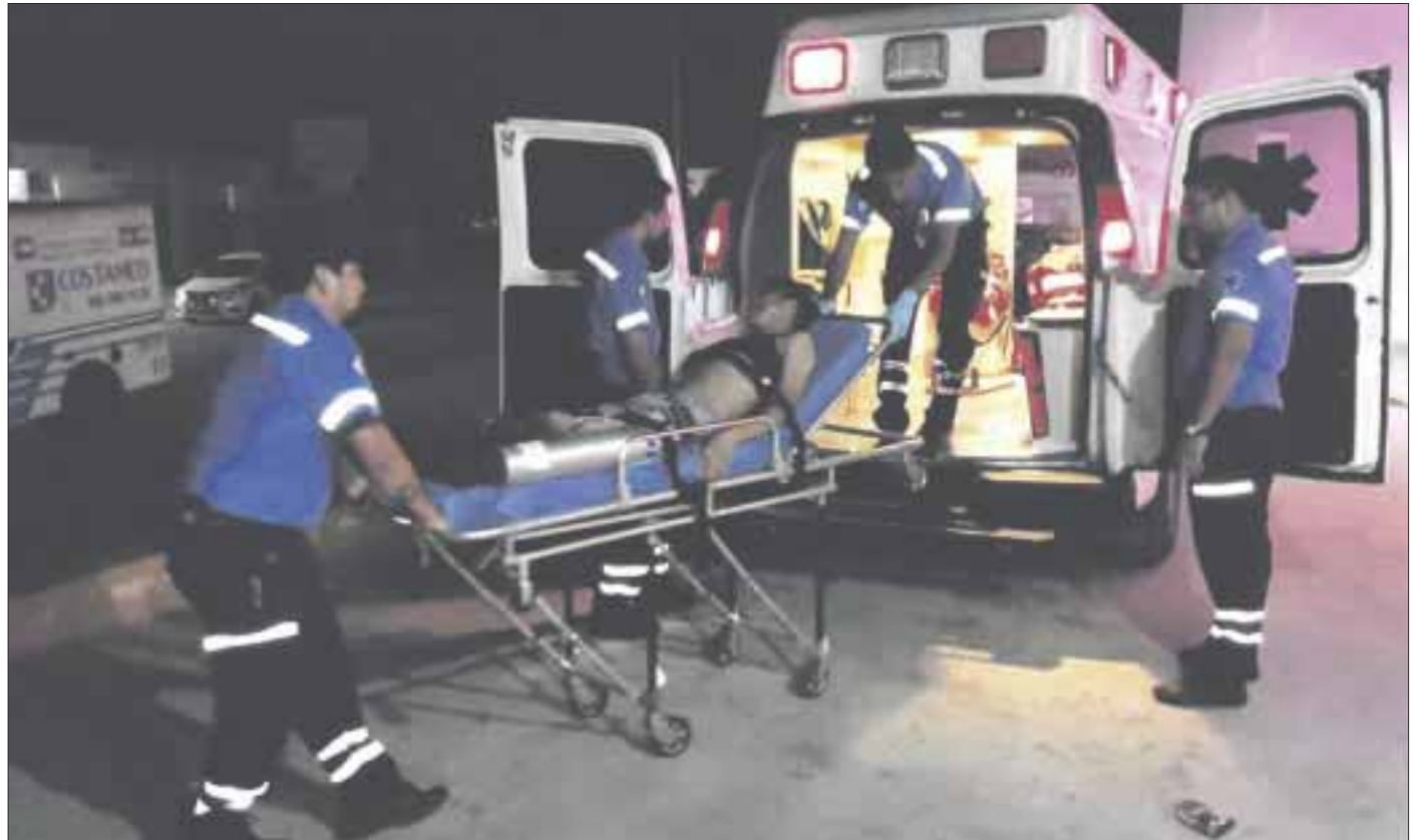
Una mujer y dos hombres fueron trasladados al hospital para ser atendidos, dos de ellos fueron heridos de gravedad.

Al lugar arribaron elementos de la policía de Solidaridad y la parte investigadora, que ya indaga a partir de las declaraciones del propietario de “Carnitas Mayita”, quien aseguró reconocer al agresor.