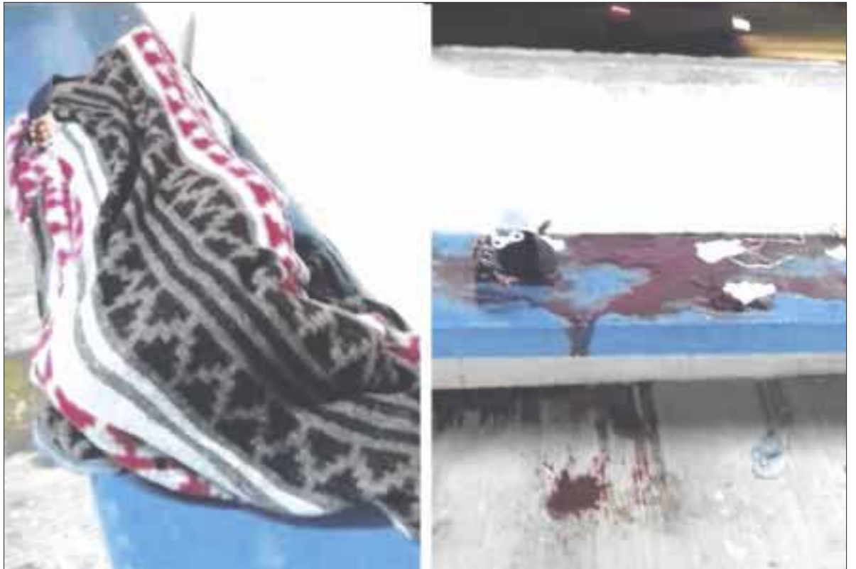
La Cruz Roja arribó con una ambulancia para trasladar a la mujer a Chetumal después de que ya había dado a luz.

Los afectados solicitaron al Gobierno del Estado que entre en operaciones el Hospital de Especialidades que tiene Nicolás Bravo, que se construyó durante la administración de Roberto Borge Angulo y que hasta la fecha no ha entrado en funciones.