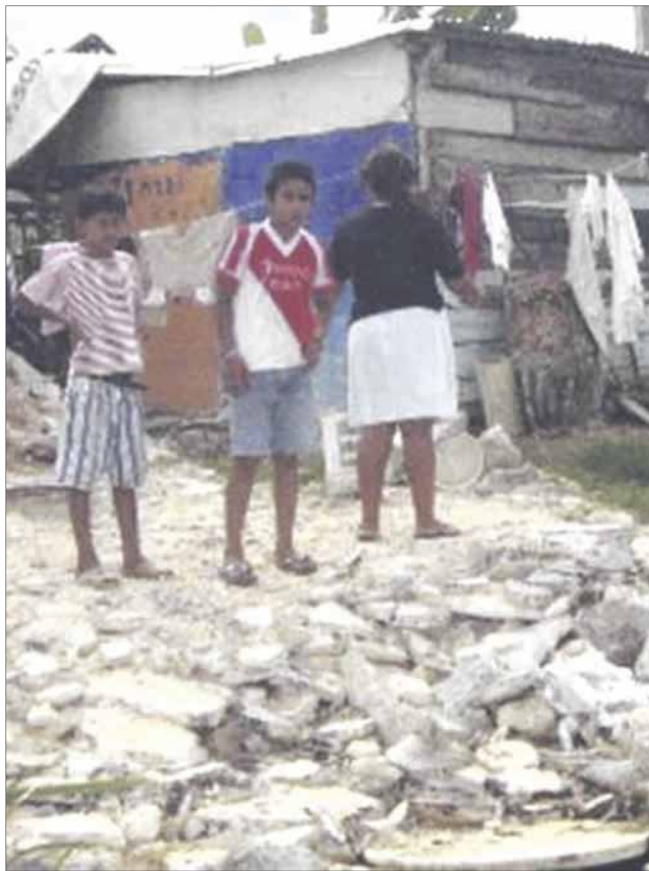
El problemas de los cinturones de marginación en destinos turísticos deberán erradicarse.

Agregó, que un síntoma positivo de que se mantendrán, e que del 24 al 27 de septiembre se llevará a cabo el Tianguis de Pueblos Mágicos en Pachuca, Hidalgo para definir los lineamientos para su preservación por la importancia que tienen en la industria turística.