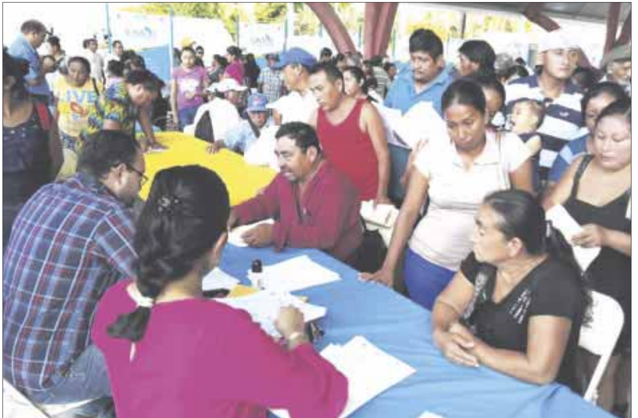
Durante esta caravana se entregaron certificados de estudios de nivel intermedio y avanzado, afiliaciones al Seguro Popular, cartas de antecedentes no penales, actas de nacimiento, muletas y otros apoyos.

Durante esta “Caravana” entre otros servicios se entregaron: certificados de estudio de nivel intermedio y nivel avanzado, afiliaciones al Seguro Popular, cartas de antecedentes no penales, actas de nacimiento, muletas, andaderas y semillas de hortalizas entre otros apoyos. Así como cubetas de pintura y equipo para mejorar la “Esc. Constituyentes del 74”; la Primaria Indígena “Vicente Guerrero de la localidad Nueva Loria; la Esc. Primaria Bilingüe “Kukulcán y la Esc. Telesecundaria “Narciso Ucahum” de la localidad de Plan de la Noria Poniente.