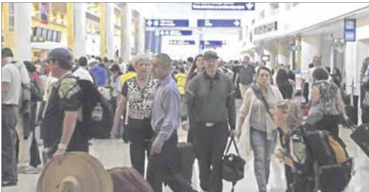
El Aeropuerto Internacional de Cancún espera cerrar el año, en un 1.5 y 2 por ciento, de tráfico de pasajeros, que, si bien no es mucho, les permite alcanzar sus metas con un índice de operaciones alto en invierno.

Cancún. — En el Aeropuerto Internacional de Cancún se espera cerrar el año, en un 1.5 y 2 por ciento, de tráfico de pasajeros, que, si bien no es mucho, les permite alcanzar sus metas al tener un índice de operaciones importantes para la próxima temporada de invierno.