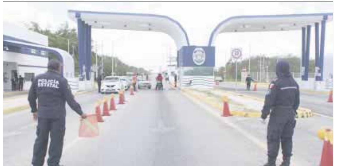
A través de los filtros sanitarios colocados al sur del estado se logró identificar a al menos a 12 personas con síntomas similares a los del Covid-19.

Personal de la Clínica de Detección y Diagnóstico Avanzado (CLIDDA), que pertene-