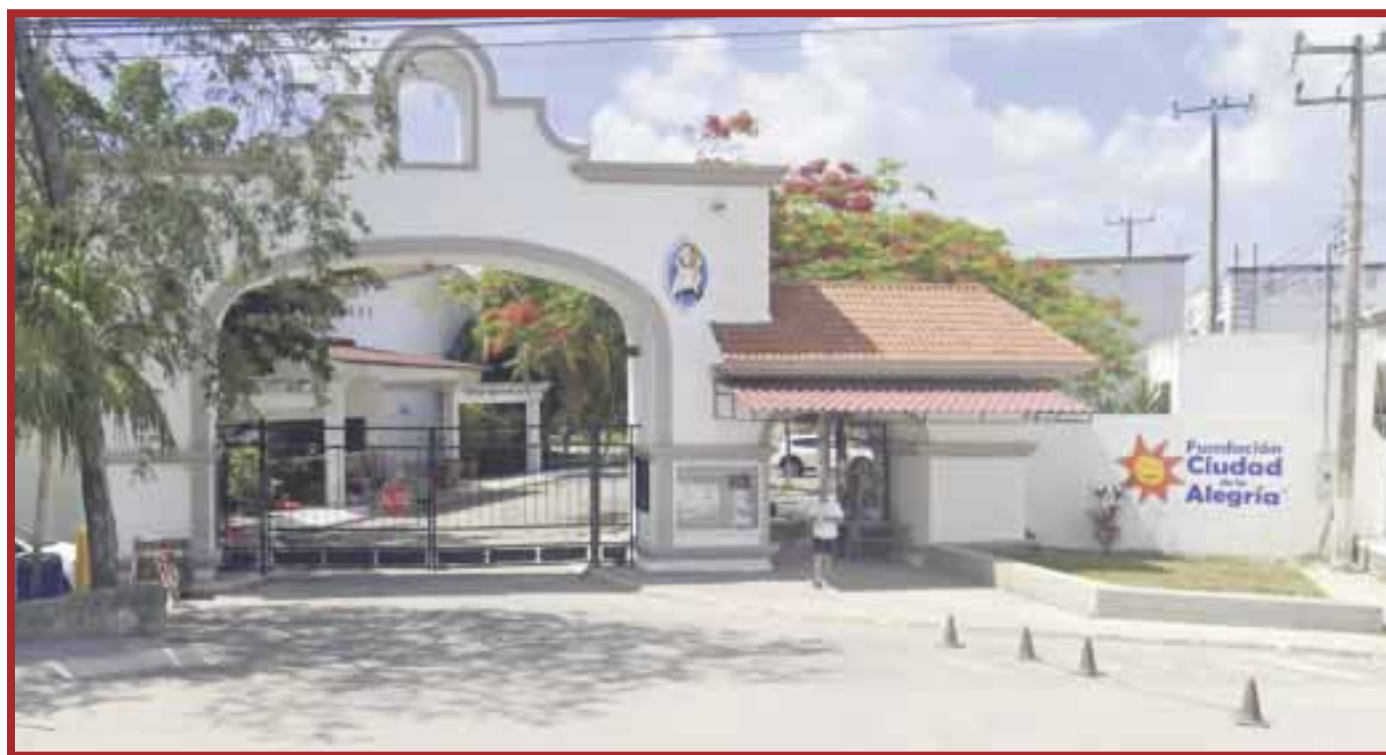
La Fundación Ciudad de la Alegría solicita donaciones a favor de 50 ancianos, mujeres y pacientes con VIH.

Cancún. — La Fundación Ciudad de la Alegría pidió a empresas o particulares otorgar donaciones a favor de 50 ancianos, mujeres y pacientes con VIH ante la pandemia de coronavirus (Covid 19), ante la disminución de alimentos y productos de primera necesidad.