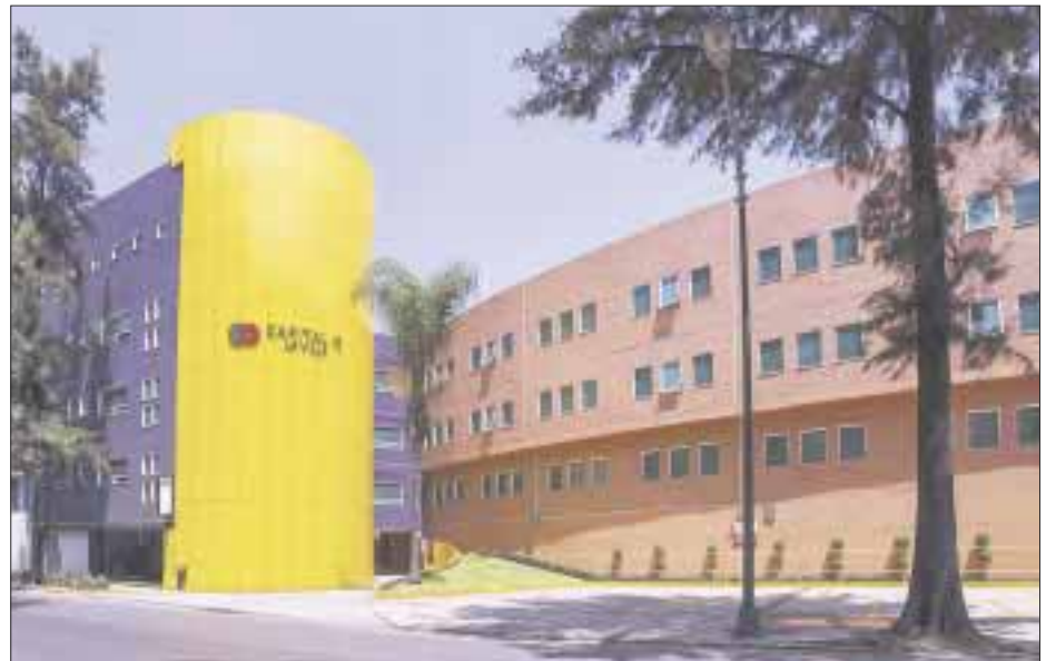
Mil noches de alojamiento gratuito a profesionales de la salud.