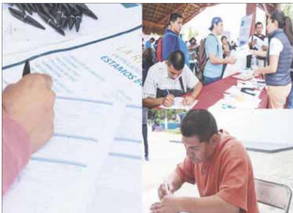
Para reactivar la economía lo más pronto posible, los gobiernos estatal y federal han destinado un fondo de 30.9 millones de pesos.

Chetumal.- A fin de reactivar la economía lo más pronto posible, después de la contingencia por el Covid-19, los gobiernos estatal y federal han destinado un fondo de 30.9 millones de pesos para la colocación de personas en un empleo formal en Quintana Roo.