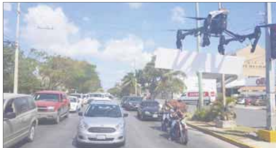
Se activó el escuadrón "Azor de Drones" de la Policía Quintana Roo para exhortar a la gente a quedarse en casa.

Con la participación de elementos de la policía municipal de Benito Juárez se instalaron filtros urbanos