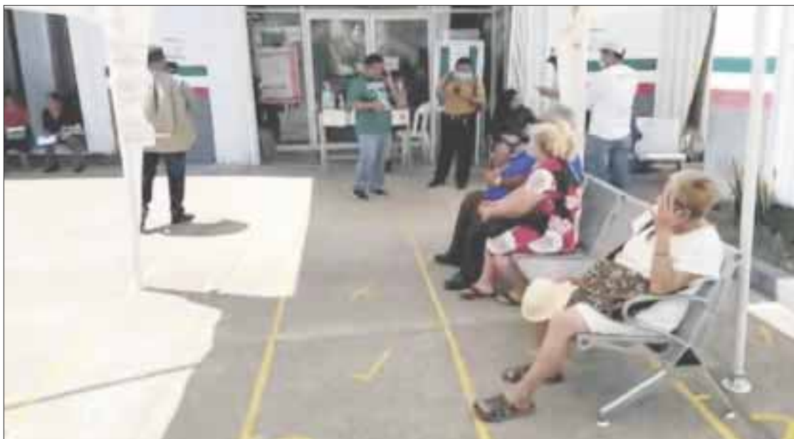
Personal de la Clínica de Detección y Diagnóstico Avanzado (CLIDDA), del ISSSTE, suspendió ayer sus labores, ante la presunta falta de equipo protector para personal.