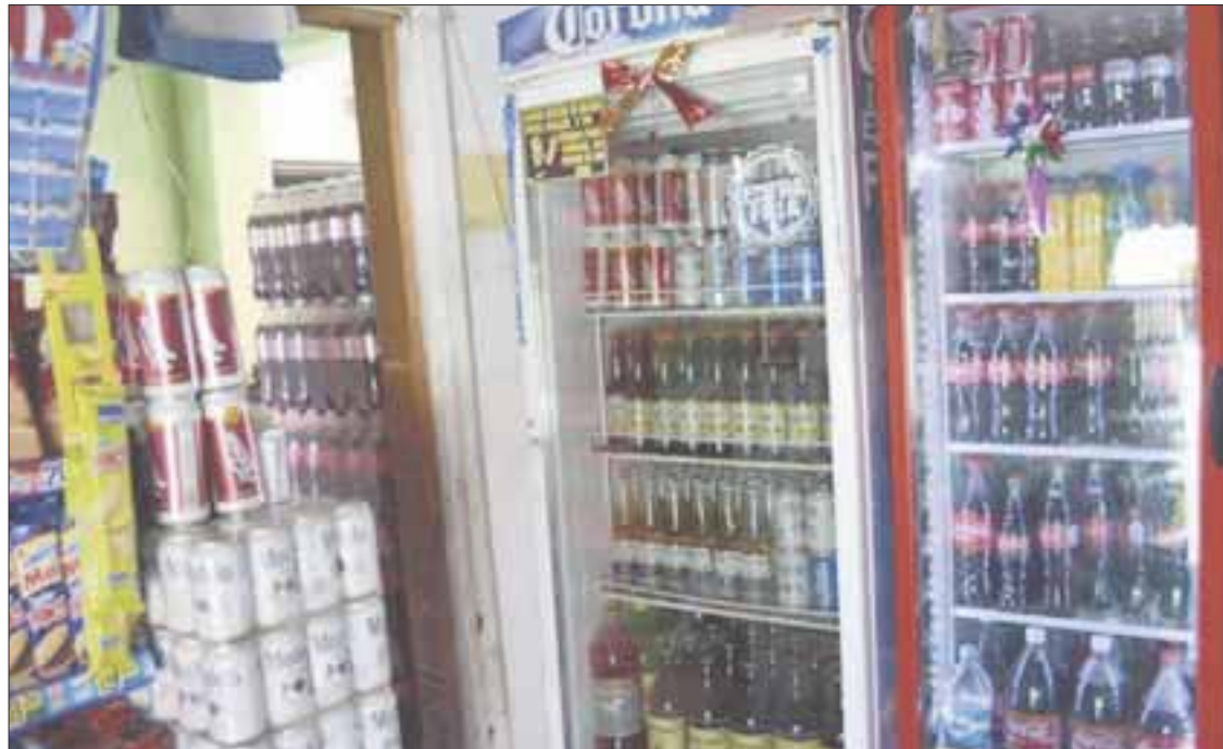
Un total de 21 negocios fueron clausurados por no respetar las restricciones en horario de venta de bebidas embriagantes.

En relación a los clandestinos, precisó que será la Secretaría de Seguridad Pública, quien se encargue de las investigaciones, y al ser un delito, serán procesados de manera penal, por tratarse de ventas clandestinas de bebidas embriagantes.