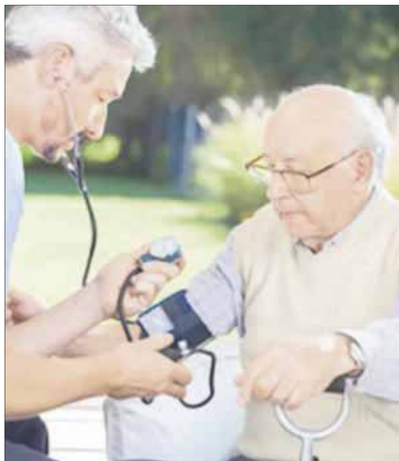
Aproximadamente 445 mil quintanarroenses integran los grupos de mayor riesgo de contraer el Covid-19.

La instrucción, se deberá acatar, de lunes a domingo todos los municipios de la entidad, advirtió Alberto Capella Ibarra, Secretario de Seguridad Pública de Quintana Roo