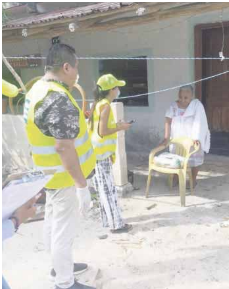
El gobernador Carlos Joaquín presentó avances y resultados del Plan Juntos Saldremos Adelante ante la contingencia sanitaria por Covid-19.

Los empresarios hoteleros coincidieron que en Quintana Roo somos una entidad en unidad, que el sector empresarial siente el apoyo del Gobierno del Estado