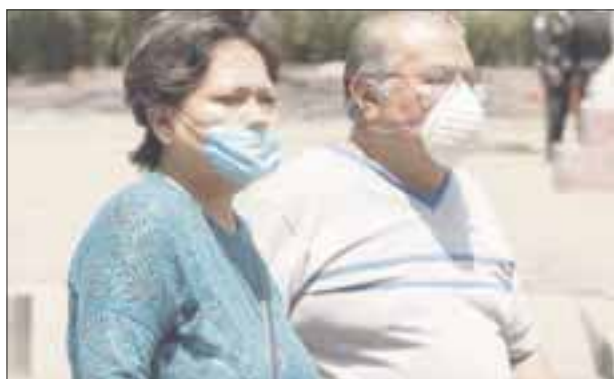
Se han registrado más decesos a causa del coronavirus en Quintana Roo.

Hasta ayer se tenían 269 contagios confirmados