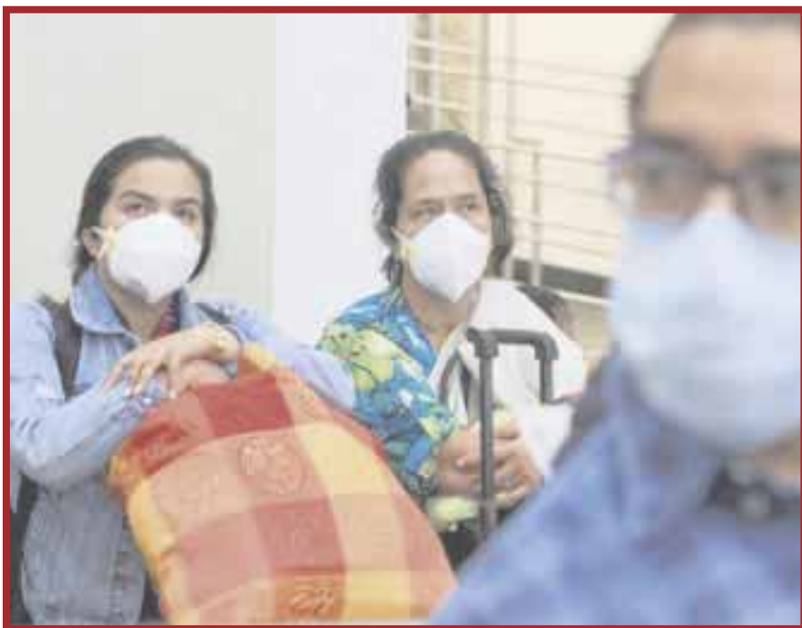
Hasta ayer, y de acuerdo con el reporte diario de la Secretaría de Salud estatal, se contabilizaron seis muertos más por Covid-19.

Chetumal.- Hasta el día de ayer y de acuerdo con el reporte diario de la Secretaría de Salud estatal, se contabilizaron seis muertos más por Covid-19, así como casi 50 nuevos contagios, siguiendo con el patrón de aumento que se esperaba entrando la Fase 3 de la contingencia.