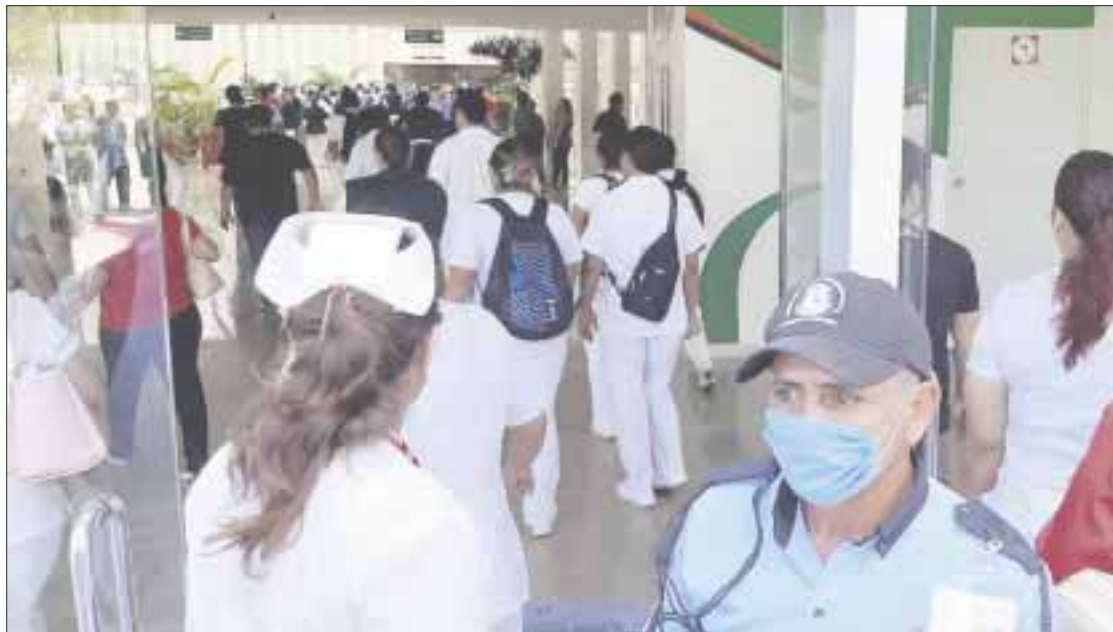
Se ha dado a conocer que el IMSS de Cancún concentra a seis de cada 10 contagiados de Covid-19 en Quintana Roo.

Pese a que se ha dado a conocer que Quintana Roo es una de las entidades que mejor atienden a la recomendación de “Quédate en tu casa”, aún la ciudadanía de Chetumal se resiste a mantener las medidas preventivas de contagio y propagación del Covid-19, tales como el uso de cubrebocas, gel antibacterial, caretas, entre otras herramientas, que los mantendrán a salvo del virus.