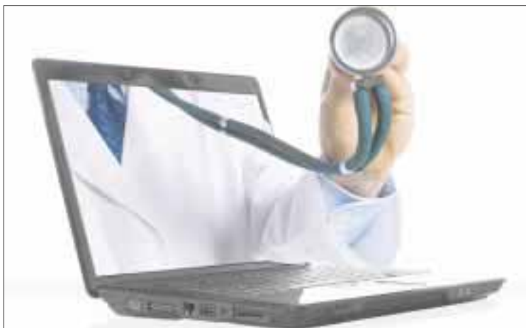
Para contar con un registro de posibles contagios de coronavirus en la entidad, el gobierno de Quintana Roo mantiene un cuestionario de autoevaluación en línea.