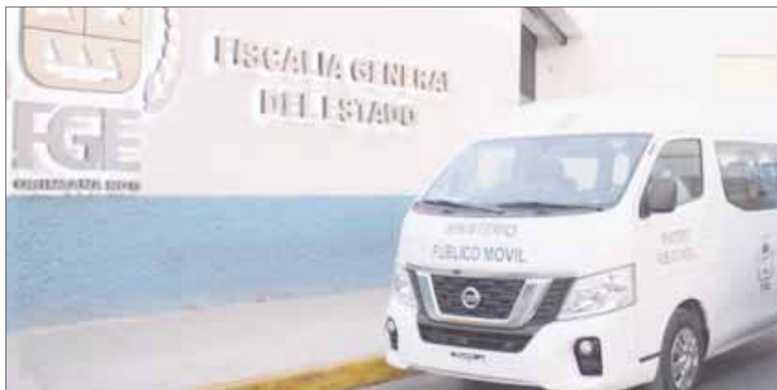
La FGE ha implementado un sitio digital para realizar denuncias por internet, a fin de que la gente no salga de sus casas.

La plataforma digital otorgará a las personas denunciantes un comprobante con un número de folio, mismo que debe presentar ante el Agente del Ministerio Público cuan-