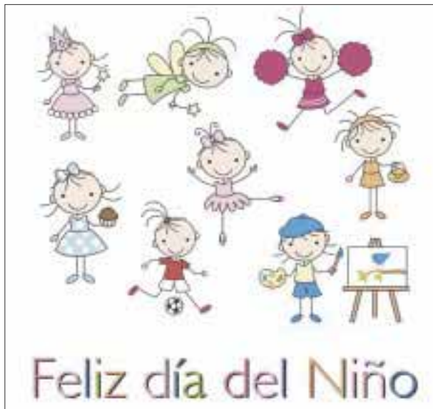
Feliz día del niño.

victoriagprado@gmail.com Twitter: @victoriagprado