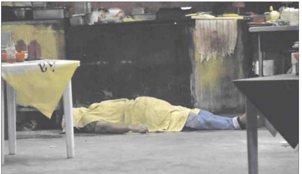
Sicarios dispararon contra dos personas del sexo masculino dentro de la taquería Tres Poblanos, que perdieron la vida a consecuencia de los impactos de bala.

Elementos de la policía ministerial y peritos acudieron al lugar para efectuar el levantamiento de los cuerpos y realizar los trámites de rigor para la entrega de los cuerpos a los familiares.