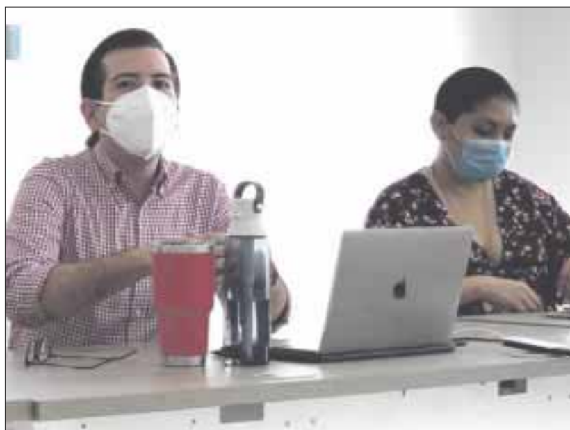
Se sostuvieron reuniones informativas para dar a conocer las bases de la convocatoria y unir esfuerzos con académicos, empresarios y emprendedores.

Chetumal.— El Instituto Quintanarroense de la Juventud (IQJ), continúa promoviendo la convocatoria del Fondo de Innovación Social “Emprende, yo te apuesto”, para lo cual, se sostuvieron reuniones informativas tanto en la zona norte como en la zona sur de la entidad, para dar a conocer las bases de la convocatoria y unir esfuerzos con académicos, empresarios y emprendedores con el propósito de que más jóvenes que residen en el Estado puedan participar.