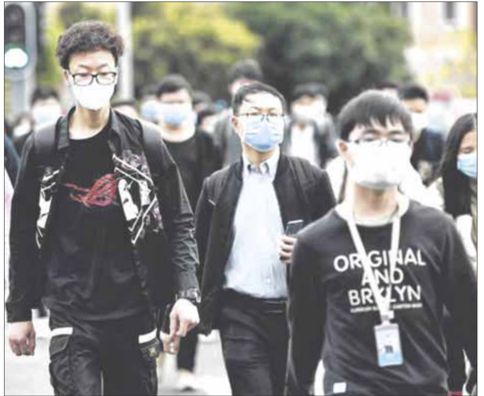
Según registro de la Universidad Johns Hopkins, los casos de Covid-19 a nivel mundial, superaron este sábado los 23 millones de infectados.

Estados Unidos y Brasil, reportaron 176 mil 978 y 114 mil 744 decesos, respectivamente, teniendo juntos, alrededor del 36% del total de víctimas fatales en el mundo.