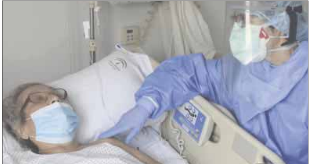
El ritmo de contagios de Covid-19 en Quintana Roo continúa con una tendencia a la baja, ayer se reportaron 10 nuevos positivos a la enfermedad.

En cuanto a la ocupación hospitalaria, Chetumal con una pérdida de dos puntos porcentuales quedó en 38%, Bacalar se mantuvo en 20% y Cancún bajo a 26%. El resto de los municipios presentaron: Cozumel (55%), Felipe Carrillo (22%), Isla Mujeres (0%), José María Morelos (0%), Lázaro Cárdenas (0%), Puerto Morelos (0%) y por último Playa del Carmen (33%) y Tulum (14%).