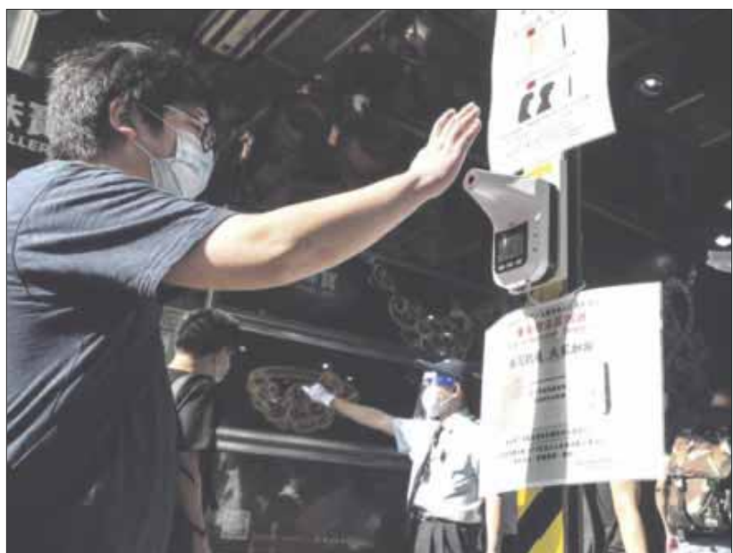
Según investigadores de la Universidad de Hong Kong, un hombre originario de aquel país es el primer caso de reinfección por Covid-19.

Un hombre de Hong Kong, de 33 años, es el primer caso de reinfección por Covid-19 en el mundo, según investigadores de la Universidad de Hong Kong.