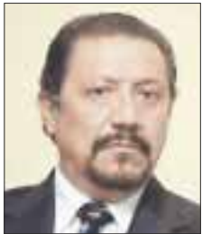
Por Sócrates A. Campos Lemus

Creo que en verdad, hay muchos que se la llevan lamentándose, sobre lo que sufren en la actualidad, y cuando andas en esas ramas de la queja y la lamentación, pues uno se especializa en ellas, pero no puede buscar otras formas de pensar para mejorar en su vida, y eso, requiere otra forma de pensar.