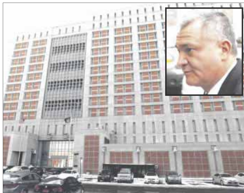
Genaro García Luna permanecerá retenido en el Centro de Detención Metropolitano de Brooklyn, mientras se lleva a cabo su proceso en NY.

ga de hambre y activismo por un apagón que los dejó sin calefacción una semana, fueron objeto de vejaciones como recibir gas pimienta o