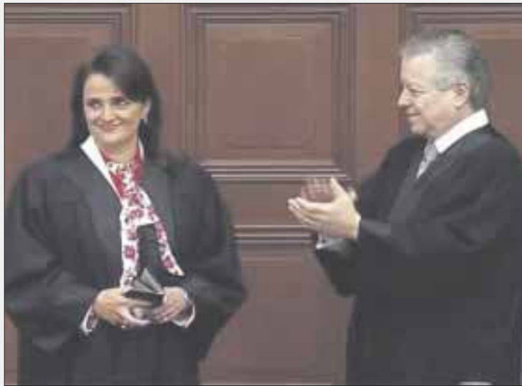
Margarita Ríos Farjat rindió protesta como ministra de la SCJN para los próximos 15 años.

El presidente de la Suprema Corte de Justicia de la Nación (SCJN), Arturo Zaldívar, afirmó que este lunes es un día histórico, pues por primera vez desde la reforma de 1994 habrá tres ministras en el máximo tribunal con la llegada de Margarita Ríos Farjat.