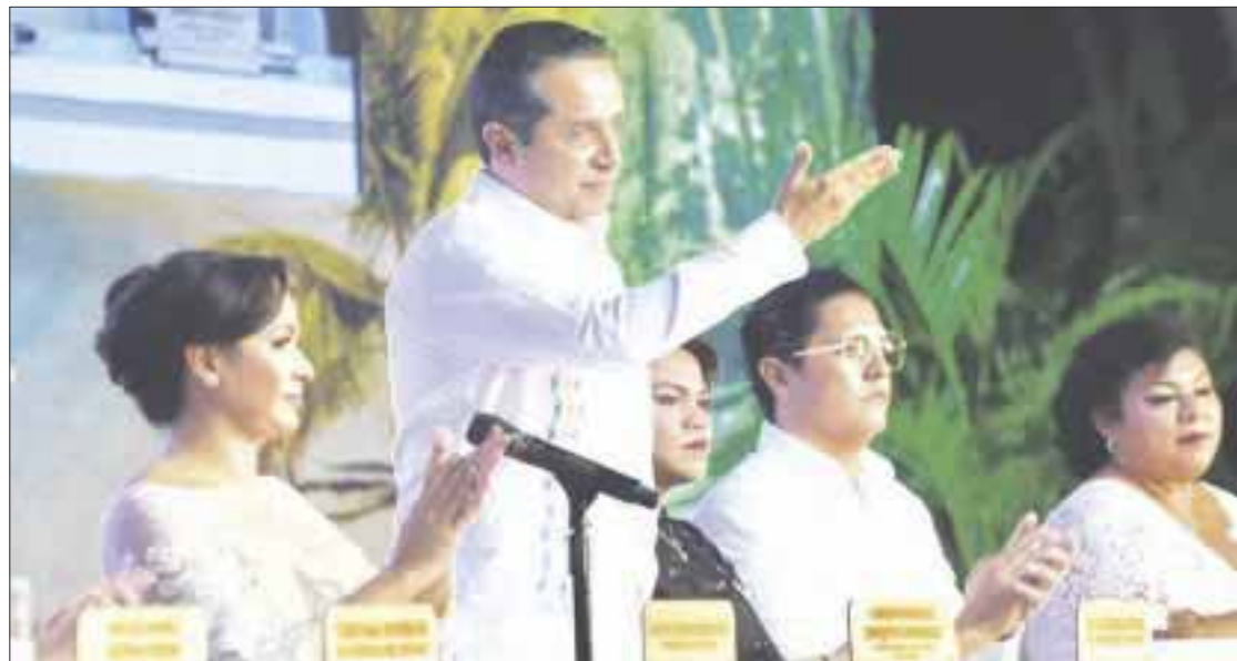
El gobernador Carlos Joaquín, al concluir el evento oficial, partió un pastel de cumpleaños.

Al concluir el acto solemne y acompañado de la presidenta del Sistema DIF Quintana Roo, Gaby Rejón, e invitados especiales, el gobernador Carlos Joaquín partió un pastel de cumpleaños y recibió felicitaciones de la ciudadanía y la interpretación de un mariachi.