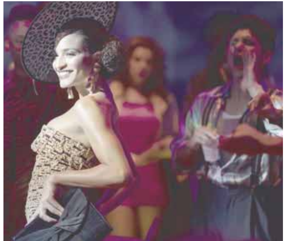
“Pose”, la aclamada serie de Ryan Murphy, estrenará su segunda temporada.

Estrena martes 14 de enero a las 21:20 horas por FOX Premium Series