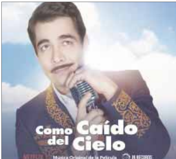
Omar Chaparro ha cautivado al público al interpretar a Pedro Infante.

El álbum recopila una exquisita selección de los mejores clásicos del ídolo Pedro Infante, entre los que encontraremos canciones como: “Amorcito corazón”, “Bésame mucho”, “Yo no fui” y otros éxitos del legendario cantante. Esta producción también trae un tema inédito llamado “De Que Me Sirve El Cielo” una poderosa y apasionante canción escrita por Jorge Avendaño y Omar Chaparro especialmente para la película, de la cual será el tema principal.