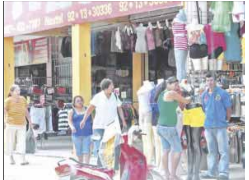
Los compradores mexicanos llegaron a la zona libre desde el sábado para la adquisición de regalos.

Desde las primeras horas del sábado se pudo observar la gran afluencia de compradores por todo el corredor comercial de casi tres kilómetros, donde se encuentran distribuidos los 260 establecimientos, de los cuales poco menos de la mitad son los dedicados a juguetes.