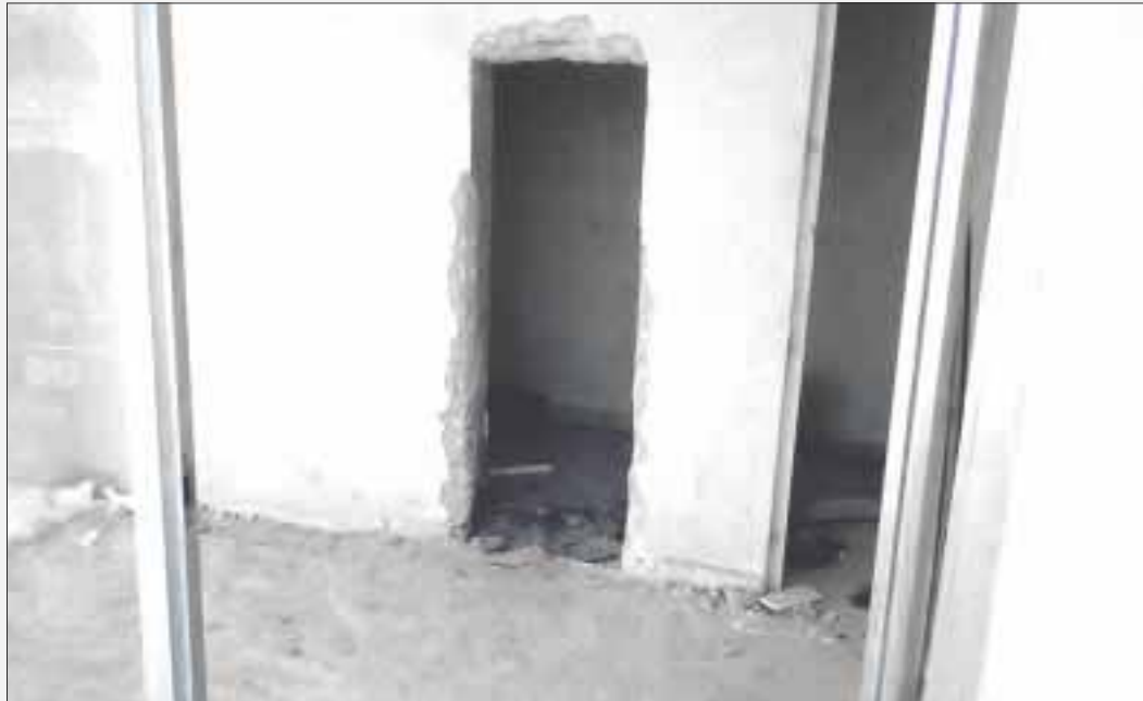
El cajero estaba situado afuera de las instalaciones de la Confederación Nacional de Productores Rurales (CNPR), donde se implementó un operativo policiaco.

Chetumal.- Como de Ripley, en una comunidad de Othón P. Blanco, se robaron un cajero de una sucursal bancaria, se dice, que fueron varios sujetos los que hicieron un hoyo en la pared para extraer el pesado artefacto, que además tuvo que ser cargado por todos, hasta llevarlo a una camioneta en la que finalmente lo transportaron.