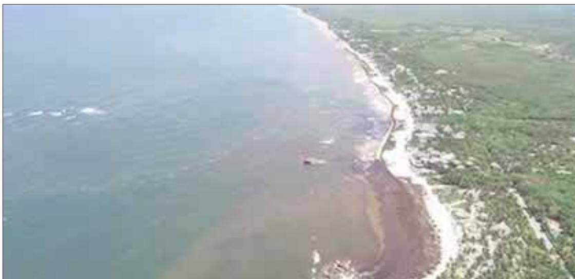
El gobierno estatal y la Secretaría de Marina (Semar) mantienen la vigilancia constante al movimiento de la macroalga en el mar Caribe y el océano Atlántico.

Han encontrado como alternativas usar el alga como composta, para darle un uso ecológico, mientras que otros empresarios lo han considerado como materia prima para la fabricación de papel, vasos, cucharas y hasta popotes biodegradables.