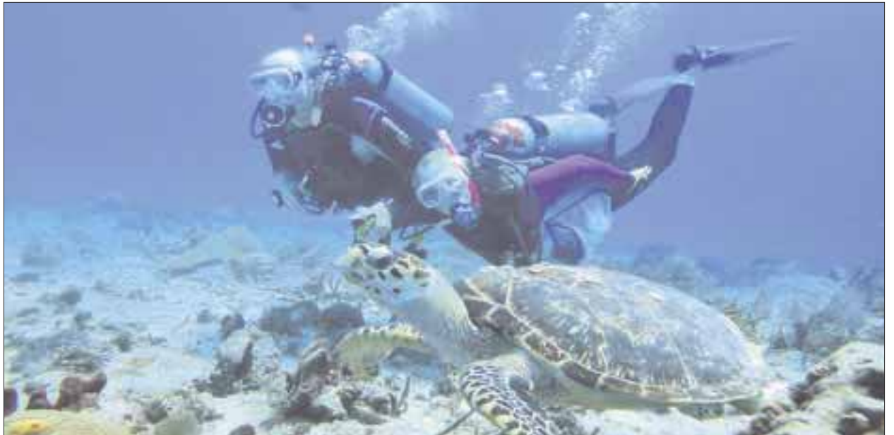
La cuarta edición del Summit de Turismo Sustentable 2020, se realizará del 26 al 29 de abril en Cancún.

Se tendrán ponentes de Inglaterra, Canadá, Estados Unidos y mexicanos, con el objetivo de continuar en la ruta hacia un turismo sustentable y sostenible, además de trabajar en la implementación del Plan Maestro de Turismo Sustentable que ya se presentó y que se está apoyando.