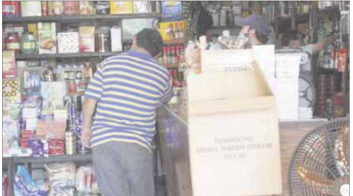
Ante la crisis por el surgimiento del coronavirus en China, Cofepris refuerza vigilancia de llegada de productos de este país a Q. Roo.

A consecuencia de los estragos ocasionados por el sargazo el