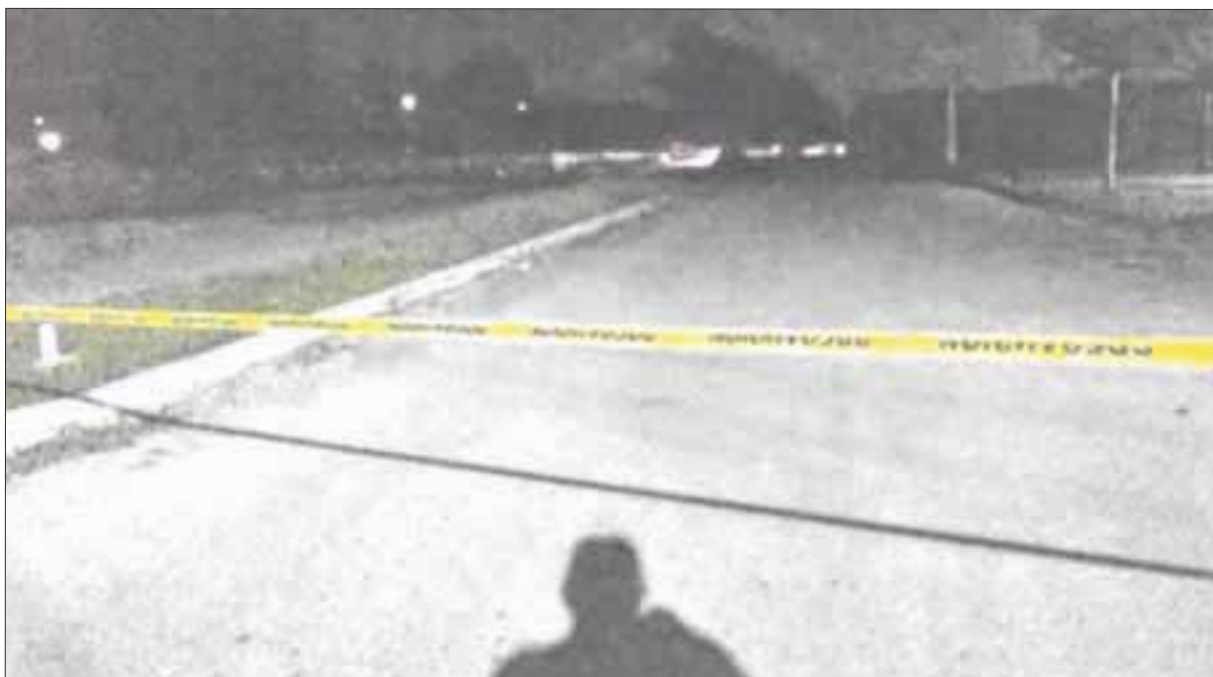
El cuerpo del hombre sin vida fue hallado en un predio a un lado del Arco Vial, en la Supermanzana 256 de Cancún y presentaba un disparo en la cabeza.

Cancún.- La ola de violencia no cesa en el estado, particularmente en Cancún, donde ya suman 44 homicidios dolosos en lo que va de 2020, lamentablemente tampoco se han capturado a los responsables de estas masacres, como lo es en este nuevo caso perpetrado la madrugada de este miércoles en la Supermanzana 256 de Cancún, donde fue hallado un muerto más, pero ninguna pista sobre sus agresores.