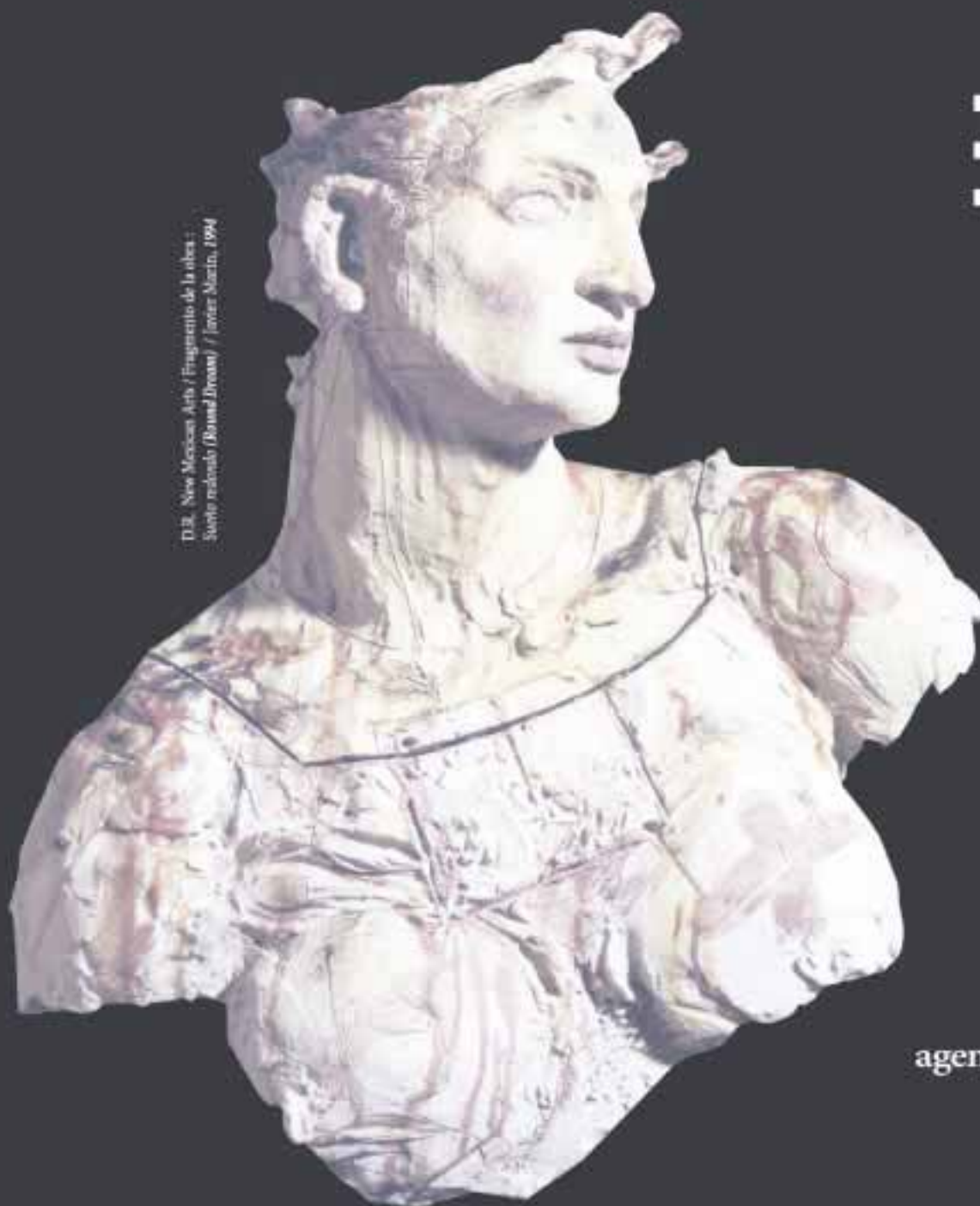
D.R. New Mexican Arts / Fragmento de la obra: Juente molinero (Bernard Drouot) / Javier Martin, 1994