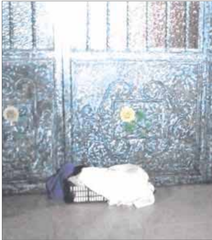
El menor, que aún tenía el cordón umbilical, fue dejado en una caja de plástico color negro con mantas en su interior.