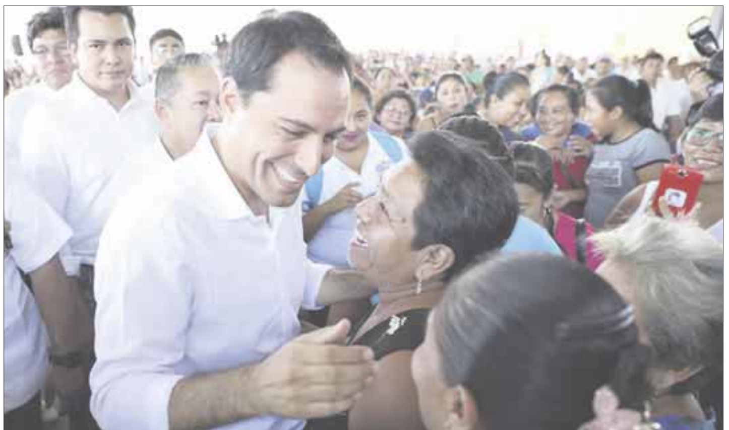
El gobernador panista de Yucatán, Mauricio Vila, en los primeros lugares.