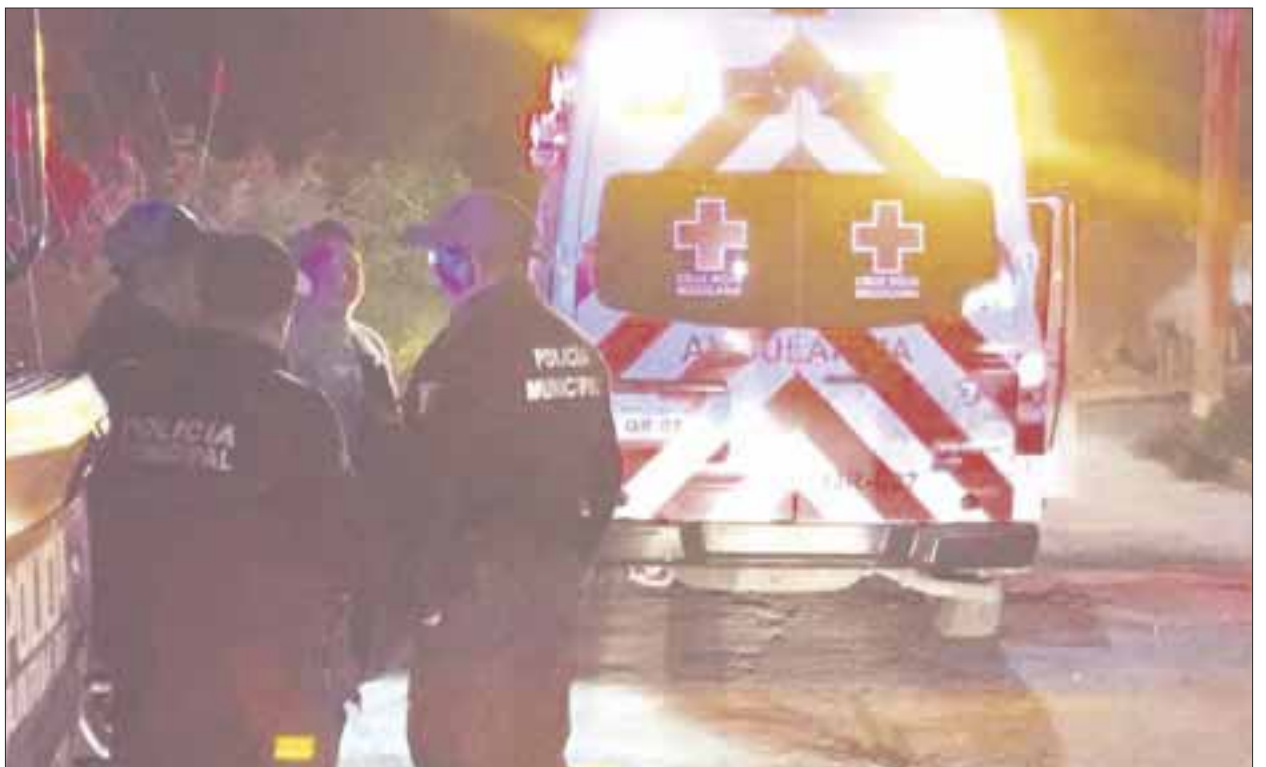
Algunos testigos señalan que la menor de 12 años que fue abusada sexualmente podría ser pariente cercano de un agente policiaco municipal.

Elementos de la Policía Quintana Roo y una ambulancia acudieron al sitio; al llegar se percataron de las condiciones físicas de la niña, por lo que dieron parte a los agentes de la Policía Ministerial de la Fiscalía General del Estado de Quintana Roo para que lleven el caso y lo resuelvan, ya que se hablaba que el responsable fue otro menor de edad. Se especula que en el lugar se habló de que la menor es familiar cercano de un agente policiaco municipal, pero al igual que la información de que el responsable fue otro menor, esta información no ha sido confirmada por las autoridades de la Fiscalía General del Estado de Quintana Roo.