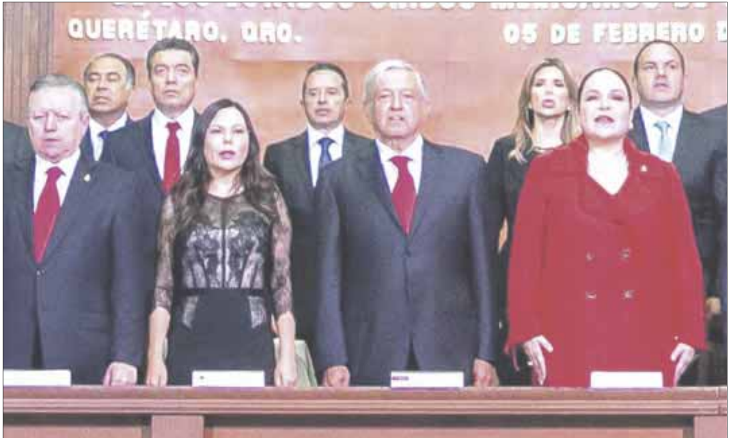
Conmemoración del 103 aniversario de la promulgación de la Constitución Mexicana, en el Teatro de la República.

Durante su visita a Querétaro, el funcionario estatal sostuvo una reunión de trabajo en temas de seguridad para Quintana Roo con el secretario de Seguridad Pública Alfonso Durazo Montaña, con el secretario de la Defensa Nacional General Luis Crescencio Sandoval González y con el secretario de la Marina José Rafael Ojeda Durán, al concluir la ceremonia conmemorativa.