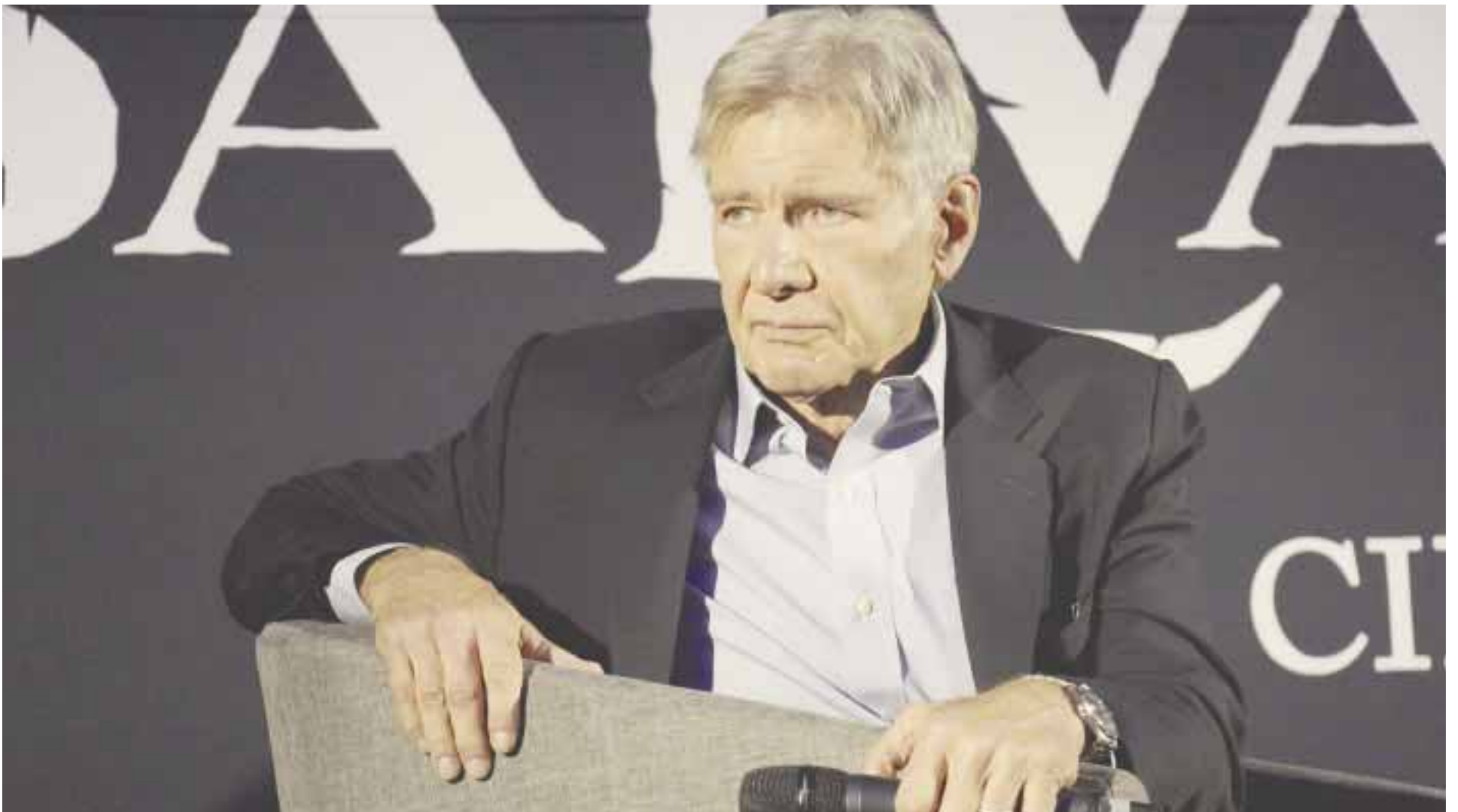
Harrison Ford, quien ha interpretado a personajes que se hicieron emblemáticos como Han Solo e Indiana Jones, habló sobre brindar apoyo a migrantes en Estados Unidos y también sobre el activismo de la joven Greta Thunberg.

El actor dijo que “El llamado salvaje” es un trabajo con un formato de las películas que se hacían antes en Hollywood, aseguró que es un filme familiar y un proyecto en donde amó su intervención, ya que refleja una parte muy íntima de él, como el amor que tiene a los perros.