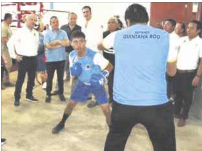
Se hizo entrega de material deportivo y se realizó una visita a las instalaciones en donde pugilistas realizaron exhibiciones.

Felipe Carrillo Puerto.- Inicia actividades la Escuela de Alfabetización Física para el Desarrollo del Boxeo en el municipio de Felipe Carrillo Puerto, una de las tres que se han instalado en Quintana Roo, Cozumel y Lázaro Cárdenas las otras sedes del proyecto integral de la Comisión Nacional de Boxeo, CONABOX que lleva a cabo en coordinación con el Gobierno del Estado y los municipios.