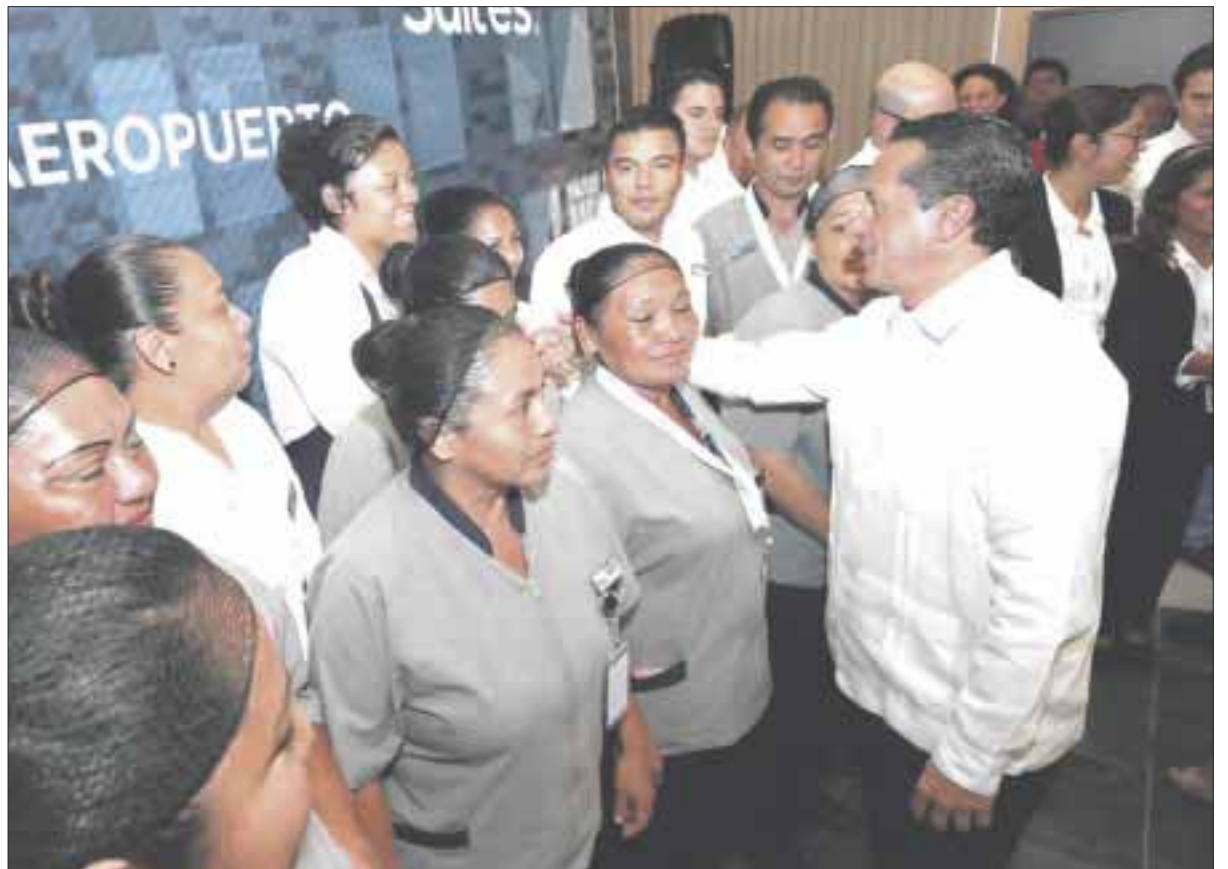
Con la inversión llegaron nuevas fuentes de empleo, afirma el gobernador Carlos Joaquín.

"Es indispensable continuar como un potente motor del desarrollo económico regional, comunitario y nacional, y, por supuesto, impulsar la diversificación turística, en lo que contribuirá el 'World Trade Center'", agregó el gobernador de Quintana Roo.