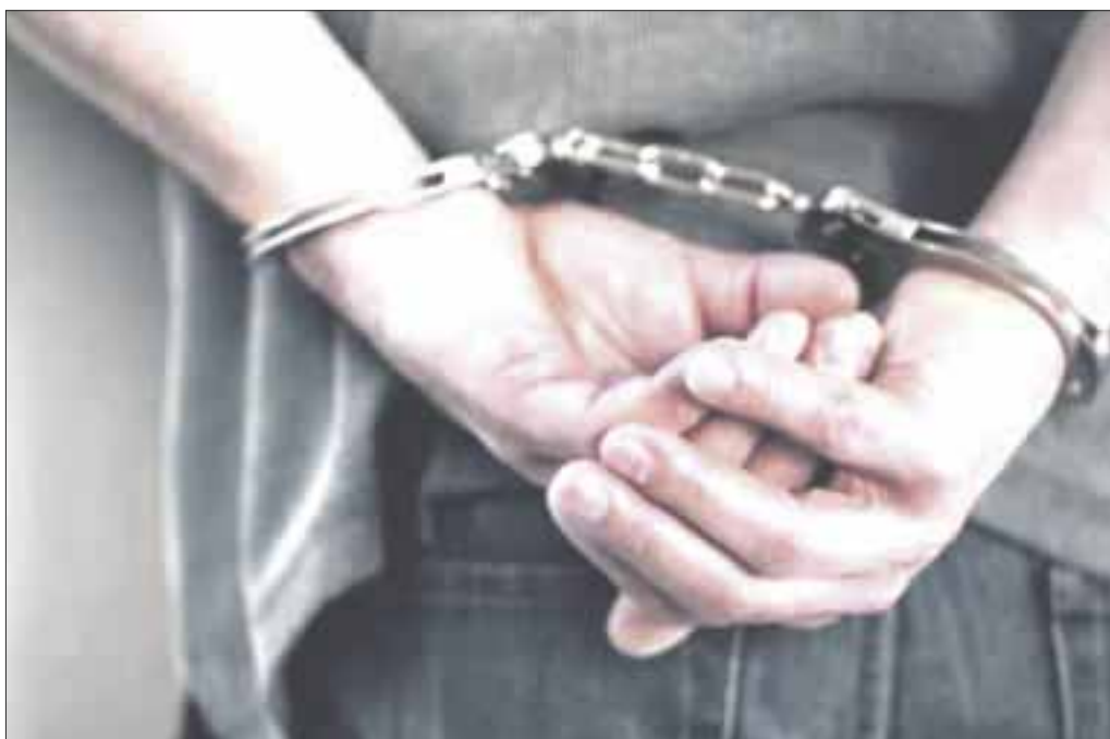
La FGR entregó en extradición a diferentes Cortes de Justicia en Estados Unidos a cinco narcotraficantes mexicanos.

Un grupo de cinco narcotraficantes fue entregado en extradición a diferentes Cortes de Justicia en Estados Unidos, informó la Fiscalía General de la República (FGR).