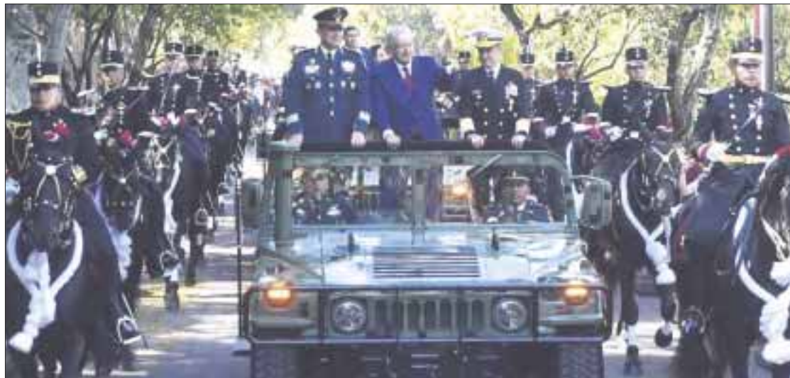
En el 107 aniversario de la Marcha de la Lealtad, las Fuerzas Armadas reiteraron su incondicional lealtad al presidente Andrés Manuel López Obrador.

En los honores al presidente de la República, le brindaron 21 cañonazos de salva para honrar su investidura como Alto Mando de las Fuerzas Armadas.