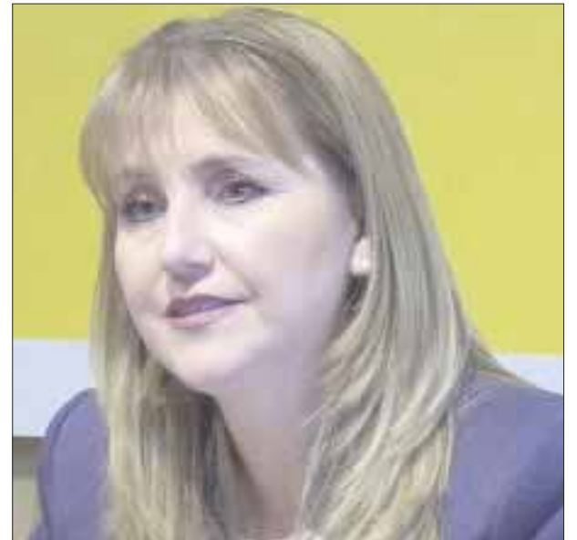
Gloria Guevara, presidenta del WTTC.

Cabe destacar que reportes del tercer trimestre del 2019, señalan que más de 80 mil sudcalifornianos se dedican al turismo, lo que representa 73.4 por ciento de la fuerza laboral de Baja Ca-