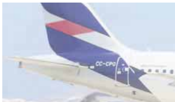
La línea aérea iniciará vuelos de Chile a Frankfurt.