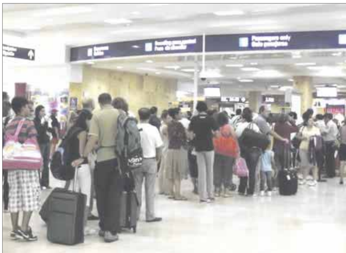
Al Aeropuerto Internacional de Cancún llegaron dos millones 227 mil 114 viajeros en el primer mes del año.

En cuanto al aeropuerto de Cozumel, el aumento global relacionado con la llegada de viajeros fue del 5.9 por ciento, al pasar de 55 mil 176 usuarios en 2019 a 58 mil 437 este año.