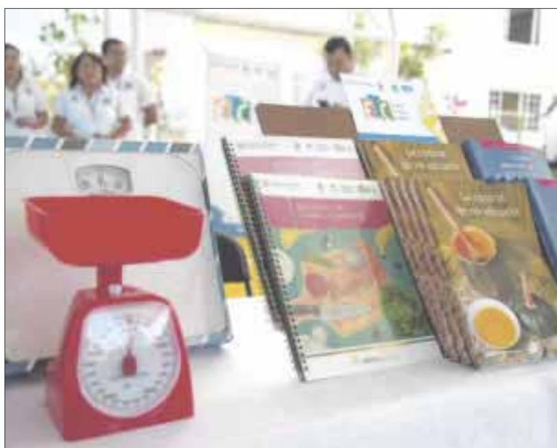
Titular de la SEQ invitó a mejorar y fortalecer el PETC en el estado

Chetumal.- La titular de la SEQ, Ana Isabel Vásquez Jiménez encabezó la entrega simbólica de material didáctico a 490 escuelas públicas de educación básica, así como insumos para fortalecer la medición de peso y talla de la matrícula escolar, con el objetivo de fortalecer las líneas de trabajo que propone el modelo pedagógico del Programa Escuelas de Tiempo Completo.