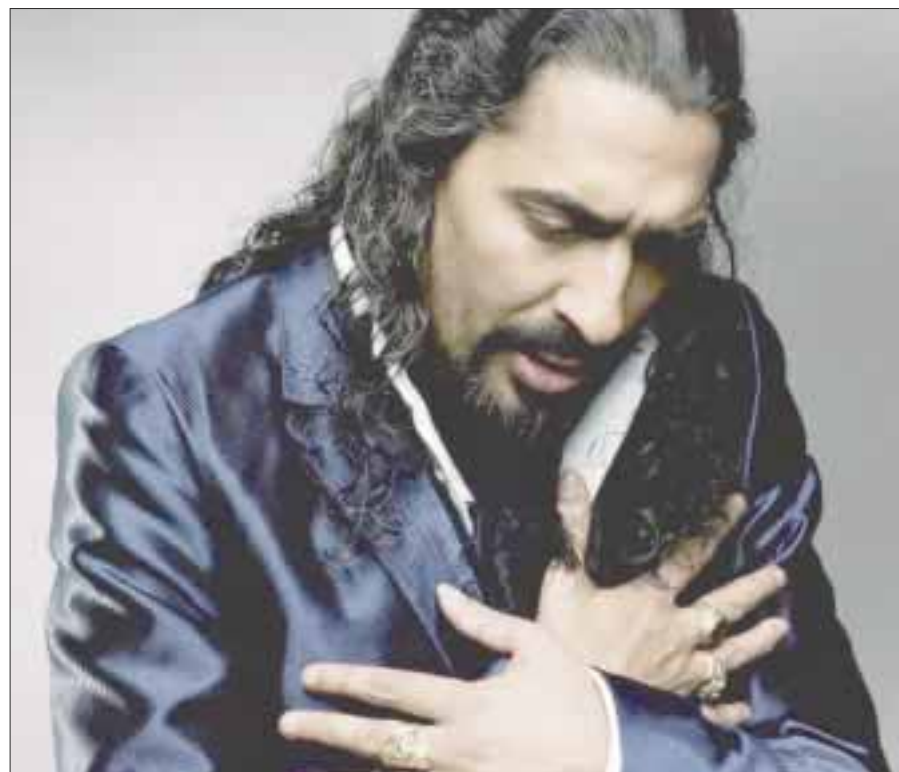
Diego El Cigala presenta un show totalmente renovado, músicos que entran y salen para cambiar los géneros, canciones de amor y desamor.

Finalmente, adelantó que tentativamente el nuevo sencillo será lanzado "un par de semanas antes del concierto. Me aventé a incluirme en el proceso de composición y de autoría del primer sencillo. Se trata de atreverte a ser tú y no alguien más, por eso admiro la labor de los compositores, me animé y lo he gozado, hay dos canciones más en el disco y en cuanto a la música estoy integrada en el equipo, como en el sonido y la producción", concluyó.