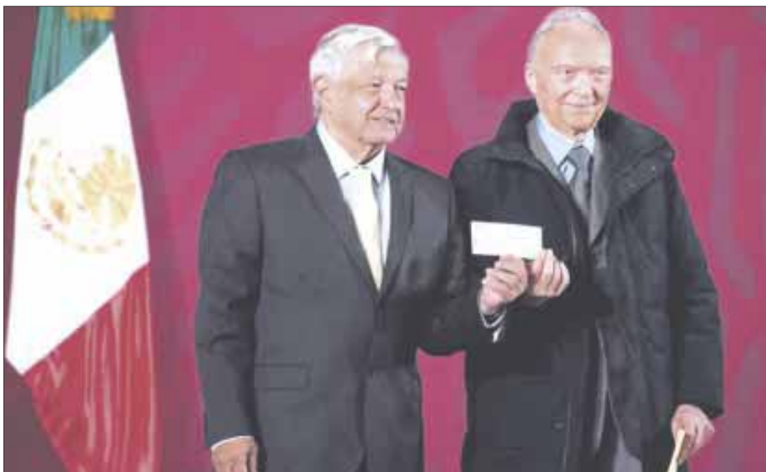
La FGR entregó 2 mil millones de pesos que serán destinados a pagar los premios de la rifa que se hará por el avión presidencial.

Alejandro Gertz Manero, titular de la Fiscalía General de la República (FGR), entregó este lunes un cheque de dos mil millones de pesos que fueron recuperados de una investigación de combate a la corrupción.