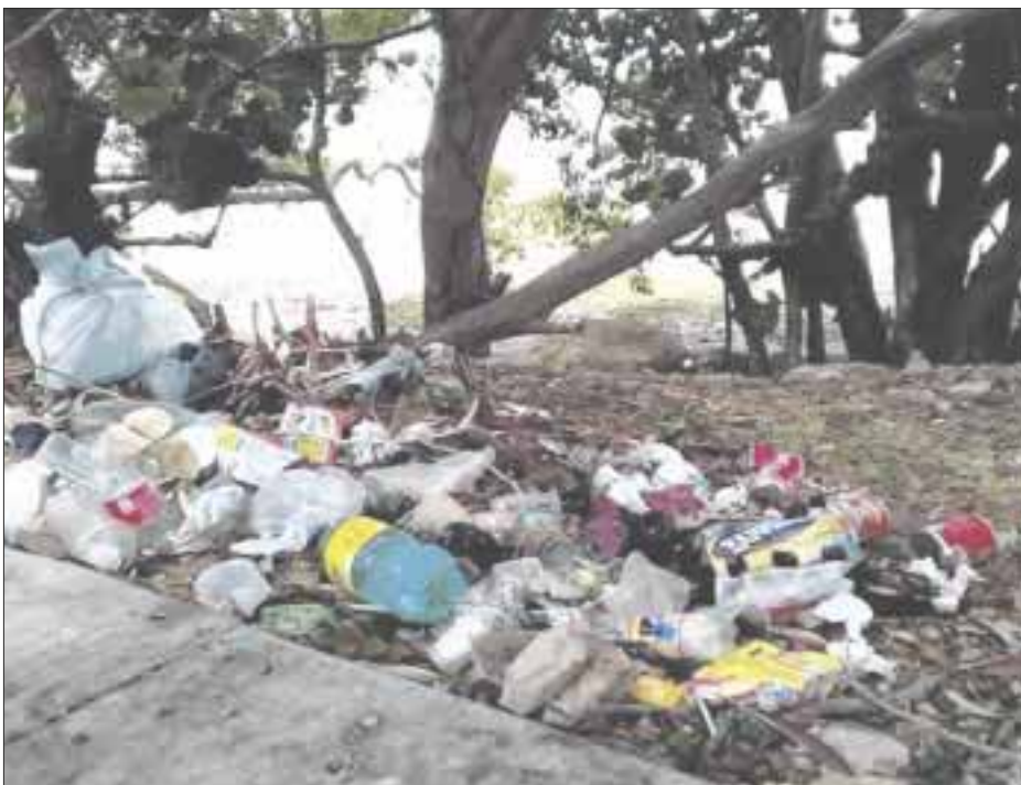
Plásticos, telas, botellas de vidrio, entre otros materiales que son utilizados en eventos privados quedan regados en la vía pública y llegan hasta la costa.

Chetumal.- La Asociación Proyecto Aak Mahahual A.C., ha denunciado que la celebración de bodas y fiestas privadas en la zona del Mahahual están contaminando seriamente al ambiente, dañando de esta manera el equilibrio ecológico y particularmente a especies como el manglar que debería ser protegido.