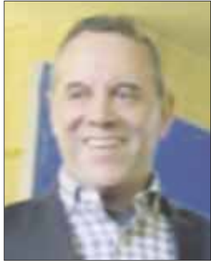
Por José Luis Montañez