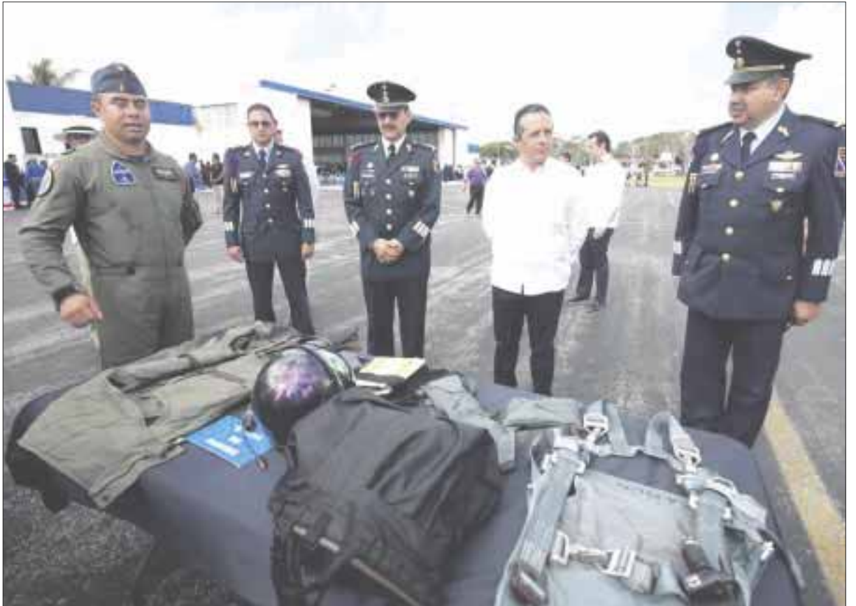
Se presentó una exhibición estática de aeronaves en el 105 aniversario de la Fuerza Aérea Mexicana.

En el recorrido, se explicó que la Fuerza Aérea Mexicana se encarga de la defensa del espacio aéreo, el territorio y la soberanía nacional; garantiza la seguridad interior e instrumenta el Plan DN-III-E, en caso de desastres, a través de puentes aéreos.