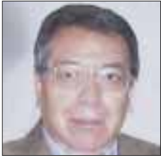
Por Roberto Vizcaino

Esta vez el cabildeo no logró ni detener, desviar o modificar el dictamen final y todo indica que los temibles dobles remolques que corrieron libremente por las carreteras de México, sin importar las miles de muertes y víctimas que causaron, junto con los más espeluznantes accidentes, llegarán pronto a su fin en este país.