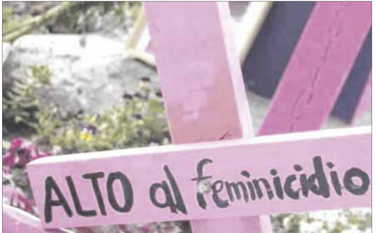
El fiscal Alejandro Gertz Manero negó que pretenda desaparecer el delito de feminicidio y dijo que no piensa renunciar a la Fiscalía General de la República.

“Me han enfermado, me han renunciado, me han parece que hay grupos a los que estoy molestando, pero es mi trabajo”, expresó Gertz Manero.