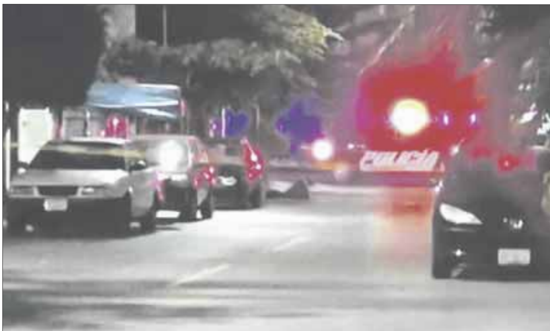
Los hechos se registraron en la Calle Canoras 11 con Canoras 2 y Pavo Real, en el fraccionamiento Villas del Carmen.

Playa del Carmen.- Lamentable situación se vivió en el municipio de Solidaridad, donde algunos vecinos reportaron el hallazgo de una bolsa, que inicialmente creyeron contenía algún animal muerto, debido a los olores, no obstante la llegada de las autoridades confirmaron que no se trataba de animales, sino de restos humanos en estado de descomposición.