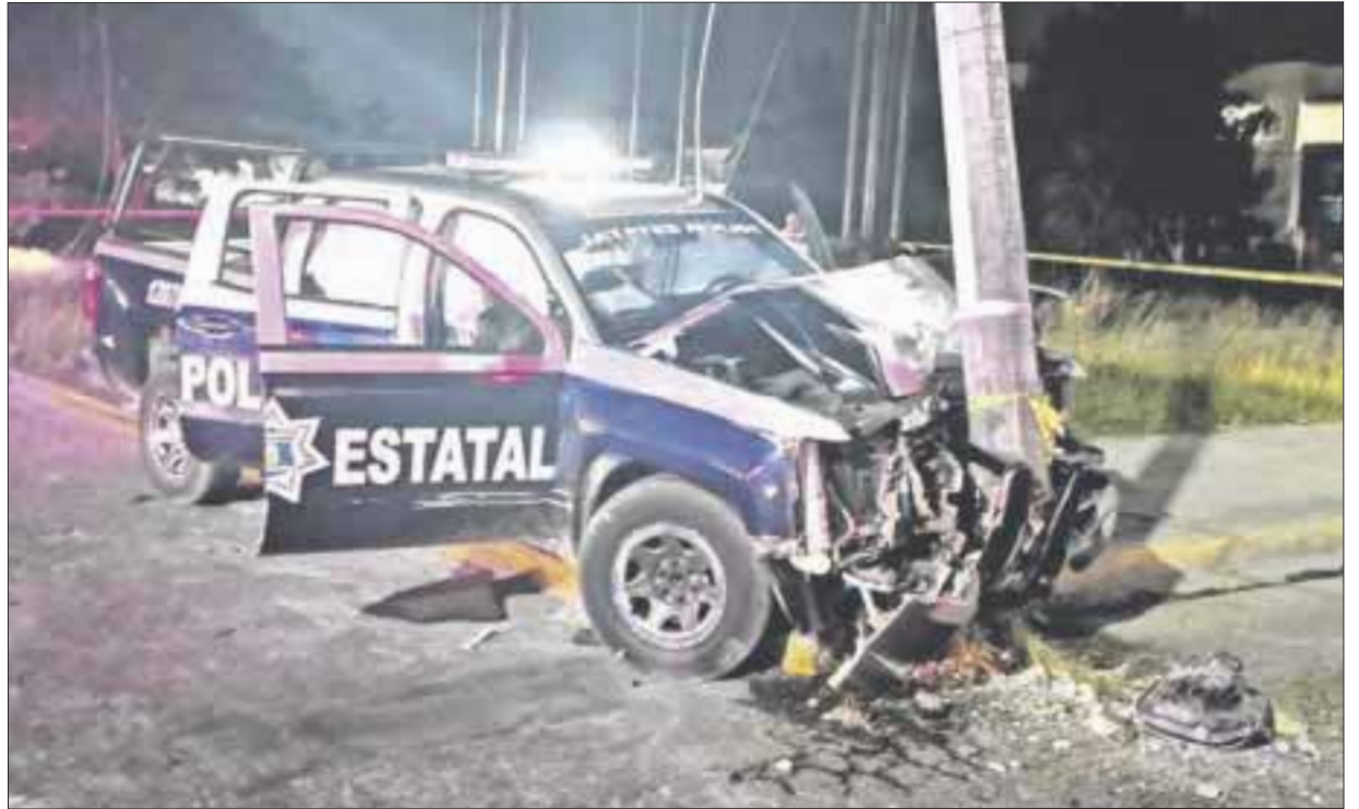
La patrulla fue prácticamente una pérdida total, pues quedó incrustada contra el poste, lo que ocasionó que dos policías resultaran lesionados.

Los trabajos de la Comisión Federal de Electricidad para reponer el poste dañado se realizaron en el transcurso de la mañana de este lunes, mientras la Secretaría de Seguridad Pública de Quintana Roo no ha realizado ningún pronunciamiento sobre el accidente de una de sus unidades.