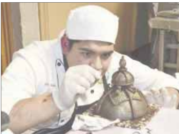
La “Fiesta Nacional del Chocolate”.

victoriagprado@gmail.com Twitter: @victoriagprado