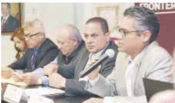
En la reunión con autoridades de Tijuana y San Diego.