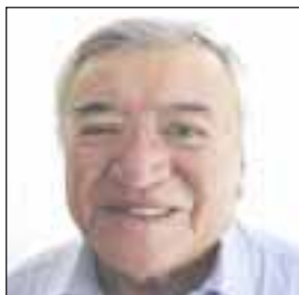
Por Miguel Ángel Rivera

Los próximos consejeros del Instituto Nacional Electoral (INE) no deben tener simpatías partidistas y ser conocedores de la materia, afirmó la secretaria de Gobernación, Olga Sánchez Cordero.