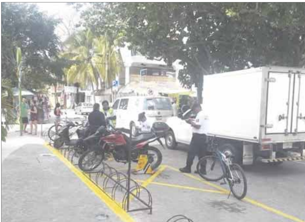
A partir de esta semana comenzaron con las primeras inmobilizaciones a motocicletas.

Playa del Carmen.- El programa de parquímetros inició con la aplicación de inmobilizadores, también conocidos como “arañas,” a motocicletas, cuyos dueños las estacionen en lugares incorrectos, pues hasta hace unas semanas no les aplicaban sanciones.