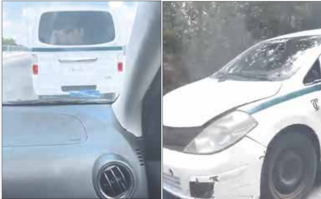
En un video publicado en redes se aprecia el momento en que los operadores del Sindicato Andrés Quintana Roo, interceptaron al vehículo de Uber.

Cancún.- Es bien sabido que la plataforma de transporte de pasajeros Uber no cuenta con permiso para operar en Quintana Roo, no obstante la violencia no debería ser un factor en este sentido para eliminarlos de la zona, puesto que ya son varias ocasiones en que los choferes de la mencionada plataforma son intimidados y hasta agredidos por agremiados del Sindicato Andrés Quintana Roo.