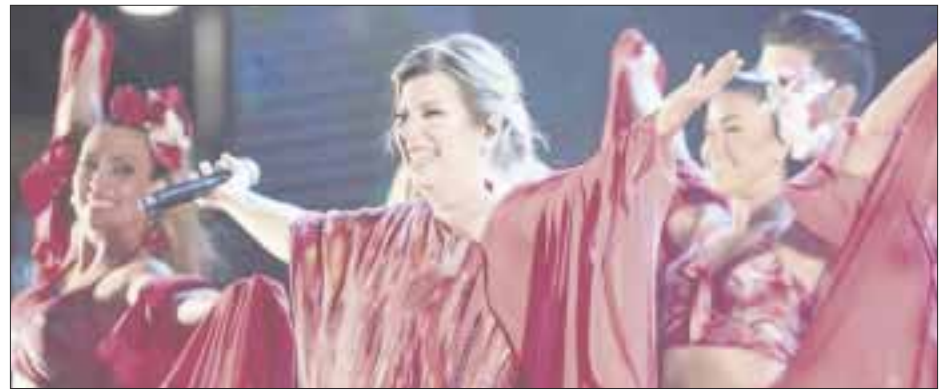
Un carnaval de playa vivirá Cancún, con la desbordada energía de la rockera Alejandra Guzmán, y Margarita “La Diosa de la Cumbia”.

Cancún. – Un carnaval de playa vivirá Cancún, con la desbordada energía de la cantante rockera Alejandra Guzmán, y Margarita la Diosa de la Cumbia, que amenizarán el ambiente de fiesta al Dios