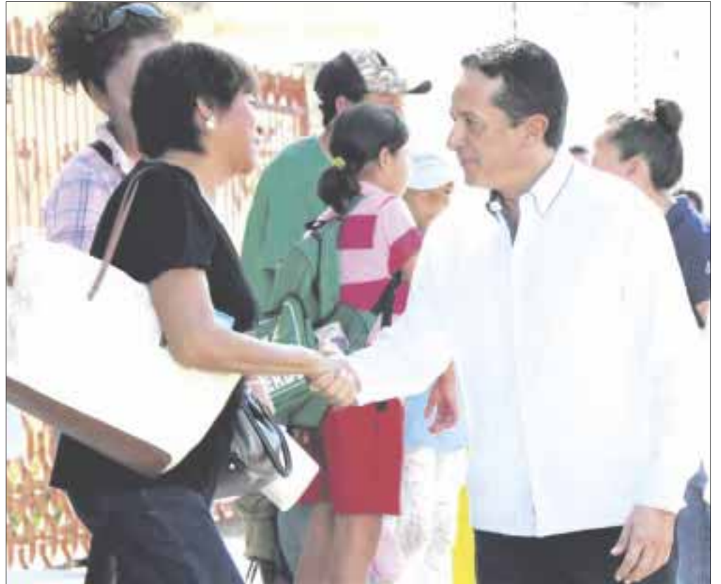
El gobernador Carlos Joaquín inaugurará este miércoles la Expo Inmobiliaria Quintana Roo Investment Summit 2020 y tomará protesta al consejo directivo del AMPI en Quintana Roo.

Durante la Expo Inmobiliaria Quintana Roo Investment Summit 2020, se realizarán conferencias magistrales con muestras de proyectos y temas de perspectiva económica, reformas fiscales, plan maestro de desarrollo sustentable, la importancia de la matrícula y la acreditación para el asesor inmobiliario, y las leyes de la Reforma Urbana de Quintana Roo, entre otros temas.