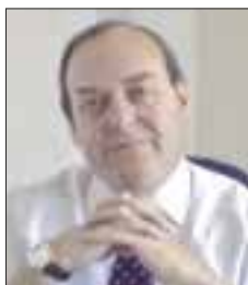
Por Ramón Zurita Sahagún

Las cámaras del ramo intensificaron sus campañas de cabildeo para evitar se legislara en la materia y consiguieron su propósito, pero ahora la fracción de Morena en el Senado de la República presentará una iniciativa para reglamentar el tema y, de ser aprobada, prohibir la circulación de estos vehículos catalogados como “carromatos de la muerte”.