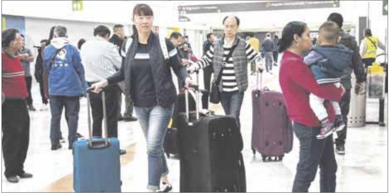
Exhorta el Consejo Mundial de Viajes y Turismo (WTTC) a no discriminar a turistas chinos ante el brote de coronavirus.

Además, precisó que la tasa de mortalidad al momento, es relativamente baja de sólo el dos por ciento contra el 10 por ciento del SARS, y el 34.4 del Síndrome Respiratorio del Medio Oriente (MERS). Preciso, que los viajes y el turismo hacia y desde China provoca beneficios culturales y económicos al mundo, y por ende, en el WTTC se consideró que el sector, es una fuerza para el bien, que une a las personas, sin importar de dónde sean.