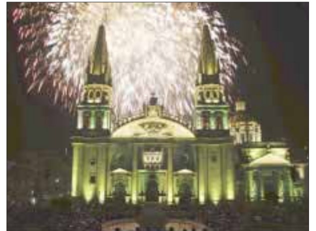
Guadalajara celebra su 478 aniversario.

☆☆☆☆☆ La “Fiesta Nacional del Chocolate”, inició el pasado lunes 10 y concluirá el próximo domingo 16 en el Patio