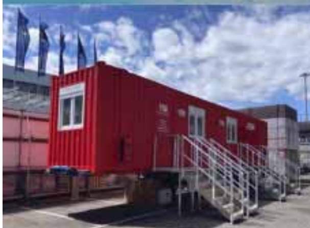
La aerolínea tiene módulos para realizar pruebas Covid-19.