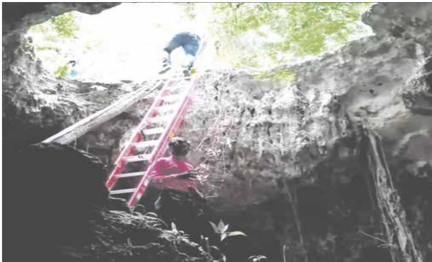
Vecinos alimentan cría de cocodrilo con perros y gatos, que está en cautiverio al interior de un cenote.

Se desconoce si el cocodrilo fue encontrado en algún lugar y colocado en el cenote, así también de quien fue la idea de alimentar al ejemplar con perros y gatos que deambulan en la zona.