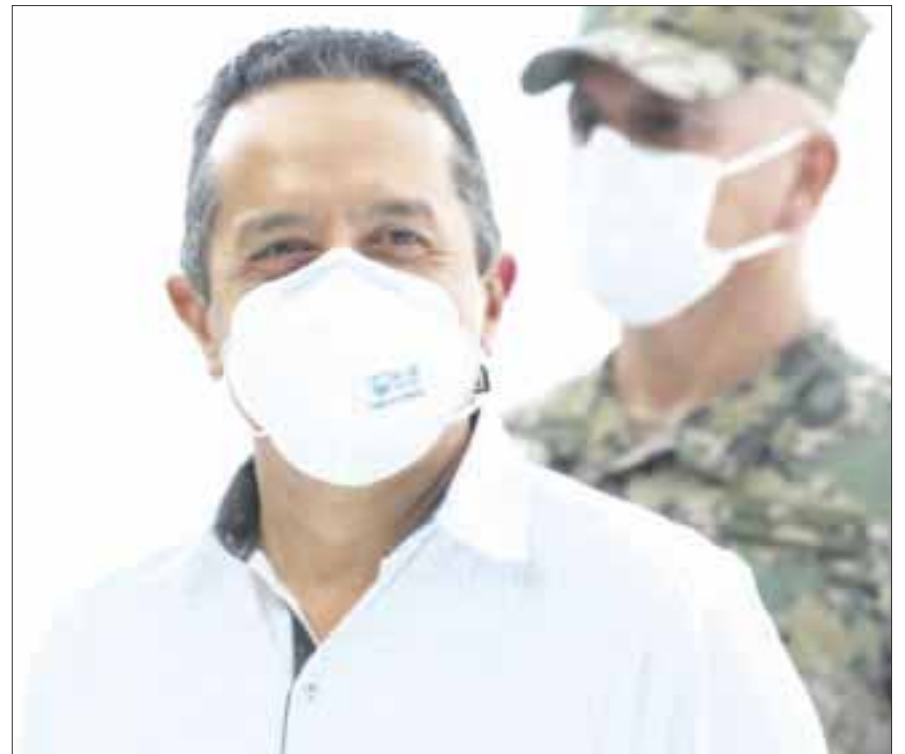
El gobernador Carlos Joaquín sostuvo que están en operación las embarcaciones recolectoras de sargazo, para mantener el esplendor de nuestras playas”.

En el mes de junio -dijo-se recolectaron 4,300 toneladas aproximadamente, y en lo que va de julio se han recolectado 2,300 toneladas, aproximadamente.