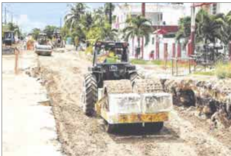
El drenaje pluvial de Chetumal zona norte, donde se invierten más de 137 millones de pesos, beneficiará a más de 12 mil habitantes.

Chetumal.- La construcción del drenaje pluvial de Chetumal zona norte, donde se invierten más de 137 millones de pesos, beneficiará a más de 12 mil habitantes que transitan las zonas de las avenidas Erick Paolo Martínez, Constituyentes, Centenario, Ignacio Manuel Altamirano y Calzada Veracruz.