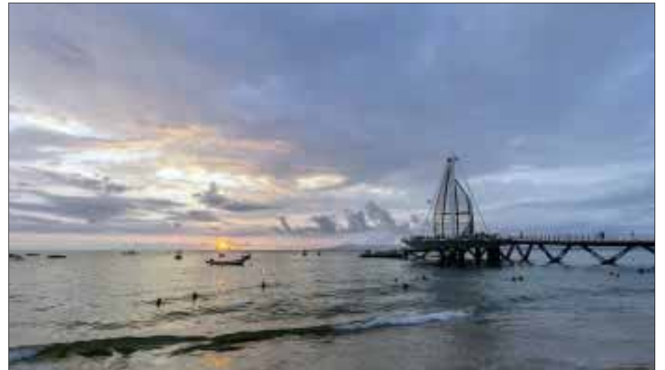
Atardecer en playa Los Muertos.