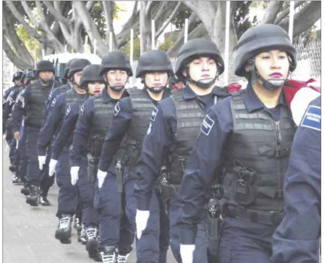
La Secretaría de Seguridad y Protección Ciudadana continúa con la campaña nacional de reclutamiento para ampliar capacidades del Servicio de Protección Federal.

Cabe destacar que el Servicio de Protección Federal avanza en la incorporación de 13 mil nuevos elementos en este 2020 y se continúa en el cumplimiento de la instrucción presidencial para que todas las instalaciones del Gobierno Federal sean resguardadas por el SPF.