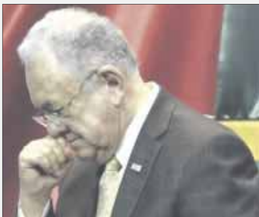
El presidente Andrés Manuel López Obrador aceptó ayer la renuncia de Javier Jiménez Espriú a la SCT.

Ciudad de México.- A través de un video difundido en sus redes sociales, el presidente Andrés Manuel López Obrador aceptó ayer la renuncia de Javier Jiménez Espriú a la Secretaría de Comunicaciones y Transportes (SCT). Argumentó que la razón fue un “diferendo” sobre el manejo de los puertos y aduanas cuyo control fue delegado la semana pasada a las fuerzas armadas.