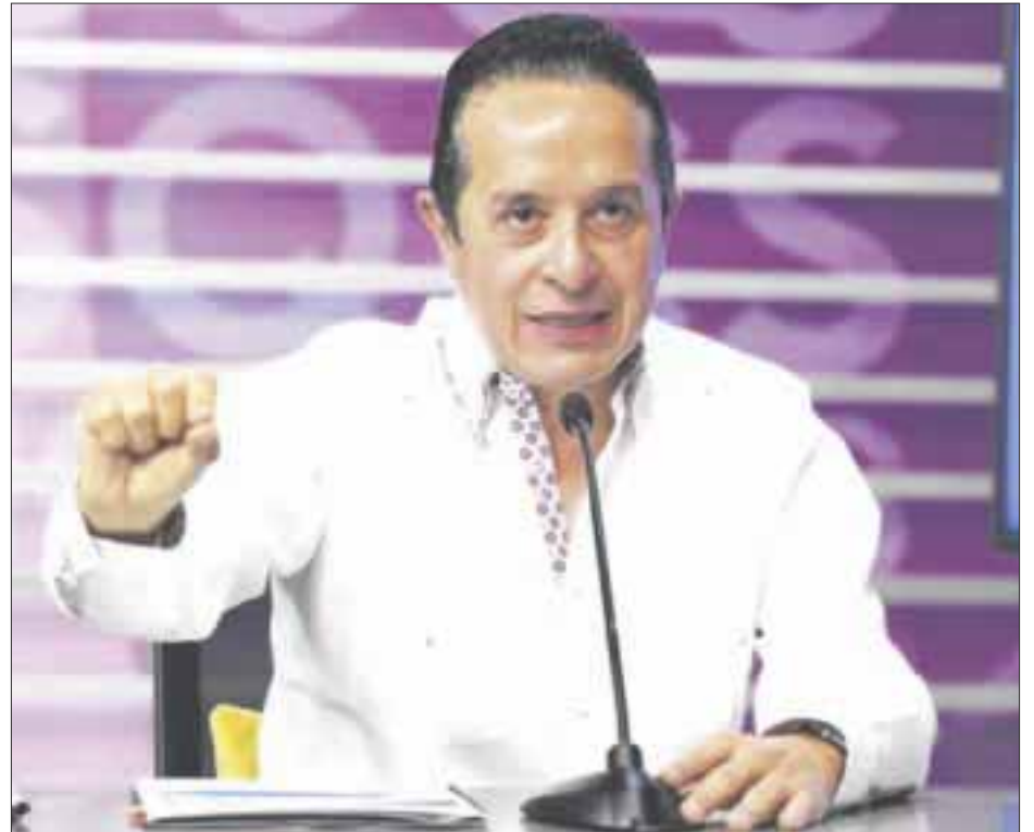
El gobernador Carlos Joaquín dijo que la inversión productiva se ha reactivado y las fuentes de empleos se han reabierto poco a poco.

El mandatario estatal explicó que los indicadores con que iniciaron las actividades económicas son positivos y hay confianza en Quintana Roo y en los quintanarroenses.