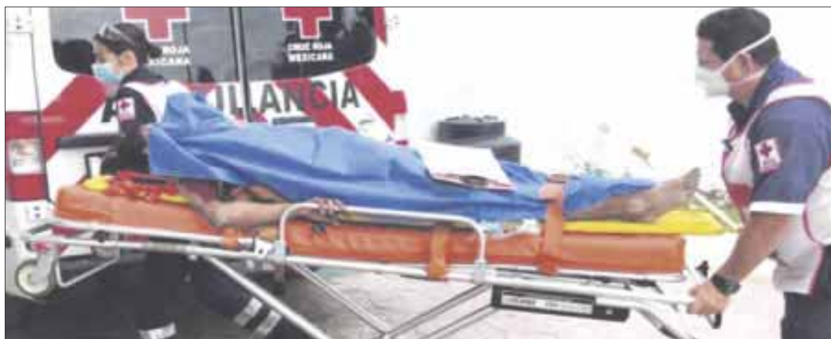
Una mujer de aproximadamente 18 años de edad fue secuestrada, violada y herida con arma blanca en el fraccionamiento Prado Norte.

La agraviada, como pudo relató, los hechos e informó que cerca de las 10 de la mañana fue privada de su libertad por unos sujetos, quienes abusaron sexualmente de ella, después golpearon y lesionaron a la altura de la barbilla con un cuchillo y, al parecer, la aventaron de un auto en movimiento