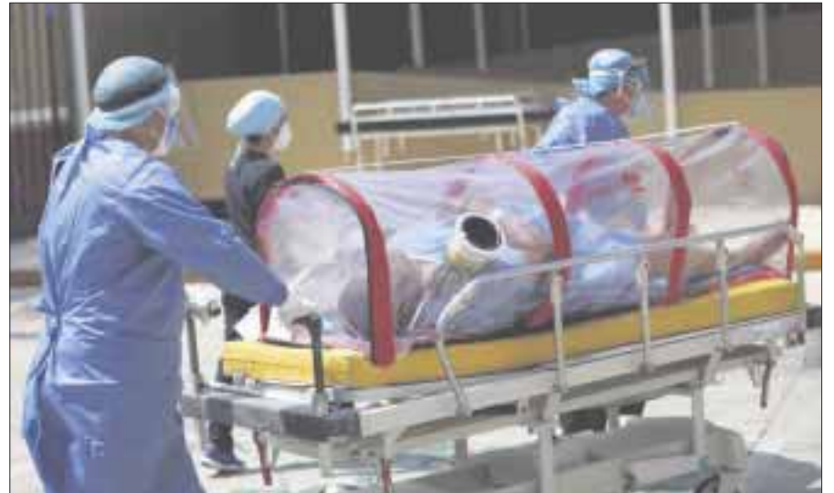
Un fin de semana aplastante se vivió en Quintana Roo con más de 300 nuevos contagios de Covid-19 en apenas dos días

Si a los 7,114 positivos, les restamos las 920 defunciones y los 3,242 recuperados, obtenemos que hasta ayer al mediodía había 2,952 casos "activos" en toda la entidad