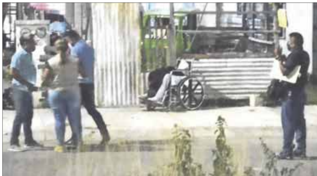
Un ataque a balazos dejó como saldo un sujeto asesinado en su silla de ruedas y una mujer lesionada frente a un domicilio del fraccionamiento La Joya.

De acuerdo al primer respondiente, de la patrulla 5732, informó de que los responsables de los disparos se dieron a la fuga en una motocicleta, uno de ellos vestía playera negra.