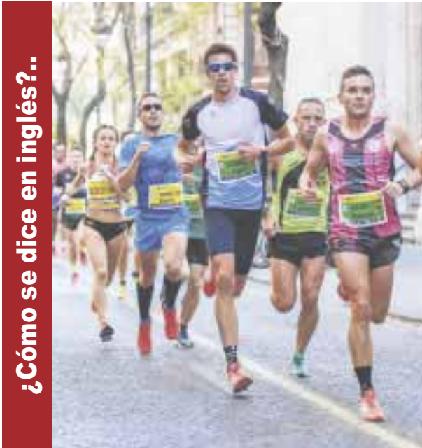
¿Cómo se dice en inglés?..