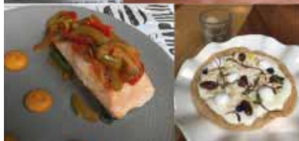
Arrachera, salón y el buñuelo acompañados por coctel de mezcal y cerveza artesanal.