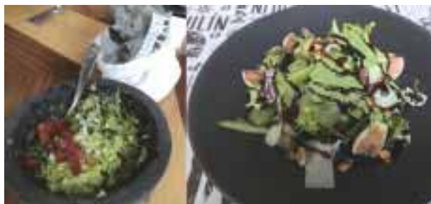
Guacamole y ensalada verde.

victoriagprado@gmail.com Twitter: @victoriagprado