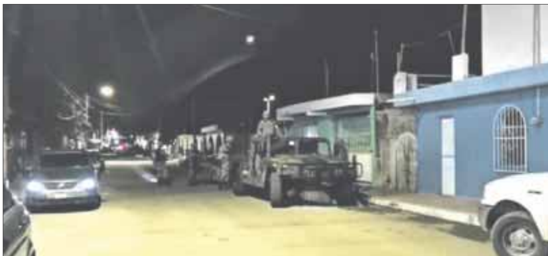
Un robo con violencia sufrió una mujer de 64 años, de parte de amantes de lo ajeno al interior de su vivienda en la colonia Adolfo López Mateos.

Chetumal.- Un robo con violencia padeció una mujer de 64 años, de parte de amantes de lo ajeno al interior de su vivienda, en donde fue amarrada de pies y manos por tres sujetos durante la madrugada en la colonia Adolfo López Mateos.