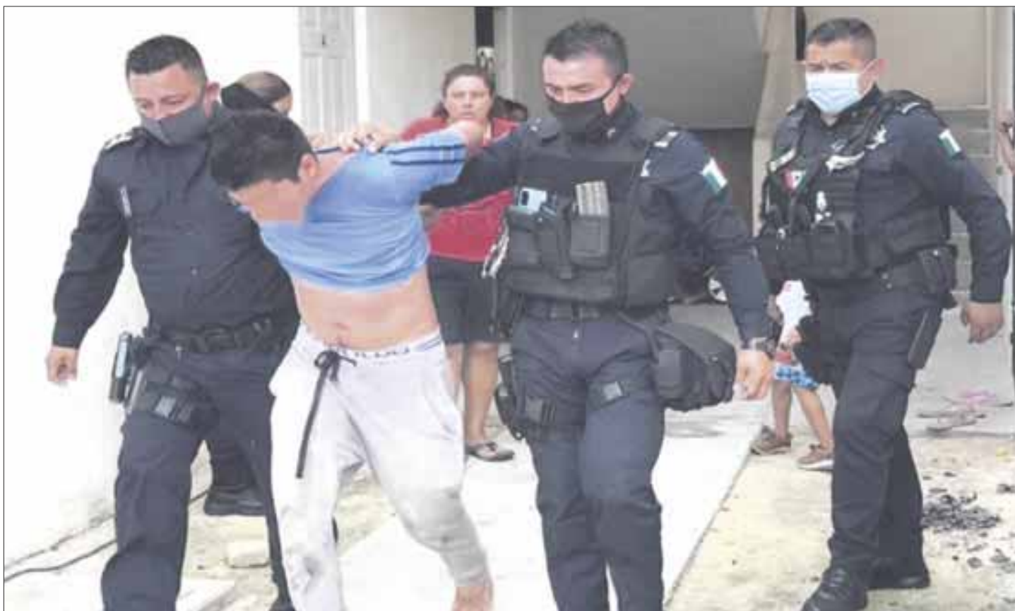
Un ratero estuvo a punto de ser linchado por los vecinos, luego de entrar a robar en un domicilio de la región 255 manzana 56.

Una vez capturado por los propios pobladores de la zona, no esperaron la presencia policiaca y prefirieron hacer justicia por su propia mano, a fin de advertir al amante de lo ajeno a base de golpes, que no regresara al lugar, empero al percatarse algunos que los ánimos se estaban caldeando prefirieron intervenir para entregarlo a los policías.