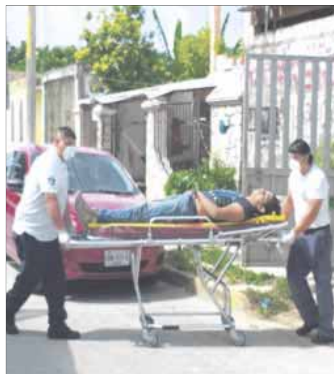
En la Región 101, ejecutaron a un joven y hieren a otro en un taller de herrería, ubicado en la manzana 37.