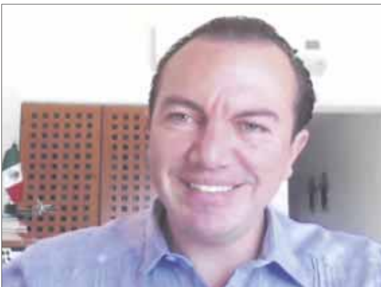
El coordinador general de comunicación y vocero del gobierno del estado, Carlos Orvañanos Rea, explicó que el nuevo servicio será atendido por personal capacitado.

Cancún. – Para que la gente tenga más oportunidades de salir adelante ante el contagio por covid-19, el gobierno del estado que encabeza Carlos Joaquín puso en servicio el número telefónico 998 416 0333, estrictamente enfocado hacia el tema del coronavirus.