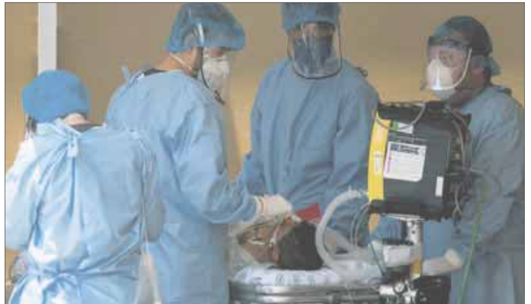
Con los 52 nuevos casos, se llegó a la cifra de 7 mil 270 casos positivos acumulados y con 16 muertos más, ahora son 946 defunciones relacionadas al Covid-19.

Ahora bien, si a los 7,270 positivos acumulados, les restamos las 946 defunciones y los 3399 recuperados reportados hasta ayer, encontramos que son 2925 casos "activos" en toda la entidad, 94 casos menos que el día anterior.