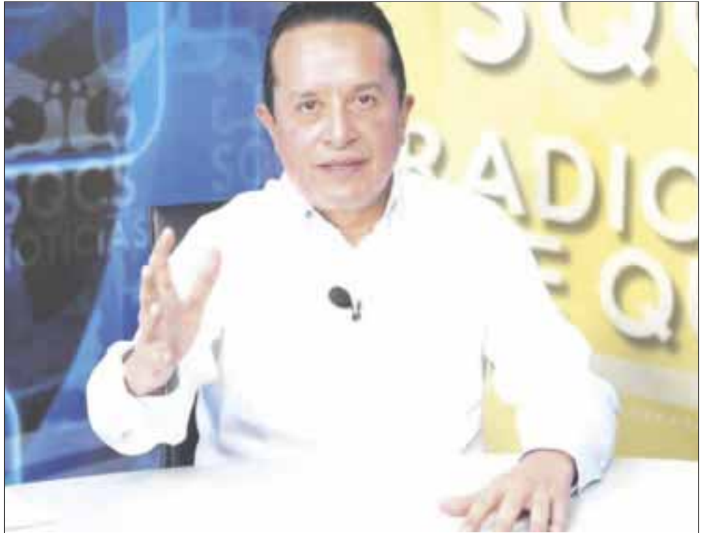
El gobernador Carlos Joaquín pidió mantener los esquemas de prevención y de salvar vidas, y evitar mayores riesgos de contagio por Covid-19.

El mandatario estatal participó mediante un enlace virtual, en la ceremonia de entrega de la recertificación de playas Blue Flag de Isla Mujeres.