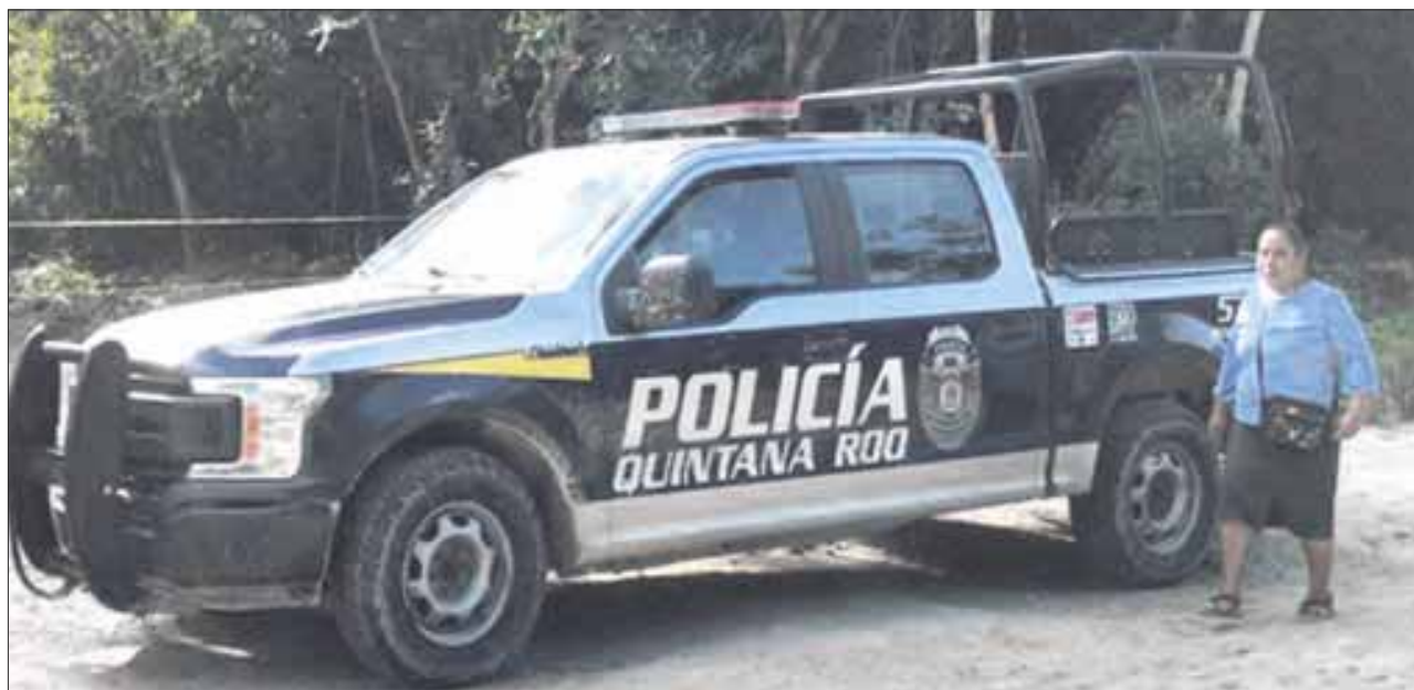
Encuentran el cuerpo de un sujeto degollado, atado de pies y manos en un área verde de la colonia Tres Reyes.

La Policía Ministerial llegó al sitio para luego ordenar el levantamiento del cuerpo y enviarlo al Servicio Médico Forense para las diligencias de rigor.