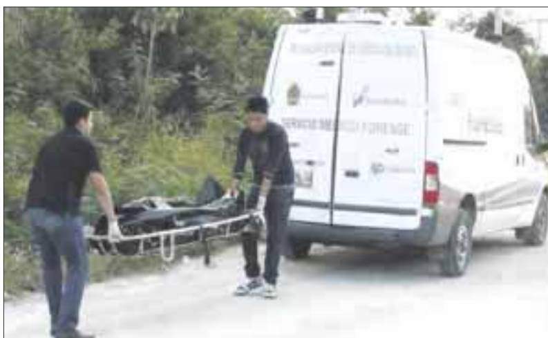
Un cubano fue asesinado con saña cuando cuidaba un predio cercano al asentamiento kilómetro 55 de Mahahual.

De acuerdo a la versión del dueño del inmueble, la tarde del martes tuvo contacto vía Whatsapp con el fallecido y le reportó todo estaba bien. Empero durante la noche le informaron del crimen. Hasta el momento, no se tiene más información al respecto, y el cuerpo quedó en manos del personal del Servicio Médico Forense (Semefó) para el procedimiento de rigor.