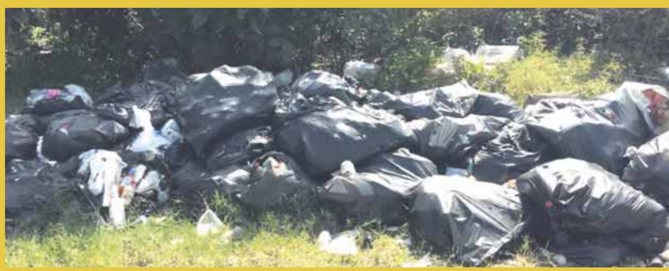
En Nizuc también han reportado la presencia de decenas de bolsas negras atiborradas de basura, sin que acudan a limpiar.

Diversas cámaras empresariales se han manifestado ante la contaminación que genera la acumulación de residuos sólidos no recolectados, pues los gases, líquidos y bacterias que se desprenden de la basura se convierten en un riesgo para la salud de la población y para el medio ambiente. "Ambos son derechos protegidos y estipulados en el Artículo 4 de la Constitución Política de los Estados Unidos Mexicanos, y los cuales se teme que sean transgredidos al no efectuar un servicio que es de prioridad en todos los sectores de la población", escriben en un comunicado.