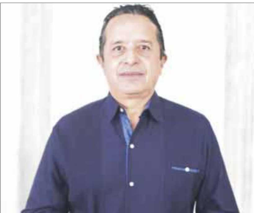
Carlos Joaquín envió un mensaje a las y los solidarenses, en ocasión del 27 aniversario de la creación del municipio de Solidaridad.

Playa del Carmen.- “Solidaridad, junto a Quintana Roo, tiene que caminar por el sendero de las realidades. Sólo así podrá recuperar su dinamismo económico y retomar su actividad turística”, expresó el gobernador Carlos Joaquín, en un mensaje que dirigió a las y los solidarenses, en ocasión del 27 aniversario de la creación del municipio de Solidaridad.