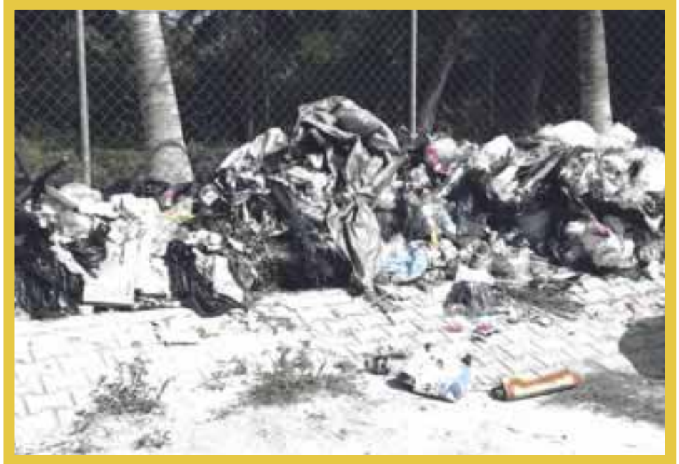
La empresa Inteligencia México S.A. de C.V. cuenta con la concesión para realizar el trabajo de recoja de basura en Cancún, no obstante, su servicio deja mucho que desear.

Hoteleros y restauranteros pagan, pero la concesionaria no cumple