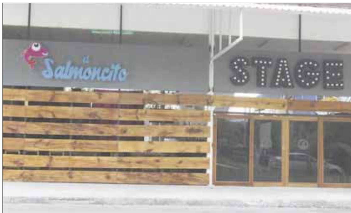
Dueños de restaurantes, bares y similares arrastran hoy deudas de hasta 144 millones de pesos en Chetumal.

Al respecto, dijo que en estos últimos días han recibido llamadas desde un número telefónico de Guadalajara, intentando intimidarlos para que hagan un depósito en alguna tienda de conveniencia a un número de cuenta, de lo contrario procederían a su localización para hacerle daño e incluso a sus familiares.