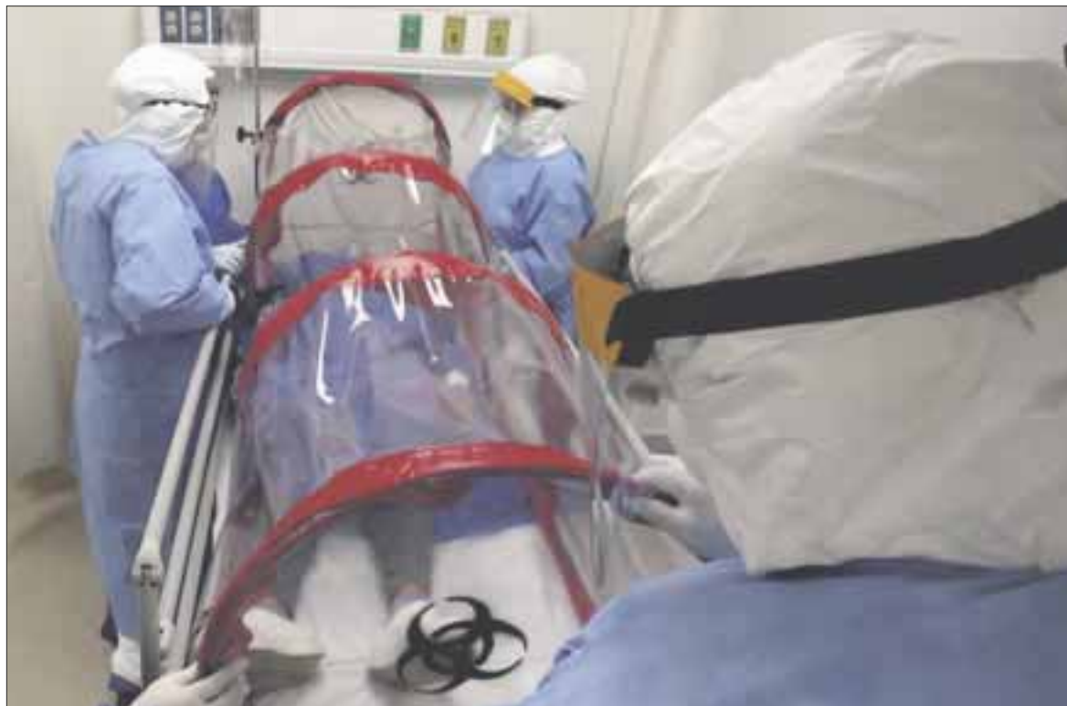
Hasta el mediodía de ayer se habían notificado 7 mil 405 casos positivos y con otros 17 muertos, un total de 963 defunciones.

Asimismo, si aplicamos la fórmula que proporcionó Alejandra Aguirre Crespo y a los 7 mil 405 casos positivos les restamos los 3535 recuperados y las 963 defunciones, encontramos que hasta ayer había en toda la entidad 2907 casos activos, es decir, 18 menos que el día anterior.