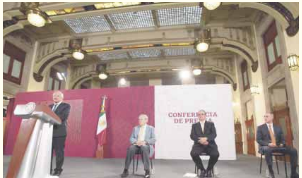
Entre otras cosas , BOA tiene en su Plan de acciones: acordar con dirigencias nacionales del PAN PRI MC PRD y organizaciones afines, la postulación de candidatos únicos de mayor rentabilidad.

Cabildeo del bloque opositor en Washington Casa Blanca y Ca-