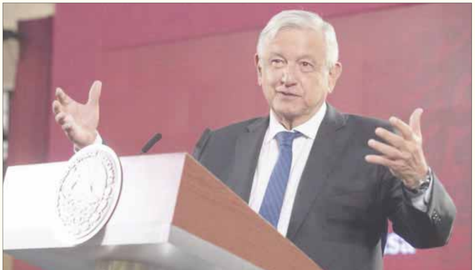
Andrés Manuel López Obrador; entre las acusaciones, señala a influencers de redes sociales, ex presidentes y medios.

El plan, indica el documento, tiene como objetivo promover el desplazamiento de Morena de la Cámara de Diputados en 2021 y