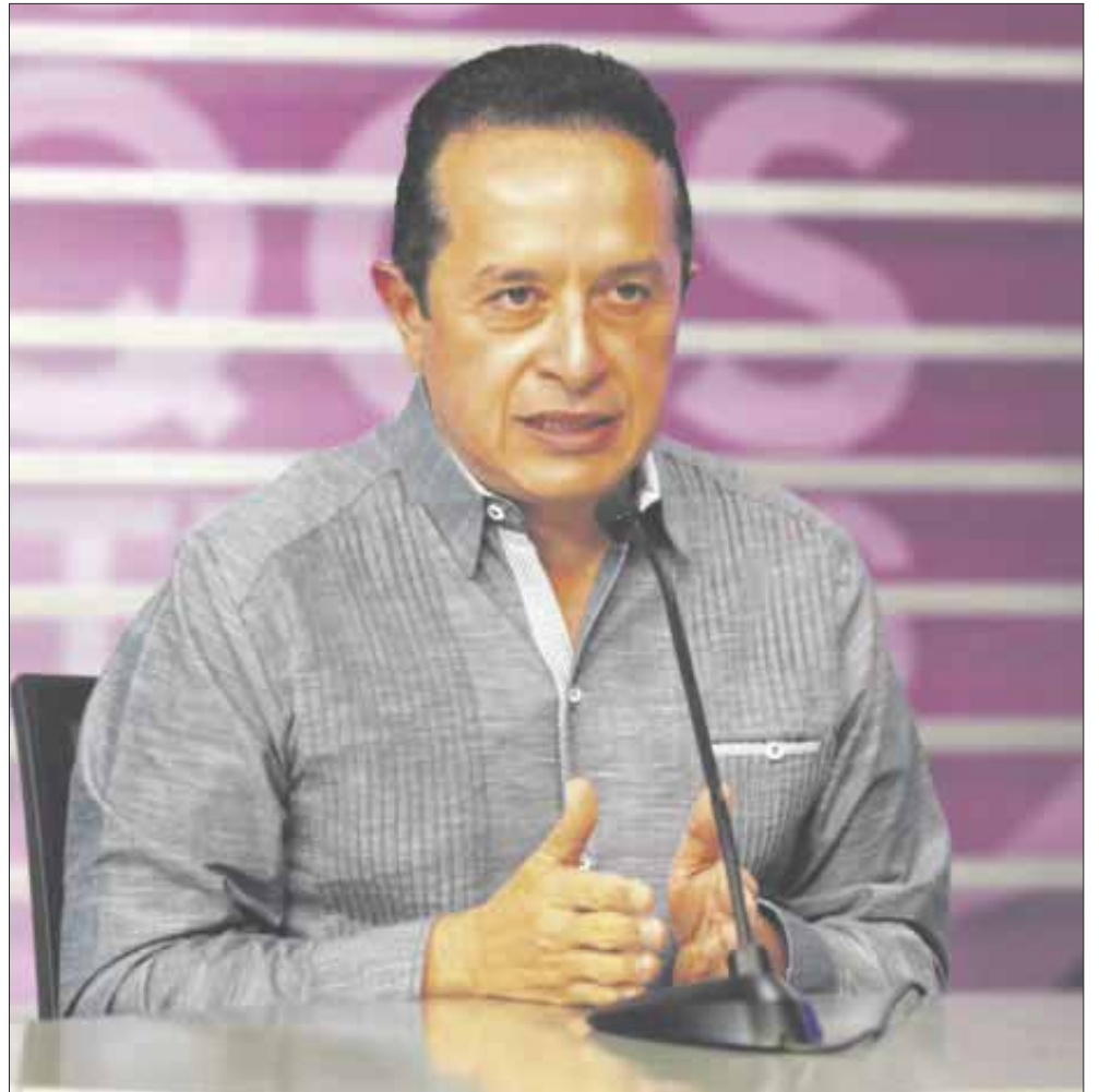
Carlos Joaquín expresó que el retorno gradual a las actividades no significa regresar a lo que conocíamos.

El gobernador de Quintana Roo añadió que el plan Reactivemos Quintana Roo contiene la estrategia de cómo funciona y en qué porcentajes debemos actuar todos los días, dependiendo del color del semáforo que se tenga.