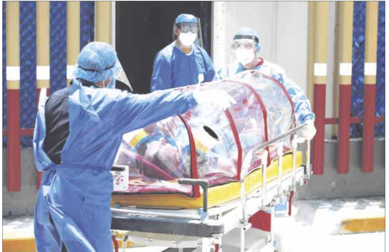
Autoridades sanitarias estatales reportan que hasta ayer había 2 mil 235 casos positivos de Covid-19 en Quintana Roo, es decir, 41 más que el día anterior.

Por su parte, Solidaridad, cuenta con 349 positivos, dos más que el día anterior. El número de defunciones se mantuvo en 58, al igual que el día anterior. En esta demarcación, 202 personas han sido dadas de alta.