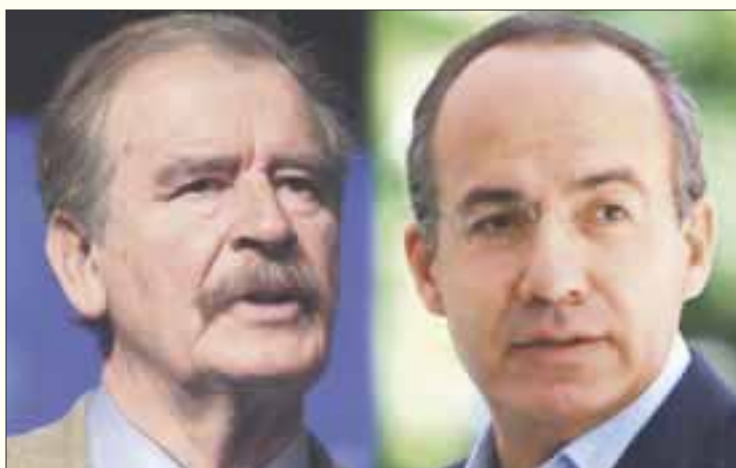
Los ex presidentes que figuran en el documento como partícipes del BOA son: Vicente Fox y Felipe Calderón, al igual que partidos y redes sociales vinculadas a ellos.

Por otro lado, integrar un bloque opositor amplio (BOA) en el que participarán PAN, PRI, PRD, MC, partidos emergentes como México libre, gobernadores, alcaldes, grupos empresariales locales, medios de comunicación y comunicadores afines,