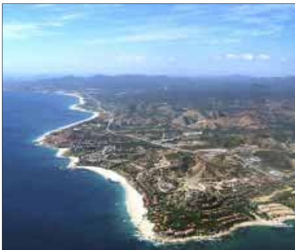
Los Cabos primer destino del Pacífico en recibir el Sello de Viaje Seguro.

victoriagprado@gmail.com Twitter: @victoriagprado