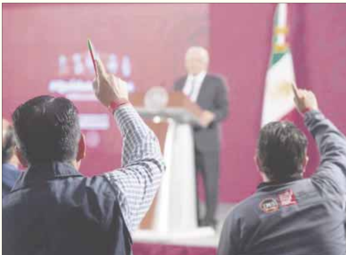
El discurso del bloque opositor se centra en dos ejes: desempleo e inseguridad, en responsabilizar a la presidencia de AMLO y a la 4T del ahondamiento en estos dos males del país.

Washington, fondos de inversión, Corporativos incorporados al TMec, corresponsales extranjeros en México”