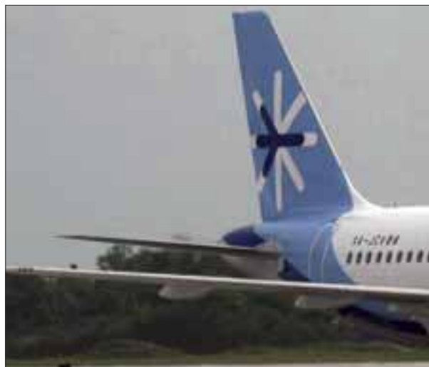
La aerolínea continúa transportando personal médico e insumos gratis.