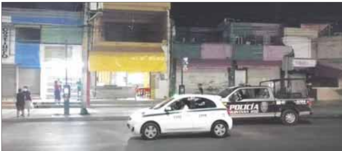
Balean a Fabiola “N” de 19 años y a Enrique “N” de 31 años, en el restaurante El Poblano, sobre la avenida López Portillo, y detienen al presunto asesino, quien resultó ser menor de edad.

Cancún.- Balean a Fabiola “N” de 19 años y a Enrique “N” de 31 años, en el restaurante y taquería El Poblano, ubicado en la zona del Crucero, sobre la avenida López Portillo, y detienen al presunto asesino con el arma en su poder, quien resultó ser un menor de edad.