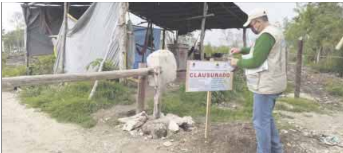
En los predios se llevaban a cabo actividades y obras sin contar con las debidas autorizaciones de la autoridad competente.

Mahahual.— La Procuraduría de Protección al Ambiente del Estado de Quintana Roo (PPA) realizó dos visitas de inspección determinando la clausura de dos predios en la localidad de Mahahual perteneciente al Municipio de Othón P. Blanco, en donde se llevaban a cabo actividades y obras sin contar con las debidas autorizaciones.