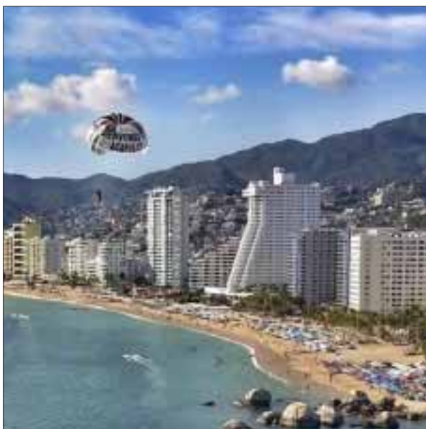
Hermosa vista de la zona hotelera de Acapulco.

victoriagprado@gmail.com Twitter: @victoriagprado