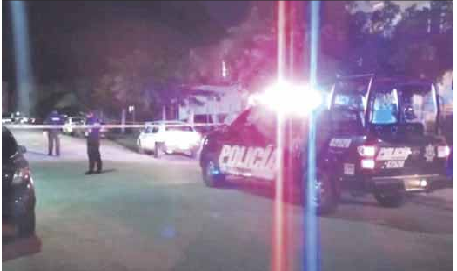
Un hombre fue ejecutado en la colonia “Villas del Sol”, por sujetos que lo remataron, al constatar que sobrevivió un primer ataque.

Los presuntos moto-sicarios, cobijados en la obscuridad de la noche, huyeron y ya no se sabe nada de ellos, según datos de vecinos del lugar, ya que al momento se desconoce el móvil del homicidio y los policías locales no reportaron detenciones.