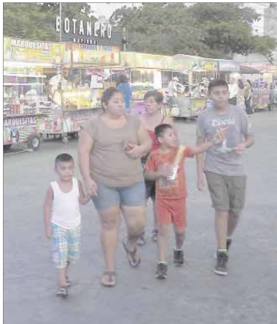
En Quintana Roo mucha gente piensa que el coronavirus no existe

Las autoridades sanitarias dieron a conocer que hasta ayer a mediodía se tenía un reporte de 2,906 contagios por Covid-19 en Quintana Roo; es decir, que en 24 horas se sumaron a la lista 51 nuevos casos, mientras que el número de decesos aumentó a 513.