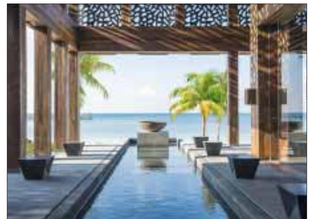
Listo para recibir a los viajeros.

☆☆☆☆☆ JW Marriott Cancun Resort & Spa y Marriott Cancún Resort & Spa que recibieron el Sello Safe Travels del World Travel and Tourism Council (WTTC). El sello permite a los viajeros identificar destinos y negocios en todo el mundo que adoptaron protocolos globales de salud e higiene recomendados por la organización para que los viajeros disfruten de viaje seguro.