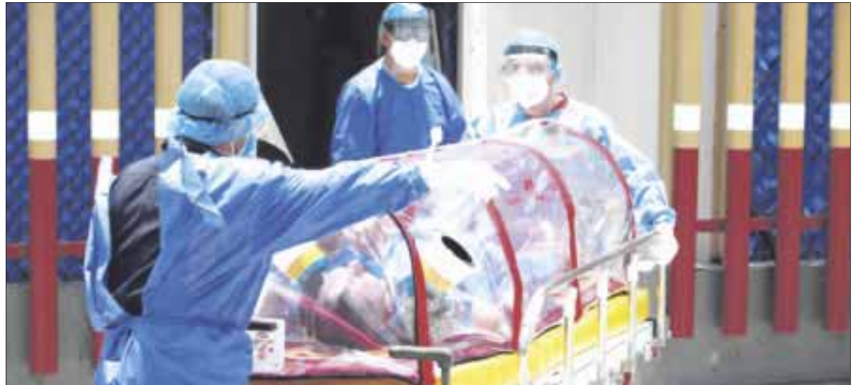
Las autoridades sanitarias dieron a conocer que hasta ayer al mediodía se tenía un reporte de 2906 contagios por Covid-19 en Quintana Roo.

Hay que recordar que a partir de hoy, se empareja el semáforo epidemiológico de Quintana Roo a un solo color, que será el naranja, tanto en la zona norte, como en la zona sur.