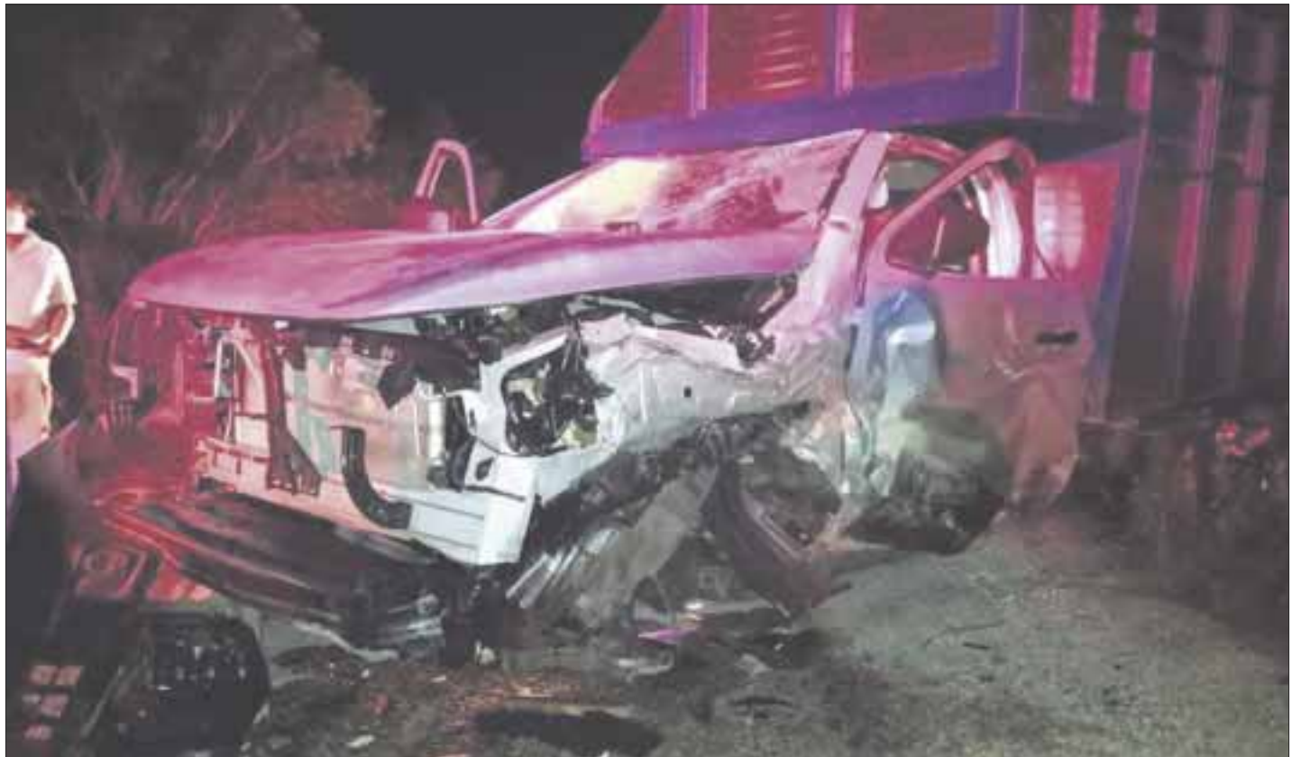
El chofer fue chocado en el lado frontal izquierdo de su camioneta Nissan de redilas por una unidad tipo Stratus, cuyo conductor huyó del lugar.

Los Bomberos de Tulum arribaron al lugar y desconectaron la batería de la camioneta para evitar algún corto y se pudiera provocar algún fuego, ya que el choque provocó que se derramara líquidos del vehículo Nissan. Acudieron a la llamada de auxilio elementos de Bomberos, Cruz Roja y Protección Civil de Tulum, que luego de la atención de las dos personas, los vehículos fueron remolcados al corralón.