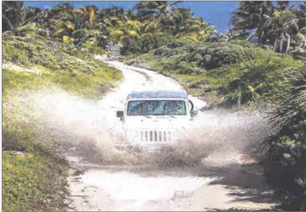
La caza dentro de Sian Ka'an está prohibida y es considerada un delito federal.

Felipe Carrillo Puerto.- Autoridades de la Reserva de la Biosfera de Sian Ka'an dieron a conocer que han presentado siete denuncias formales por la caza ilegal dentro del Área Natural Protegida (ANP) ya que esto representa una seria afectación al ecosistema silvestre.