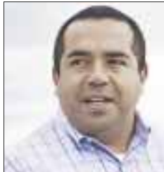
Por José Antonio López Sosa

Con profunda pena observo que vivimos en una sociedad ignorante e irresponsable, tal como lo señala el título de esta columna. Nos enganamos con rumores, desacreditamos toda información seria y tomamos decisiones primitivas, como si todos estos siglos de gestar una convivencia social no nos hubiesen enseñado nada.