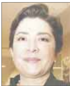
Por Guillermina Gómora Ordóñez

www.lopezsosa.com joseantonio @lopezsosa.com twitter: @joseantonio1977