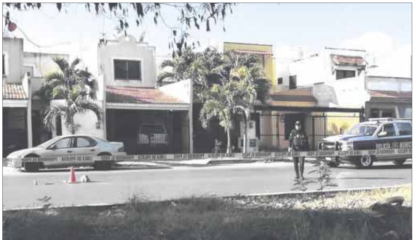
El enfrentamiento se registró en la Supermanzana 525 del Fraccionamiento Gran Santa Fe.

Tampoco se puntualizó cuantas personas participaron en el ataque, de modo que no se sabe cuantas se dieron a la fuga.