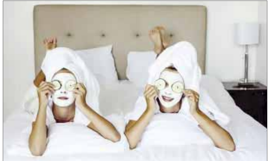
Mascarilla de yogurt, pepino y miel.