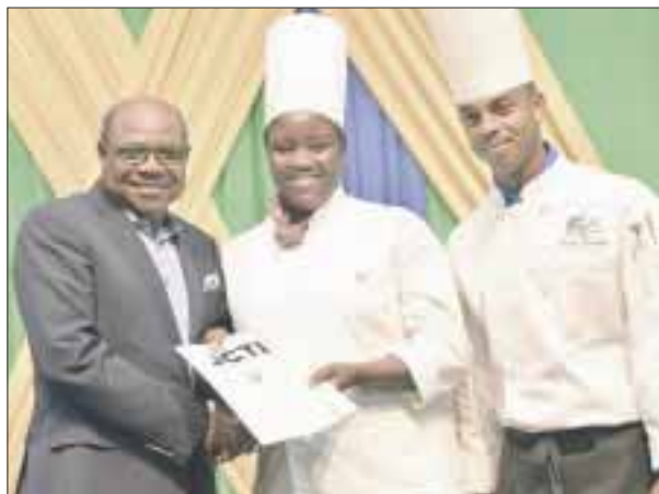
Jamaica lanza programa gratuito de capacitación.