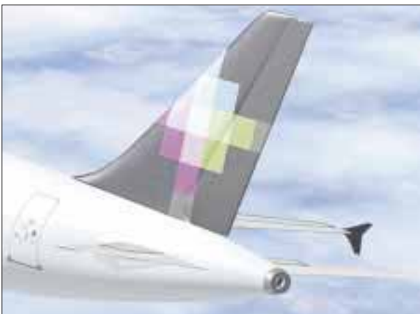
La aerolínea y empresa de seguros unieron esfuerzos.

victoriagprado@gmail.com Twitter: @victoriagprado