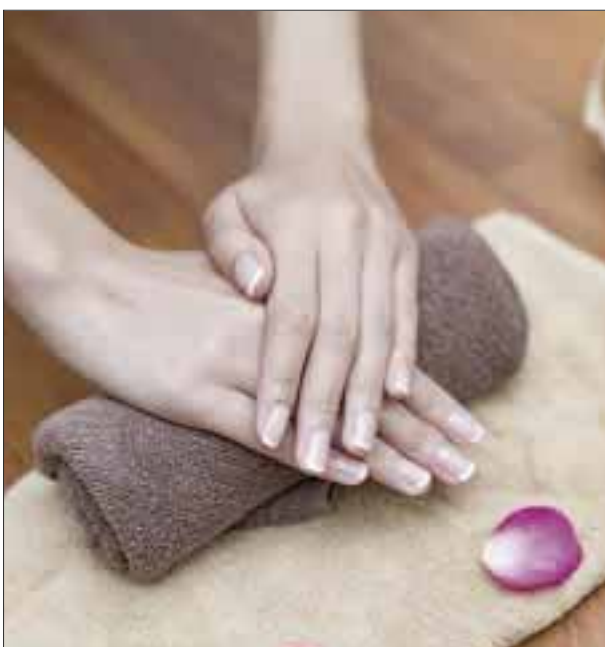
En las manos puedes darte leves masajes.

Consiéntanse mucho al menos por un día. El mundo fitness no solo es ejercicios, también necesitamos relajarnos y cuidar nuestra piel para lucir siempre radiantes.