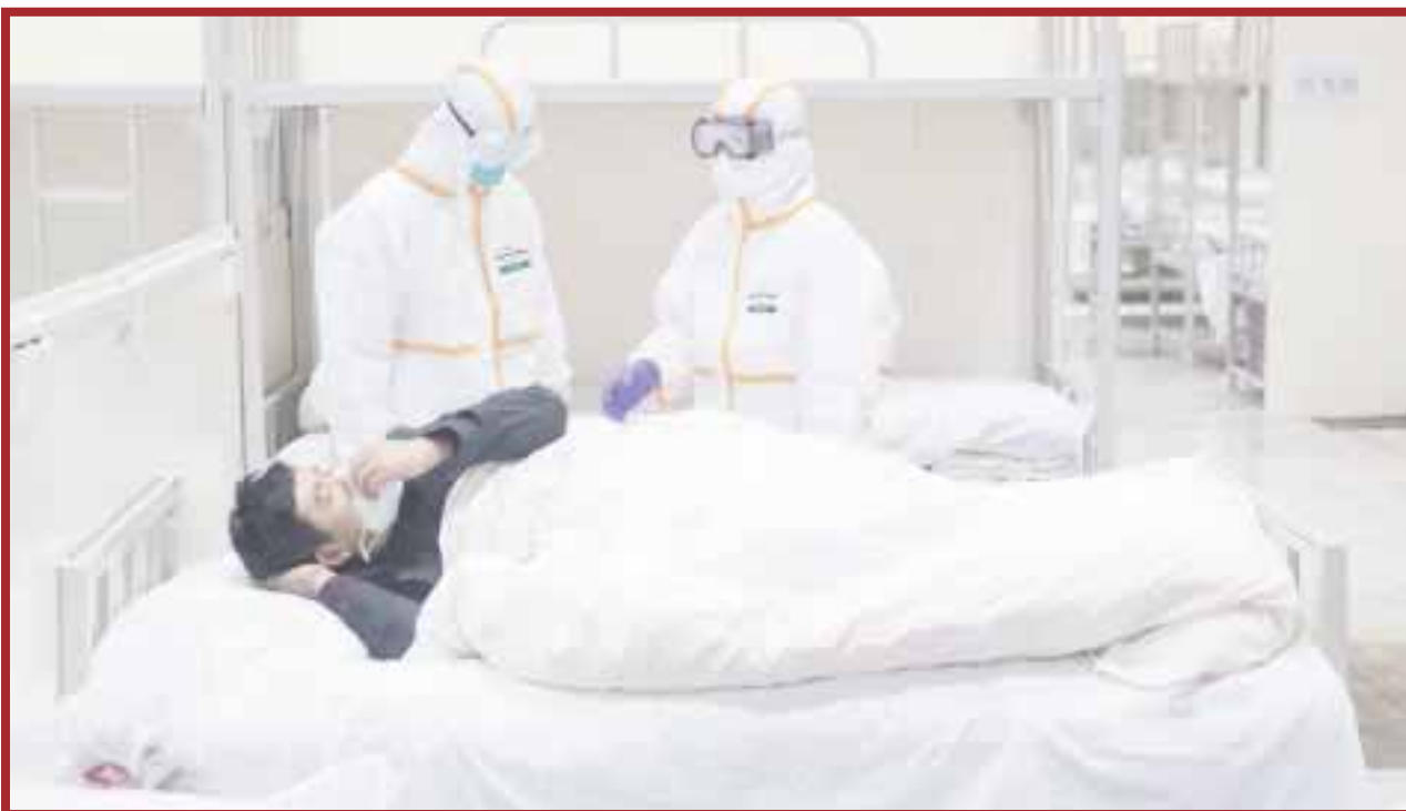
Los contagios por coronavirus avanzan en Quintana Roo, donde se han registrado 788 casos confirmados, con 116 defunciones.

Chetumal.- Los contagios por Covid-19 avanzan sin tregua en Quintana Roo y es que como habían predicho las autoridades, durante la Fase 3 de la contingencia se vivirá una etapa crítica y tan solo en la entidad se llegó a los 788 casos positivos confirmados, con 116 defunciones, de las cuales, siete ocurrieron en las últimas 24 horas.