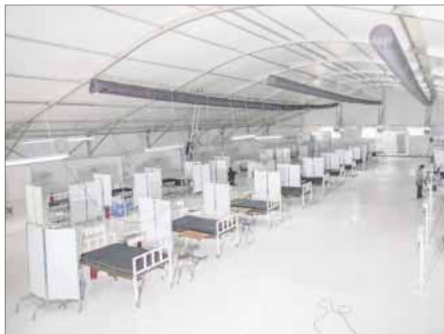
Entregan el primero de tres hospitales móviles Covid-19, está a un costado del Hospital General de Cancún Jesús Kumate Rodríguez.

La reconversión y ampliación de la infraestructura hospitalaria, es parte importante para atender de manera particular a pacientes con Covid-19