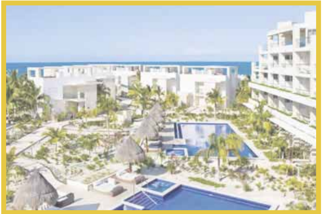
Debido a la contingencia sanitaria, más de 40 mil habitaciones de hotel en Cancún se encuentran cerrados.

En este momento, ante la pérdida del 80% de sus operaciones diarias, desde hoy, el Aeropuerto Internacional de Cancún únicamente opera la terminal 4.