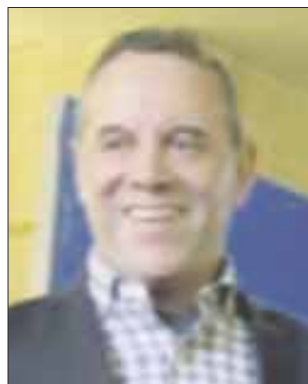
Por José Luis Montañez