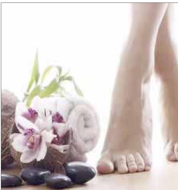
Relaja tus pies