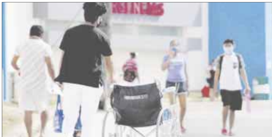
En Cancún se han denunciado brotes de coronavirus en dos hospitales públicos.

Por su parte, un enfermero de Cancún y uno de los principales denunciantes de las malas condiciones de trabajo, dijo que se contagió en el área de cirugía por la falta de material como cubrebocas y menciona que más personal médico considera que fue en ese sitio donde pacientes sanos se infectaron de Covid-19.