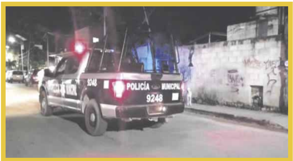
Asesinan a Angélica "N", de 40 años de edad, en la puerta de su casa, en la colonia Centro.

De acuerdo a los testigos, dos sujetos a bordo de un vehículo amenazaron a los asistentes de un convivio familiar, para posteriormente retirarse, minutos después regresaron y ante los ladridos de los perros, Angélica "N" se acercó a la entrada del domicilio, desde donde le dispararon.