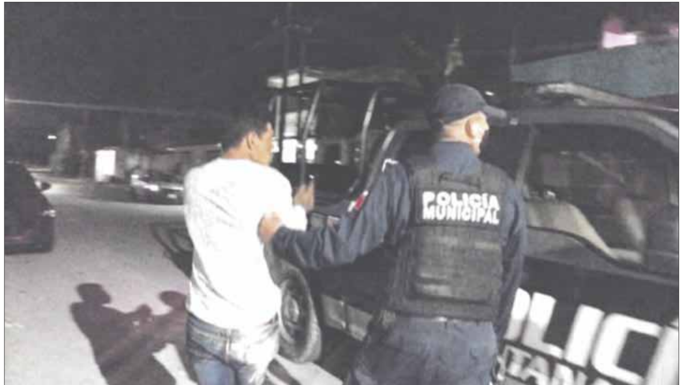
Salva la policía de ser linchado a un ladronzuelo que intentó quitarle un celular a una mujer en la Región 233.

Una vez que hicieron acto de presencia, los policías lograron calmar los ánimos de la población y le brindaron auxilio al delincuente que recibió golpes de los encolerizados pobladores para ponerlo a disposición de las autoridades correspondientes.