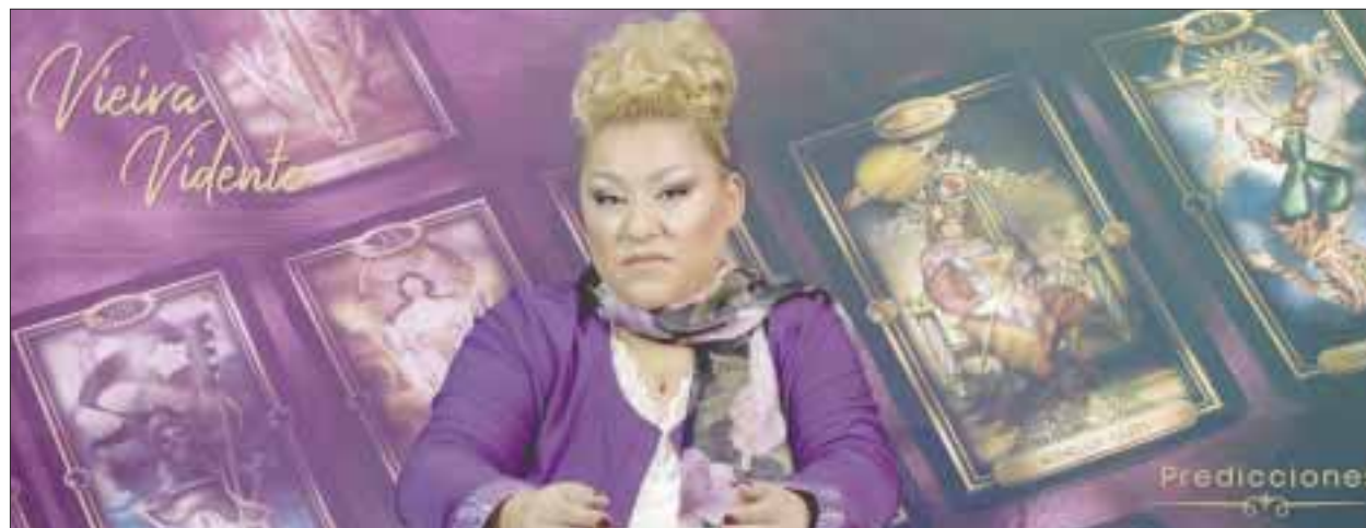
Sus predicciones mensuales son entre las más vistas en diversos países de Latinoamérica.

Vieira Videntes también es reconocida por ayudar a las personas que lo necesiten, en su trayectoria de vidente ha hecho predicciones que en muchos casos se han evitado de que sucedan desgracias muertas y muchas co-