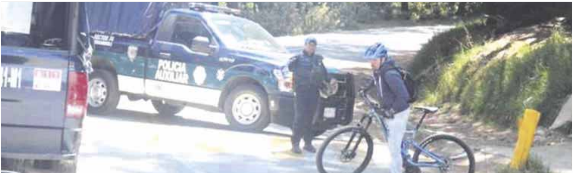
El cuerpo del ciudadano francés fue localizado sin vida en la alcaldía Tlalpan, al sur de la Ciudad de México.

Desde su desaparición, la Secretaría de Seguridad Ciudadana, en coordinación con la Fiscalía General de Justicia de la Ciudad de México y a través de la Policía de Investigación y la Fiscalía de Personas Extraviadas y Ausentes, iniciaron diversos actos de investigación orientados a la búsqueda y localización del ciudadano francés.