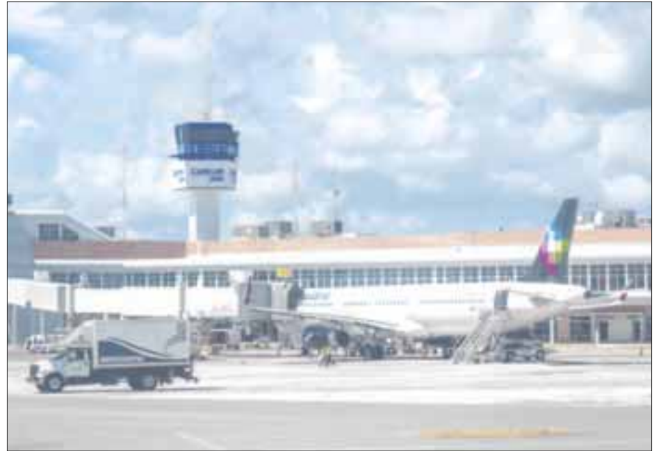
Con 396 vuelos el sábado, el Aeropuerto Internacional de Cancún registró el número de operaciones más alto desde junio pasado.

Las aerolíneas, por su parte, disminuyeron drásticamente sus operaciones, al punto que el Grupo Aeroportuario del Sureste optó por suspender operaciones en dos de sus terminales.