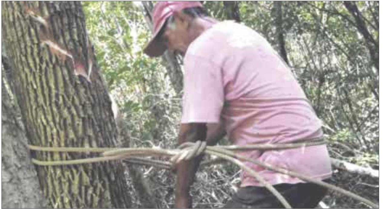
Debido a la baja demanda de látex de chicozapote y la ausencia de nuevos mercados la producción chiclera en Quintana Roo podría desaparecer.

Finalmente, dijo que por la modernización y aparte, el descubrimiento de otros productos que simulan el látex de la goma,