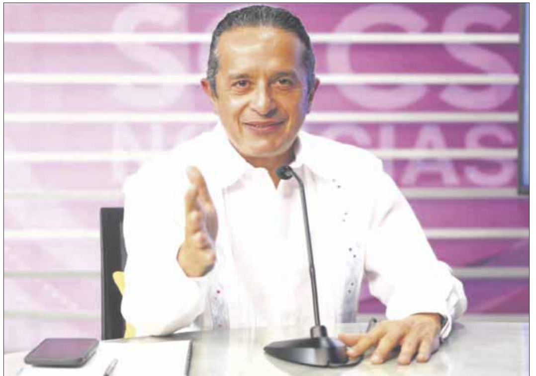
El gobernador Carlos Joaquín afirma que desde el primer día de su administración se trabaja en la disminución de la desigualdad en la Zona Sur en relación con la Zona Norte.

Asimismo, reiteró su total disposición para seguir haciendo equipo y continuar avanzando por el camino correcto, convencidos de que juntos se saldrá adelante.