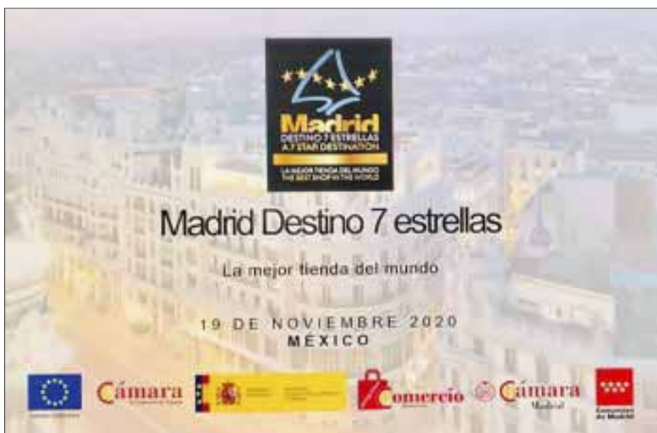
Intensa es la promoción que realiza Madrid.