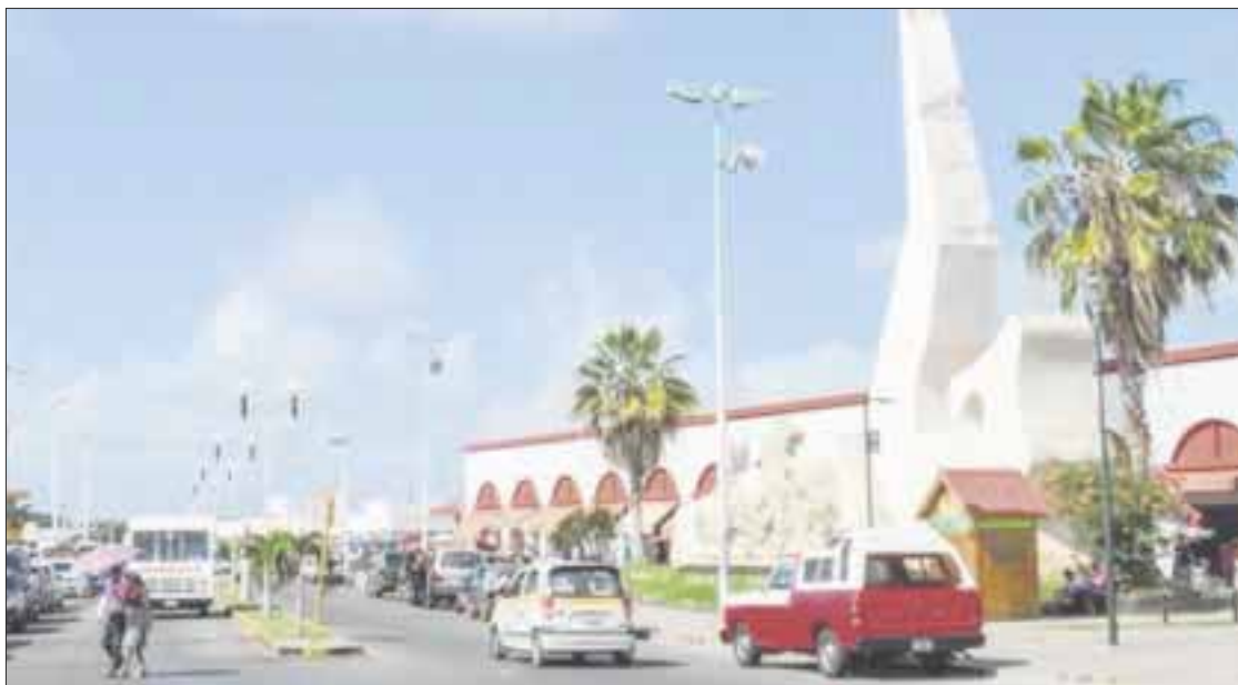
El anuncio de la zona libre para Chetumal llega en medio de una de las peores crisis económicas, reconoce el CCE.