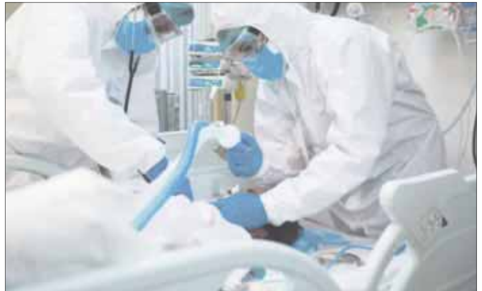
La Secretaría de Salud Estatal informó que hasta ayer había 14 mil 412 casos positivos y mil 938 defunciones relacionadas a Covid-19.

Sobre la ocupación hospitalaria, indicaron que Chetumal bajó a 10%, mientras que Bacalar permanece en 0% y Cancún bajó a 11%