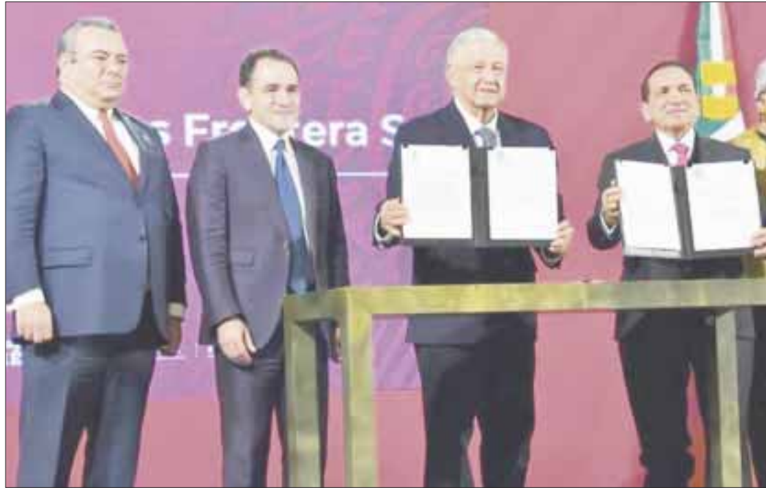
El presidente Andrés Manuel López Obrador firmó un decreto con el cual la frontera sur del país contará con una zona libre homóloga a la de la frontera norte.

sidente del CCE Chetumal declaró: “Recibimos con mucha alegría y mucha emoción la noticia de la creación de la zona libre para Chetumal y queremos reconocer la palabra cumplida del presidente con la sociedad, con el empresariado, porque este decreto nos dará herramientas para poder mirar las oportunidades que se abren a partir de este instrumento, para lograr una diversificación”.