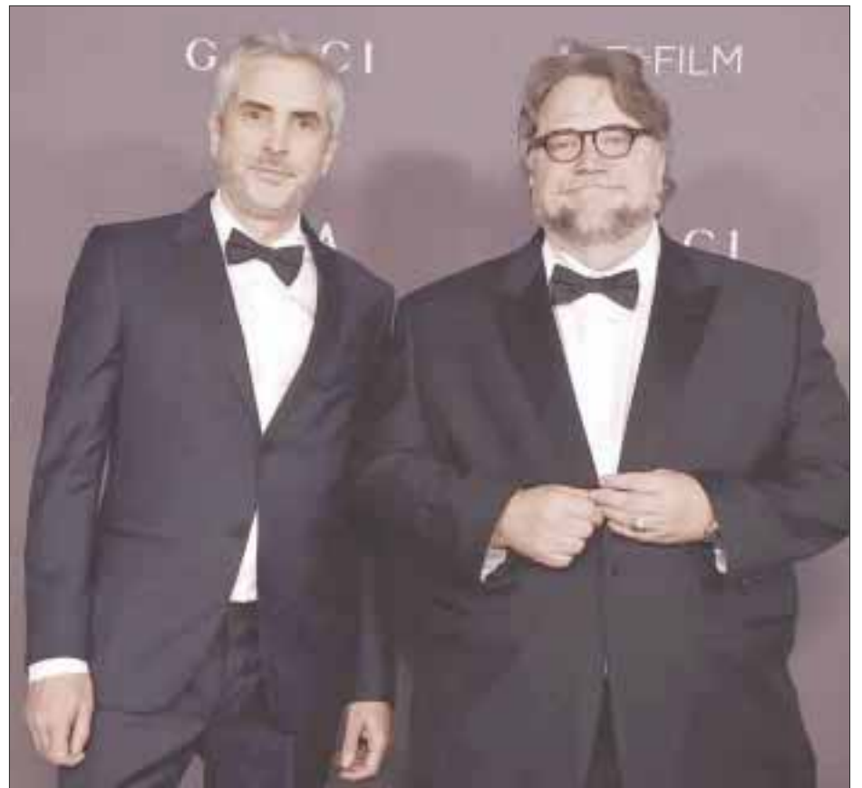
Bajo el nombre de “Monstruos y Silencios: Narrativas Para un Siglo Turbulento”, los galardonados al premio Oscar compartirán con el público sobre la cómo la realidad actual influye en sus historias y en su forma de contarlas.

“En el conversatorio hablarán de sus preocupaciones, inquietudes, sus visiones ingeniosas y esperanzadoras; además,