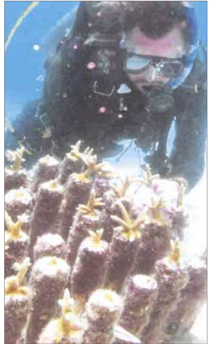
Especialistas capacitados han estado reparando colonias de coral rotas, volteadas y desplazadas en Puerto Morelos y Cancún- Isla Mujeres.

Las brigadas de respuesta están trabajando en Puerto Morelos y en Cancún-Isla Mujeres. Hay 80 personas capacitadas que han estado reparando colonias de coral rotas, volteadas y desplazadas. Ya han fijado mil 200 colonias y han rescatado y colocado en el arrecife más de seis mil fragmentos.