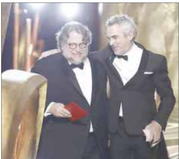
Del Toro obtuvo dos premios Oscar por “La forma del agua” en 2018, mientras que Cuarón en el 2014 por “Gravity” y 2019 por “Roma”.

Esta es una participación solidaria donde Del Toro y Cuarón no reciben ninguna retribución y donde ellos en este conversatorio pudieron fluir de una manera muy amorosa e interesante.