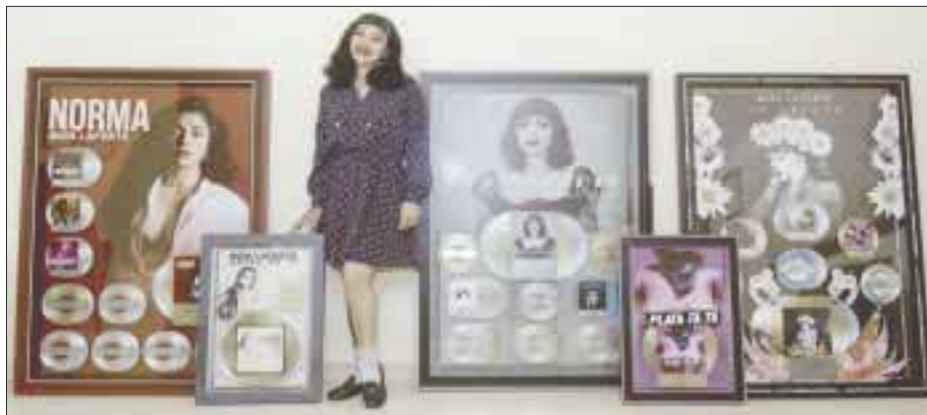
Mon Laferte recibió por parte de su sello discográfico, Universal Music, 10 Discos Platino + 3 Discos Oro

Mon Laferte grabó un concierto en vivo desde el Teatro Fru Fru de la Ciudad de México, el cual el público podrá ver a través de la plataforma Streamtime el próximo jueves 5 de noviembre a las 20:00 horas, el costo es de 199 pesos