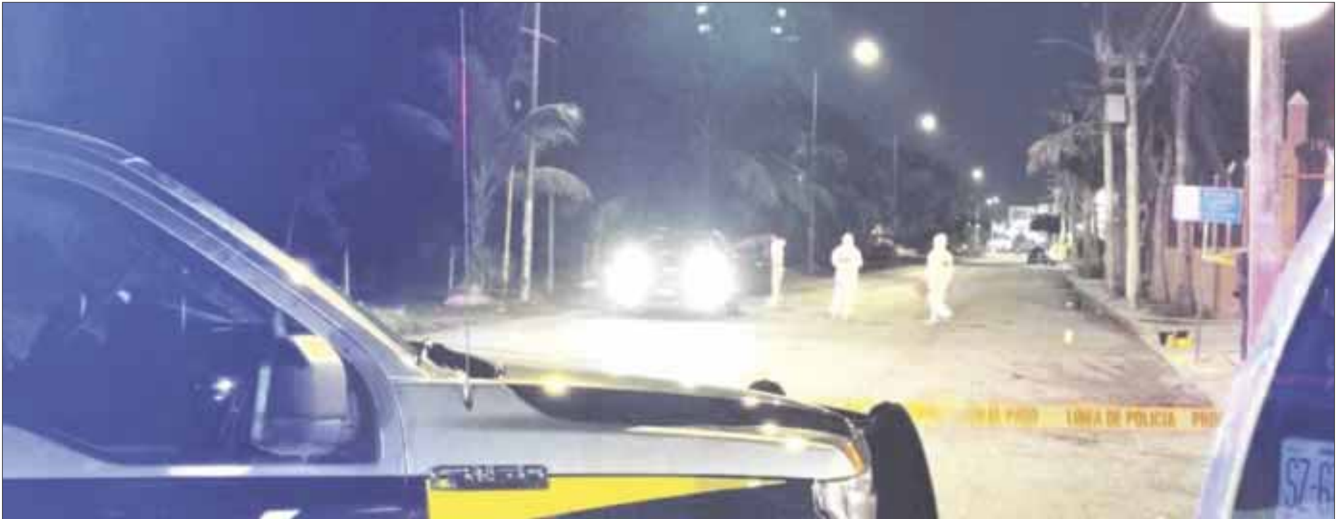
Ejecutan a sujeto de un disparo dentro de su camioneta cuando circulaba a la altura del cruce de las avenidas México y Las Torres.