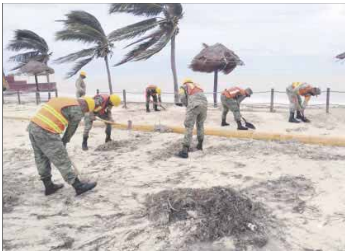
Con las acciones de la Sedena, se salvaguardó la integridad de 36,466 personas en Tabasco, Quintana Roo y Yucatán.

Con estas acciones, la Secretaría de la Defensa Nacional refrenda su compromiso y responsabilidad de servir al pueblo de México en cualquier condición y lugar, a fin de realizar actividades para proteger la integridad física de la población.