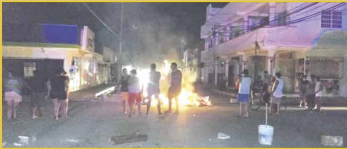
La protesta de vecinos se registró en la Supermanzana 227 en el cruce de las calles 116 con 18, donde colocaron piedras, maderas y bloques de concreto.

Realmente la problemática de recolección se ha visto afectada por los malos manejos del Ayuntamiento de Benito Juárez, Siresol y de la empresa Inteligencia México S.A. de C.V., desde el inicio de la emergencia sanitaria.