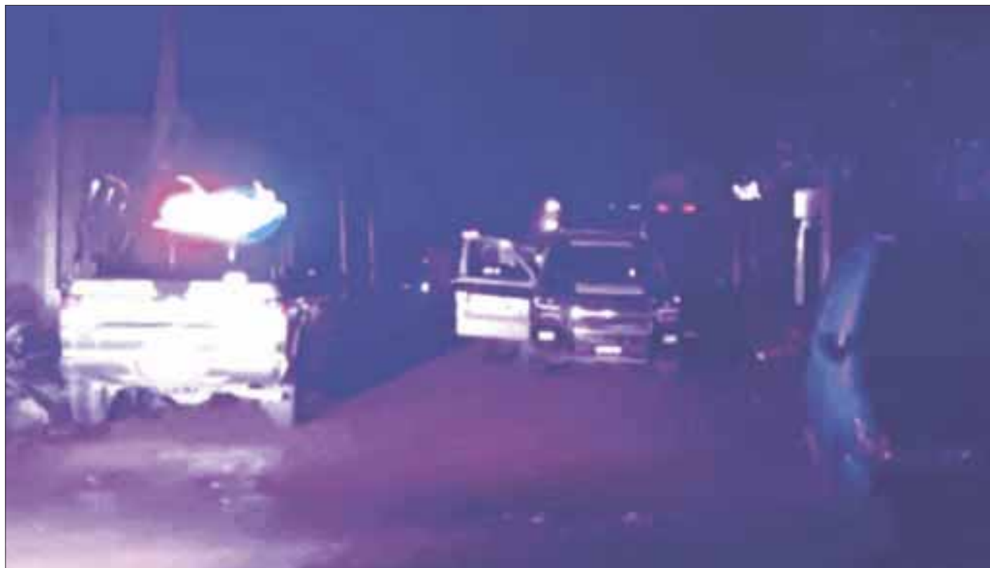
Un chofer de mototaxi fue emboscado y ejecutado a balazos en la colonia irregular Valle Verde.

A pesar de los intentos de brindarle los primeros auxilios por parte de los paramédicos el sujeto no resistió y perdió la vida, ante las múltiples heridas de gravedad que recibió en el atentado a balazos. El lugar fue acordonado y se levantó la evidencia así también se realizó la investigación correspondiente para después dejar a cargo a la Semefo del cuerpo para la autopsia de rigor, además de asegurar la unidad de la víctima y trasladarla al encierro estatal.