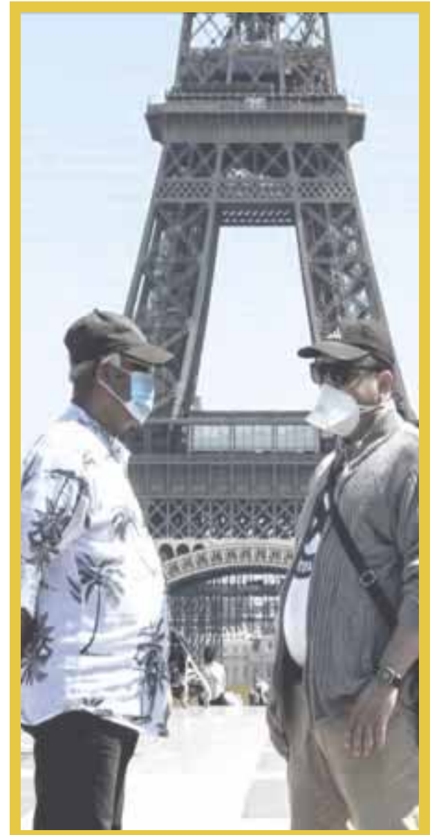
Francia vuelve al confinamiento obligatorio a partir de este viernes y hasta el próximo 1 de diciembre, tras rebrote de casos de Covid-19.

Un aumento alarmante de casos de coronavirus en Europa y Estados Unidos está borrando meses de progresos contra la pandemia en dos continentes, lo que ha orillado a nuevas restricciones a los negocios y elevado la posibilidad de nuevos encierros a gran escala y sacudiendo los mercados financieros. Wall Street se contagió del nerviosismo y terminó con fuertes bajas, en un mercado que calibra el impacto de la segunda ola de coronavirus en la economía.