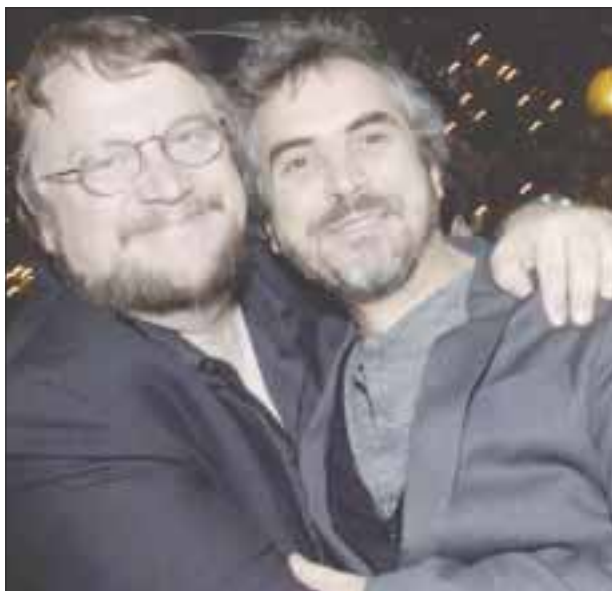
El conversatorio será a beneficio del Grupo Solidario Ubuntu AC y la Asociación Mexicana de Psicoterapia Analítica de Grupo (AMPAG).

*** Entre los temas destacará la pandemia, cine, política y por supuesto México