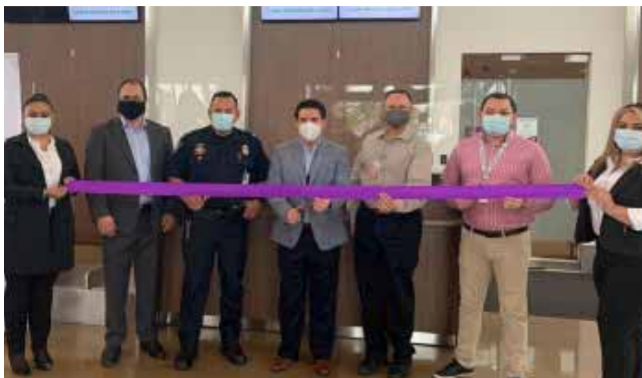
En la inauguración de módulos.

victoriagprado@gmail.com Twitter: @victoriagprado