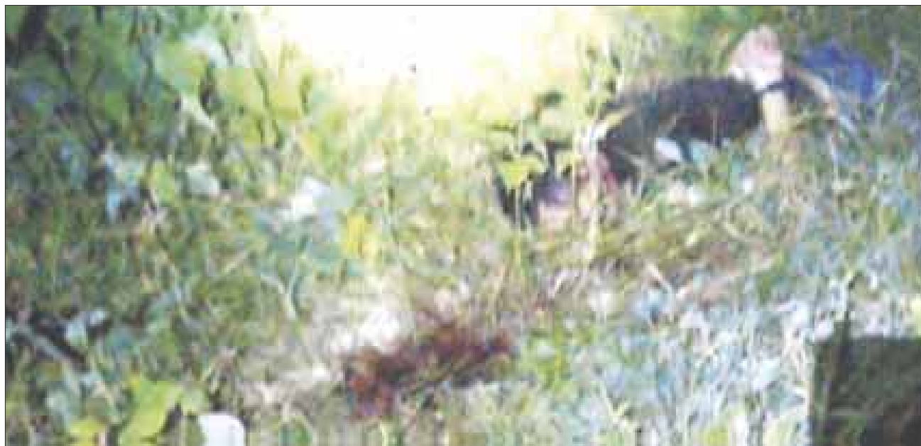
Dos personas ejecutadas encintados y maniatados fueron arrojados en una calle que divide a la Región 225 y el fraccionamiento La Selva de Cancún.

Cancún.— Dos personas ejecutadas encintados y maniatados fueron arrojados por sujetos desde una camioneta, en una calle que divide a la Región 225 y el fraccionamiento La Selva de Cancún.