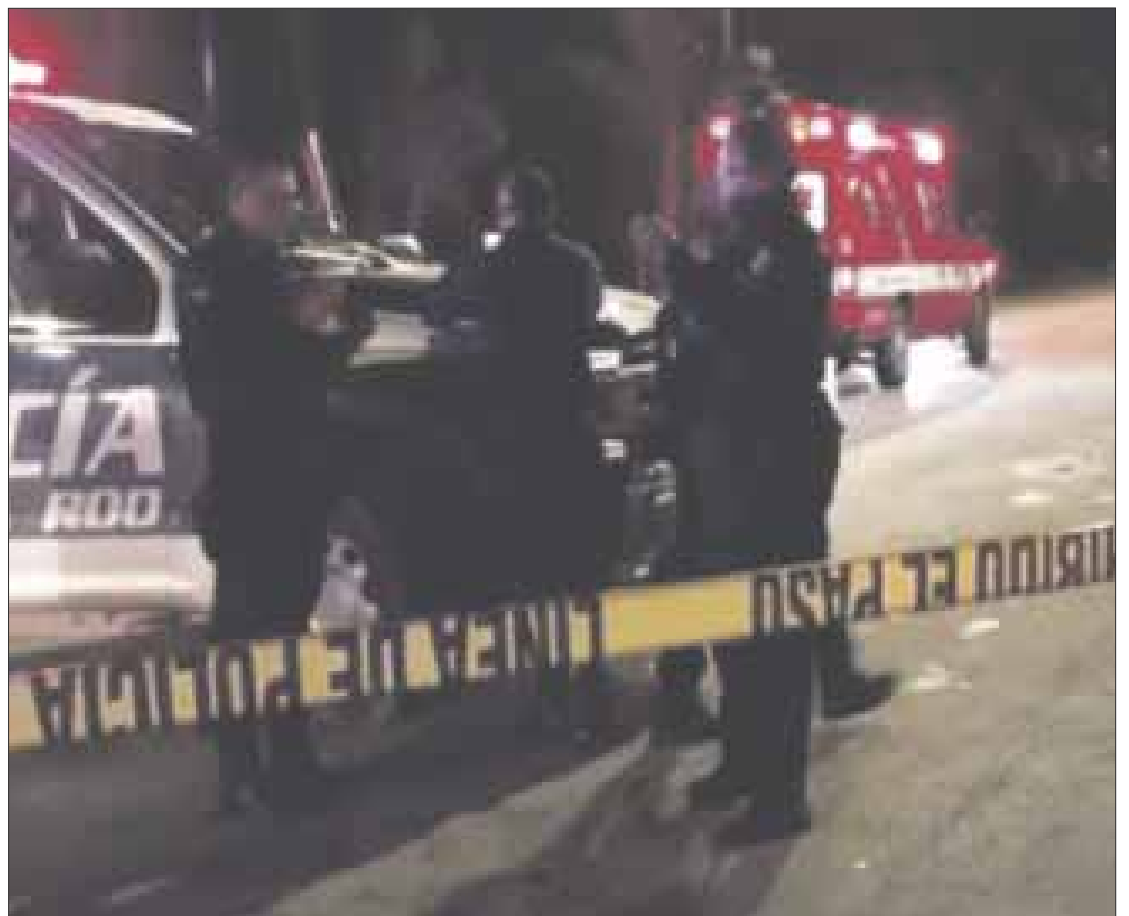
La policía y paramédicos en el lugar y confirmaron que había un hombre dentro de una camioneta Kia color negra.

Los policías acordonaron la zona, en espera de las autoridades de la Fiscalía General del Estado a fin de levantar evidencia y efectuar la investigación correspondiente para más tarde dejar el cuerpo a disposición de los elementos de la Semefo para la autopsia de rigor.