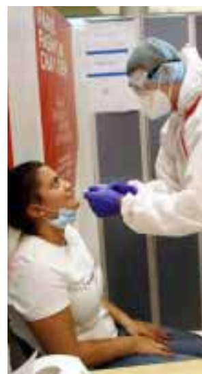
Realizar pruebas en aeropuertos.