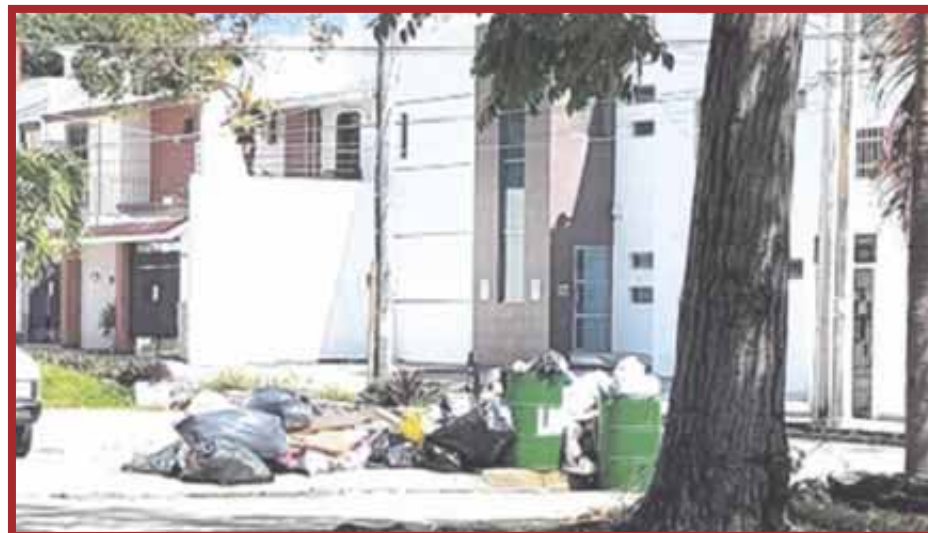
El paso de fenómenos hidrometeorológicos complica el servicio en recolección de desechos en Cancún, que se ha convertido ya en un problema de salud pública.

La problemática en la recolección y disposición final de residuos en el municipio continúa sin respuesta, pese a al millonario presupuesto con que cuenta el órgano descentralizado Siresol con 99.5 millones aprobados este 2020, sumados la presupuesto original de 324 millones, mismos que han sido ejercidos con opacidad.