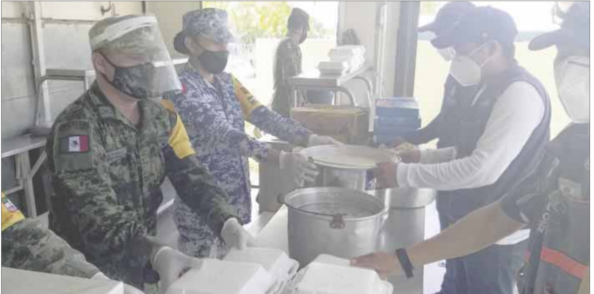
El Ejército activó desde el 6 de octubre el Plan DN-III-E, en sus tres fases: Prevención, Auxilio y Recuperación.

comunicación y remoción de árboles y ramas caídas.