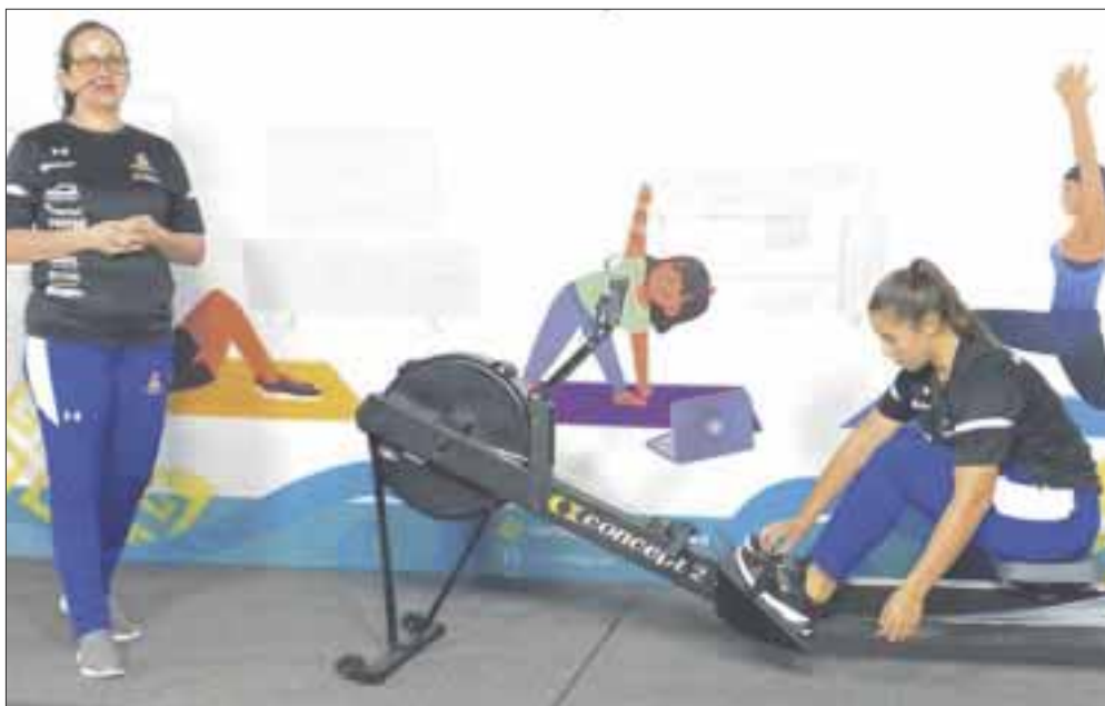
La COJUDEQ lleva a cabo acciones para el fomento de la activación física y deportiva, dirigida a toda la familia.

Chetumal.- La Comisión para la Juventud y el Deporte de Quintana Roo, a través del canal de televisión del Sistema Quintanarroense de Comunicación Social, lleva a cabo acciones para el fomento de la activación física y deportiva, dirigida a toda la familia, con el objetivo de contribuir a una mejor calidad de vida haciendo ejercicio sin necesidad de salir de casa.