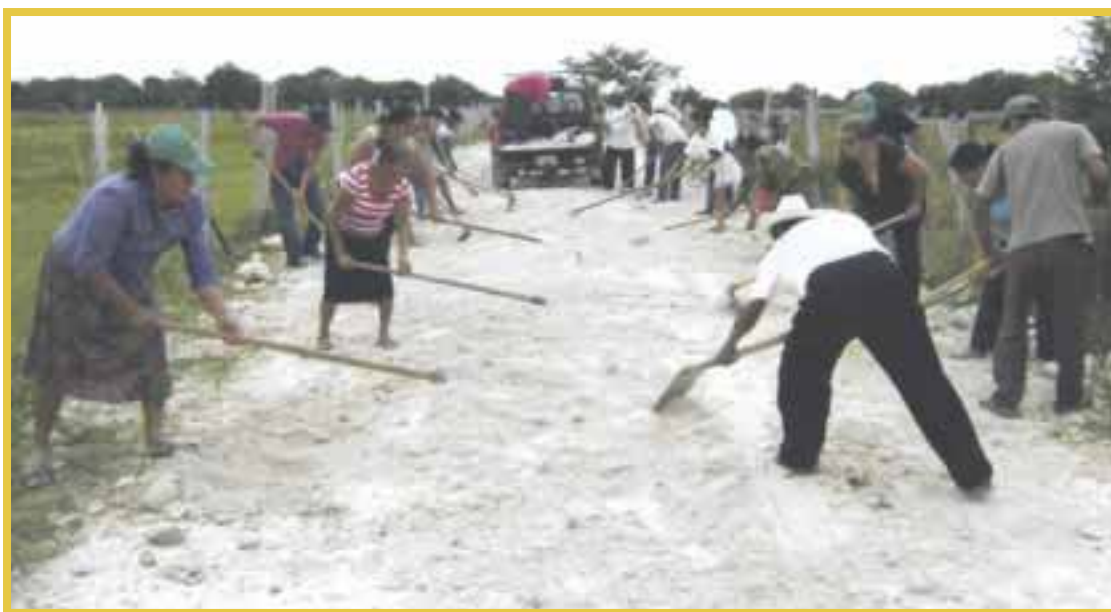
El Programa de Empleo Temporal desaparece y deja sin trabajo a personas de comunidades rurales en Bacalar.

Ahora mismo, solicitan que se retomem este tipo de programas, pues las comunidades rurales son de las más afectadas económicamente, incluso desde antes de atravesar la contingencia sanitaria de Covid-19.