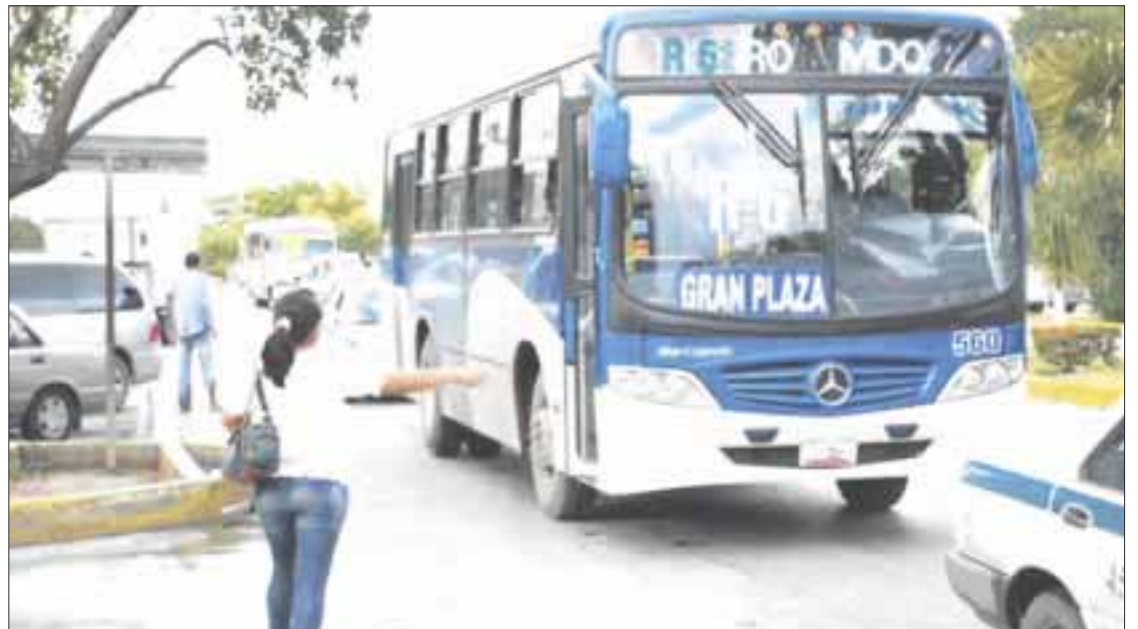
El transporte público concesionado en Cancún ha ampliado su capacidad.

Para evitar que esto se convierta en un riesgo de contagio de Covid-19, el concesionario indicó que “la población debe usar de forma adecuada el cubrebocas, deben respetar la sana distancia y cada uno de los protocolos de salud. El problema es cuando alguien no tiene cubreboca, cuando estornuda, tose o habla, las partículas van por el aire, pero si van protegidos el riesgo es mínimo,