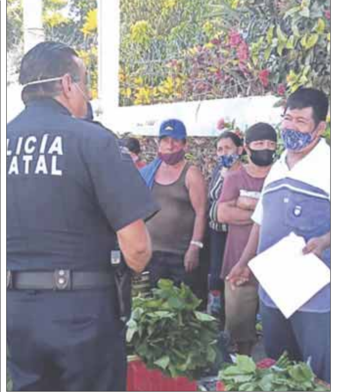
Ambulantes de las comunidades de Mayabalam y Cuchumatán se resisten a ser removidos a mercados por no respetar las medidas sanitarias.