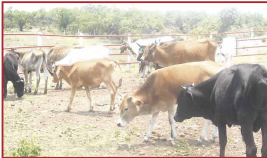
Ganaderos temen que la falta de lluvias ponga en riesgo las casi 500 mil hectáreas de pastizales de alimento que tienen para sus animales.

A partir de este mes inicia la temporada de otoño y los ganaderos tienen que prepararse pensando también en el invierno, para tener los granos forrajeros, pasto seco, zacate taiwán, sorgo, soya, maíz, entre otros. No nos puede tomar por sorpresa nada, menos en un tiempo en el que la economía está tan afectada y apenas se empieza a norma-