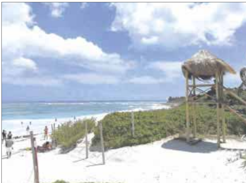
La Reserva Estatal Santuario de la Tortuga Marina Xcabel-Xcabelito abrió al público, tras 167 días de cierre por contingencia sanitaria.

Tulum.- Con la publicación del semáforo Reactivemos Quintana Roo indicando amarillo, la Reserva Estatal Santuario de la Tortuga Marina Xcabel-Xcabelito abrió al uso público, tras 167 días de cierre por contingencia sanitaria Covid-19.