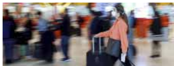
Disfruta las terapias que brinda el Spa en Cancún.