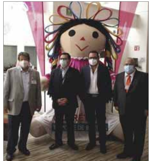
La famosa Lele ahora promueve Querétaro en el AICM.

☆☆☆☆☆ Nizuc Spa by Espa en Cancún se ha convertido en