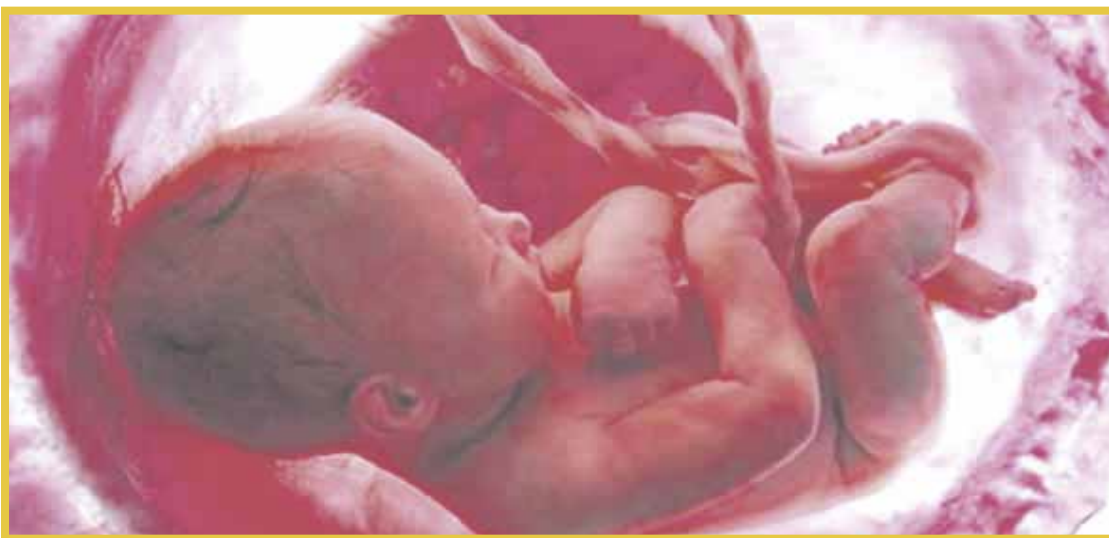
Quintana Roo se ubica entre las cinco entidades con menos defunciones fetales en lo que va de 2019.

Quintana Roo está en la posición 28 con 225 defunciones fetales el año pasado; le sigue con 168, Nayarit que ocupa el lugar 29; en la posición 30 con 156 casos se ubica Colima; Campeche con 138 se colocó en el lugar 31; y en la casilla 32 se localizó Baja California Sur, con 116. Durante 2019, en México se registraron 23 mil 868 defunciones fetales. El 83.4 por ciento de los fallecimientos ocurrieron antes del parto; un 15.4 por ciento durante el parto y en 1.2 por ciento de los asuntos, no fue especificado.