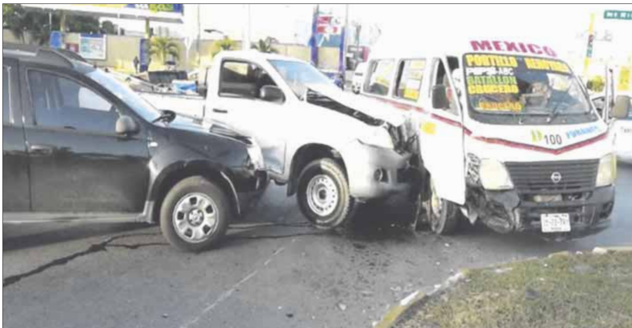
Cuatro lesionados fue el saldo de un accidente que provocó una camioneta de transporte en la avenida José López Portillo.

Cancún.— Cuatro lesionados fue el saldo de un accidente que provocó una camioneta de transporte en la avenida José López Portillo, al pasar la luz roja del semáforo en el cruce con la avenida Andrés Quintana Roo, donde los usuarios no podían salir al quedar bloqueada la puerta corrediza.