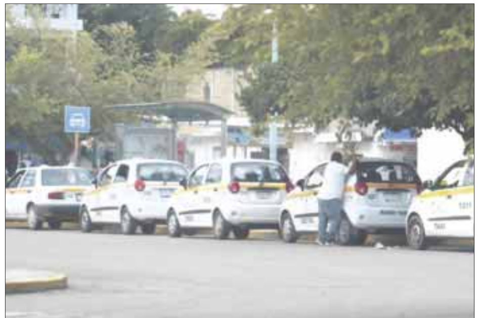
El Congreso de Q. Roo aprobó de manera unánime las reformas a la Ley de Movilidad, a fin de que los taxistas puedan heredar sus concesiones a familiares.

de Movilidad de Quintana Roo quien debía autorizar sus derechos sobre las concesiones de los titulares que han fallecido en los últimos dos años. Situación que ahora podrá ser resuelta, tras el fallo a favor de las modificaciones a la ley de movilidad en ese tenor.