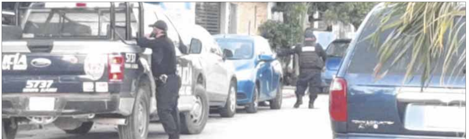
Afortunadamente la agresión armada no dejó ninguna persona lesionada.