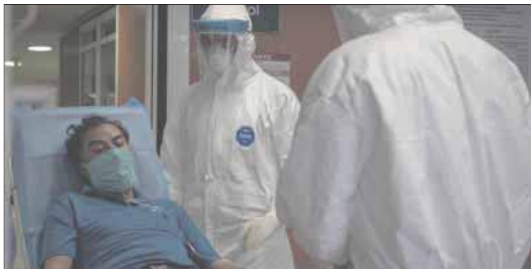
Hasta el mediodía de ayer, había 11 mil 188 casos positivos acumulados y mil 555 defunciones relacionadas al Covid-19.

Precisamente sobre la ocupación hospitalaria, reportaron que Chetumal se mantuvo en 23%, lo mismo que Bacalar en 40% y Cancún bajó a 23%. El resto de los municipios presentaron: Cozumel (29%), Felipe Carrillo (11%), Isla Mujeres (0%), José María Morelos (0%), Lázaro Cárdenas (0%), Puerto Morelos (0%) y por último Playa del Carmen (26%) y Tulum (10%).