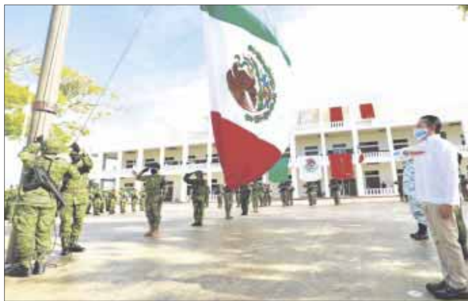
Carlos Joaquín presidió ayer la ceremonia de izamiento de la bandera nacional, en la plaza cívica de Palacio de Gobierno.