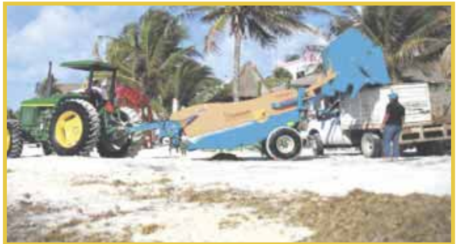
Según un reporte del Comité Técnico Asesor del sargazo en Quintana Roo, el arribo del alga este año no fue tan grave como se esperaba.

El año histórico en el arribo del sargazo fue el 2018, cuando recalieron 115 millones de toneladas. “La pregunta es si a partir de 2020 el comportamiento del sargazo va a ir hacia arriba o seguiría bajando”.