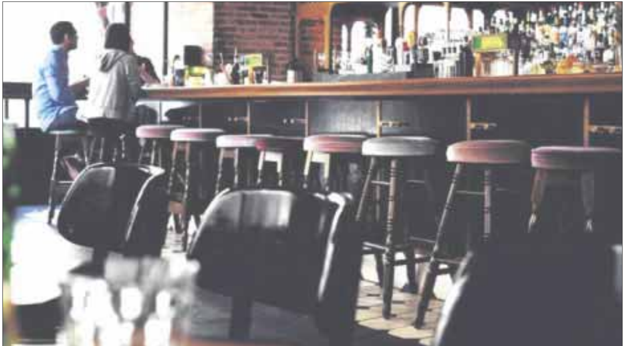
La Cofepris informó que realizará inspecciones sorpresa en 96 restaurantes-bar de Quintana Roo.

El texto avalado por los legisladores incluyó en el artículo 113 la designación de beneficiarios en caso de muerte. Antes,