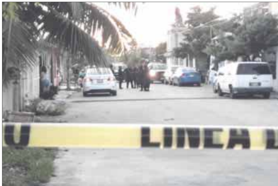
Ante el temor de que sus familiares resultaran heridos, los vecinos solicitaron apoyo al número de emergencias 911.

Las detonaciones de arma de fuego, a las siete de la mañana alertó a la población aledaña, que constató desde su ventana que un grupo de hombres armados, dirigían sus disparos hacia un domicilio aledaño.