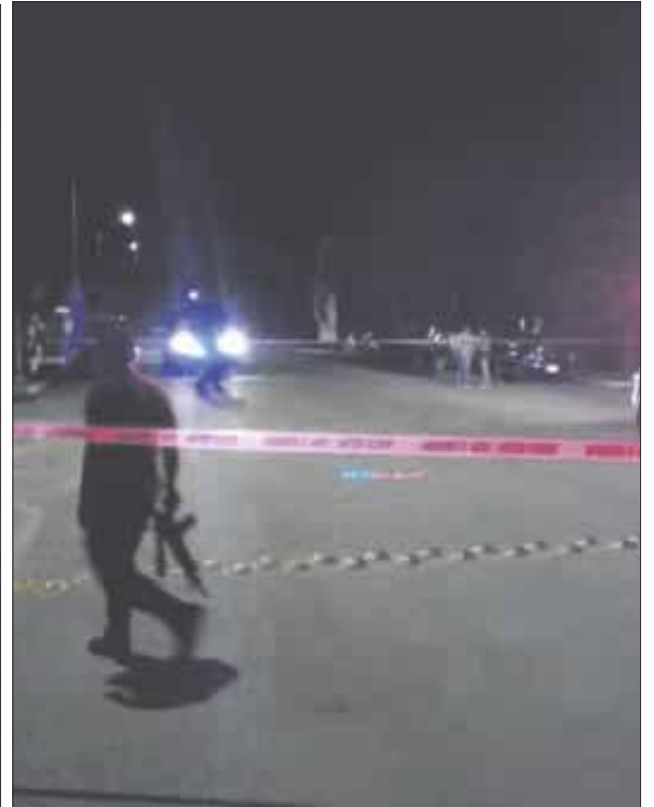
Se registró en la colonia Forjadores una explosión de un vehículo a las afueras de la base de la policía Quintana Roo.