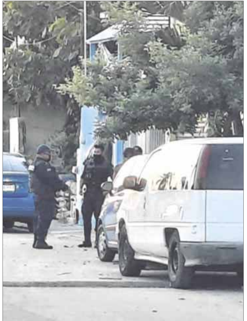
Más de 50 casquillos recibió la casa de un elemento de Seguridad Pública municipal en la calle 111 manzana 78 en la Región 95 en Cancún.

De acuerdo a los vecinos, señalaron que el domicilio atacado era de un agente de la policía de Quintana Roo que aún está activo, y por fortuna, nadie en la casa, ni los vecinos resultaron heridos.