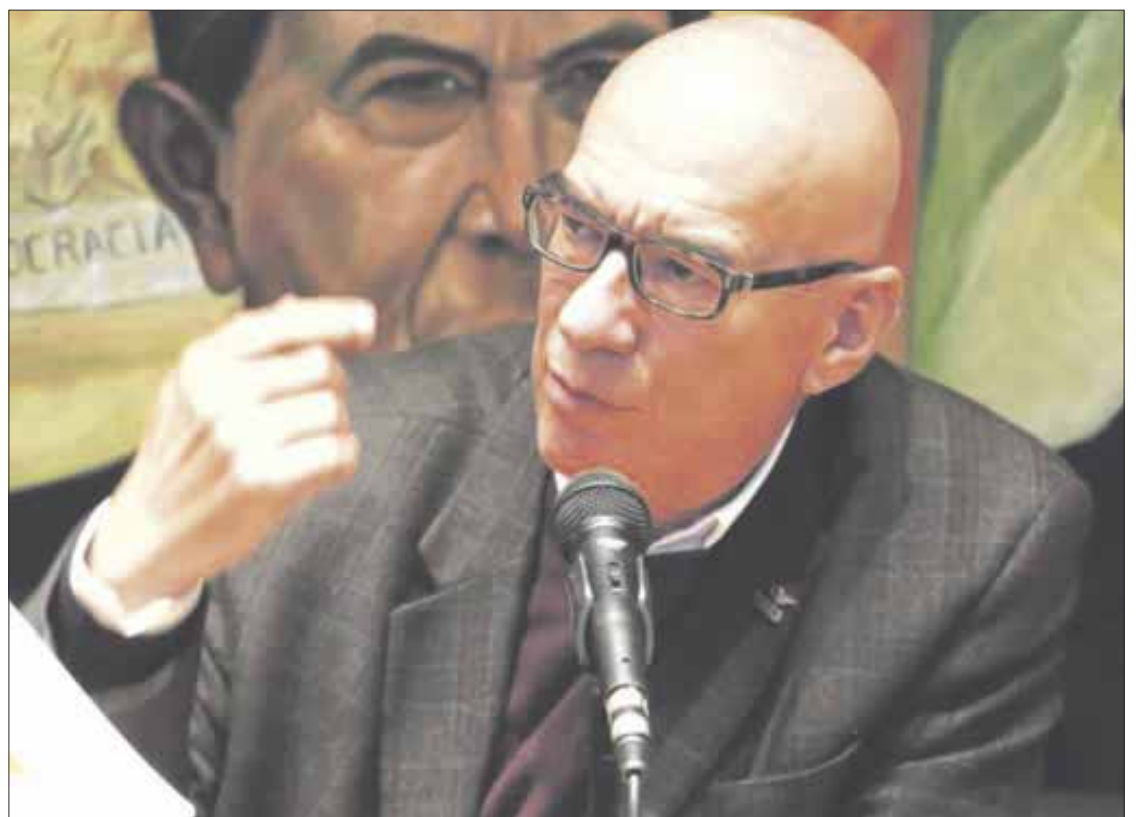
Dante Delgado , propietario de Movimiento Ciudadano.