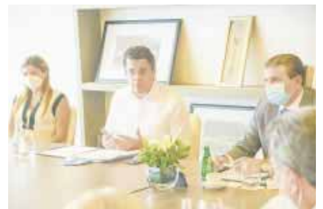
El ministro de turismo de República Dominicana en conferencia.

de apoyar a los profesionales de la salud, Velas Resorts logró su meta inicial de obsequiar 300 noches Todo Incluido, como muestra de agradecimiento a su extraordinario esfuerzo en la lucha contra la pandemia por coronavirus. Serán seleccionados 100 médicos que podrán disfrutar estancia en el complejo de Puerto Vallarta.