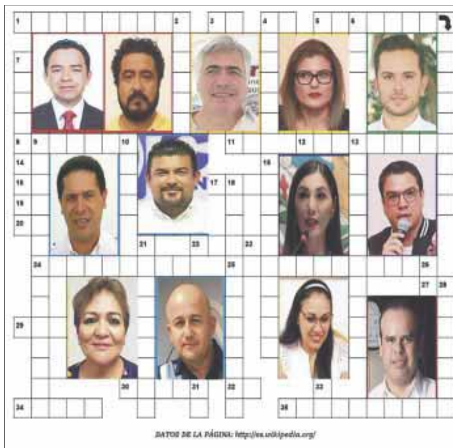
DATOS DE LA PÁGINA: http://es.wikipedia.org/

35.- Como se les califica en lo político a los políticos que constantemente andan cambiando de partido y que se podrá observar en algunos nombres de los que aparecen en este Politigrama..