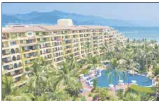
El hotel en Puerto Vallarta.