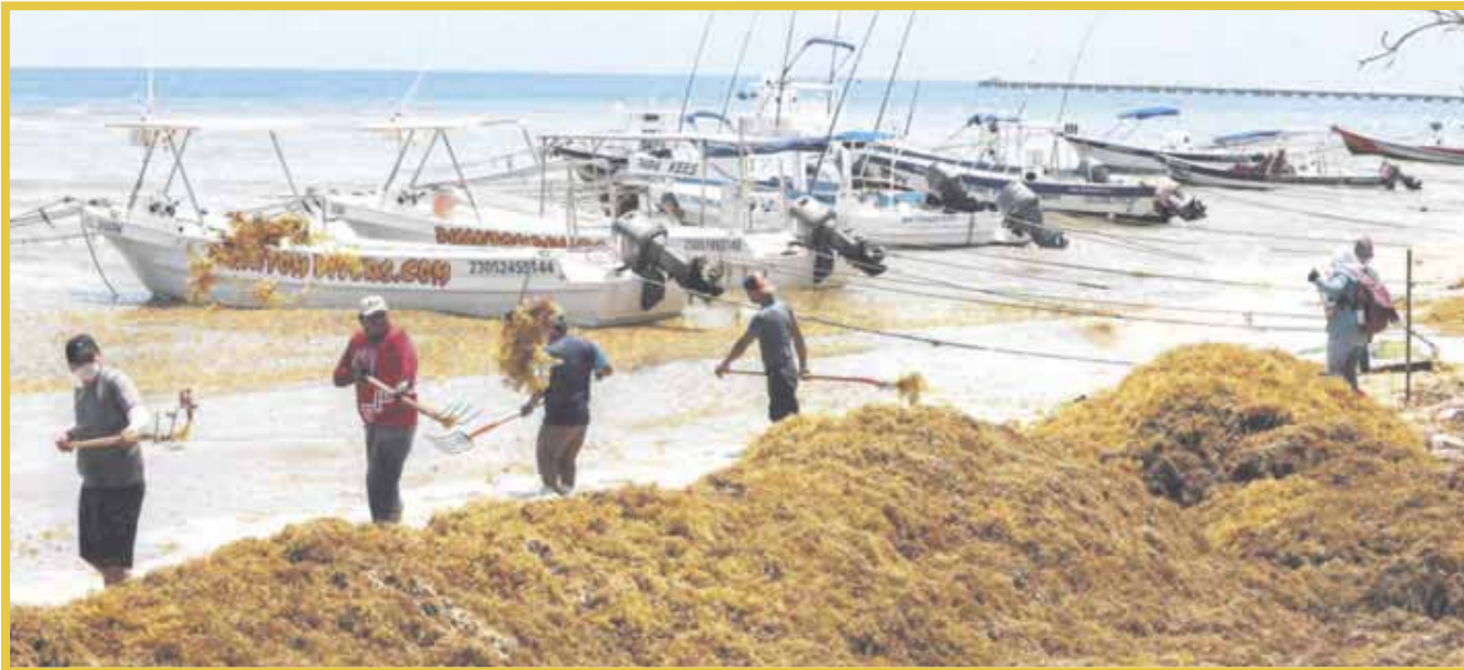
Las costas quintanarroenses recibieron entre el miércoles y el jueves los primeros recales masivos de sargazo de este año.

Las costas quintanarroenses recibieron entre el miércoles y el jueves los primeros recales masivos de sargazo de este año, con mayor afectación en los balnearios de Playa del Carmen, Cozumel, Tulum, Xcalak y Mahahual.