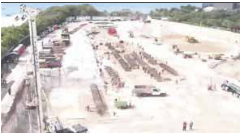
RIU Hotels volvió a recibir el respaldo de la justicia con una nueva sentencia favorable, para retomar las obras de su proyecto promovido en Punta Nizuc.

Cancún.- RIU Hotels informó que volvió a recibir el respaldo de la justicia con una nueva sentencia favorable, para retomar las obras de su proyecto promovido en Punta Nizuc.