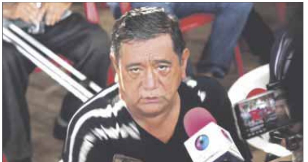
Félix Salgado Macedonio , el “toro sin cerca”.