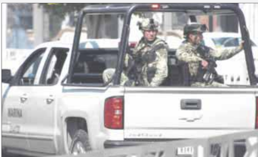
Jueces federales vincularon a proceso a 30 elementos de la Secretaría de Marina por la desaparición de cuatro personas en Reynosa, Tamaulipas, en 2018.

Tras reabrir un caso de 2018, jueces federales, con sede en Reynosa, Tamaulipas, vincularon a proceso a 30 elementos de la Secretaría de Marina Armada de México (Semar), por la desaparición de cuatro personas.