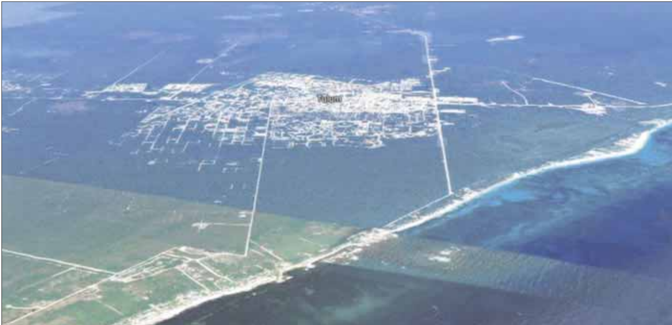
La Semarnat notificó al municipio de Tulum que no admiten su Programa Municipal de Ordenamiento Territorial publicado el 31 de marzo.

Semarnat notificó al municipio de Tulum que no admiten el Programa Municipal de Ordenamiento Territorial, Ecológico y Desarrollo Urbano Sustentable Municipal (PMOTEDUS) publicado el 31 de marzo debido a “faltas e incongruencias relevantes”.