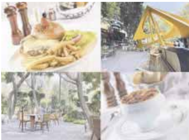
Podrás disfrutar excelentes platillos al aire libre.

victoriagprado@gmail.com Twitter: @victoriagprado