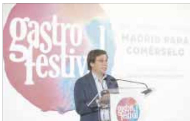
En la presentación del Gastrofestival en Madrid.