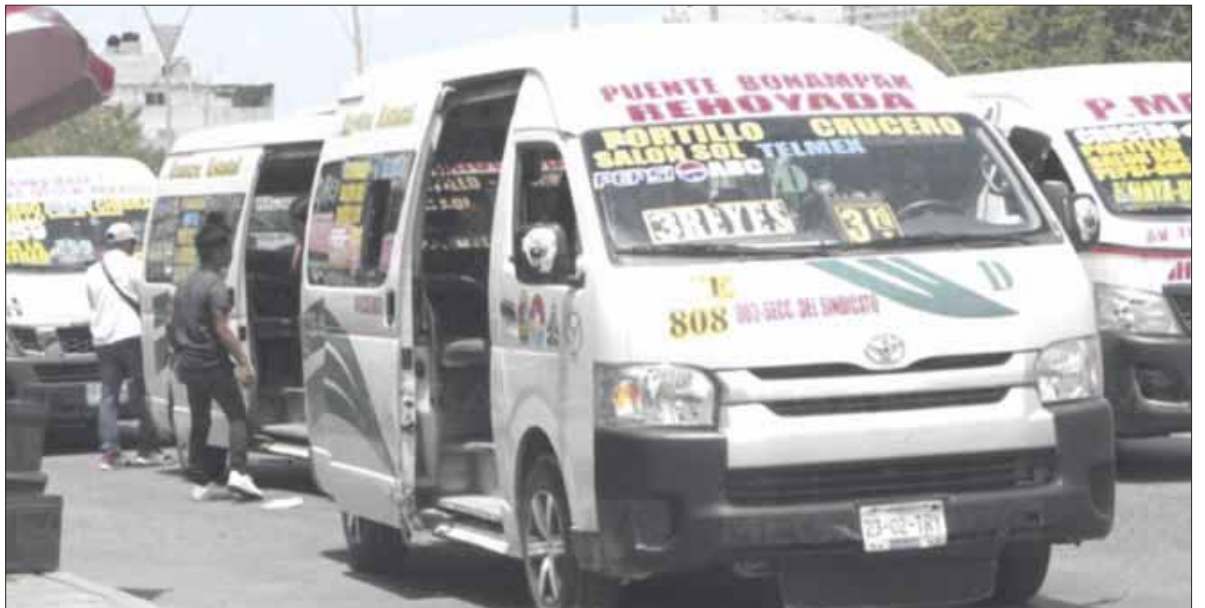
Entre cinco y 10 urvans del transporte público en Cancún son multadas por sobrecupo, en Cancún.

Por último, destaca que estos filtros de revisión se llevan a cabo todos los días de manera sistemática, mismos que se incrementaron a partir que dio inicio la pandemia, sin embargo, pide que la responsabilidad sea compartida, porque finalmente, quienes pagan los platos rotos son los operadores, cuando el usuario también debe ser consciente y no abordar a las unidades si estas tienen sobrecupo.