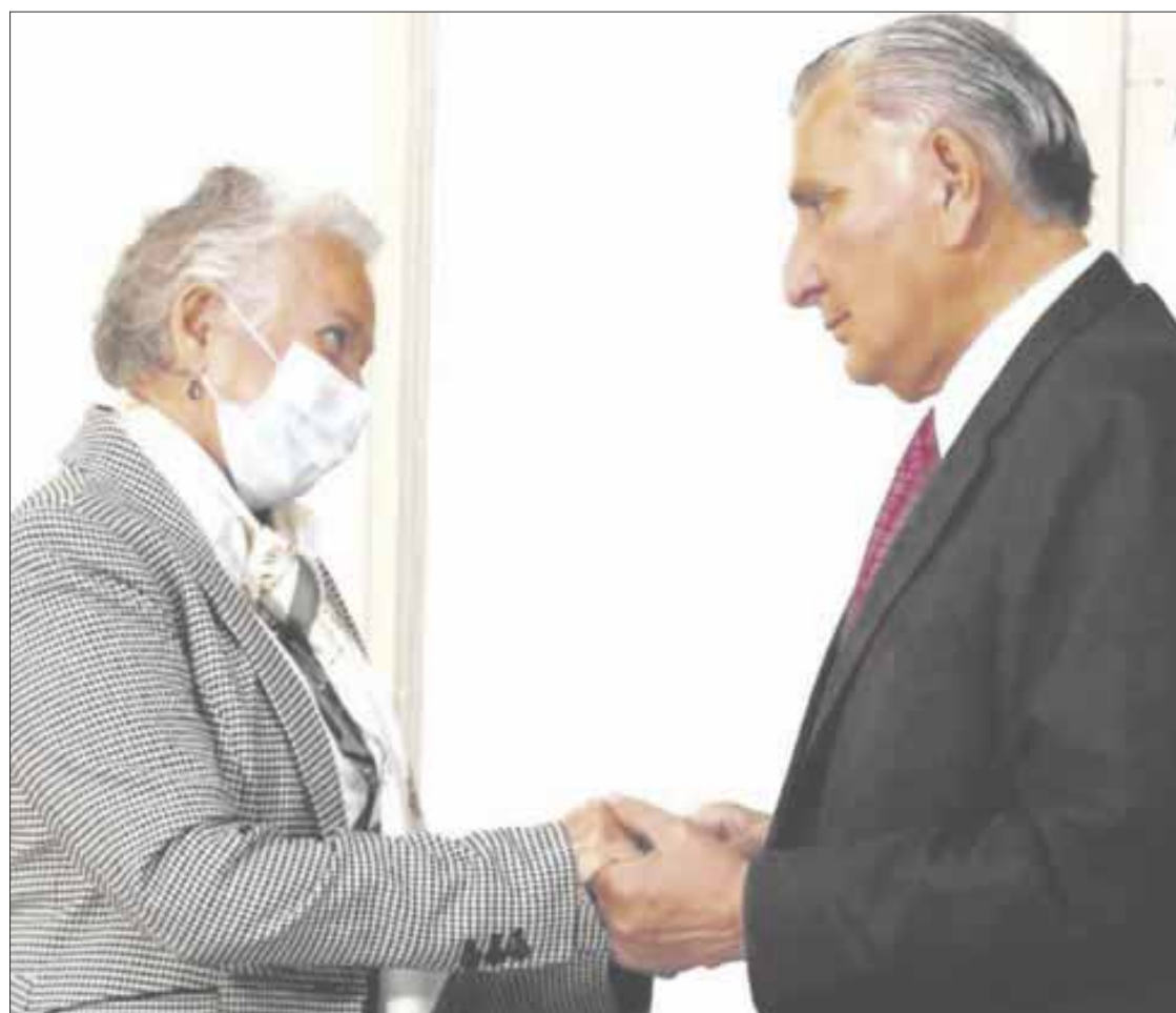
Adán Augusto López , nuevo secretario de Gobernación.