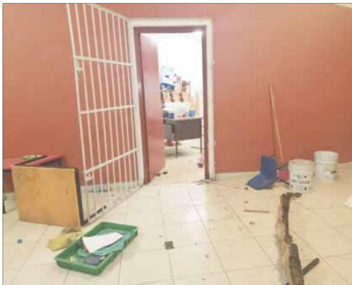
El 80% de las 600 escuelas del centro y sur de la entidad carecen de los servicios básicos de electricidad y agua.

A su vez, la titular de la Secretaría de Educación de Quintana Roo confirmó que este lunes, sólo 341 escuelas en el estado se registraron para el regreso presencial, mientras que los Comités Participativos de Salud Escolar de otras 100 es-