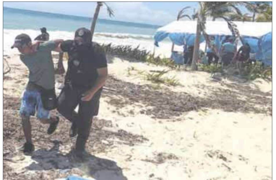
Durante el operativo en playas de Isla Mujeres se logró la detención de 10 personas, las cuales fueron puestas a disposición del Ministerio Público para determinar su situación jurídica.

Aseguró que la víctima, quien se encontraba aislada, logró hacer contacto con la representación diplomática de su país en México para solicitar apoyo. El Cónsul acudió al Ministerio Público para realizar la denuncia correspondiente y agentes de la FGE acudieron al rescate de la víctima.