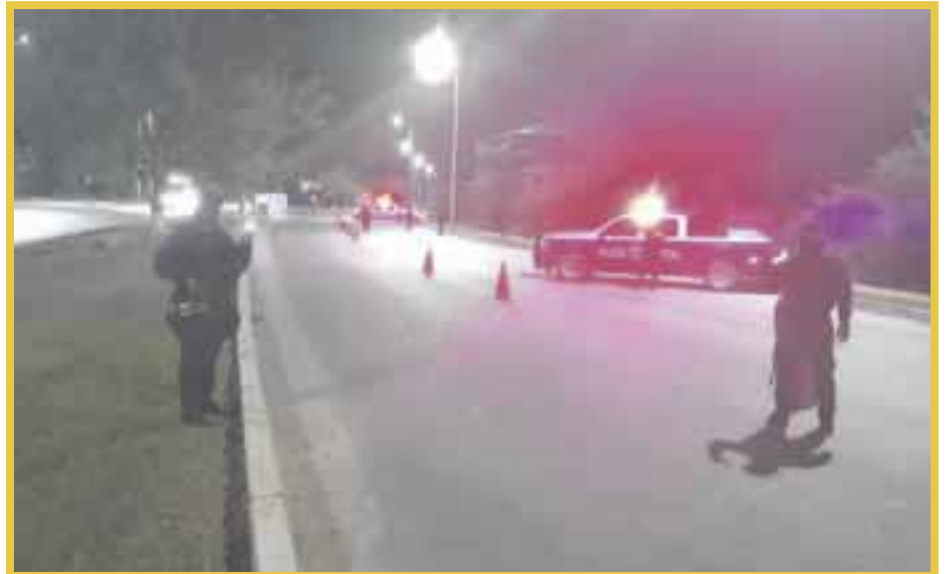
El gobierno de Quintana Roo anunció el cierre de vialidades en Othón P. Blanco (Chetumal) y en Bacalar.