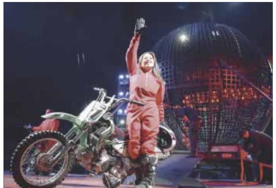
Un acto impresionante los motociclistas en el globo de la muerte.