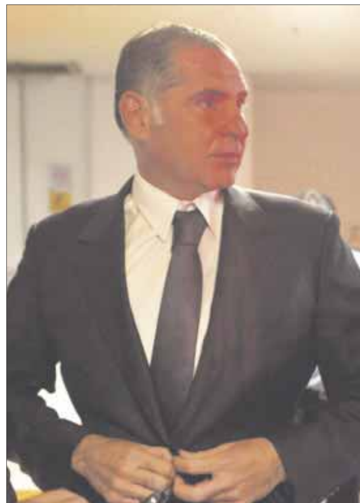
Gabino Cué , ex gobernador de Oaxaca.