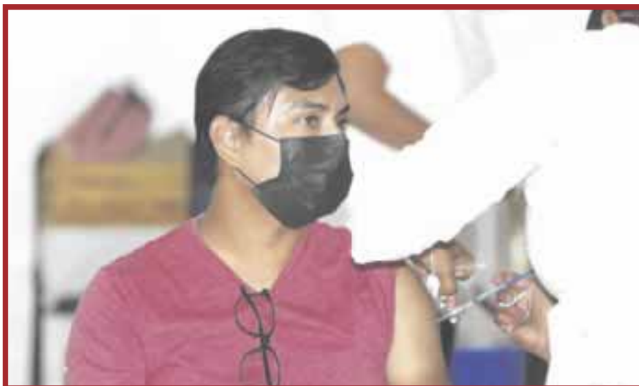
No se tiene una fecha exacta para que arribe el lote de vacunas para aplicar la segunda dosis a los ‘millennials’, ‘centennials’ y rezagados.

El gobernador Carlos Joaquín informó que se emitió una alerta para ambos municipios, donde ya se tiene un aumento de 91% de nuevos casos. “Hemos logrado mantener el color naranja en el semáforo epidemiológico, pero hay riesgo de retroceder al rojo en la zona sur”, advirtió.