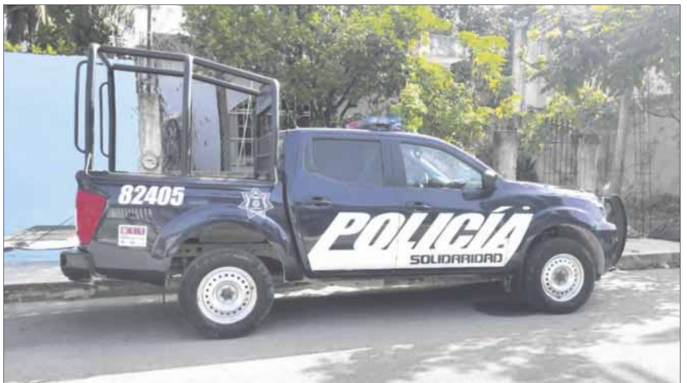
Escapa por la puerta falsa una jovencita, al colgarse con una soga al interior de su domicilio en la calle 18, entre la avenida 80 y diagonal 85, en la colonia Ejido.

Una llamada al número telefónico de emergencia 911, alertó a las autoridades del hecho, Los familiares de esta víctima llamaron al 911, luego de encontrarla suspendida de una soga, en la colonia Ejido.