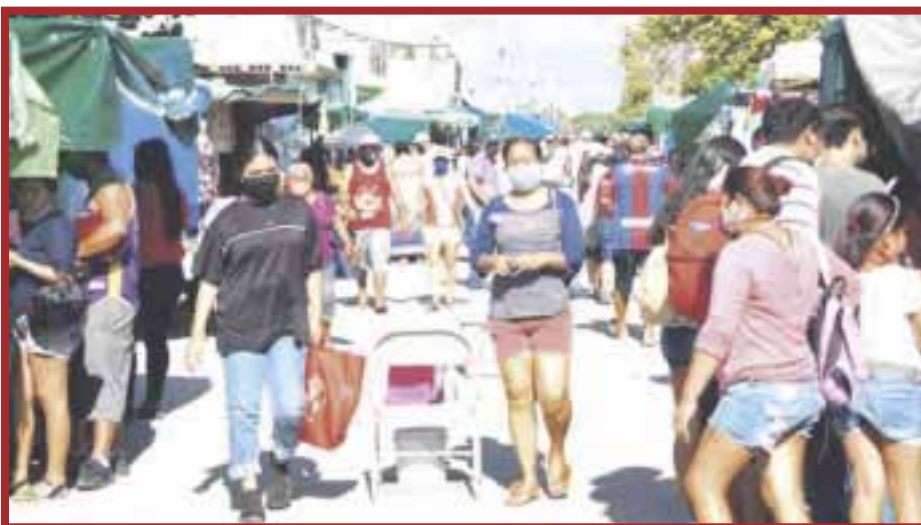
En los tianguis de Cancún, sólo la venta de alimentos dejan ganancias loables.

La tonelada de maíz inició este año con un precio de cuatro mil pesos por tonelada, luego aumentó a cinco mil pesos, más tarde se disparó a los siete mil pesos y ahora, se encuentra a un precio de 10 mil pesos por tonelada, lo cual es demasiado para sólo un año de incrementos.