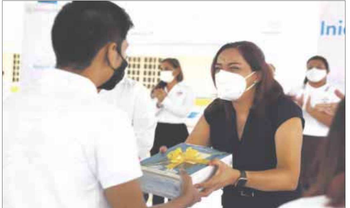
La titular de la SEQ indicó al reducido número de asistentes la importancia de mantener la sana distancia, usar de manera obligatoria el cubrebocas, lavar las manos constantemente y aplicar gel anti bacterial.

De acuerdo con la SEQ, el ciclo escolar 2021-2022 dio inicio con 341 escuelas de manera presencial, 300 de éstas son educación privada, mientras que 41 son escuelas públicas; con esto, mil 300 alumnos que regresan a las aulas en pequeños grupos y de manera escalonada.