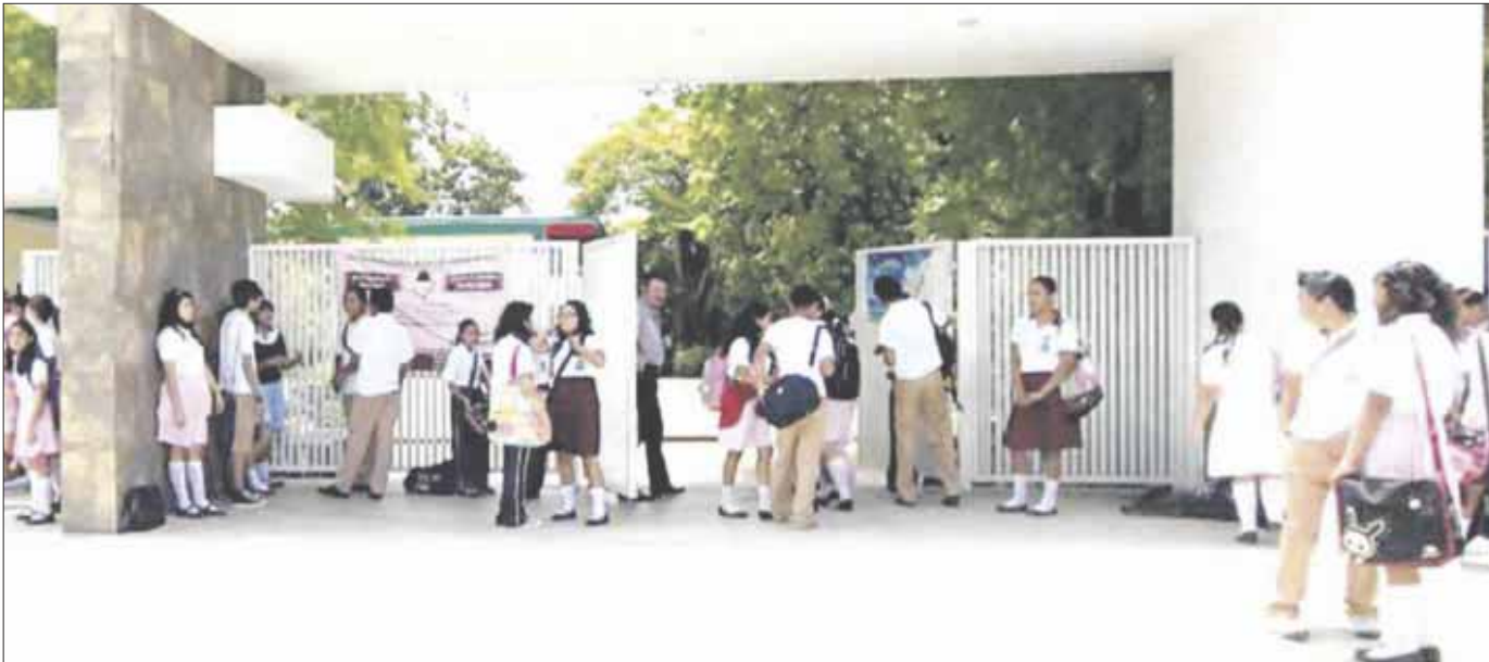
La semana pasada se presentó en el Congreso de Quintana Roo una iniciativa para implementar una ley de seguridad escolar.

Se presentó en el Congreso de Quintana Roo una iniciativa para implementar una ley de seguridad escolar, a fin de atender y prevenir los problemas de violencia en los salones de clases, perímetros de las escuelas, casos de maltrato y acoso a alumnos.