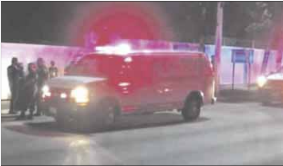
Un hombre resultó al presuntamente resistirse a un “levantón” en la Calzada Veracruz, entre Venustiano Carranza y San Salvador.

Chetumal.— Una bala en la pierna izquierda recibió un hombre al presuntamente resistirse a un “levantón”, luego de ser atacado por sujetos armados que lo dejaron mal herido en la Calzada Veracruz, entre Venustiano Carranza y San Salvador y en consecuencia pidió refugio en el batallón de Infantería de Marina (BIM).