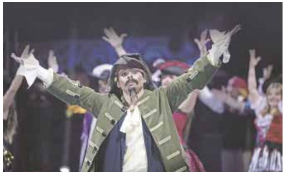
“Bardum el show” con 25 personas en escena haciendo realidad una fantasía inspirada en Piratas del Caribe.