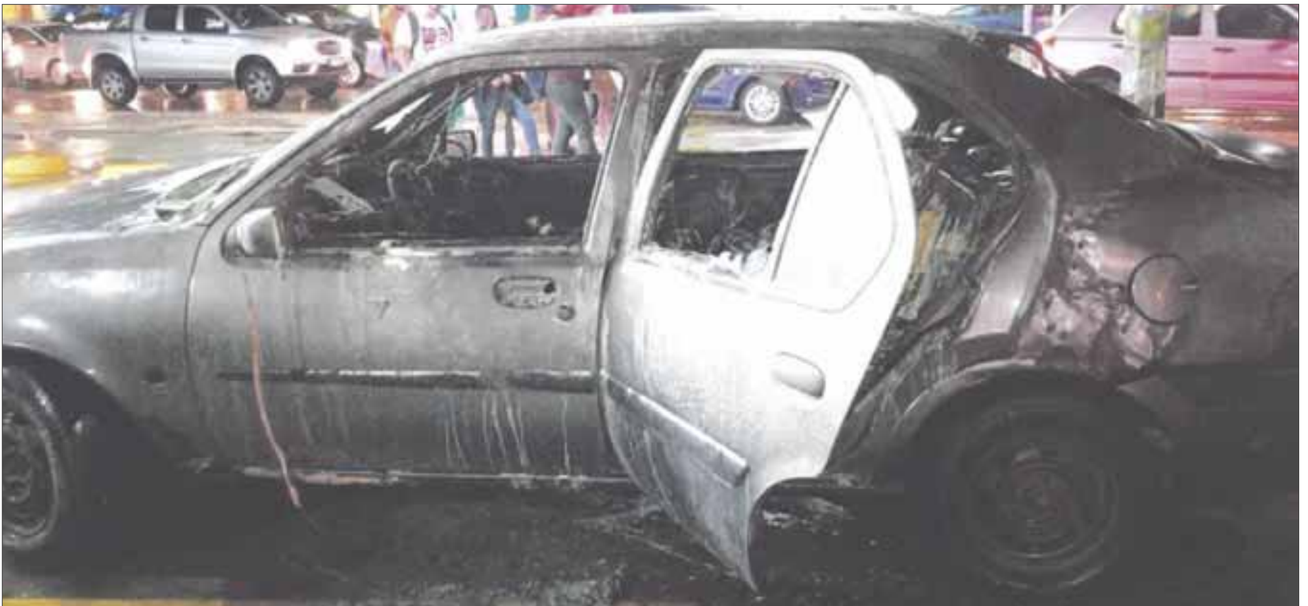
Se incendió un vehículo en una estación de gasolina , ubicada en la Región 230, en las inmediaciones de la Región 230, entre las avenidas Kabah y Leona Vicario. A pesar de que los bomberos trataron de sofocar las llamas, el fuego consumió el vehículo que se redujo a pérdida total, al quedar como chatarra.