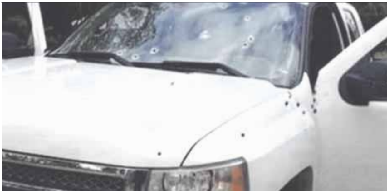
Un enfrentamiento a balazos entre presuntos narcomenudistas y policías, dejó como saldo, dos lesionados y una camioneta baleada en la comunidad de Sergio Butrón Casas.

Chetumal. — Un enfrentamiento a balazos entre presuntos narcomenudistas y agentes de la Policía Quintana Roo, dejó como saldo, dos lesionados con arma de fuego y una camioneta baleada en la comunidad de Sergio Butrón Casas.