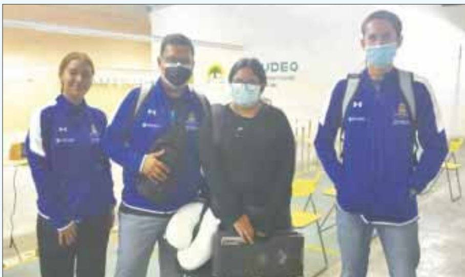
Atleras quintanarroenses participan en la competencia selectiva rumbo a campeonatos internacionales como el Centroamericano de Tiro 2021, entre otros.

Chetumal.- Seleccionados quintanarroenses de la disciplina de Tiro Deportivo, pertenecientes al Centro Estatal Deportivo de Alto Rendimiento (CEDAR) de Chetumal, participan en la primera competencia selectiva nacional con armas de aire rumbo al Primer Campeonato Centroamericano de Tiro 2021, Campeonato Panamericano de Tiro Lima 2021 y también primer selectiva nacional con miras al clasificatorio para los Juegos Panamericanos Junior Cali 2021.