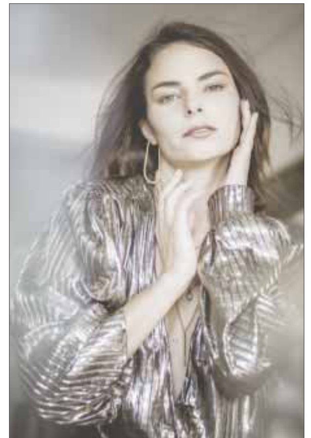
La bella y angelical actriz es egresada del Centro de Educación Artística de Televisa, y su primera telenovela fue "Porque el amor manda", desde entonces ha estado en las telenovelas con mayor rating de Televisa.