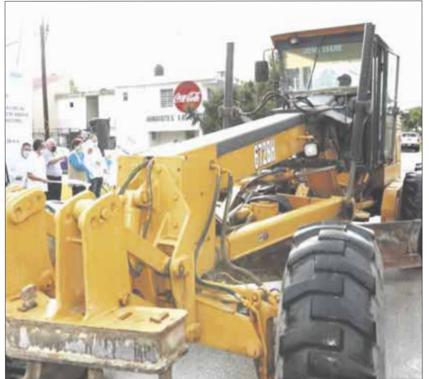
Carlos Joaquín dio el banderazo de arranque de las obras de ampliación de la avenida Isla Cancún, en Chetumal.

Con esta obra, que responde a las solicitudes de los vecinos, se mejorarán la vialidad y la movilidad, y se avanzará en la recuperación del esplendor de Chetumal