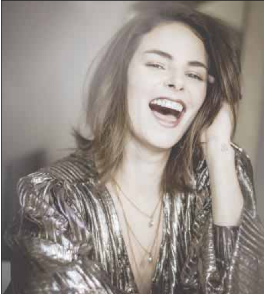
Señala que no está cerrada a ningún tipo de producción "para mí actuar es ya una bendición".

Sí, es complicado separarme de mis hijos porque me encanta estar con ellos. Disfruto cumplir mis sueños, seguir buscando mis metas y trato de que cada área sea la mejor versión de mí.