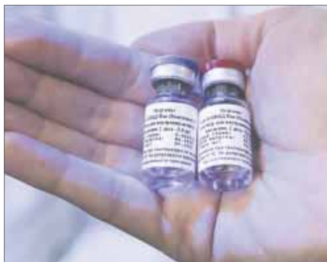
México podría aprobar en unos días la vacuna rusa, Sputnik V, contra Covid-19, anunció el secretario de Hacienda.

En los próximos días, México podría aprobar la vacuna rusa, Sputnik V, contra Covid-19, anunció el secretario de Hacienda y Crédito Público (SHCP), Arturo Herrera Gutiérrez.