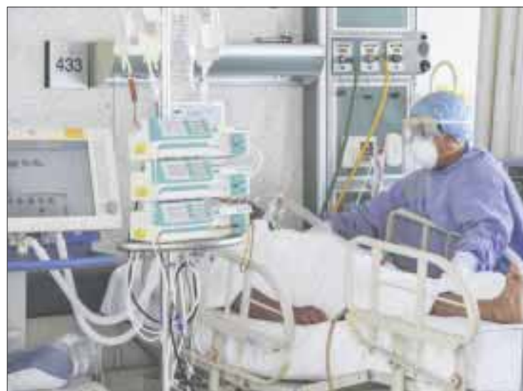
Hasta el 14 de enero, se habían notificado 2 mil 119 defunciones y 16 mil 703 casos positivos.

La Organización Mundial de la Salud advirtió que las mascarillas con válvula no son recomendables, ya que permiten el paso del virus a través de la misma