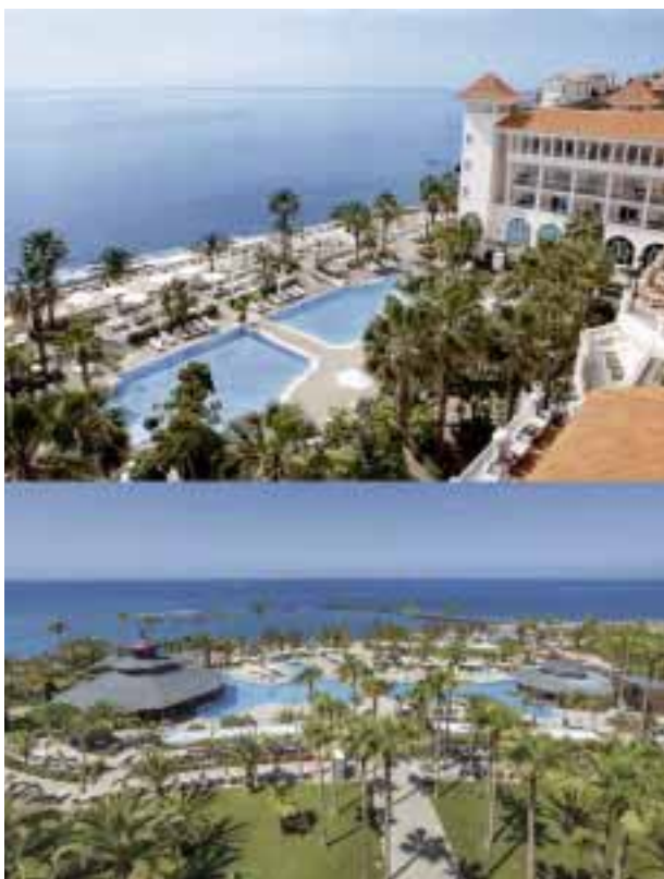
Los hoteles Riu en Madeira, Portugal; y Tenerife, España.

victoriagprado@gmail.com Twitter: @victoriagprado