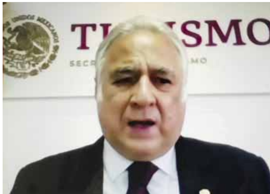
Miguel Torruco en la presentación de la Rueda de Negocios de Mundo Maya.

Señaló también: “hasta ahora, solo un pequeño porcentaje de personas en todo el mundo ha recibido la vacuna, mientras que hay un gran número que no, pero que podrían hacerse la prueba, mostrar un resultado negativo y viajar con seguridad”.