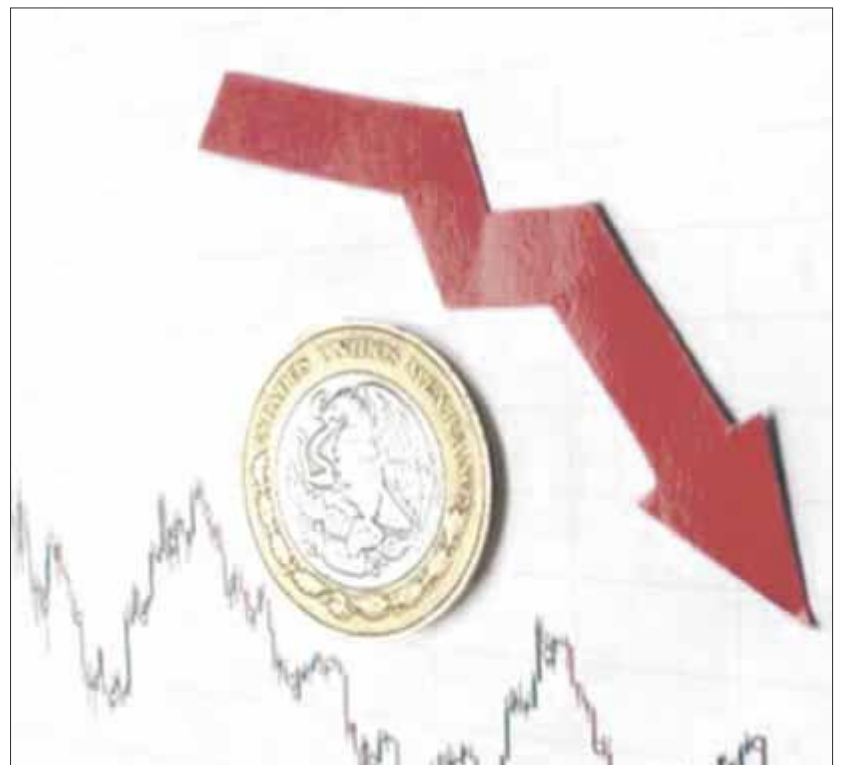
Los estragos dejados a nivel salud y economía tardarán por lo menos dos años en sanar, afirman expertos en economía y finanzas.

“La realidad que se nos está presentando desde diciembre pasado en el país es que se volvió a disparar la pandemia, lo cual provocó que se estén cerrando otra vez las economías”