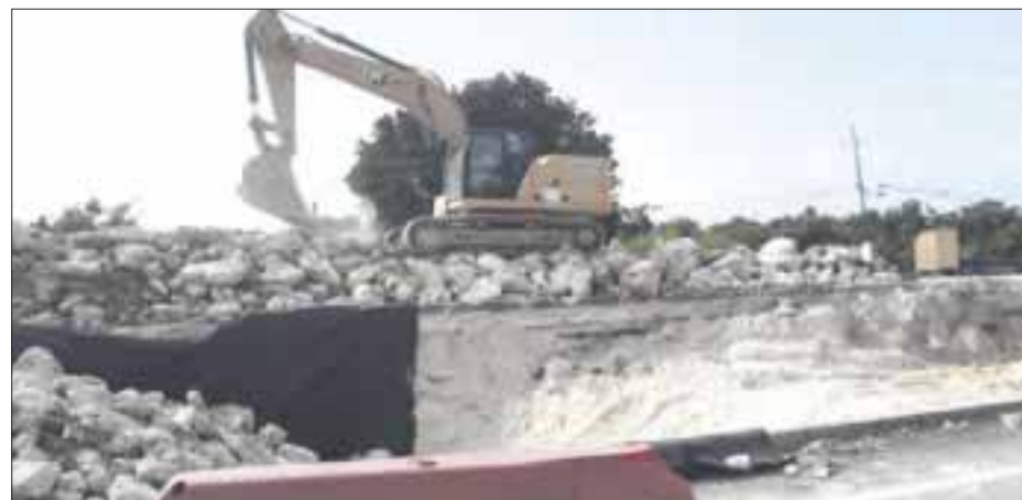
Fonatur informó que se va a acelerar la construcción de la vialidad alterna en la carretera Cancún-Playa del Carmen.