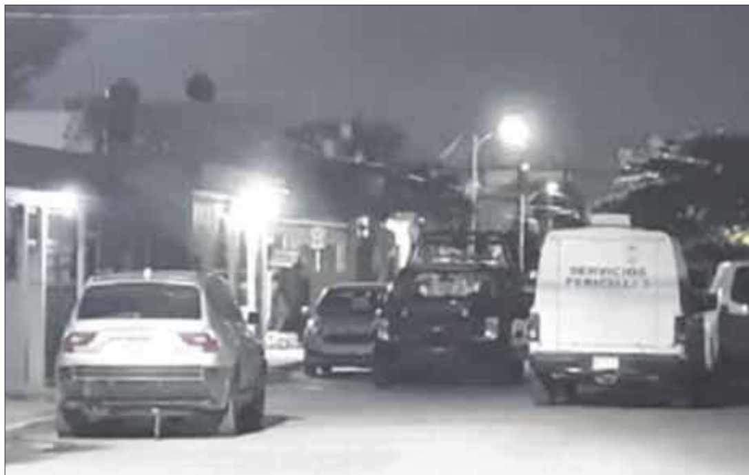
Encontraron el cuerpo en estado de putrefacción de Marlene “N” de 21 años de edad, al parecer asfixiada, en una cuartería en la manzana 4, calle 50, con la 127.

A la joven la encontraron con una bolsa de basura en la cabeza y con varios golpes en el cuerpo, tenía moretones en ambas piernas y en el brazo izquierdo, como seña particular era de tez morena clara, cabello ondulado castaño oscuro