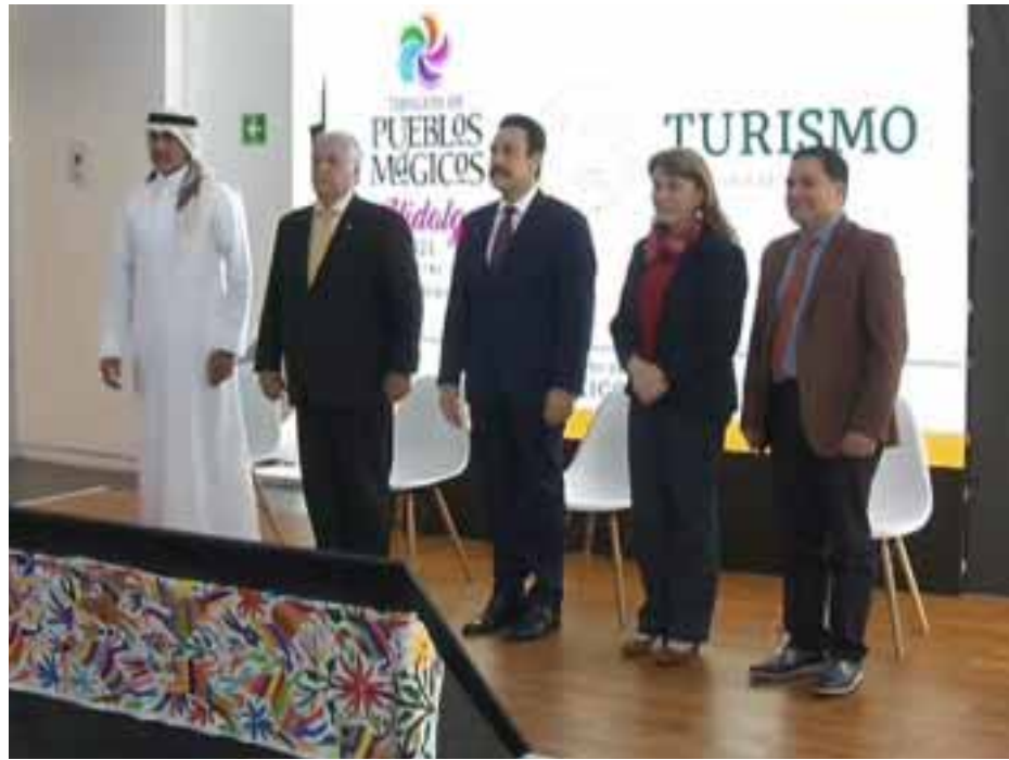
Durante la conferencia de prensa.

☆☆☆☆ El turismo deportivo fue hasta 2019 muy importante para el sector turístico. Este año la Selección Nacional de México destaca entre los equipos que juegan en el área de Dallas Fort Worth, además de las selec-