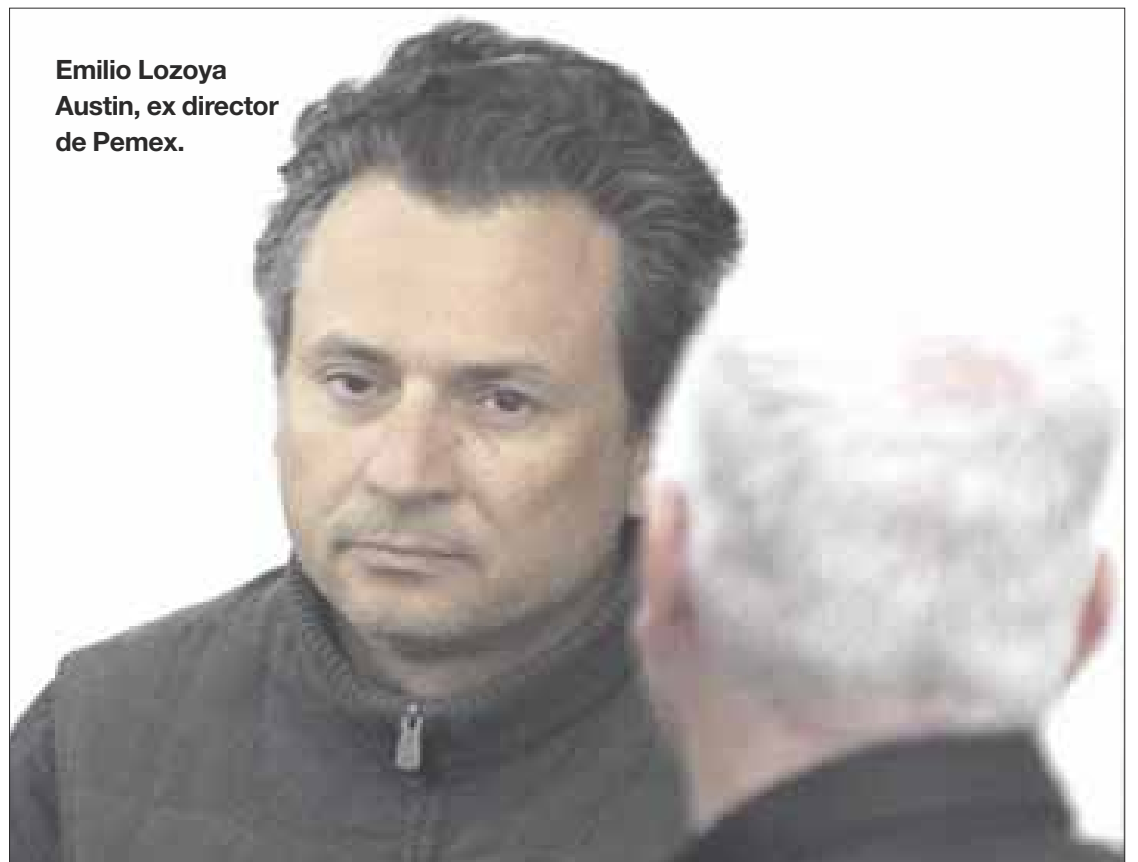
Emilio Lozoya Austin, ex director de Pemex.

La FGR no encuentra elementos para proceder en contra de los señalados, por lo que pronto habrá de revertir el tema y, en consecuencia, actuar en contra del señor Emilio Lozoya Austin, agotado ya el tema del criterio de oportunidad.