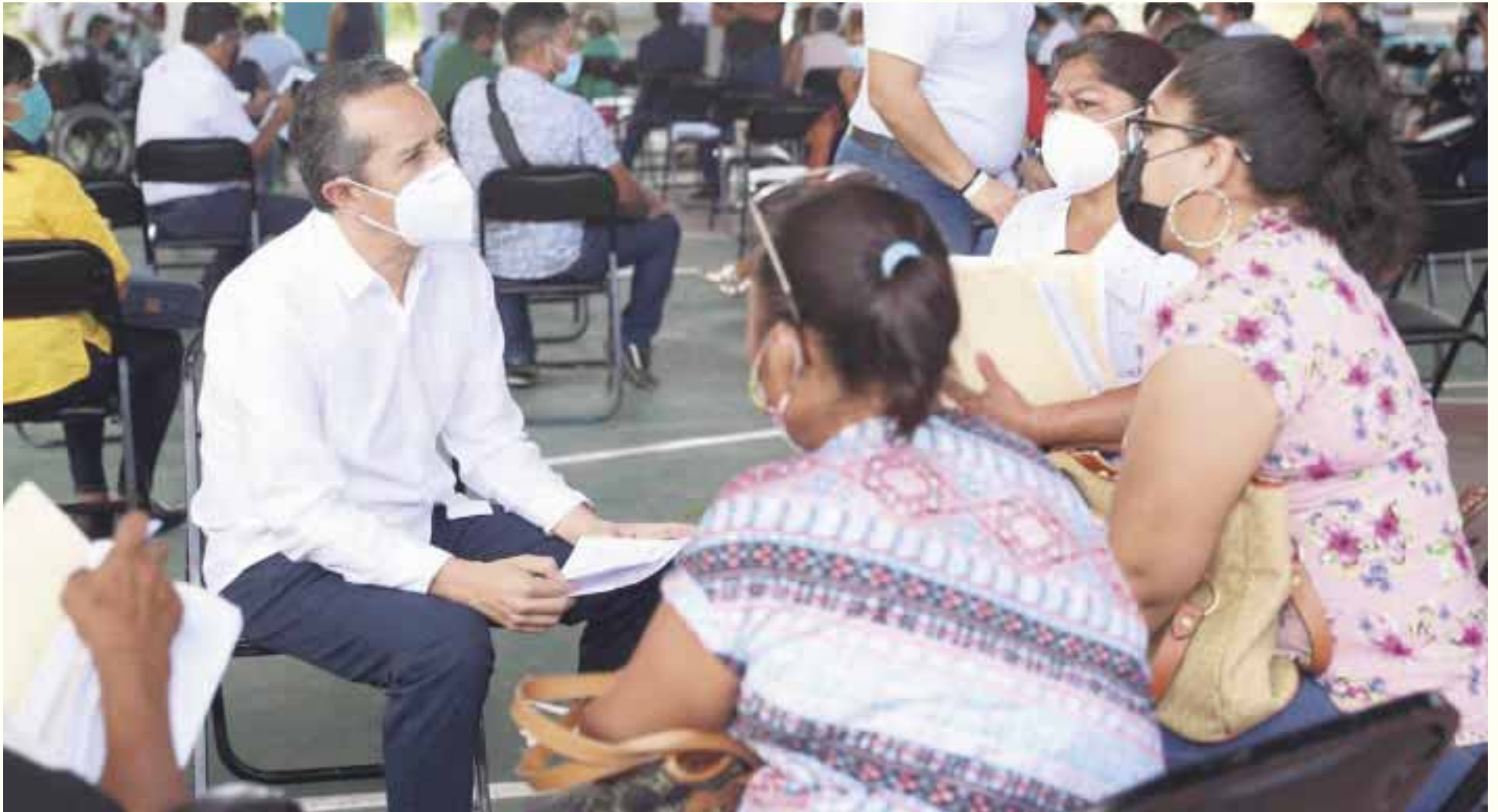
El gobernador Carlos Joaquín encabezó la audiencia pública “Pláticale al Gobernador” en Chetumal, escuchando y atendiendo de forma directa a los ciudadanos.