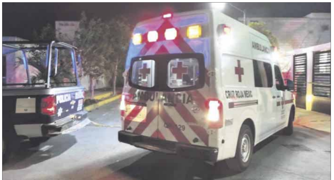
Una adolescente de 16 años de edad se suicidó en la vivienda ubicada en la calle Mar Rojo, con avenida Playa del Carmen, en el fraccionamiento Villamar 1.

Los agentes de la Policía Municipal solicitaron la presencia de la Fiscalía General del Estado para que los peritos y elementos de investigación realicen el procedimiento de rigor, y el cuerpo se deje en manos de elementos del Servicio Médico Forense (Semefo) para la necropsia de ley.