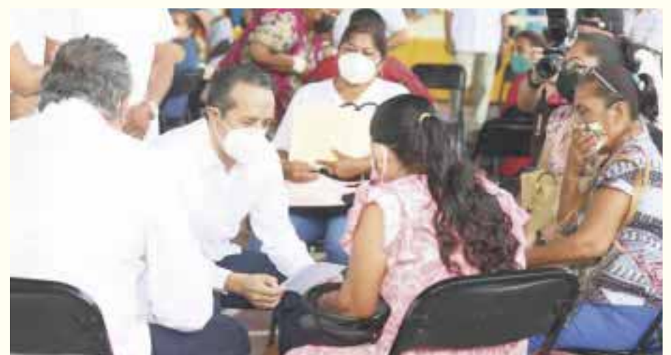
En la audiencia, realizada en el domo del Colegio de Bachilleres Plantel 2 de Chetumal, se atendieron a más de 108 personas, 71 mujeres y 37 hombres, con más de 204 asuntos.