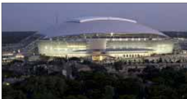
Uno de los estadios donde se jugará la Copa Oro.

victoriagprado@gmail.com Twitter: @victoriagprado