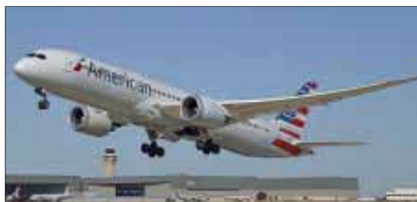
El Aeropuerto de Dallas Fort Worth 40 años de ser centro de conexiones.