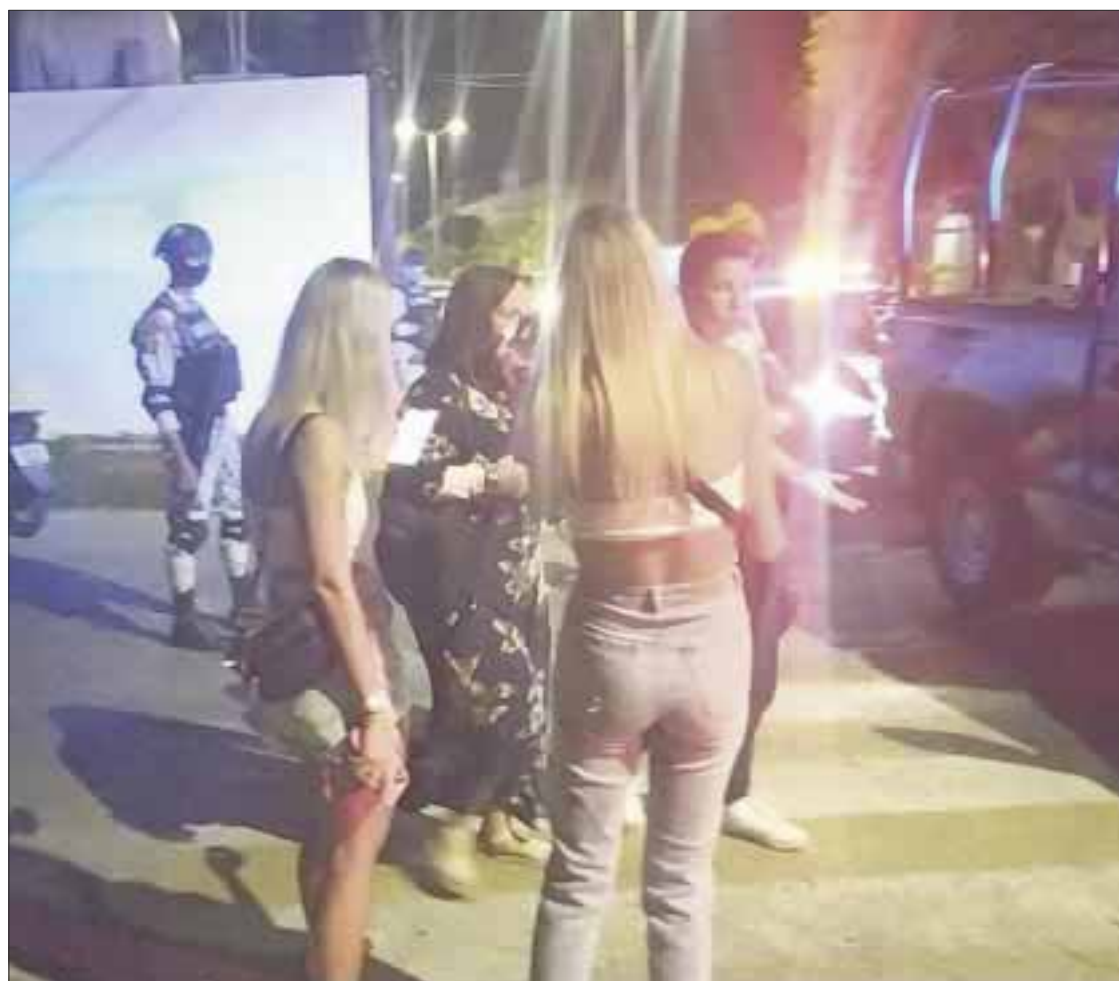
El pasado fin de semana se reportaron en Cozumel 16 fiestas y reuniones que se convirtieron en focos rojos de riesgo a contagiarse de Covid-19.

Asimismo, se sabe que algunos turistas buscan en internet y redes sociales domicilios con suficiente espacio para organizar fiestas, donde se puedan rebasar los límites permi-