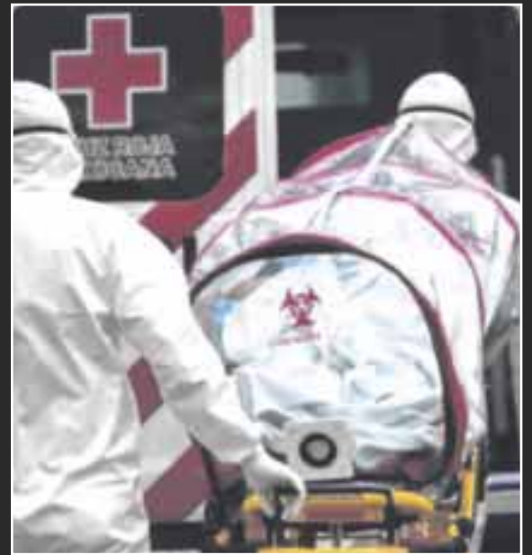
Hasta ayer martes, eran de 36 mil 679 casos positivos y 3 mil 120 muertes por coronavirus en el estado.

Sobre la ocupación hospitalaria, la actualización apuntó que en la zona norte es de 30%, mientras que en la sur bajó a 21%, de igual manera, la velocidad en el crecimiento de contagios en el primero de los casos es de .77 y de .38 para el segundo. Siendo Quintana Roo la única entidad en todo el país, que presenta cifras al alza en el número de nuevos contagios.