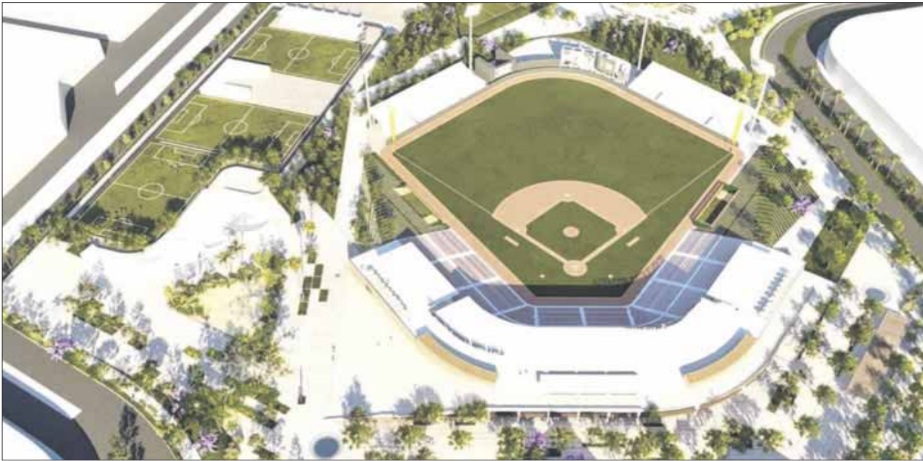
La Constructora Maíz Mier ganó la licitación para la remodelación de Estadio de Beisbol Beto Ávila, en Cancún.

Los documentos de la licitación explican que el estado actual del campo de beisbol Beto Ávila, que se renovará en su totalidad, pone en riesgo la vida de los aficionados, ya que las columnas y traveses presentan daños, fisuras y un armado deteriorado.