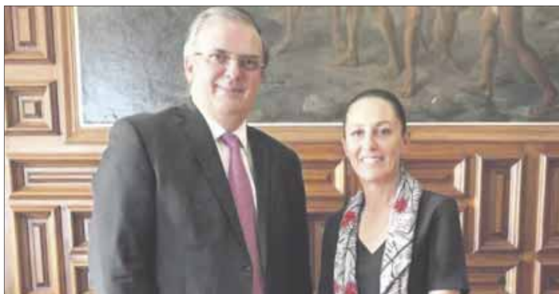
Marcelo Ebrard Casaubon y Claudia Sheinbaum Pardo.