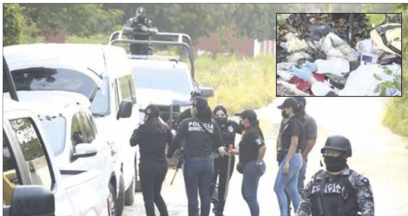
Descubren una fosa clandestina con restos óseos en la zona selvática en el cruce de las calles Sergio Butrón Casas y Alfonso Alarcón Morali, en la Supermanzana 308.

La zona está acordonada y bajo resguardo por parte de la Policía Quintana Roo, Guardia Nacional y El Ejército, que realizan rondines de vigilancia en la zona a fin de prevenir cualquier ataque en la zona.