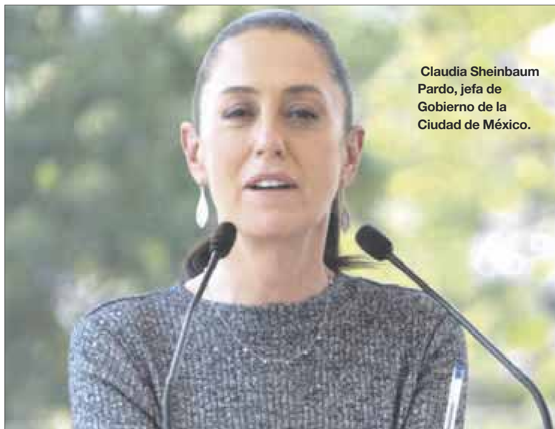
Claudia Sheinbaum Pardo, jefa de Gobierno de la Ciudad de México.