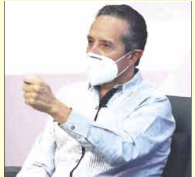
El gobernador Carlos Joaquín anunció que habrá medidas adicionales que permitirán seguir protegiendo la salud de la gente y avanzar en la recuperación económica.

Chetumal.- El gobernador Carlos Joaquín expresó que durante el transcurso de la semana anunciará medidas adicionales que permitirán seguir protegiendo la salud de la gente y avanzar más rápido en la recuperación económica.