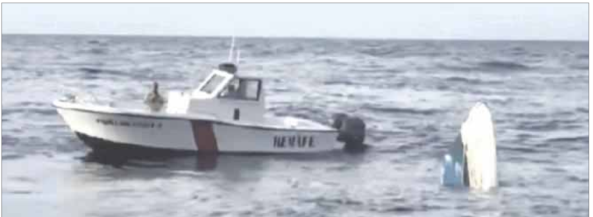
La embarcación llevaba 16 personas, incluyendo a la tripulación, en donde algunos salvaron la vida al mantenerse a flote y nadando hasta la zona de acantilados.