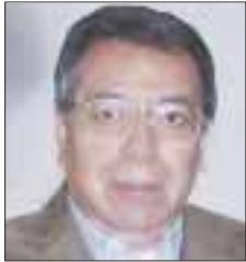
Por Roberto Vizcaíno