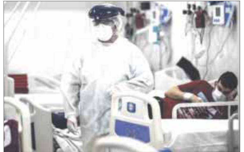
Hasta ayer miércoles había un conteo de 30 mil 939 personas recuperadas, 41 mil 251 casos negativos.

El reporte diario de la Secretaría de Salud estatal, hasta ayer 14 de julio había un conteo de 30 mil 939 personas recuperadas, 41 mil 251 casos negativos, 319 casos en estudio, 37 mil casos positivos