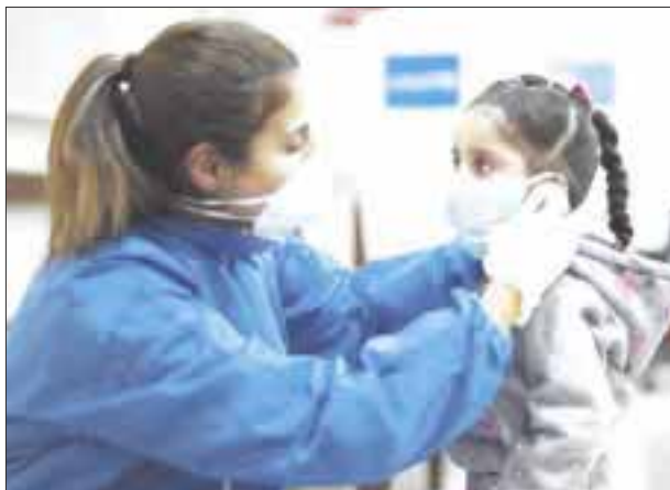
La Secretaría de Salud en el estado negó que la situación de la Covid-19 en Quintana Roo se esté agudizando.

Cancún.- La Secretaría de Salud en el estado negó que la situación de la Covid-19 en Quintana Roo se esté agudizando, a pesar de que ese argumento se reportan entre 200 y 400 nuevos contagios a la enfermedad y también han trascendido brotes entre grupos de turistas que visitan el estado.