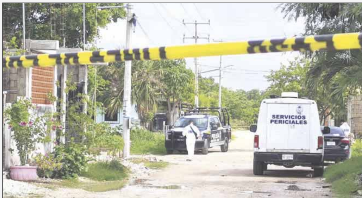
Hallan a un sujeto “ensabanado” en una área verde de la colonia San Alfredo, en la Región 242, cerca del Arco Vial.

Cancún.— Un ensabanado maniatado un cable color verde en el cuello y un torniquete que se realizó con alambre y dos maderas, de alrededor de 30 años de edad, fue encontrado en una área verde de la colonia San Alfredo, en la Región 242, cerca del Arco Vial.