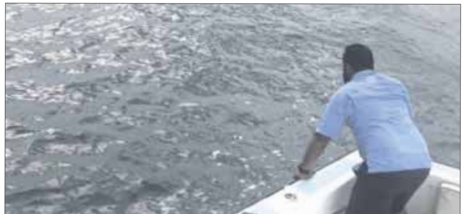
El saldo mortal del hundimiento de la embarcación “Rosa Coral” en Punta Sur, fue de 3 fallecidos