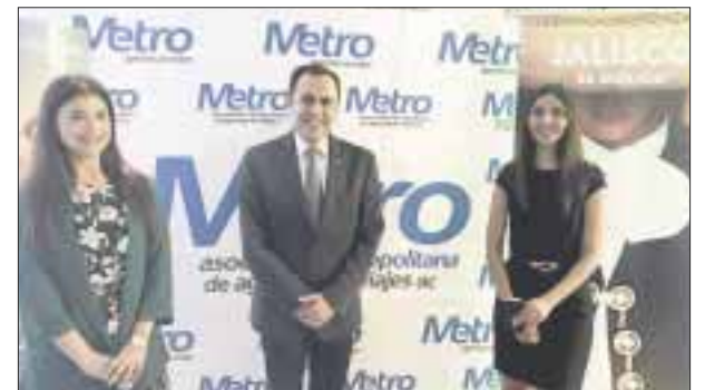
Luego de la reunión de Jalisco con La Metro.

☆☆☆☆☆ Los Emiratos Árabes Unidos están preparando para el próximo evento: Expo 2020 Dubái que abrirá para visitantes el próximo 1 de octubre. El evento tendrá duración de seis meses y se realizará por primera