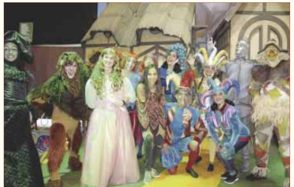
Del 15 de junio al 15 de agosto podrás disfrutar de este colorido show en el estacionamiento de Plaza Universidad, con funciones cada 15 minutos.