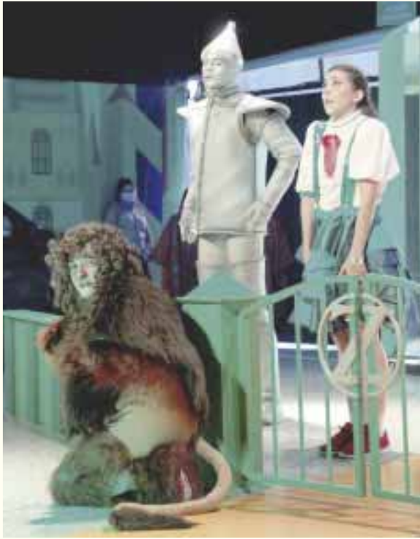
El Mago de Oz sorprende con show Drive in.