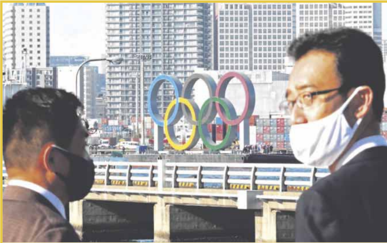
Los Juegos Olímpicos tendrán lugar entre restricciones sin precedentes para todos los deportistas participantes.

El presidente del Comité Olímpico Internacional, Thomas Bach, asegura que hay “cero” riesgo de que los participantes en los Juegos infecten a los ciudadanos japoneses con covid-19, en un momento en que los casos alcanzaron un máximo de seis meses en la ciudad anfitriona.