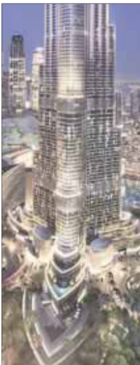
Expo 2020 Dubái en octubre próximo.

La votación inició luego de que los tres videos estuvieron listos se contó con la participación de: Wilma Ormeño , Viajes La-