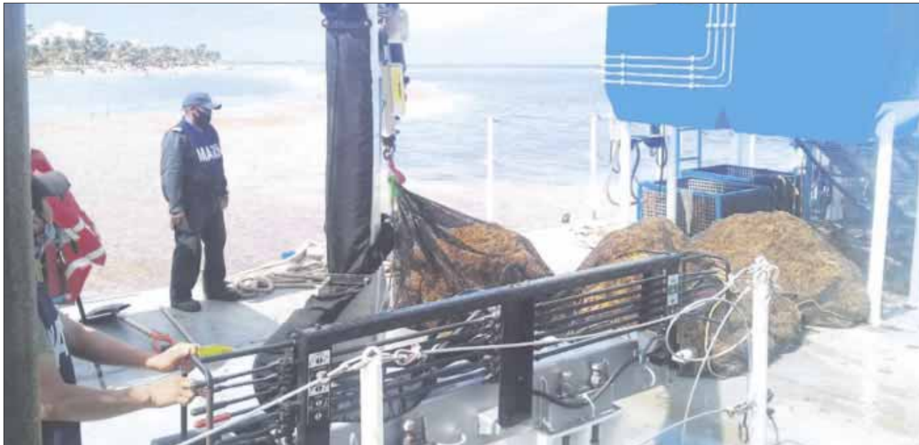
Semar confirmó que el arribazón masivo de sargazo a las costas quintanarroenses, continuará al menos hasta el mes de agosto.

La Secretaría de Marina, informó que cuentan con 11 embarcaciones sargaceras y se incorporó la patrulla oceánica "California" desde el pasado 8 de julio, la cual ha concentrado sus recorridos en las inmediaciones de Puerto Morelos a Punta Nizuc, en apoyo en la recolección de la macro alga.