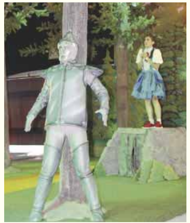
$1,300 pesos es el costo por automóvil para que disfrutes en compañía de tu familia "El Mago de Oz Drive in".