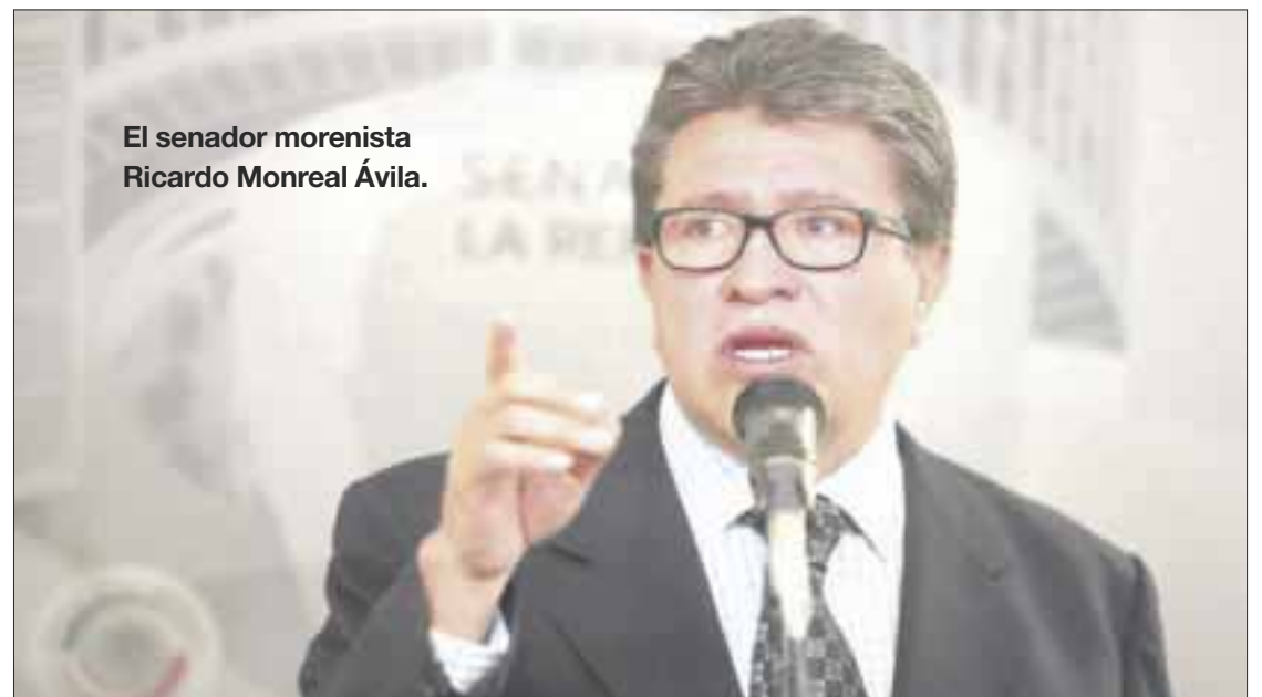
El senador morenista Ricardo Monreal Ávila.