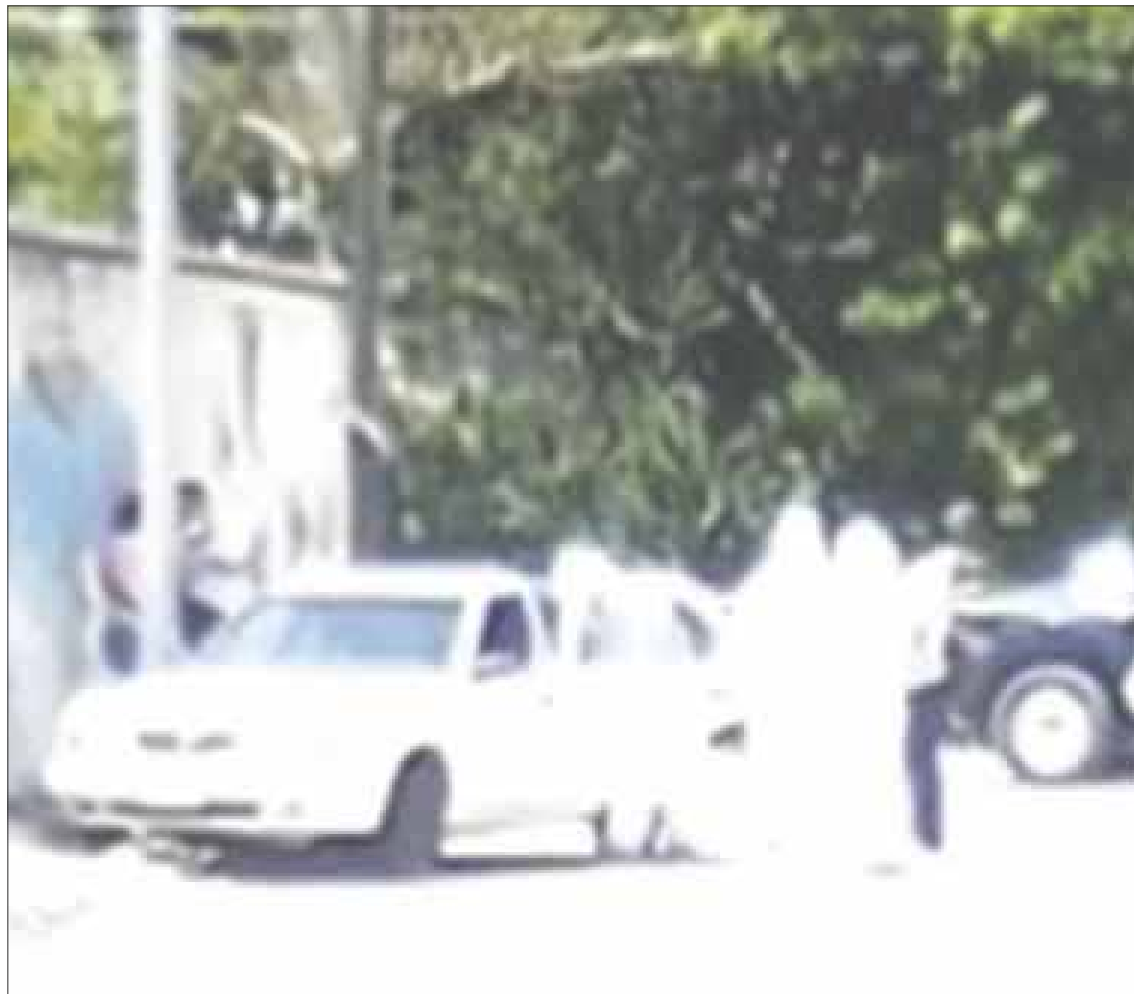
Encontraron a dos hombres ejecutados en un vehículo Nissan abandonado, sobre la avenida 80 con 15 sur, en la colonia Ejidal.

Los peritos y elementos de investigación de la Fiscalía General del Estado (FGE) de Quintana Roo levantaron la evidencia e integraron en el expediente correspondiente para después dejar los cuerpos en manos del personal de Servicio Médico Forense (Semefo) para la necropsia de ley.