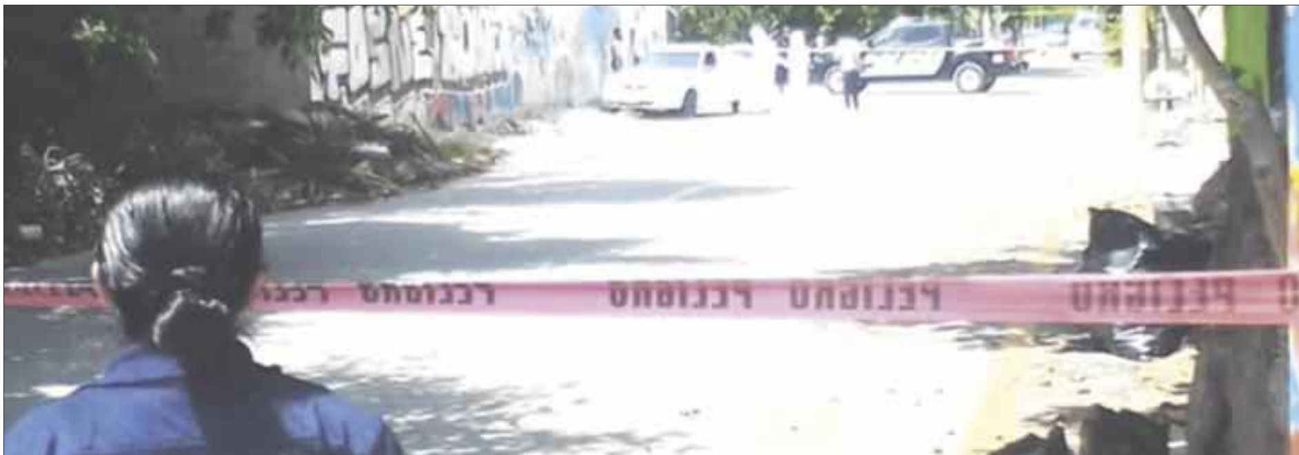
Al llegar la policía, procedió a la revisión y encontró ambos cadáveres por lo que acordonaron el lugar, en espera de las autoridades correspondientes.

Uno de los cuerpos estaba en la parte trasera del auto con heridas provocadas por arma de fuego y el otro estaba oculto en la cajuela del vehículo, que llamó la atención de las personas por estar mal estacionado.