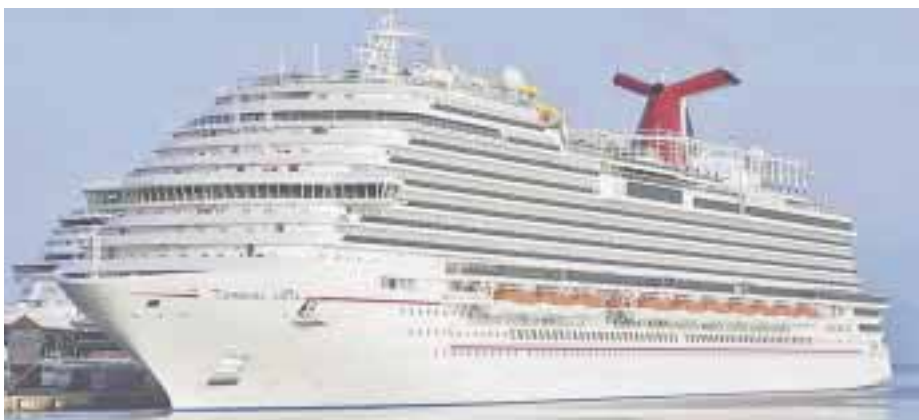
El 3 de julio empezará a navegar.

victoriagprado@gmail.com Twitter: @victoriagprado