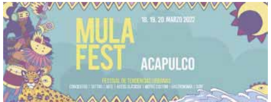
El Mula Fest, una vez más de España a México.

- El Consejo Mundial de Viajes y Turismo lanzó nueva campaña para motivar a los viajeros