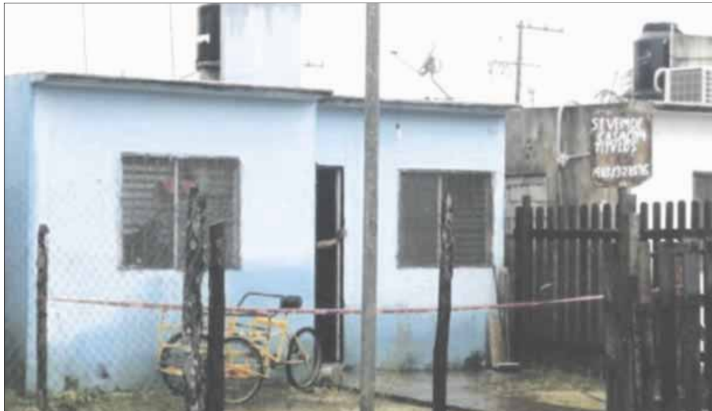
Escapa por la puerta falsa un hombre de aproximadamente 35 años en la colonia Caribe.

El cuerpo quedó a disposición del Servicio Médico Forense (Semefo) para la autopsia de ley.