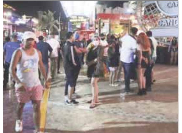
La gente se ha desentendido de los protocolos de prevención frente al Covid-19 y han protagonizado aglomeraciones en todos lados.

De la misma manera, es muy común ver no sólo a los menores de edad expuestos a las aglomeraciones entre las calles de los tianguis, sino que también muchos adultos no tie-