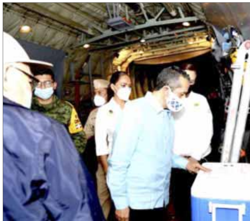
Las gestiones del gobernador Carlos Joaquín ante el gobierno federal para destinar vacunas anti-Covid al sector turístico fueron constantes y desde diversos foros.

El titular del Ejecutivo estatal advirtió que la falta de aplicación de vacunas podría frenar la recuperación de la actividad turística, en tanto que hacerlo más rápido daría más confianza a los mercados