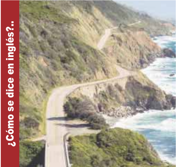
¿Cómo se dice en inglés?..