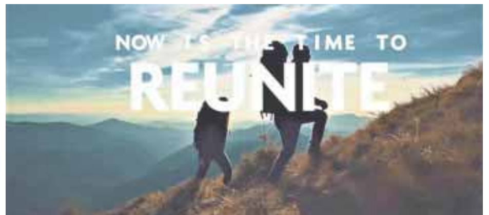
La nueva campaña del Consejo Mundial de Viajes y Turismo.