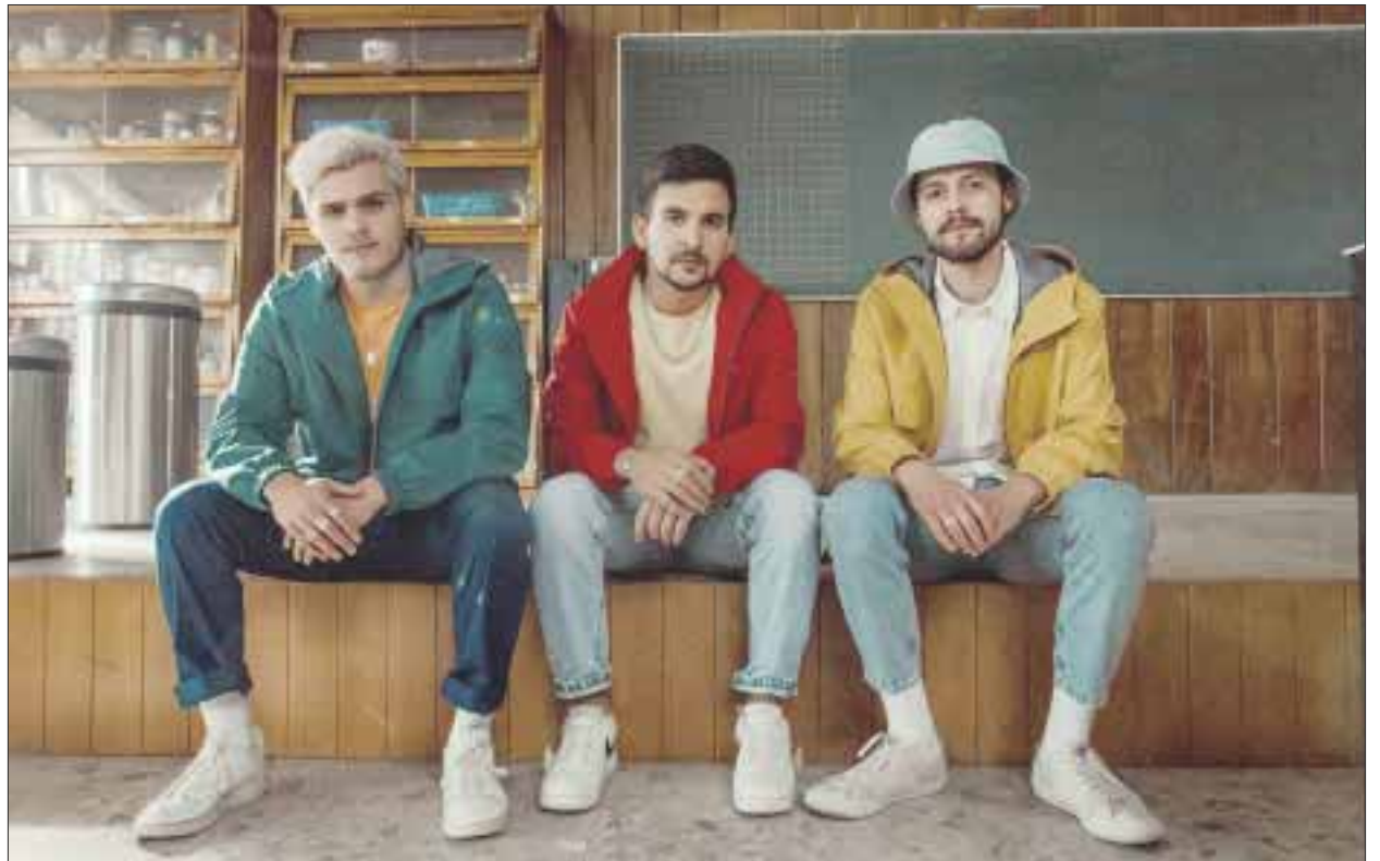
Fran se unió a Caztro para presentar su más reciente sencillo en el que se alejan un poco del sonido rock que los ha caracterizado.

Estamos bien contentos por que fue muy rápido, cada uno hizo su chamba, en una hora teníamos la canción terminada, decidimos maquetarla enseguida, guitarra, bajo, voces, le dijimos a Caztro que grabara un pedacito y fue