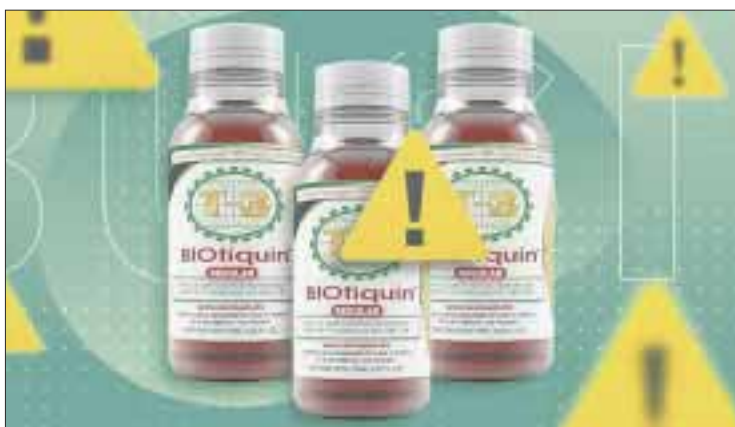
Cofepris advirtió que el producto “Biotiquín” no cuenta con registro sanitario, ni estudios que avalen su seguridad o eficacia contra Covid-19.