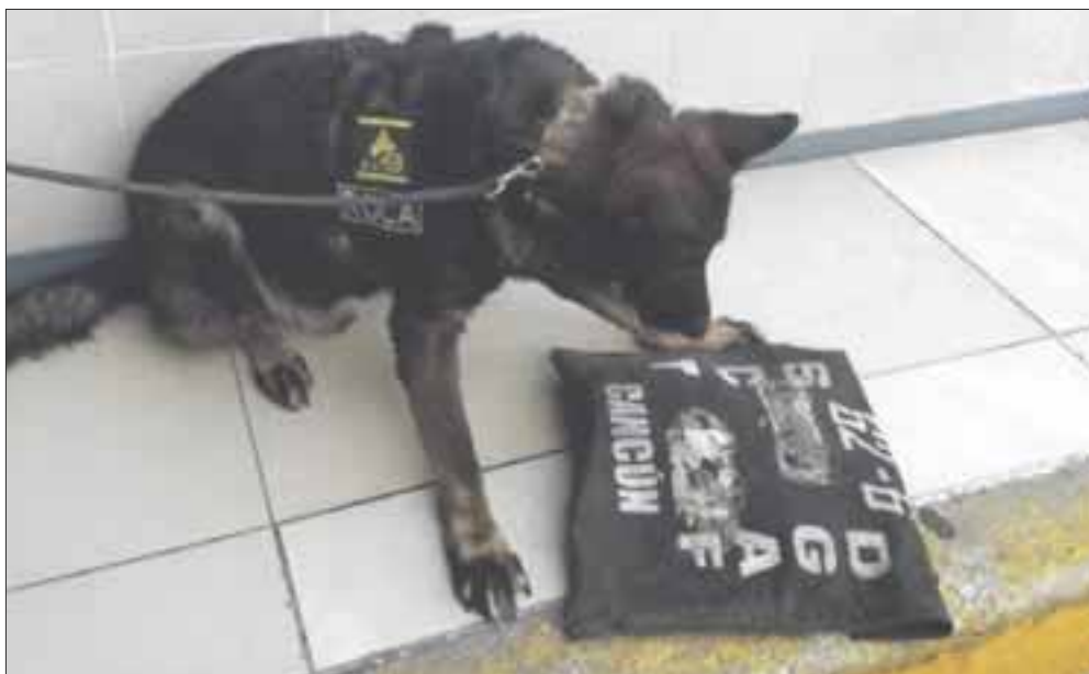
Detecta un binomio canino , de Seguridad Pública Municipal, un paquete con droga en la terminal de Autobuses de Oriente de la Quinta Avenida.

Playa del Carmen.— un binomio canino de la Secretaría de Seguridad Pública Municipal detectó un paquete con droga, en la terminal de Autobuses de Oriente, en la Quinta Avenida.