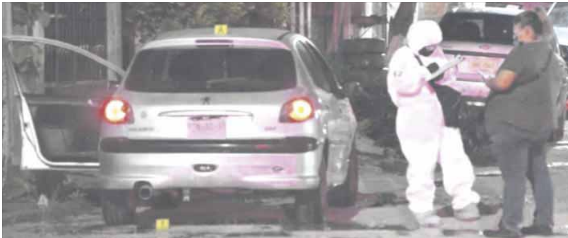
La Fiscalía General del Estado aseguró un vehículo estacionado en la Supermanzana 234 en el que encontraron en su interior un arma larga y una corta.

De acuerdo a los hechos, personas armadas rafaguearon la fachada del bar, ubicado en la avenida Chac Mool, hiriendo a dos meseras y al parecer también a un hombre, que recibió un rozón, por lo que se trasladó al Hospital General de Cancún por sus propios medios.