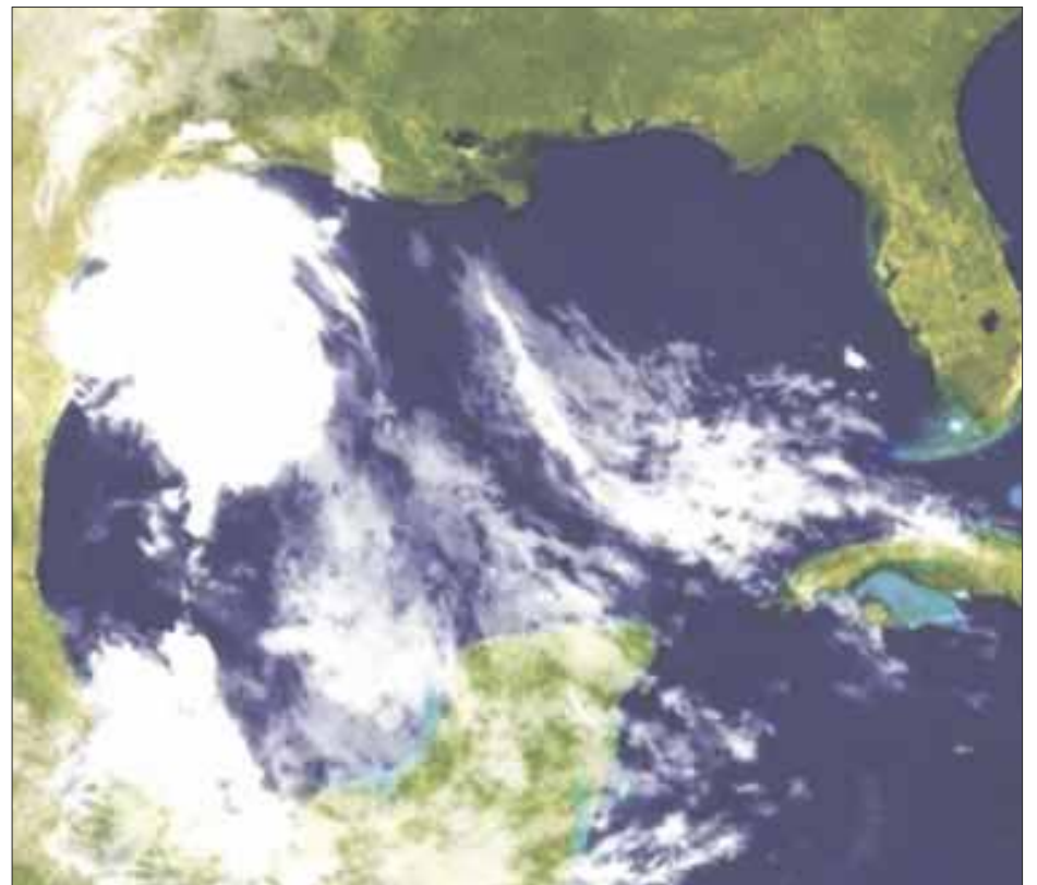
La depresión tropical número dos se convirtió en la tormenta tropical “Bill”, pero sin riesgo para Q. Roo.

1.- Permanecer alertas a los avisos y recomenda-