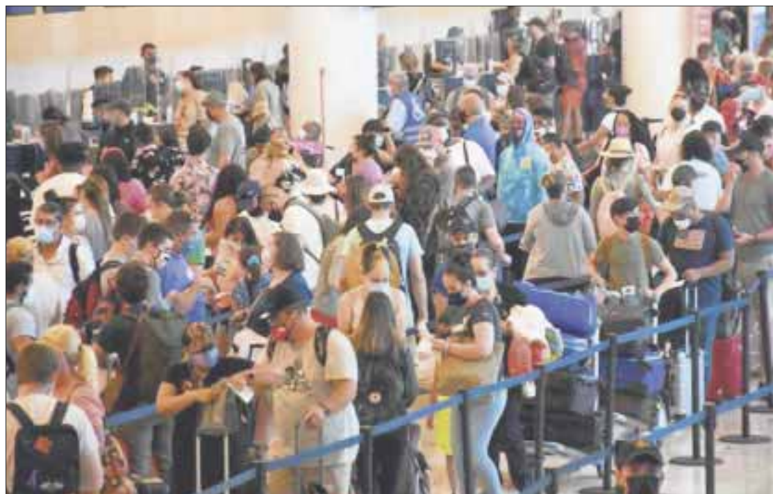
Miles de turistas nacionales e internacionales continúan llegando al Aeropuerto Internacional de Cancún sin restricción alguna.

Asimismo, dijo que se han implementado revisiones propias por parte de la dependencia y se ha detectado que la infracción más recurrente es el