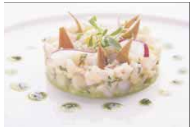
Ceviche de mariscos.

"Desde la Asociación Nacional de Municipios Turísticos, pusimos ejemplo de las medidas que permiten avanzar en la re-