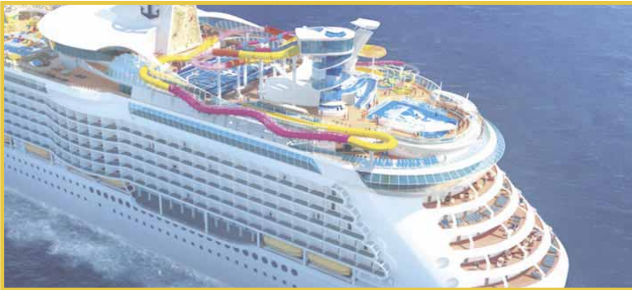
El Adventure of the Seas de Royal Caribbean arribará hoy a la Isla de Cozumel, en el tan esperado regreso de los cruceros.

Tras la reanudación de actividades de los cruceros en el Caribe mexicano, la primera mega embarcación será recibida hoy en la Isla de Cozumel, bajo los más estrictos protocolos de seguridad sanitaria, a fin de evitar contagios por el nuevo coronavirus.