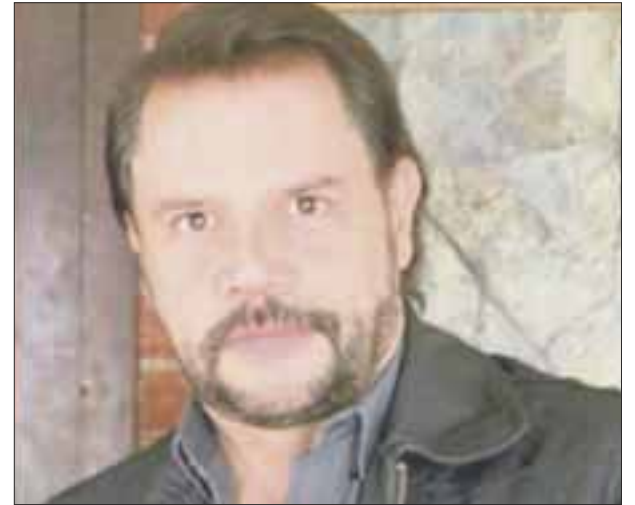
Agentes de la Policía de Investigación de la FGJCDMX lograron la aprehensión del actor Héctor Parra en las calles de la colonia General Anaya.