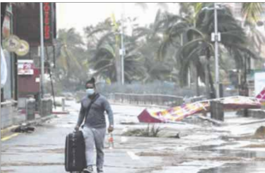
La Coordinación Nacional de Protección Civil presentó cinco puntos a seguir en caso de suscitarse un huracán.

De acuerdo a información del SMN, la depresión tropical número dos de esta temporada, se intensificó y se convirtió en la tormenta tropical “Bill”, la cual ha ganado fuerza durante las últimas horas en el Océano Atlántico.