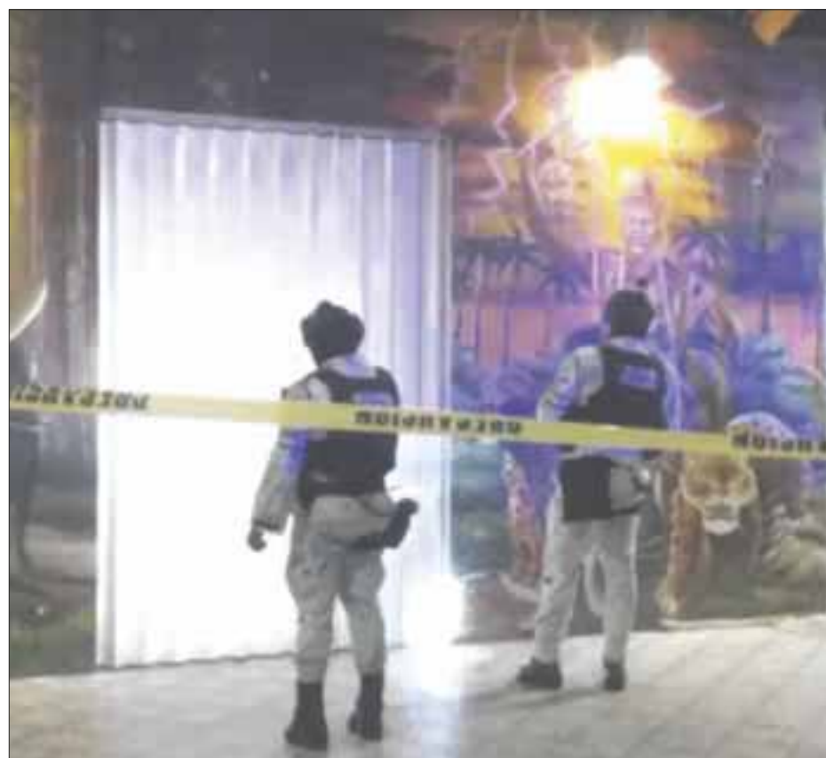
Dos mujeres resultaron lesionadas en el ataque armado al Bar Xtabay, negocio ubicado en la Supermanzana 219.

Las autoridades informaron que realizan la investigación correspondiente a fin de descartar que se trata de dos hechos diferentes.