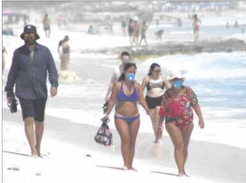
López-Gatell, subsecretario de Salud, confirmó que hay seis estados que presentan un aumento de casos Covid-19, entre ellos Quintana Roo.

López-Gatell señaló que se trabajará en los seis estados que han presentado crecimiento de contagios, para que haya una respuesta inmediata en cada una de las regiones, finalmente, pidió a la población mexicana que solicite atención médica de manera temprana en caso de presentar síntomas como fiebre, tos, dolor de garganta, dolor de cabeza y fatiga crónica, primero para que reciban el tratamiento adecuado y segundo para que en caso de tener Covid-19 no contagien a más personas.