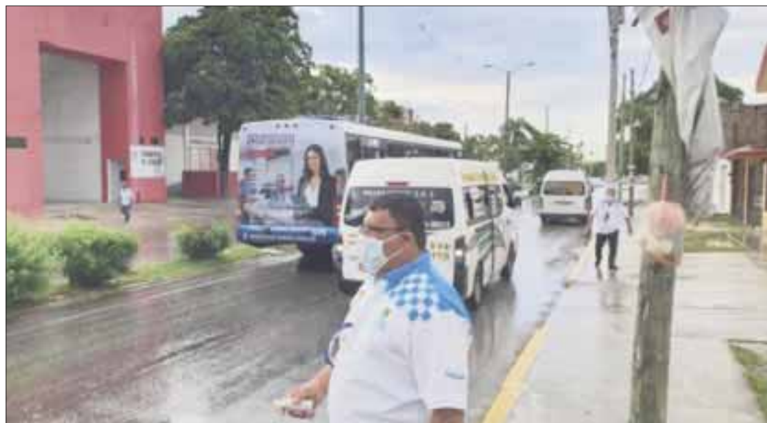
La Dirección de Transporte y Vialidad en Cancún informó que siguen las verificaciones en el servicio de transporte público para que se respeten protocolos.

Los horarios se pueden consultar en las redes sociales de la Secretaría de Salud estatal o bien ingresando a la página web donde además se puede realizar un registro para que se les indique el lugar donde les corresponde acudir a recibir el inmunológico.