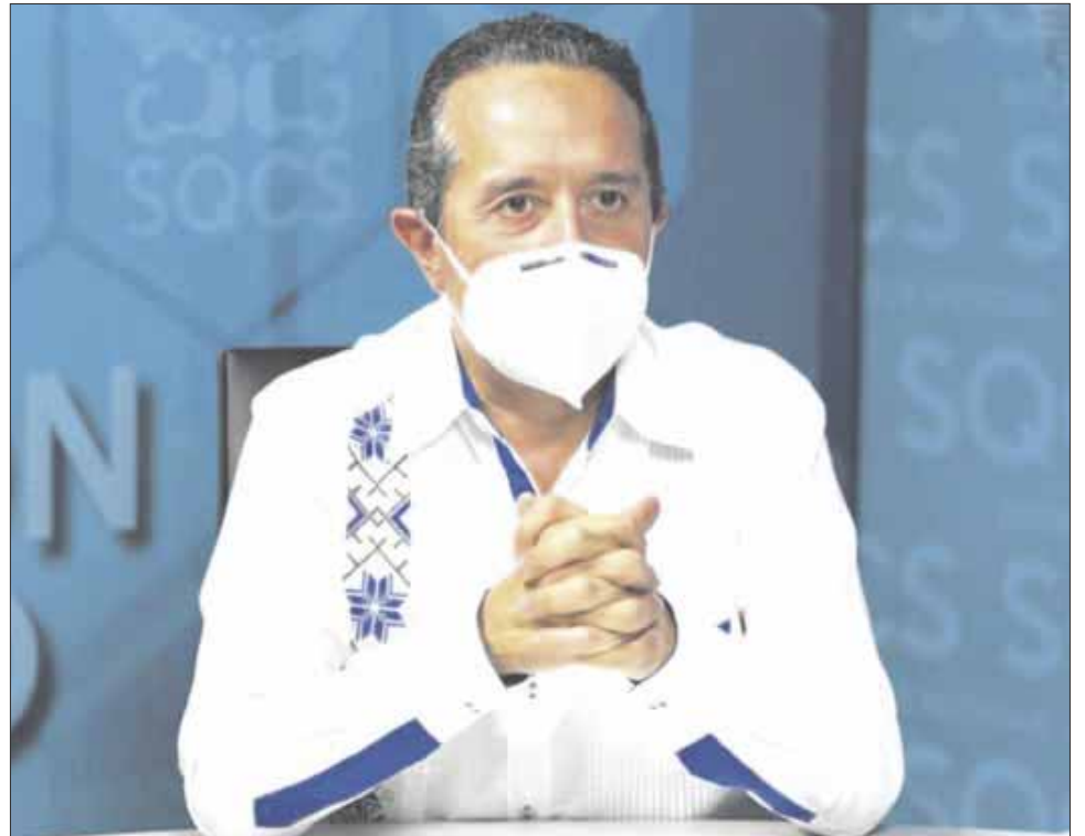
El gobernador Carlos Joaquín privilegia el manejo honesto de los recursos, de manera transparente.

El estudio titulado “Crece deuda estatal por pandemia”, reconoce al gobierno de Quintana Roo por presentar una reducción del 3.8% de sus pasivos de largo plazo; lo que implicó, una reducción de la deuda pública durante 2020.