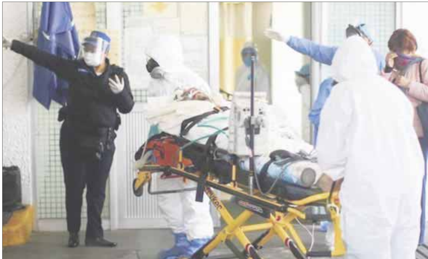
Ayer 15 de junio, se confirmaron 138 positivos más a Covid-19 y solo 2 muertes por Covid-19.

En cuanto a los casos activos, se actualizó que hasta ayer eran un total de 1 mil 983, de los cuales 1 mil 729 están en aislamiento social, enfrentando