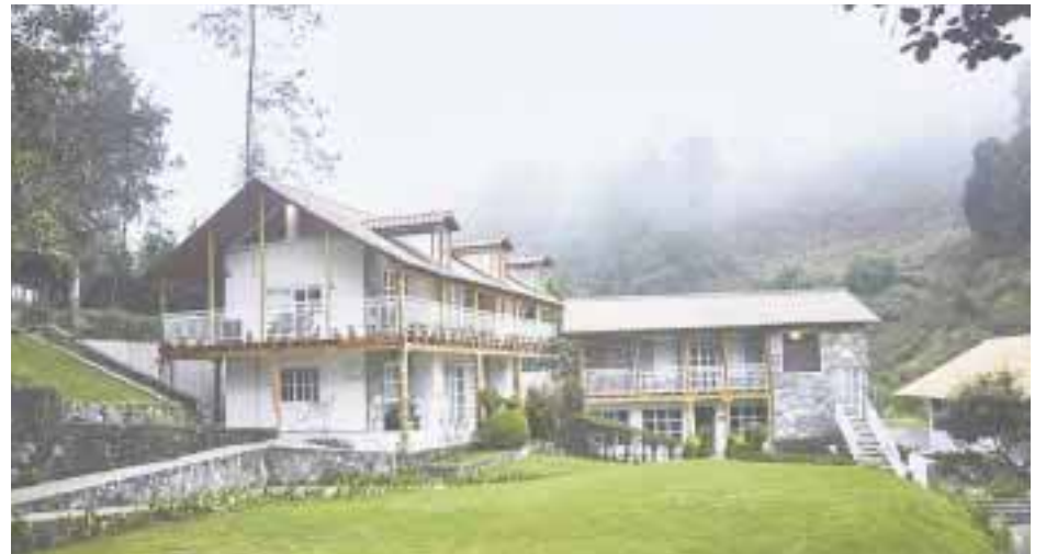
En la finca La Concordia.

De los participantes está el restaurante Almara, con su espléndida cocina mexiterránea y participa con excelente menú Amuse-Bouche (elección del