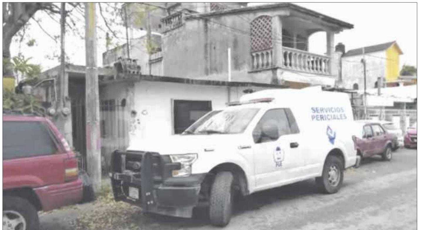
Un hombre de 72 años de edad se colgó con su hamaca al interior de su domicilio en la Supermanzana 102.

La Policía Quintana Roo y agentes ministeriales realizaron el procedimiento de rigor, en tanto elementos del Servicio Médico Forense (Semefo) procedieron a levantar el cuerpo y trasladado a la morgue, a fin de realizar la necropsia de rigor.