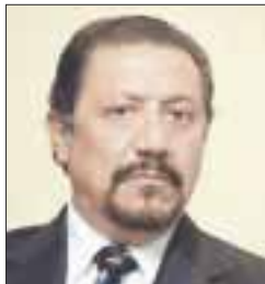
Por Sócrates A. Campos Lemus