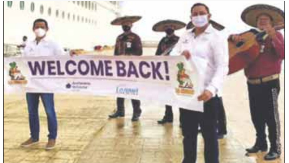
Este miércoles llegó la primera embarcación de Royal Caribbean International, proveniente de Bahamas.

El gobernador especificó que la empresa naviera dividió en dos grupos a los pasajeros: vacunados y no vacunados. El 95 por ciento de los pasajeros están vacunados con esquema completo, mientras que los no vacunados, que son aproximadamente 150 personas (menores de 12 años y personas con alguna condición de salud), presentan prueba negativa PCR máximo de 3 días antes de abordar, además de que les realizan una prueba