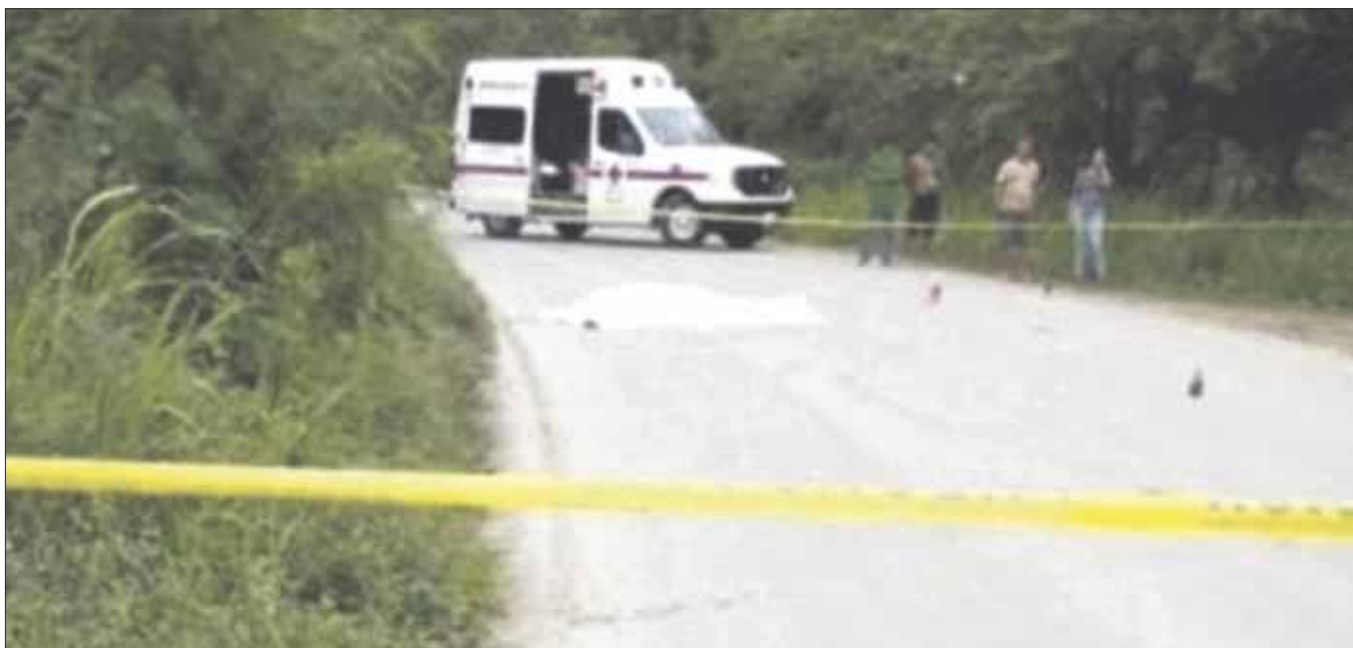
Hallan el cuerpo de un hombre baleado en las inmediaciones de la comunidad Álvaro Obregón, en la ribera del Río Hondo.

Chetumal.- Encuentran el cuerpo de una persona del sexo masculino baleada en las inmediaciones de la comunidad Álvaro Obregón, en la ribera del Río Hondo, que presentaba heridas de arma de fuego, con entrada en el pecho y cabeza.