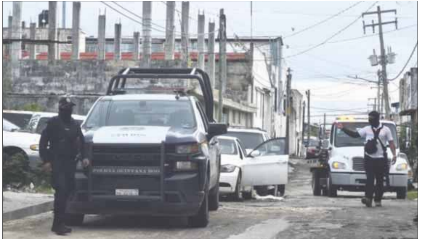
Agentes ministeriales recuperaron en el taller “deshuesadero” en la Región 92, el cruce de las calles 34 con la 89, cuatro autos robados.

La zona fue acordonada para dar paso al personal de la Fiscalía General del Estado, agentes de la Policía Estatal y personal de grúas para realizar el procedimiento para retirar los vehículos asegurados, como parte de esta diligencia de recuperación de unidades robadas.