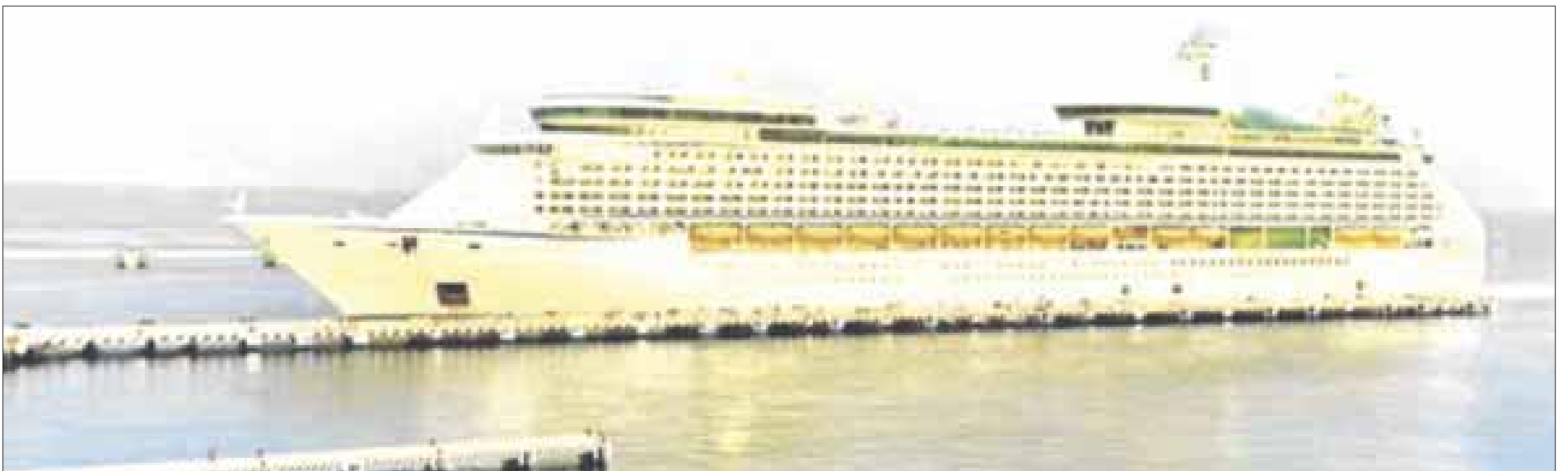
El Adventure of the Seas partió ayer mismo con sus mil 68 pasajeros para continuar con su itinerario de siete días en el mar.

A principios de la pandemia, Royal Caribbean promovió la creación de un grupo conformado por médicos, científicos, expertos en salud pública, bioseguridad, epidemiología, hotelería y operaciones marítimas reconocidos a nivel mundial, denominado Healthy Sail Panel, para establecer protocolos de salubridad sólidos para una pronta reactivación de la industria.