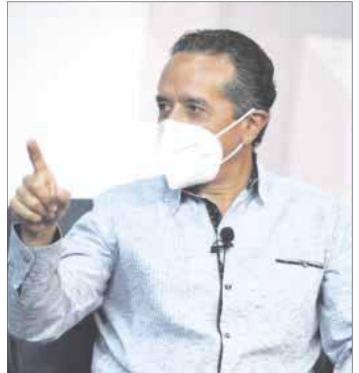
El gobernador Carlos Joaquín explicó que se han reforzado algunas acciones para proteger a la gente, ante el repunte de Covid.

Se ha incrementado la supervisión en el transporte público, como parte de las medidas que permitirán evitar ir al color rojo en el Semáforo Epidemiológico Estatal