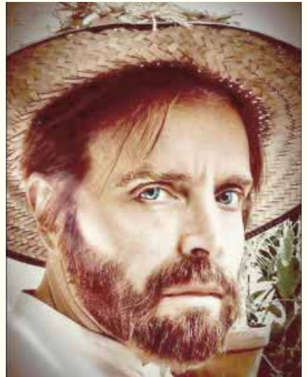
El actor y productor mexicano también viajó por Europa durante un mes ex profeso para este proyecto, visitando los lugares donde vivió el post impresionista holandés.

Finalmente nos cuenta de la función en línea que ofrecerá de la obra de teatro, en el mar-