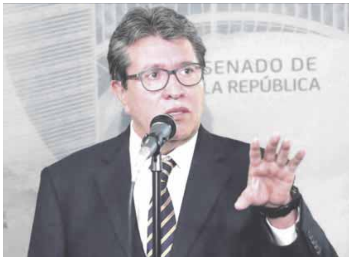
El senador zacatecano Ricardo Monreal.