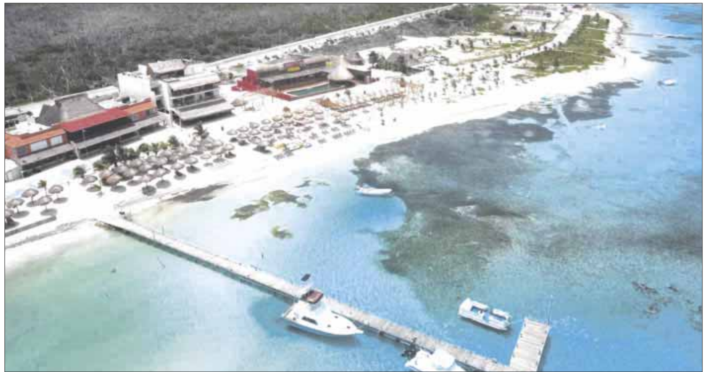
La Grand Costa Maya, al sur de Quintana Roo, enfrentará la suspensión de la energía eléctrica en Mahahual y Xcalak durante cuatro días.

Apenas la semana pasada, en la madrugada del domingo el servicio eléctrico se interrumpió