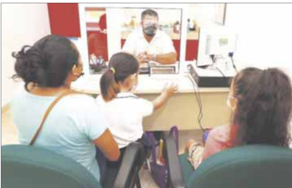
En el QRIQ , se atiende a niñas, niños, jóvenes, adultos y adultos mayores con algún tipo de discapacidad o en riesgo de presentarla.

Chetumal.- Como parte de los compromisos de la Presidenta del Sistema Estatal DIF Quintana Roo, Gaby Rejón de Joaquín de que la Institución ofrezca servicios de atención de calidad con calidez, a través del Centro de Rehabilitación Integral de Quintana Roo (CRIQ) se ofrecen valoraciones de especialidades y de rehabilitación a la población en situación vulnerable, siguiendo los protocolos de sanidad por el Covid-19.