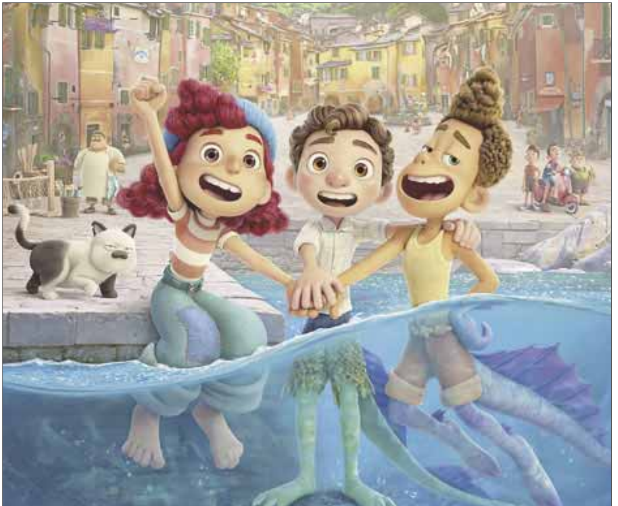
"Luca" recurrirá a un conocido tópico narrativo para desplegar una metáfora sobre el sentirse diferente

Habilidad que le permitirá explorar otro modo de vivir. En un mundo cazador de monstruos marinos pero, también, en un mundo anhelable,