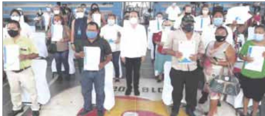
El gobernador Carlo Joaquín inició la entrega de títulos de propiedad para abatir rezagos que afectaron a las familias.

Para ello, a través de la Secretaría de Desarrollo Territorial Urbano Sustentable (Sedetus), se puso en marcha el programa de titulación, con acuerdos para que las familias puedan concluir sus trámites, como estímulos fiscales por el derecho de inscripción ante el Registro Público de la Propiedad, la dispensa del 100 por ciento de intereses moratorios y el subsidio del 100 por ciento por concepto de pagos de titulación para beneficiarios de la Sedetus.