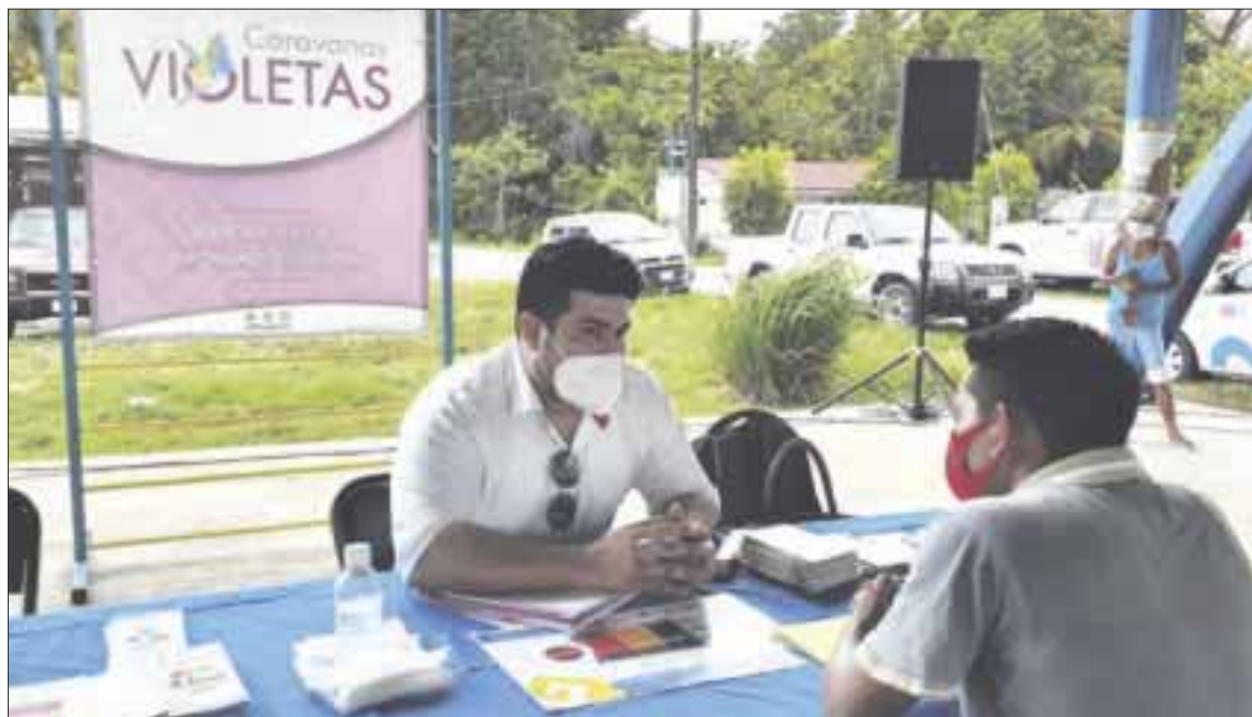
En su segunda edición, llega a la comunidad de Miguel Hidalgo, en Bacalar, el programa Caravanas Violetas

Bacalar.- Con el objetivo principal de atender a mujeres, niñas y niños de comunidades indígenas y rurales del estado, se llevó a cabo la segunda edición de las Caravanas Violetas en la comunidad de Miguel Hidalgo municipio de Bacalar, donde se atendieron a un total de 310 habitantes de las cuales 182 son mujeres, con 579 acciones.