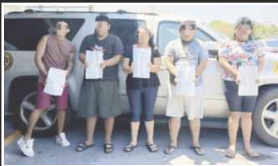
Secuestradores de empresario hotelero yucateco que apareció muerto en Cancún.