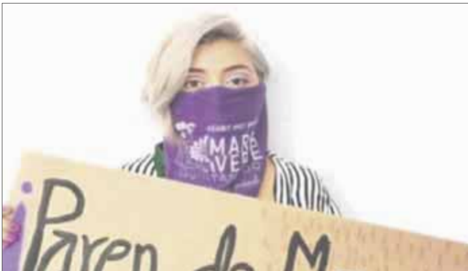
Feministas quintanarroenses han solicitado mayor protección contra las mujeres en el estado.

Mujeres han denunciado que llegan a tardar hasta seis horas en interponer una denuncia por delito sexual, no obstante, las autoridades argumentan que es un tiempo suficiente para garantizar que se pueda obtener el mayor número de pruebas y garantizar un proceso correcto.