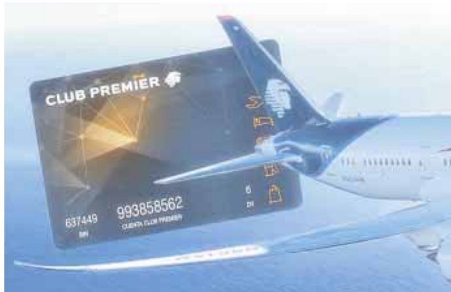
Ambas empresas firman convenio.

☆☆☆☆ En América Latina (AL) la contribución del sector de viajes y turismo al PIB de la región registró pérdida superior a 41 por ciento, derivado de la crisis sanitaria y se contabilizó pérdida de 4 millones de puestos de trabajo en la industria turística