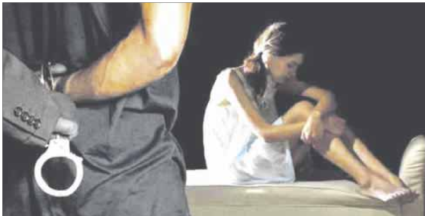
Víctimas de delitos sexuales, principalmente mujeres, han denunciado que llegan a tardar hasta seis horas en interponer una denuncia.

Recordemos que el Código Penal del Estado de Quintana Roo indica que es considerado un delito de violencia sexual cuando se vulnera el derecho al libre desarrollo de las personas en esta materia, principalmente ocurre cuando se presenta