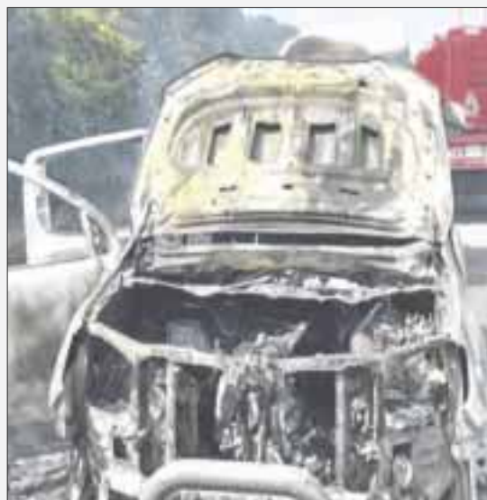
Una camioneta con remolque , donde transportaban un caballo, se incendió sobre la carretera Bacalar-Felipe Carrillo Puerto, a la altura de la comunidad de Buenavista.

Chetumal.— Una camioneta Ford Ranger con placas de circulación TB2671H con remolque se incendió sobre la carretera Bacalar- Felipe Carrillo Puerto, a la altura de la comunidad de Buenavista, en donde se transportaba un caballo que una persona de la tercera edad, logró sacar y salvar de que muriera quemado.