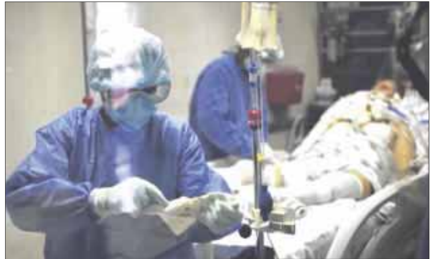
Hasta ayer martes, se habían confirmado 32 mil 616 casos positivos y 3 mil 015 defunciones por Covid-19 en la entidad.

La ocupación hospitalaria para la zona norte es de 34% mientras que en la zona sur es de 13%. Asimismo, la velocidad en el ritmo de contagios en el primero de los casos es de .63