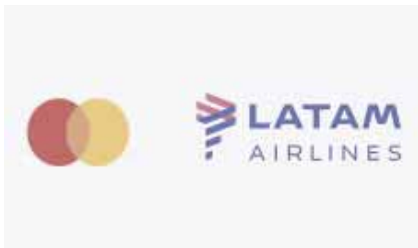
Mayores beneficios para los socios.

cesidades de cada pasajero digitalizando la experiencia de viaje con tecnologías personalizadas, sin contacto y seguras.