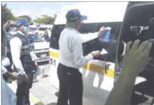
El transporte público es uno de los principales focos de contagio de Covid-19.

Chetumal.- Ante el alza de contagios por la Covid-19 y para evitar regresar al semáforo rojo en el estado de Quintana Roo, el gobierno estatal anunció una estrategia que consta de 10 acciones de inmediata ejecución; entre los puntos se encuentra la supervisión al servicio público de transporte.