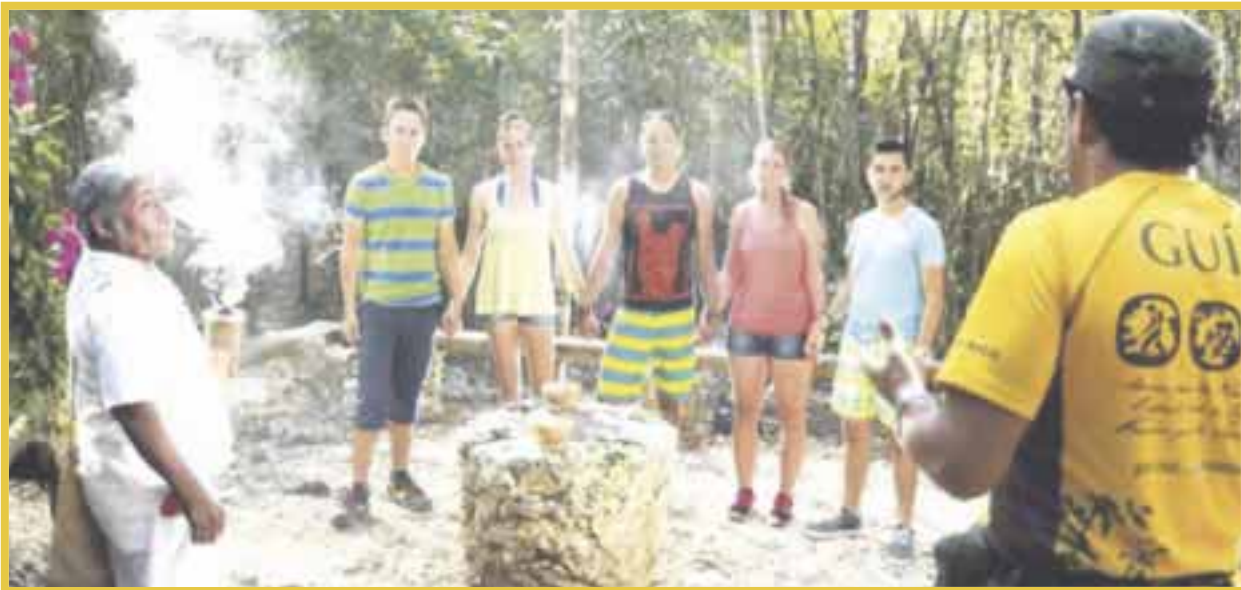
El Tren Maya buscará promover el turismo alternativo en toda la península de Yucatán.

Autoridades turísticas informaron que con la llegada de esta obra insignia del gobierno federal se buscará promover el turismo alternativo, por lo que algunos hoteles deberán abandonar el modo de “todo incluido” para invitar a sus huéspedes a explorar otros puntos del estado.