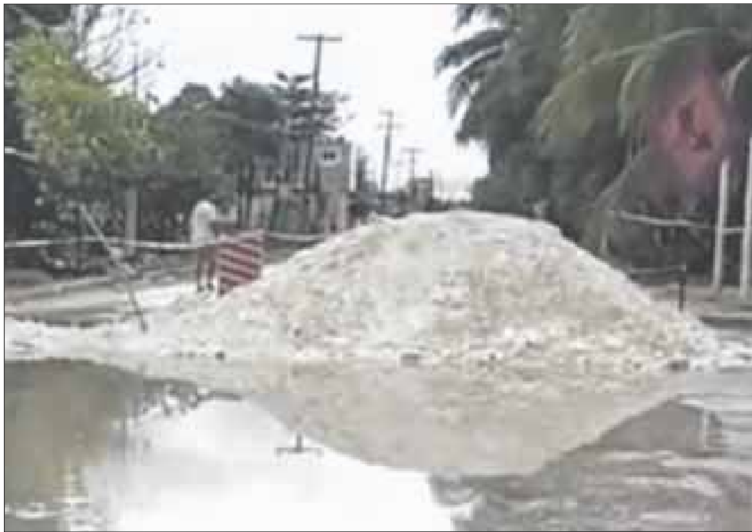
Comité de Pueblos Mágicos de Bacalar denunció que CAPA lleva 4 meses de retraso en sus obras en la costera de este municipio.

Asimismo, a causa de las lluvias, no se tiene certeza sobre cuando seguirán con los trabajos, ya que el mal tiempo paraliza todo. “Hace 15 días, el comité se reunió con directivos de CAPA quienes prometieron darle mayor celeridad a estas obras. Esperemos que cumplan, porque hay muchos problemas”, concluyó.