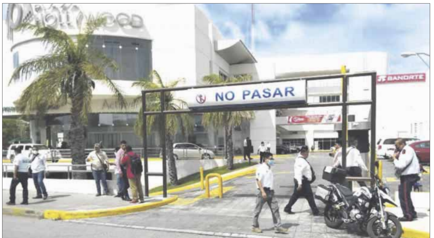
Detienen a un asaltante, luego de una persecución en el estacionamiento de una plaza comercial, sobre la avenida Xcaret.

La captura del presunto delincuente se logró gracias a un operativo, luego que las cámaras de seguridad captaron su imagen, lo que facilitó que lograran ubicar y detener al presunto ladrón, que trasladaron hasta la Fiscalía General del Estado (FGE).