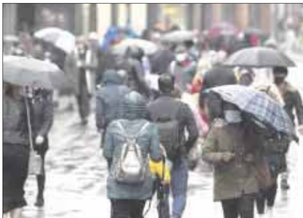
Algunos países bajaron la guardia frente a la pandemia, alertó el director general de la OMS.

Después de siete semanas de reducciones, los casos de Covid-19 vuelven a subir porque algunos países bajaron la guardia frente a la pandemia, alertó el director general de la Organización Mundial de la Salud (OMS), Tedros Adhanom Ghebreyesus.