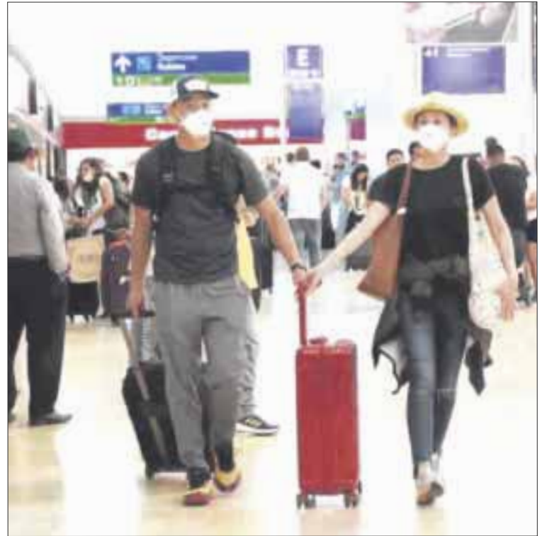
El mandatario estatal, Carlos Joaquín explicó que marzo trae buenas noticias para la reactivación turística con la llegada de nuevas rutas aéreas.

Carlos Joaquín explicó que marzo trae buenas noticias para la reactivación turística con la llegada de nuevas rutas aéreas desde diferentes partes del mundo hacia el Caribe mexicano.