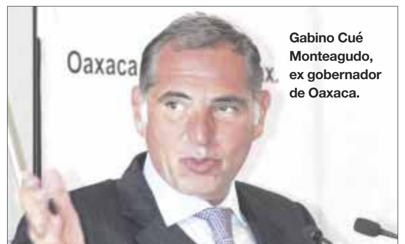
Gabino Cué Monteagudo, ex gobernador de Oaxaca.