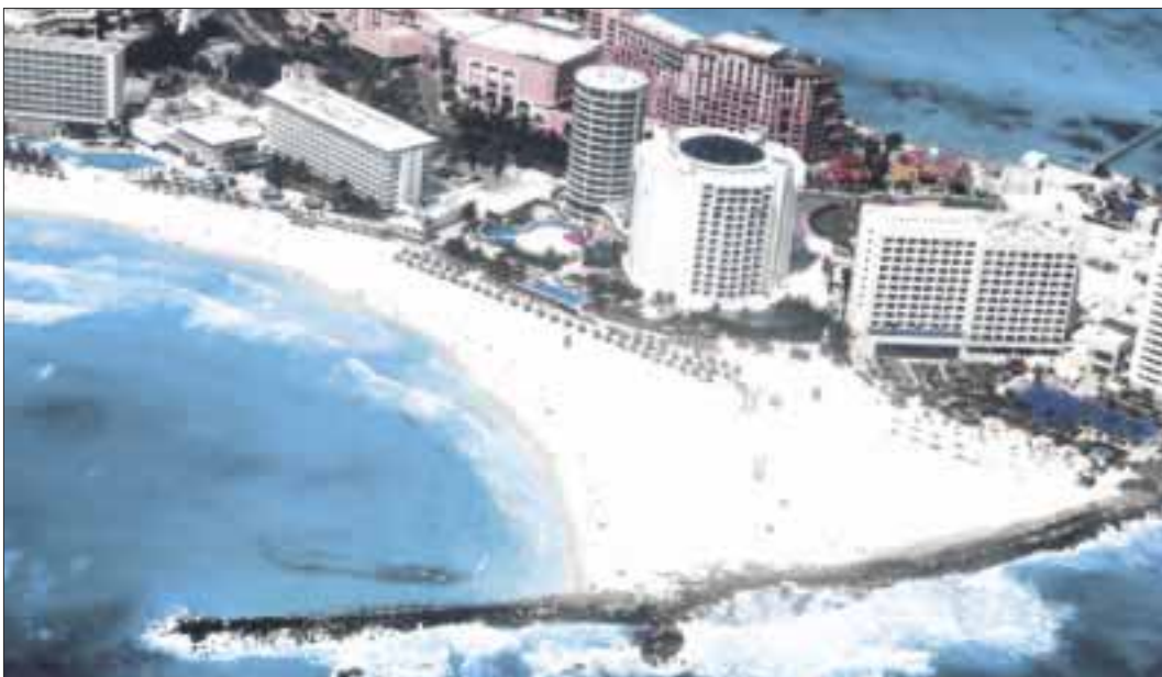
En la administración de Carlos Joaquín se impulsa un gobierno moderno y eficiente, que privilegia el manejo honesto de los recursos públicos.

Chetumal.- Desde el inicio de la administración, el gobernador Carlos Joaquín impulsa un gobierno moderno y eficiente, que privilegia el manejo honesto de los recursos, la transparencia y la rendición de cuentas, como parte de las acciones para combatir la corrupción.