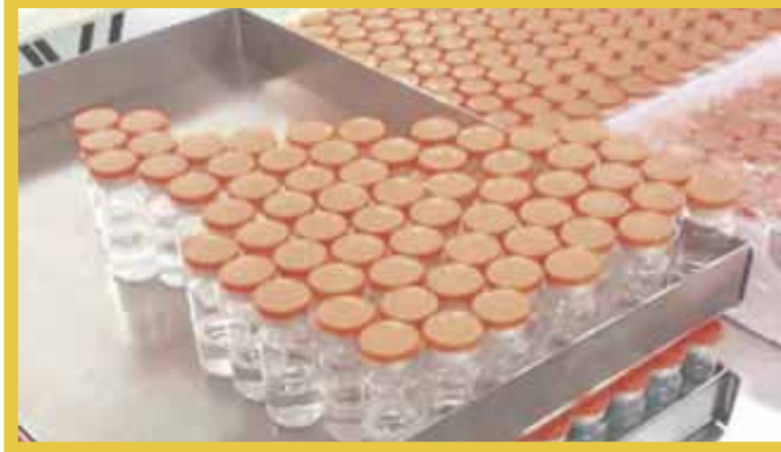
Inició en la planta de Drugmex, en Querétaro, el envasado de la vacuna CanSino.

La empresa mexicana Drugmex es responsable del proceso final de envasamiento de la vacuna CanSino Bio, la cual tiene 65.28 por ciento de eficacia para prevenir todas las enfermedades sintomáticas por covid-19, y de 90.07 a 95.47 por ciento para prevenir un cuadro