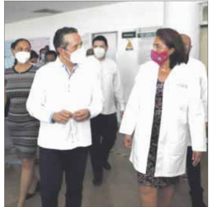
El gobernador Carlos Joaquín explicó que todas las medidas implementadas para la atención de la pandemia permiten hoy estar en color amarillo en el semáforo epidemiológico.

En esta etapa, se está vacunando al personal de salud de primera línea y a las personas mayores de 60 años. En particular, este último grupo poblacional es prioritario.