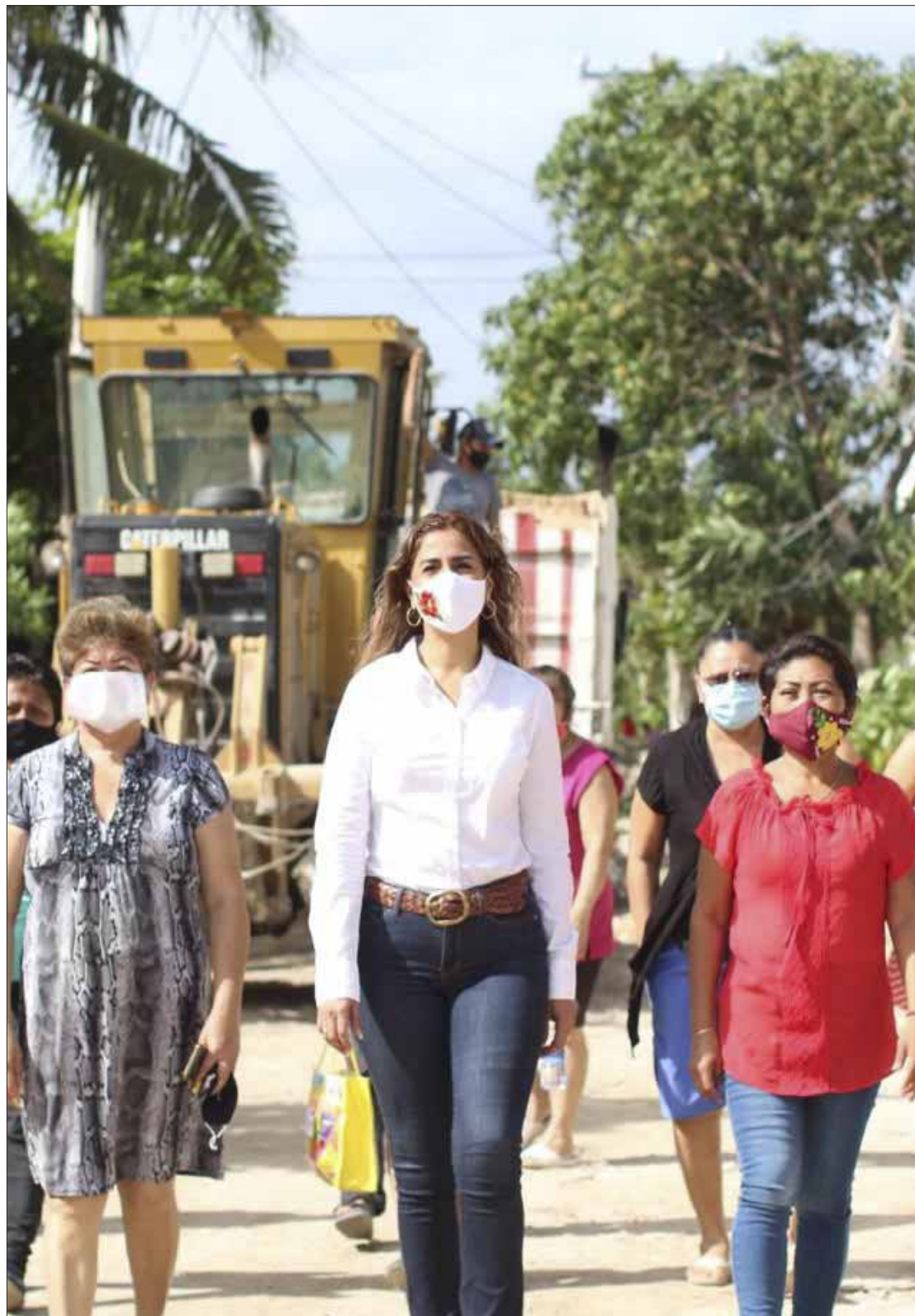
La senadora morenista Marybel Villegas Canché atenderá de tiempo completo su virtual candidatura a la alcaldía de Benito Juárez, Quintana Roo.

Los más recientes sondeos les dan del 60 al 70 por ciento de aprobación a su trabajo y preferencias electorales, pese a lo complicado de la situación, sobre todo por los efectos de la pandemia de la Covid-19.