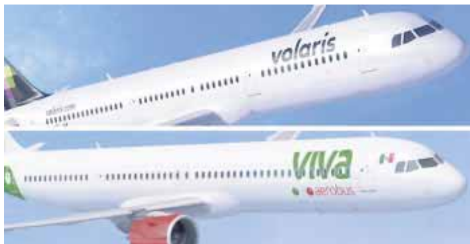
Ambas aerolíneas buscan volar a Colombia.

Actualmente, hay cuatro compañías que operan vuelos directos entre México y Colombia: Aeroméxico, Avianca, LATAM Airlines y Wingo . El portal Simple Flying asegura que antes de la pandemia, Colombia era el mercado de aviación más importante de Sudamérica para los viajeros mexicanos. La Secretaría de Comunicaciones y Transportes (SCT) señala que más de 1,5 millones de pasajeros se transportados en 2019, cifra que se redujo a menos de 30 por ciento en 2020.