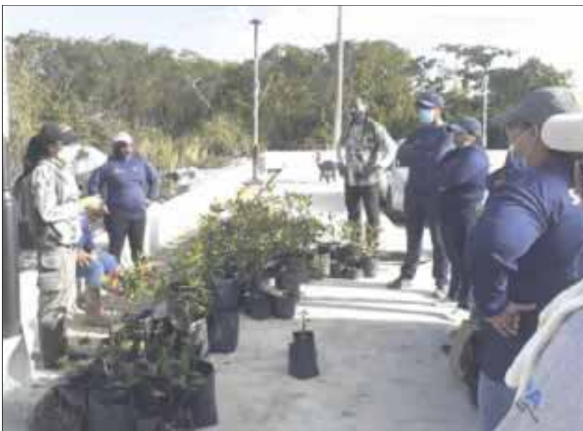
Se plantaron 150 ejemplares de mangle en Laguna Manatí, en la fracción colindante con Puerto Juárez.

Cancún.- Como parte de la estrategia de recuperación ambiental que la administración del gobernador Carlos Joaquín realiza en las áreas naturales protegidas estatales localizadas en el municipio de Benito Juárez, se llevó a cabo la segunda jornada de saneamiento y reforestación de Laguna Manatí, en la ciudad de Cancún.