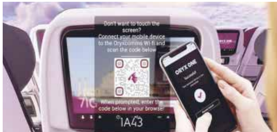
La primera aerolínea Zero Touch .

La Margarita, hecha a base de tequila, es una de las bebidas más famosas en el mundo. De origen mexicano, han surgido diferentes versiones sobre su historia, pero en todas ellas, el común denominador es una mujer de nombre Margarita como protagonista. Muchas son las versiones y quienes quieren atribuirse la creación de este famoso coctel, pero sólo Juárez puede hacerlo con constancia impresa.