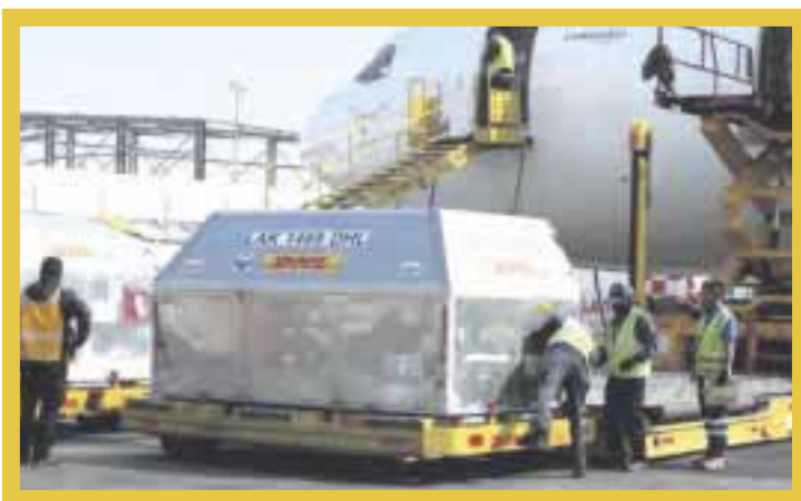
El vuelo 925 procedente de Bruselas, Bélgica, arribó a la plataforma 42 del aeropuerto de la Ciudad de México con las dosis Pfizer.

Este martes, llegó a México otro lote con 852 mil 150 dosis de vacunas contra Covid-19 de la farmacéutica Pfizer-BioNTech procedente de Bruselas, Bélgica, las cuales se distribuirán en 38 municipios urbanos.