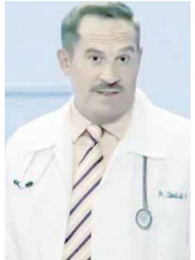
Se estrenará en el segundo semestre de 2021 por “las estrellas” en la barra de comedia “Domingos de Sofía”.

Lo que parecieran buenas noticias en cuanto a que se va a controlar la pandemia por el Covid-19, no lo son, pues Yamarash antecede que “Hay mucha posibilidad de que vengan otras enfermedades, incluso se desataría otra pandemia a finales este 2021, algo completamente diferente al Covid”, concluyó.