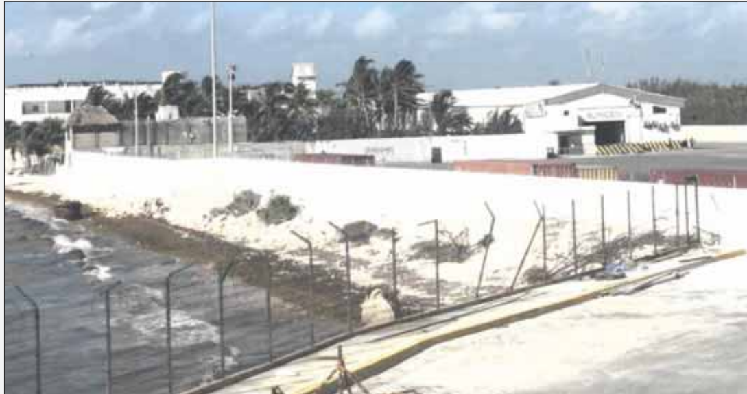
La terminal marítima de Puerto Morelos sufrió daños por los diversos fenómenos meteorológicos que se registraron en 2020.

Puerto Morelos.- Con una inversión de 1,739,559 de pesos, la Administración Portuaria Integral de Quintana Roo (APIQROO) concluyó en la terminal marítima de Puerto Morelos la construcción de un cercado de 160 metros de longitud y dos metros de altura, tras los daños que sufrió por los diversos fenómenos meteorológicos que se registraron en 2020, en Quintana Roo.