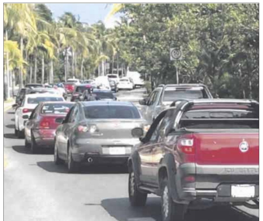
El CCEC exige reunirse con Fonatur para solucionar los problemas viales en la glorieta del kilómetro 1.5 del bulevar Kukulcán, a la entrada de Puerto Cancún.