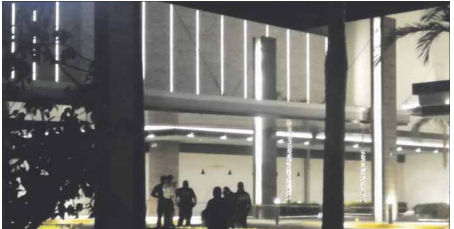
Balean a mujer cuando estaba con su pareja sentimental , en el estacionamiento de Plaza las Américas, en Paseo Central, con avenida Chemuyil.

Al lugar llegaron agentes policiacos y de la Fiscalía General del Estado, empero en la escena del crimen ya no alcanzaron a detener a nadie.