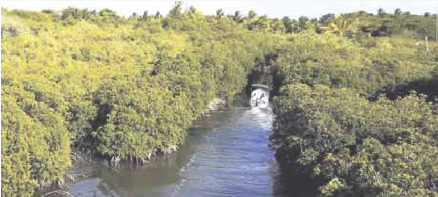
La inversión de recursos por parte del PNUD comenzó para estimular la consolidación del destino turístico MayaKa'an.

En total, el Fondo para el Medio Ambiente Mundial (GEF, por sus siglas en inglés) aportará 1.4 millones de dólares que servirán para la capacitación, promoción y mejora de la oferta del destino ecoturístico de MayaKa'an.