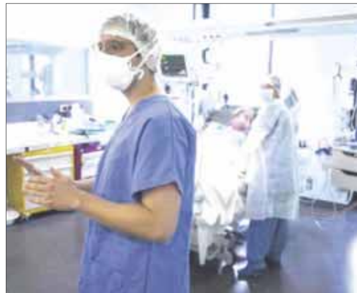
Según el reporte de Sesa, hasta ayer, se habían notificado 2 mil 404 defunciones y 20 mil 202 casos positivos por Covid.

Sobre los casos activos, informaron que hasta ayer eran 871, de los cuales 686 se encuentran en aislamiento social, ya que no presentaron síntomas de gravedad, mientras que los otros 185 si han tenido que ser internados