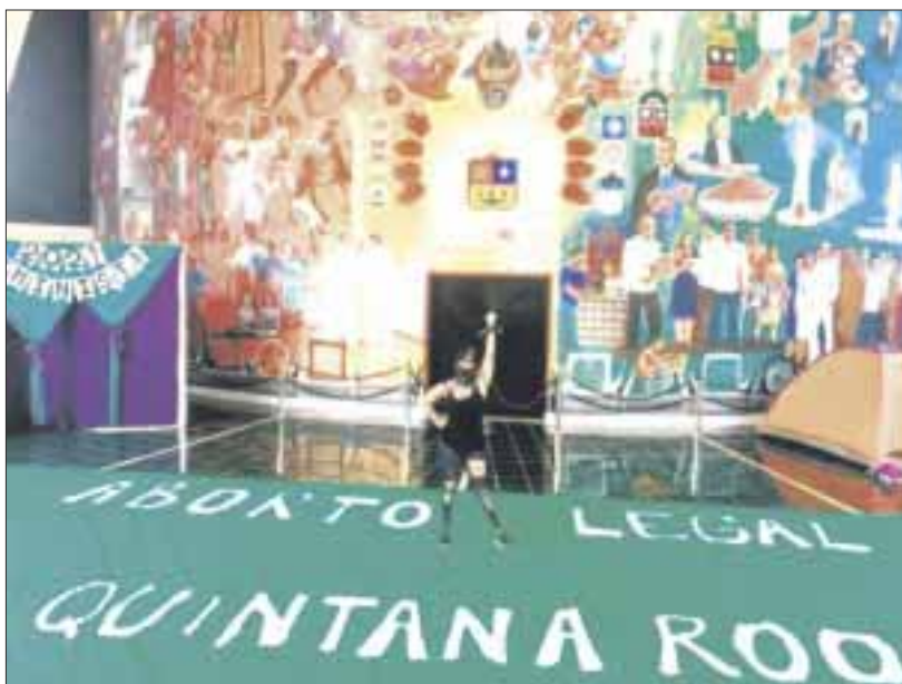
Red Feminista Quintanarroense (RFQ) desalojó el Congreso del estado y adelantó que promoverán un amparo contra rechazo del aborto.

Chetumal.- A 94 días de mantener la toma del Congreso del Quintana Roo en demanda de la dictaminación y votación sobre la despenalización del aborto, la Red Feminista Quintanarroense (RFQ) desalojó el recinto legislativo y adelantó que promoverán una demanda de amparo en contra de la resolución de los diputados.