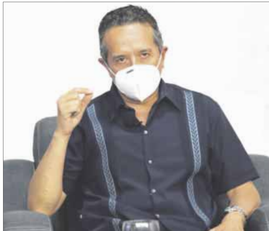
El gobernador Carlos Joaquín exhortó a mantener el equilibrio entre el cuidado de la salud y la reapertura de las actividades económicas.

Carlos Joaquín exhortó a mantener el equilibrio entre el cuidado de la salud y la reapertura de las actividades económicas, con más atención en la aplicación de los hábitos y los protocolos sanitarios.