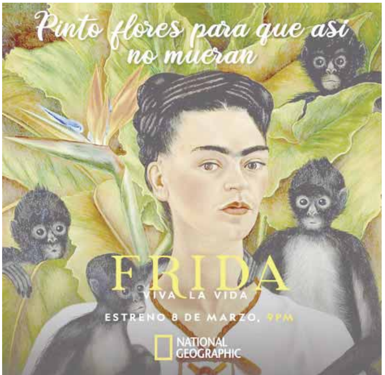
"Frida. Viva la Vida" en National Geographic

16.- "No hablaré de Diego como 'mi esposo', porque sería ridículo; Diego no ha sido jamás ni será "esposo" de nadie. Tampoco como de un amante, porque él abarca mucho más allá de las limitaciones sexuales, y si hablara de él como de un hijo, no haría sino describir o pintar mi propia emoción,