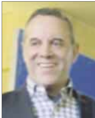
Por José Luis Montañez