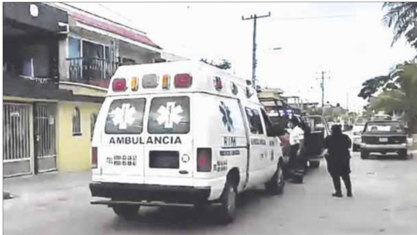
Pistoleros intentaron levantar a un taquero y al oponer resistencia le dan un cachazo en la cabeza.

Una llamada al número telefónico de emergencia 911, alertó a las autoridades de los hechos, y al llegar la Policía de Quintana Roo y agentes ministeriales constataron que intentaron secuestrar al taquero y que estaba herido, luego de asistirlo se realizó un operativo de búsqueda y captura, sin éxito al no encontrar a los sicarios.