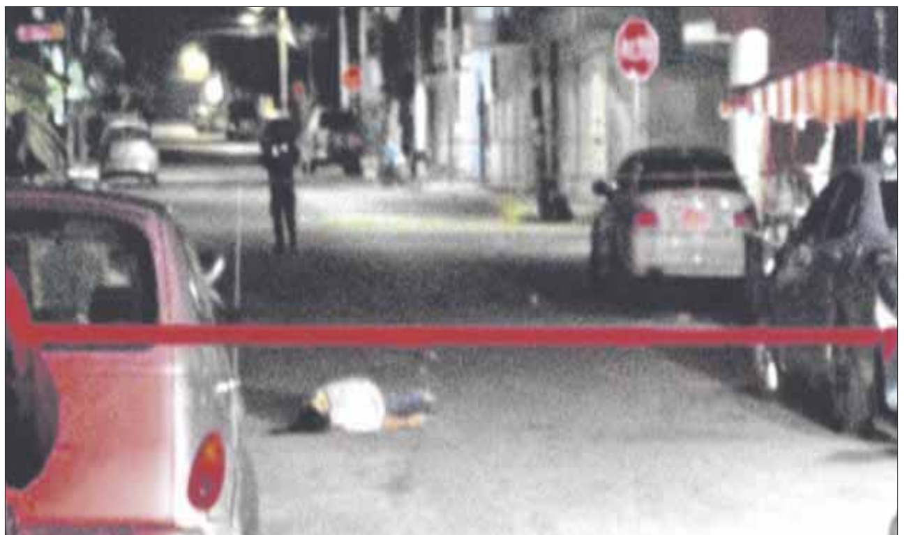
Balacera en Tulum deja como saldo un muerto y cuatro heridos; se presume que uno de los baleados es víctima colateral.

Una vez que llegó la ambulancia, los baleados fueron trasladados de urgencias al hospital general de Playa del Carmen, en donde los médicos diagnosticaron su estado de salud como reservado.