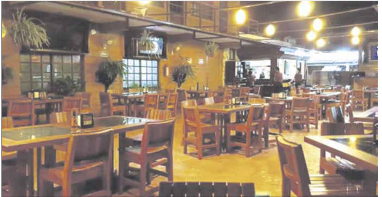
La Canirac de Cancún, Puerto Morelos e Isla Mujeres celebró que varias cadenas de comida decidieron apostar por el Caribe mexicano en 2021.

No obstante, asegura que los establecimientos que quedaron de por vida son los que ahora salen muy fácilmente; en cambio los que son nuevos tratan de generar cosas nuevas para atraer a todo tipo de comensales “Ofrecen otras expectativas, no sólo relacionadas con la comida, como un saxofonista, violinista,