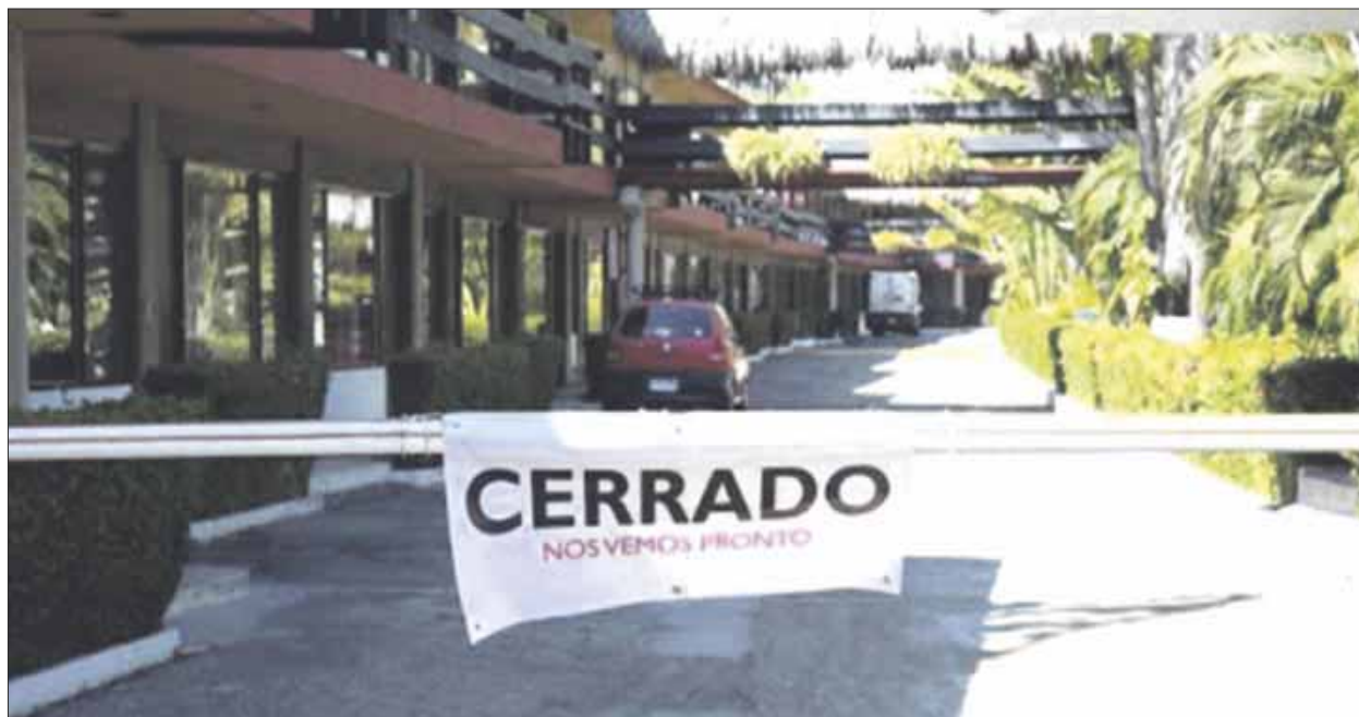
Canaco-Servytur dio a conocer que el 30% de los negocios en Cancún han cerrado debido a la contingencia sanitaria.

La Canaco, en diciembre de 2019 tenía más de 4 mil 500 socios y ahora tienen 3 mil 600, por los socios que han cerrado sus negocios, sin embargo, no pierden la esperanza de que con el tiempo se van a recuperar.