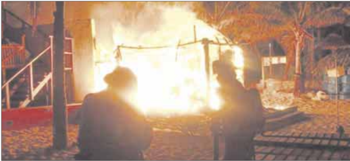
Se incendia un almacén de tanques de buceo en la playa Tortugas de la zona hotelera, en el kilómetro 6.5 del bulevar Kukulkán.

Cancún.— Se incendia un almacén de tanques de buceo en una palapa, que en cuestión de minutos quedó envuelta en llamas, en la playa Tortugas de la zona hotelera, en el kilómetro 6.5 del bulevar Kukulkán.