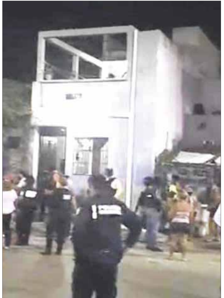
Autoridades no pudieron rescatar a una menor de dos años, pues vecinos los corrieron del lugar a pedradas del Fraccionamiento Villas del Mar Plus.

Empero, el trámite de recuperación, no se pudo concluir por parte de los policías al evitar los vecinos, que se llevaron a la niña al recibirlos a pedradas y con amenazas de lincharlos.