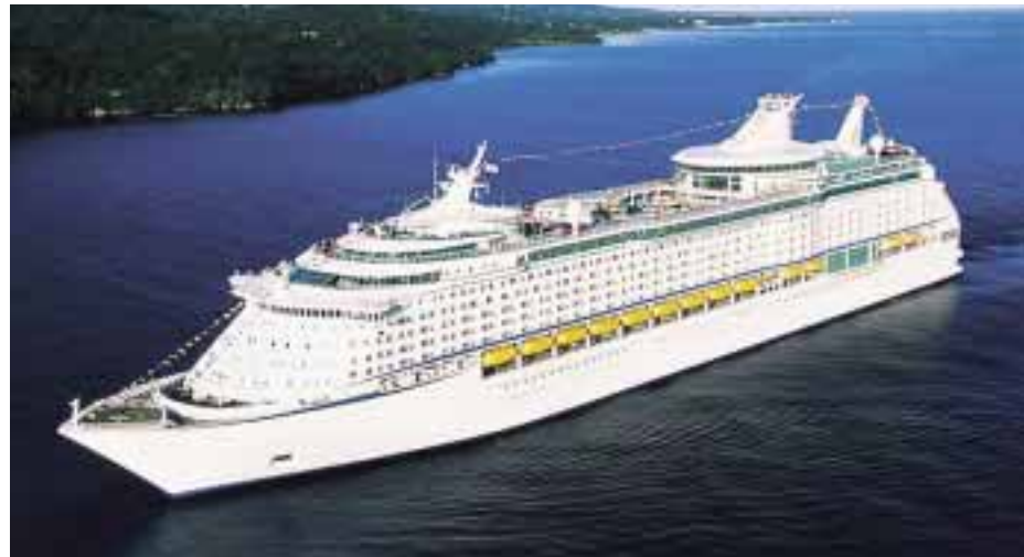
El Odyssey of the Seas .

El alcalde indicó que con el apoyo de la Comisión Federal de Competencia Económica (Cofece), la Secretaría de Comunicaciones y Transporte (SCT) y la Coordinación General de Puertos y Marina Mercante, “se pondrá en marcha este cruce social tras acuerdo con las navieras Winjet y Ultramar , que