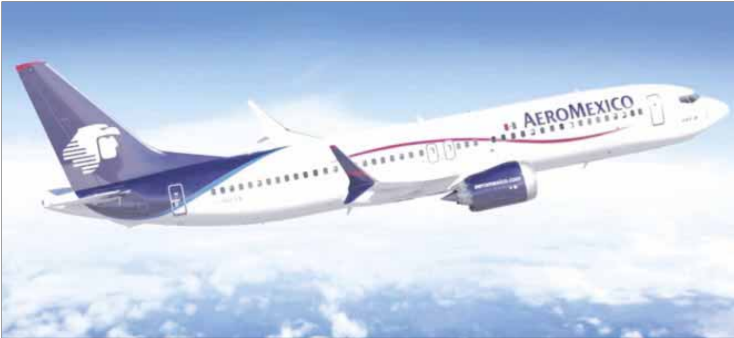
Aeromexico anunció la ampliación de sus vuelos con destino a Chetumal.

Aeromexico comenzó operaciones en diciembre del año pasado con un vuelo diario desde Ciudad de México, sin embargo de frente a las vacaciones de Semana Santa, estará incrementando sus vuelos a 11 frecuencias a la semana.