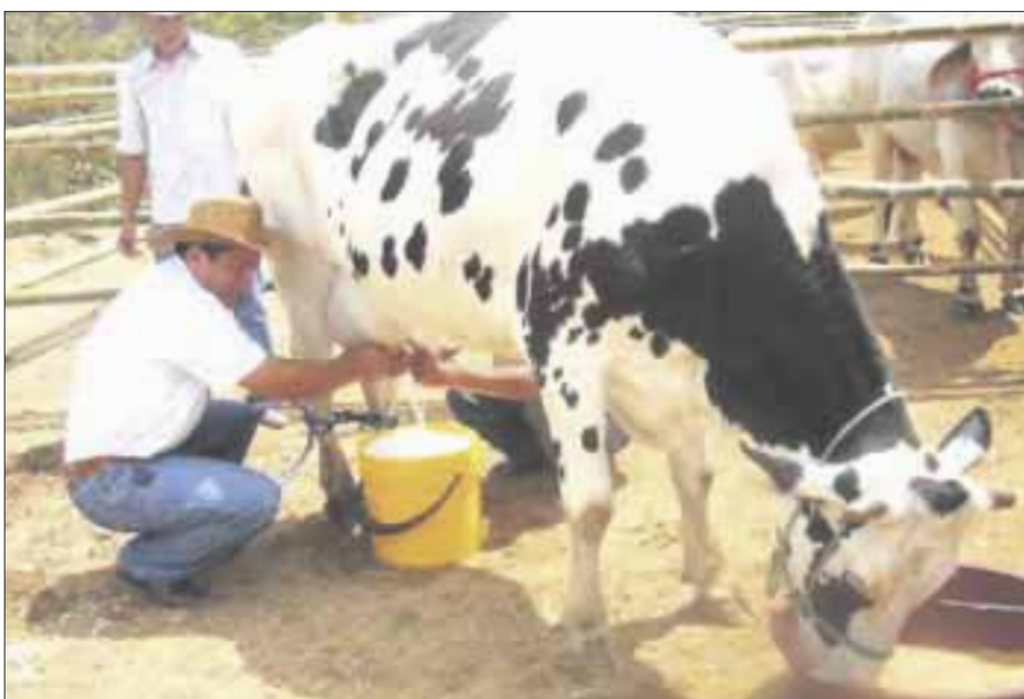
Lecheros de Chetumal ganan menos de lo que invierten en la producción de este alimento.

Industriales de la Masa y la Tortilla trabajan para lograr que el consumidor regrese a sus establecimientos a comprar en el mostrador y no a través de intermediarios, ya que muchas tortillerías se han visto afectadas económicamente.