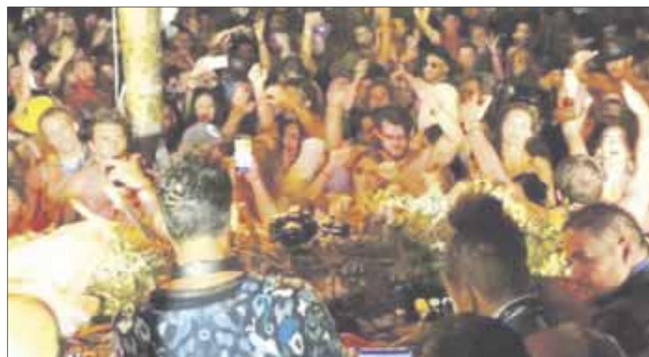
La Dirección Estatal de Prevención contra Riesgos Sanitarios (Cofepris) confirmó que ha suspendido 64 fiestas y reuniones clandestinas.

“No se puede realizar ningún evento con un aforo mayor sin la realización de pruebas de antígenos a todos los participantes, con máximo 48 horas de anticipación. Hay que recordar que en lugares cerrados el aforo es de 30% y en abiertos hasta el 50%. Asimismo, los establecimientos tienen un horario máximo de las 12 de la noche para retirar a las personas y trabajadores con el fin de evitar el incremento de contagios”, explicó.