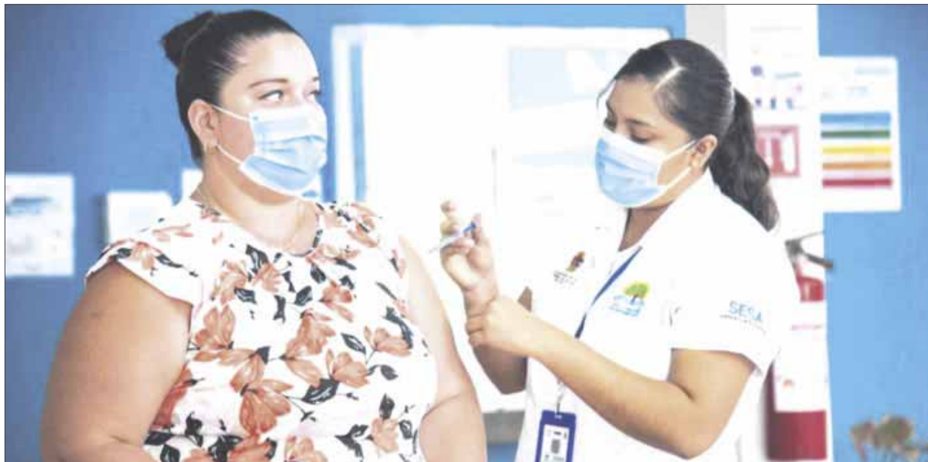
Se estima que más de 250 mil habitantes de Quintana Roo entre los 40 y 49 años de edad recibirán la vacuna contra el virus Covid-19.

Se estima que más de 250 mil habitantes de Quintana Roo en este rango de edad recibirán la vacuna contra el virus Covid-19, toda vez que el presidente Andrés Manuel López Obrador, anunció que en junio iniciará una nueva etapa del Plan Nacional de Vacunación.