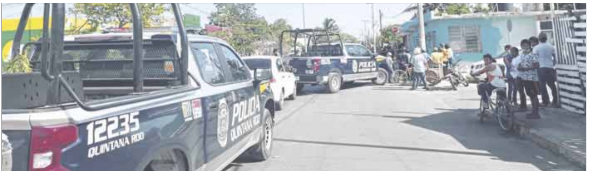
La policía sólo confirmó los hechos, en tanto los paramédicos dictaminaron que el sujeto ya no tenía signos vitales y se procedió al acordonamiento de la zona.

Otro caso, ocurrió en el fraccionamiento La Isla, cuando una persona del sexo masculino fue atraído por sicarios hasta un domicilio, al aprovechar que era un moto-repartidor y al llegar al domicilio fue atacado a plomazos, hasta matarlo.