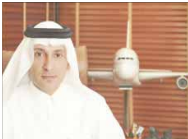
Akbar Al Baker.