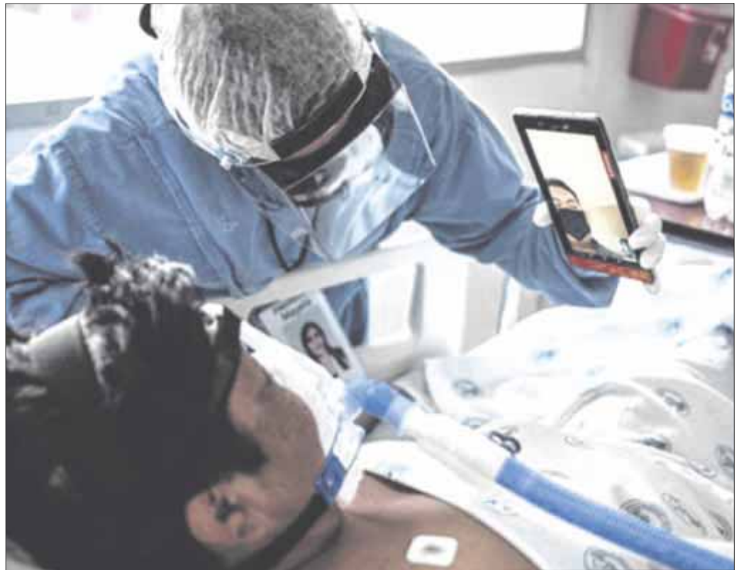
Hasta ayer domingo, se habían confirmado 26 mil 993 casos positivos y 2 mil 778 defunciones.

Finalmente, indicaron que se han aplicado 331 mil 013 dosis de vacuna contra Covid-19 en toda la entidad, por lo que la recomendación es continuar con los hábitos de higiene para proteger tu salud mientras te llega el turno por edad y en tu municipio para vacunarte. Se pretende que esta semana arranque la vacunación a personas entre 40 y 49 años de edad.