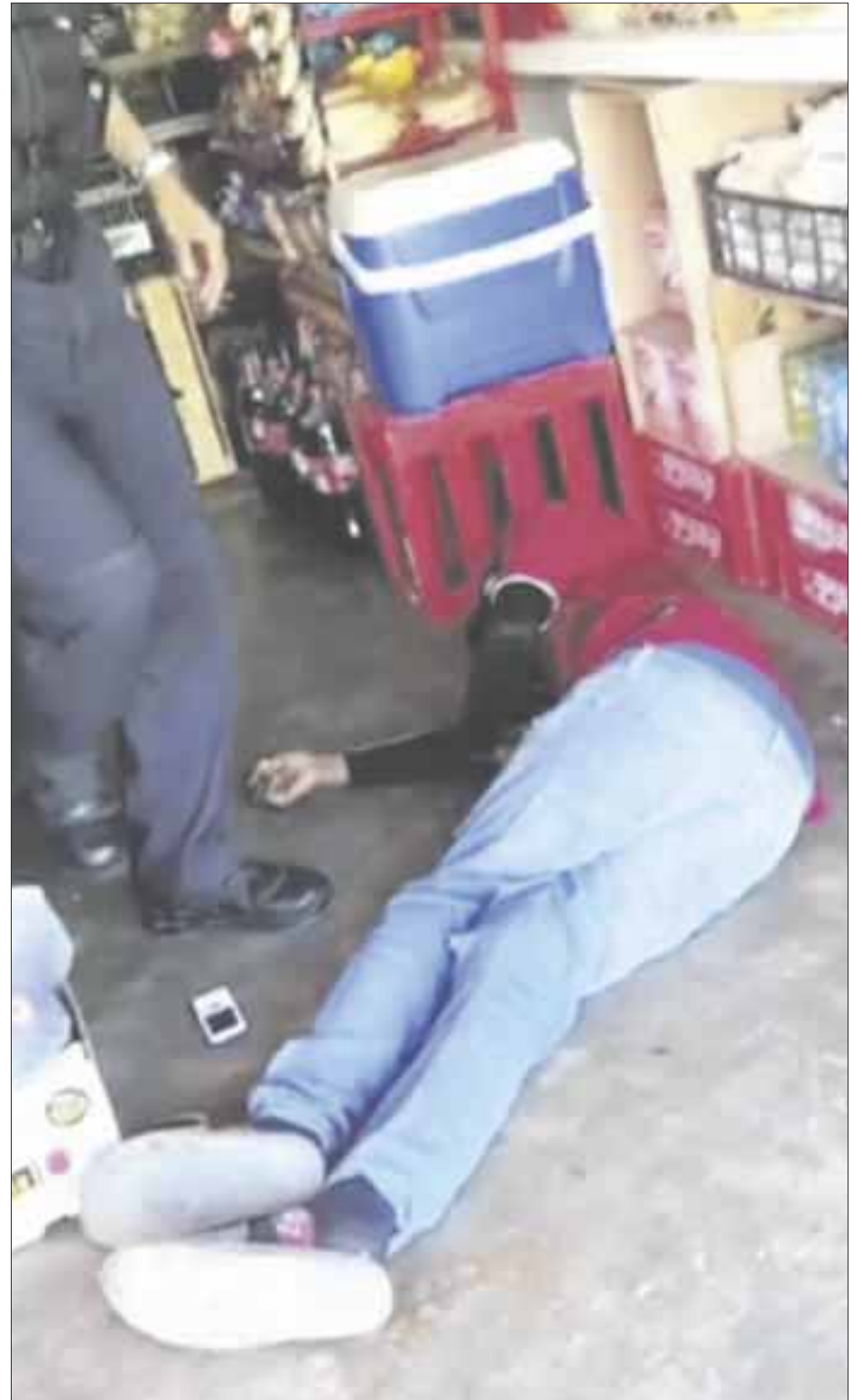
Al menos cuatro balazos, recibió un hombre a quien persiguieron y ejecutaron en una carnicería, en avenida Chetumal con Payo Obispo, de la colonia Lázaro Cárdenas.

Al hombre se le identificó con las siglas M.M.M, que al momento de llegar a la calle Manuel M. Diéguez, entre avenida Universidad y Ramón López Velarde, lo recibieron a balazos por sujetos que se dieron a la fuga en un Jetta oscuro.