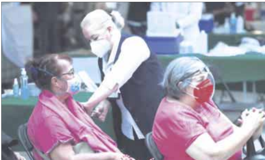
Se han suministrado en el país 30 millones 293 mil 682 dosis de las cinco vacunas que se tienen aprobadas para uso en México.

En México, han recibido al menos una dosis de la vacuna contra la Covid-19, una de cada cuatro personas mayores de 18 años, de acuerdo a cifras de la Secretaría de Salud federal.