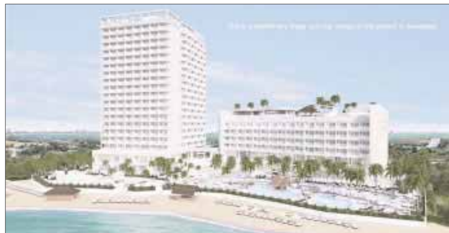
Render de Breathless Cancun Soul Resort & Spa.