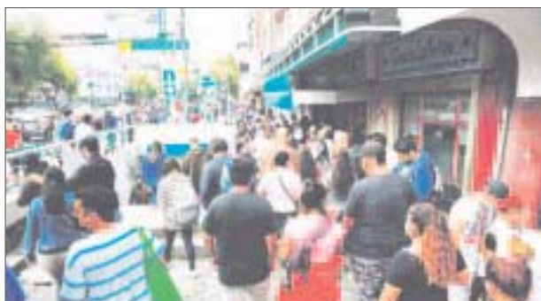
En las últimas cinco semanas, la mayor parte de los contagios se presentaron en la población de 18 a 29 años de edad.

México registró en las últimas 24 horas 790 decesos y 7 mil 682 nuevos casos por Covid-19, de acuerdo al corte de este martes de la Secretaría de Salud federal (Ssa).