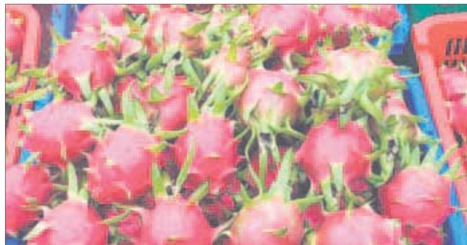
Productores de Quintana Roo preparan 300 toneladas de Pitahaya para exportar al extranjero.

La empresa firmó un contrato por cinco años con los ejidos que forman parte de la cuenca pitahayera "Mukil Meya S.A. de R. L." para la compra y exportación de la producción de 300 toneladas de pitahaya por año.