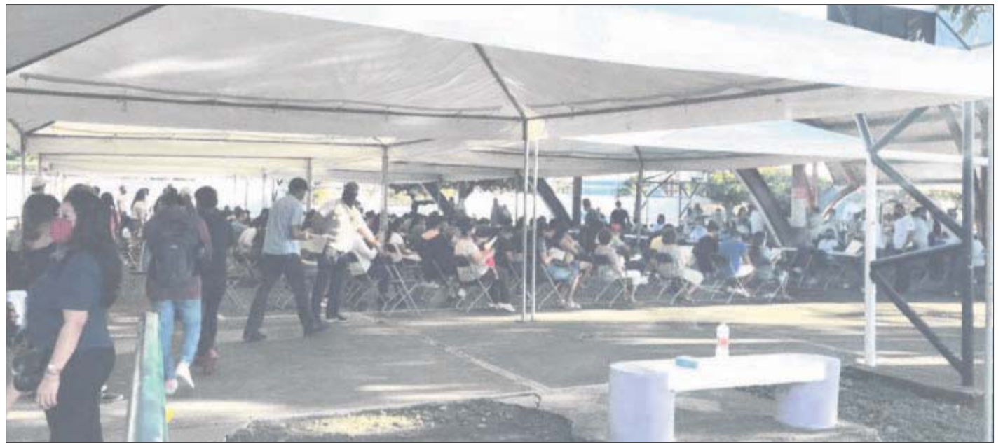
Reportan baja participación en aplicación de segundas dosis para jóvenes de 18 a 29 años en Cancún.

No obstante a lo anterior, refiere que se espera que en los próximos días mejore la participación. “Es el primer día, pero tenemos la meta que obtuvimos la vez pasada, por lo que esperamos cubrir esa cantidad, que fue de aproximadamente dos mil 500 dosis por jornada, fueron ocho días y queremos tener el mismo número. Muchas veces los jóvenes dejan las cosas para después, pero les invitamos a respetar su cita, en día y horario para no entorpecer la campaña”, dijo. En este contexto,