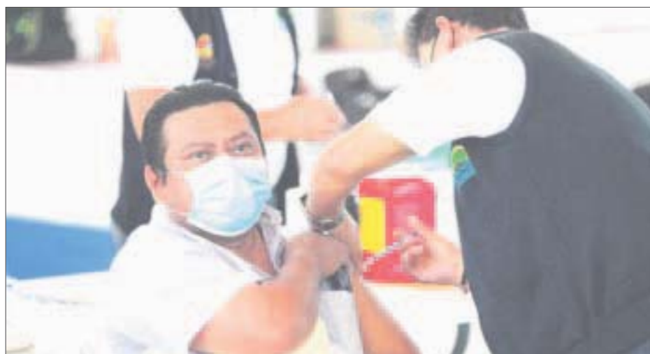
Desde ayer y hasta el próximo viernes habrá vacunación para rezagados en algunos municipios del estado.

En Felipe Carrillo Puerto, la vacunación termina la campaña el jueves 7 de octubre, por lo que los rezagados deben acudir al Domo Doble Cecilio Chi, dependiendo la edad en la fecha que le corresponda. Por su parte, en José María Morelos serán vacunadas las embarazadas y mayores de 18 años rezagados en el Domo San Juan, desde ayer martes y hasta el jueves 7 de octubre.