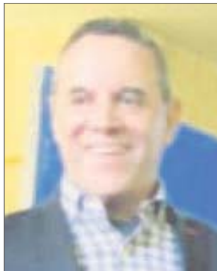
Por José Luis Montañez