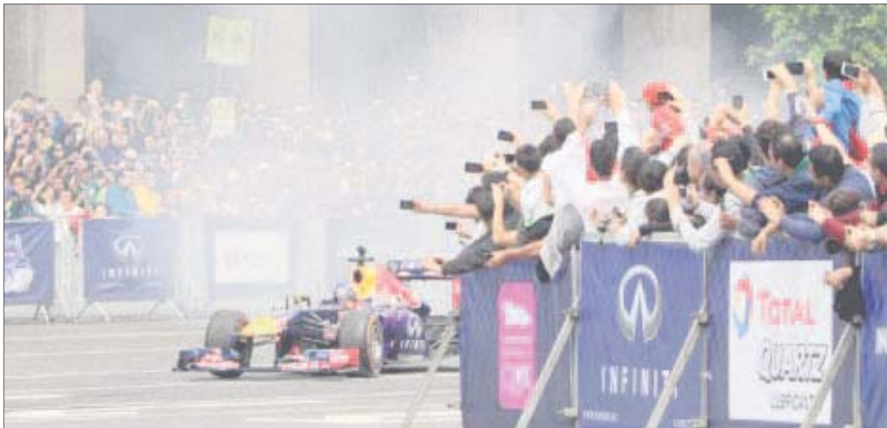
El Red Bull Show Run CDMX será gratuito para el público e inaugurará el fin de semana del Gran Premio de México en el Autódromo Hermanos Rodríguez.