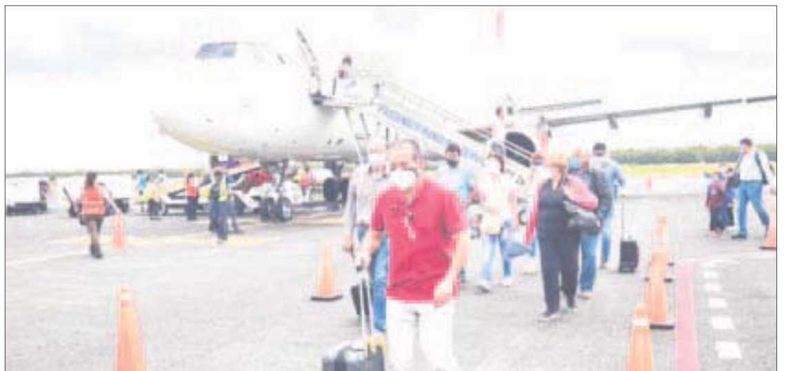
De acuerdo con el Consejo de Promoción Turística de Quintana Roo (CPTQ) a partir de este mes y hasta marzo de 2022 varias aerolíneas han anunciado la llegada de nuevos vuelos a Quintana Roo.

El gobernador Carlos Joaquín ha expresado que el punto más importante y medular de estas acciones es la recuperación del empleo, que las familias quintanarroenses tengan recursos y las posibilidades de mejorar los ingresos para que las familias tengan mejores oportunidades