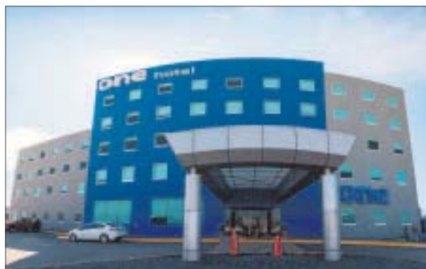
Nuevos hoteles de la cadena en el país.