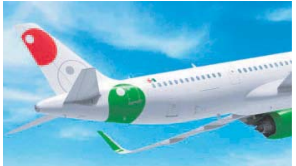
La aerolínea estrena página en internet.