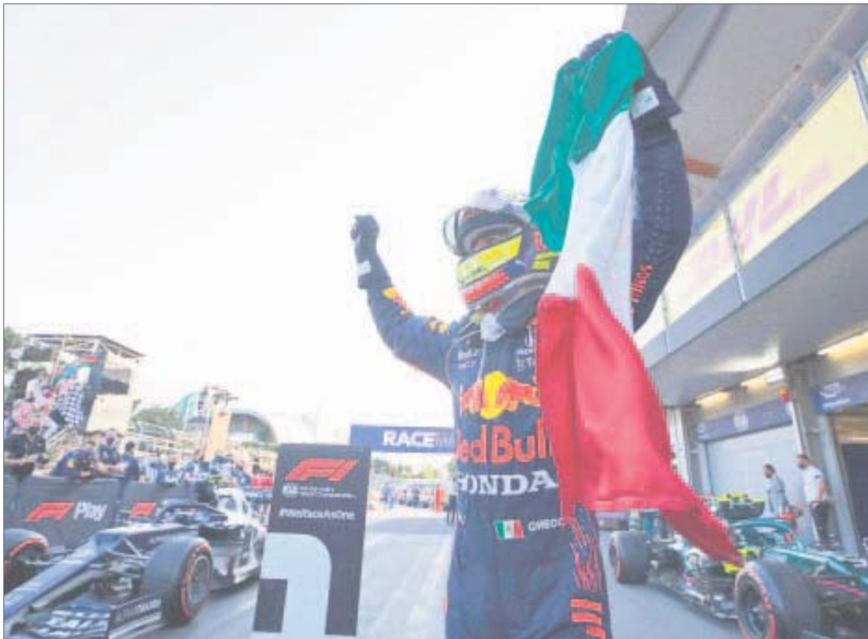
Checo Pérez tendrá la oportunidad de llevar el RB7 de Red Bull por la avenida Reforma, este 3 de noviembre.

Pronto se anunciarán más detalles sobre el horario, el circuito y los invitados especiales, a través de los canales oficiales de Red Bull Racing Honda y redbull.com/showrun .