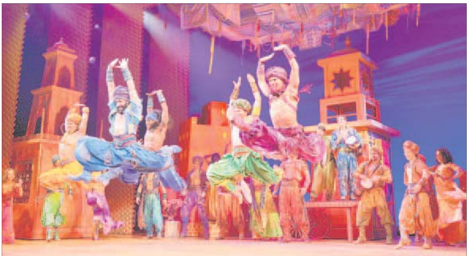
Aladdín representa el banderazo de salida para conquistar y encantar al público de habla hispana. ¡Todos hemos esperado esto durante mucho tiempo!

Pero sobre todo lo más importante es la corresponsabilidad de todos para tener la experiencia más segura y disfrutar de esta vuelta a los escenarios del entretenimiento en vivo. Tenemos que regresar lo mejor de los espectáculos y los eventos para los que tu ayuda y cooperación es fundamental.