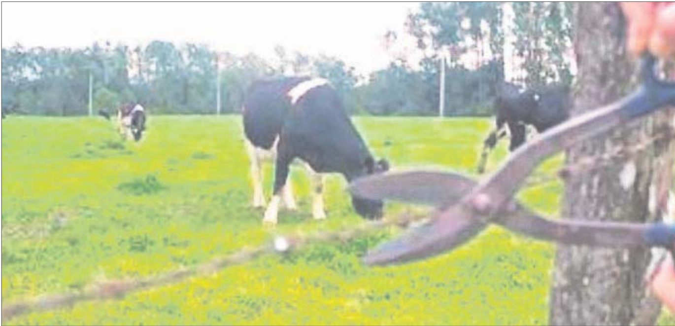
Ganaderos en Felipe Carrillo Puerto denuncian que el abigeato persiste y exigieron a las autoridades que se investiguen.

Ganaderos en Felipe Carrillo Puerto denunciaron que existe una grave inseguridad debido al abigeato que persiste en la zona maya y exigieron a las autoridades investigar los casos establecidos en carpetas de investigación y que se castigue a los responsables.