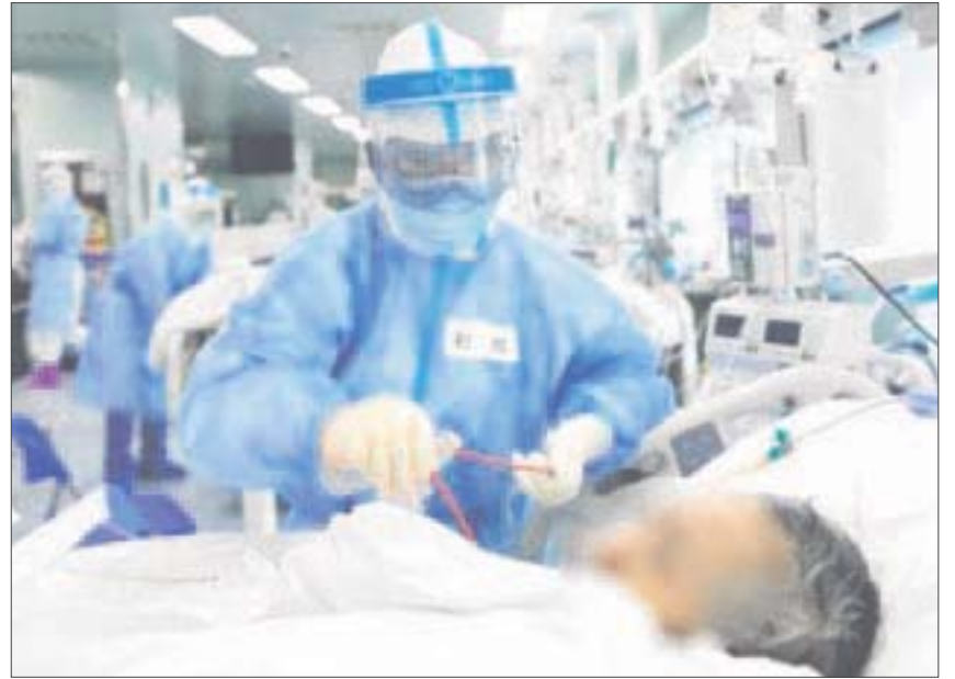
Hasta ayer 5 de octubre, se habían confirmado 58 positivos más a Covid-19 y 3 muertes por la misma causa.

La actualización indica que hasta ayer la ocupación hospitalaria en la zona norte era de 8%, mientras que en la zona sur es de 17%. En cuanto a la velocidad en el crecimiento de contagios, la zona norte tiene 0.11 y la sur 0.24.