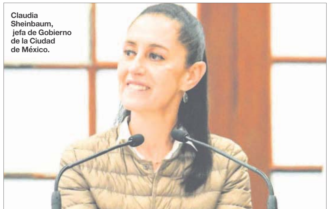
Claudia Sheinbaum, jefa de Gobierno de la Ciudad de México.