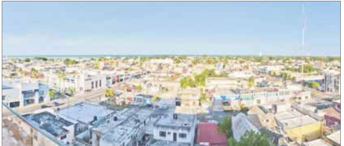
Chetumal ocupa 7 lugares en el Ranking semanal de las colonias con más casos activos de Covid-19.

Durante la segunda semana de clases presenciales, se han acumulado 16 contagios por Covid-19 confirmados en los planteles de Quintana Roo.