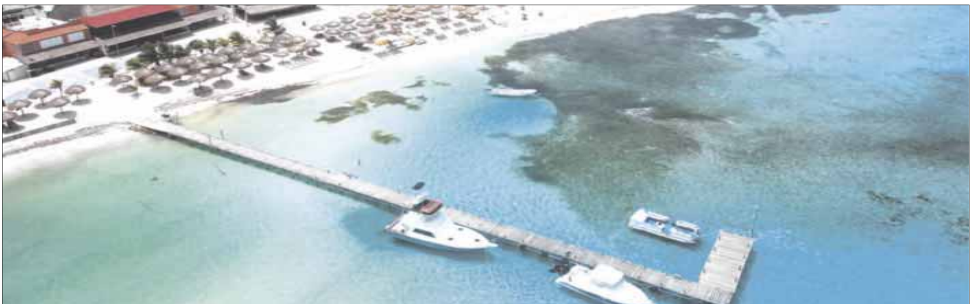
La APIQROO desarrolló y consolidó el sector portuario con una inversión de 7 millones 684 mil pesos, en infraestructura que moderniza las instalaciones y los servicios nacional y extranjero.