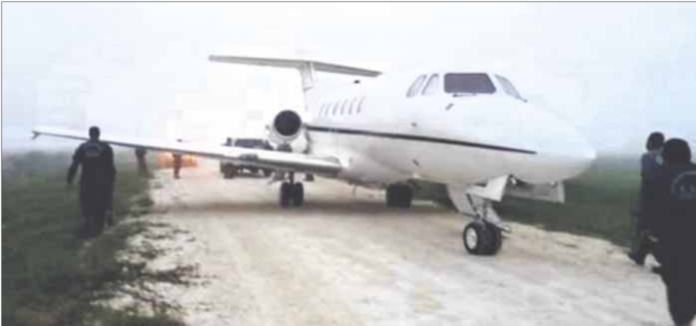
El Sistema de Vigilancia Aérea, en lo que va de 2021, han logrado detectar 298 sobrevuelos ilegales en la zona sur de Q. Roo.

Los vuelos provienen de Venezuela, Colombia y Perú, mismos que al salir de sus aeropuertos de origen presentan planes de vuelos con destinos diversos, pero al sobrevolar Belice o las costas del Caribe mexicano ingresan de manera ilegal a la Ribera del Río Hondo y Bacalar.