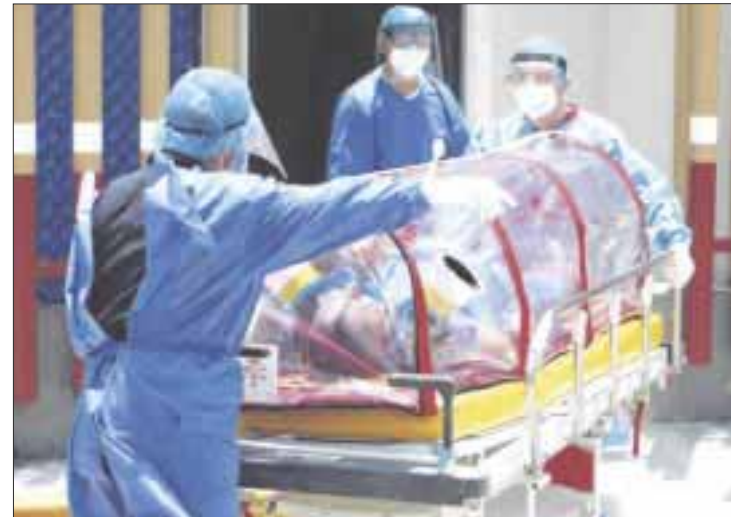
Hasta ayer miércoles, se tenía un conteo total de 3 mil 838 defunciones y 55 mil 789 casos positivos por Covid-19.

La ocupación hospitalaria de acuerdo con la última actualización, indica que en la zona norte hay un 21% y en la zona sur 28%. Mientras que la velocidad en el crecimiento de contagios es de 0.37%