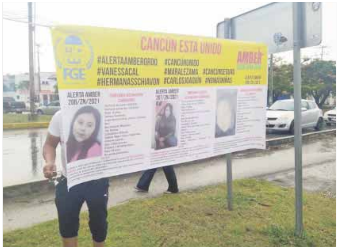
La FGE informó que la noche del 7 de septiembre localizaron a las tres menores que habían desaparecido el día 2 del mismo mes, en Cancún.

Las menores rindieron una declaración acompañadas de sus familiares, la FGE indicó que se dará intervención al Sistema para el Desarrollo Integral de la Familia (DIF), para los efectos de su competencia,