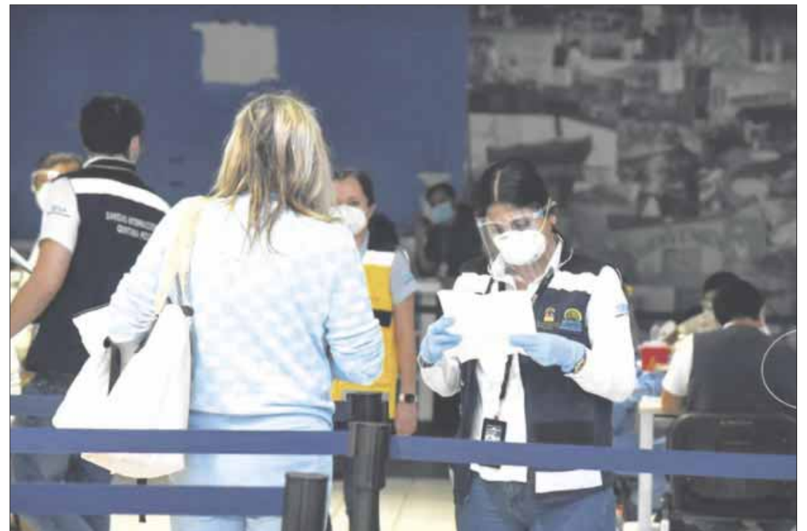
El establecimiento de una ruta nueva con la aerolínea Frontier desde la ciudad de Atlanta a Cancún. Los vuelos de Canadá empezaron ya en tres aerolíneas; por lo pronto, de Montreal, Toronto.

En cinco años de gobierno de Carlos Joaquín la Administración Portuaria Integral de Quintana Roo (APIQROO) realizó acciones de construcción, modernización y mantenimiento de obras portuarias con una inversión de 50 millones 824 mil pesos, provenientes de recursos propios.