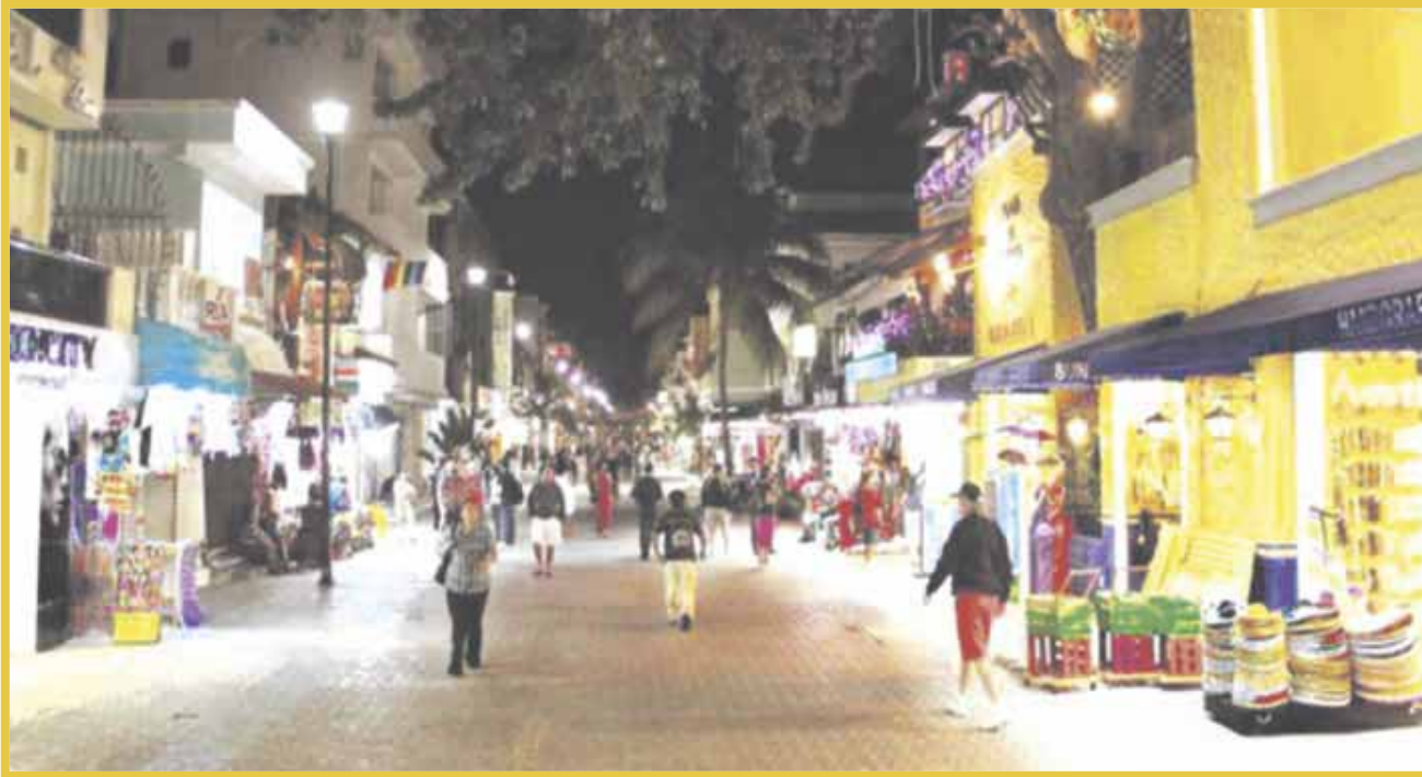
La Coparmex demanda a las autoridades que autoricen el avance a color amarillo en el semáforo epidemiológico estatal.

La Coparmex pide a las autoridades que autoricen el avance a color amarillo en el semáforo epidemiológico estatal, con el objetivo de que las empresas logren una reactivación más acelerada, en medio de la crisis que aún no logran superar en cuanto a sus finanzas.