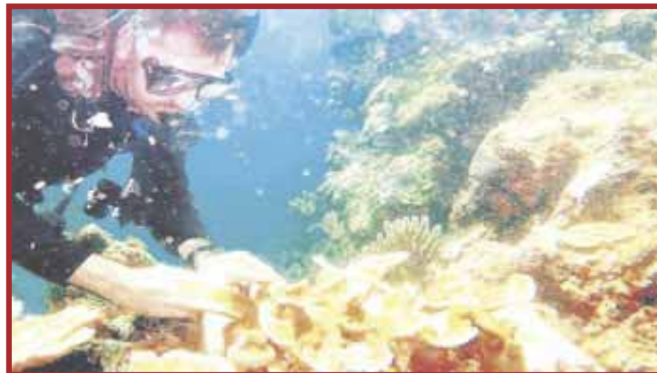
Sema, hizo efectiva la póliza de los arrecifes, luego del impacto de los huracanes el año pasado.

Agregó que estos recursos ya están aprobados, y adicionalmente, se destinó un monto extra como fondo de emergencia “Un millón de pesos se van a destinar para un fondo de emergencia por si este año hay alguna otra afectación. De suceder podremos poner de inmediato en acción a las brigadas que ya cuentan con una capacitación, ellos tendrán viáticos, gasolina, todos los recursos necesarios para entrar al proceso de rehabilitación de los arrecifes”.