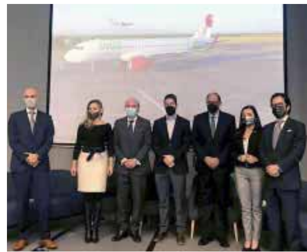
En la bienvenida del vuelo de la Ciudad de México a Bogotá.