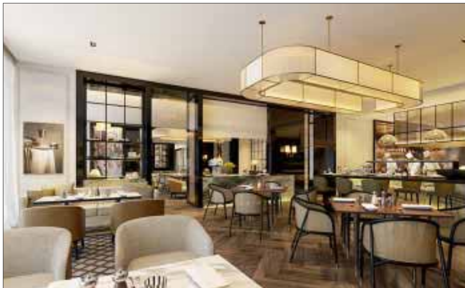
Así será el nuevo restaurante.

victoriagprado@gmail.com Twitter: @victoriagprado