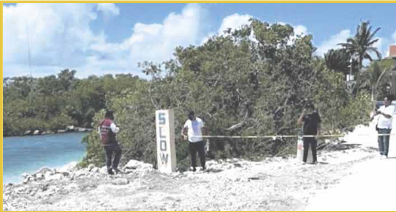
Ambientalistas advierten afectación ambiental en Puerto Aventuras por construcción de playa artificial.

Se construyó una playa artificial, arrecifes de concreto y un embarcadero en Puerto Aventuras sin autorización del Ayuntamiento de Solidaridad (Playa del Carmen), lo cual ha repercutido en graves impactos al ecosistema y un desastre ambiental.