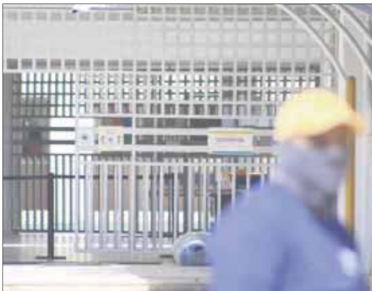
La Cofepris informó que las multas para las escuelas que no respeten protocolos sanitarios frente al Covid-19, van desde los 16 mil hasta los 160 mil pesos.