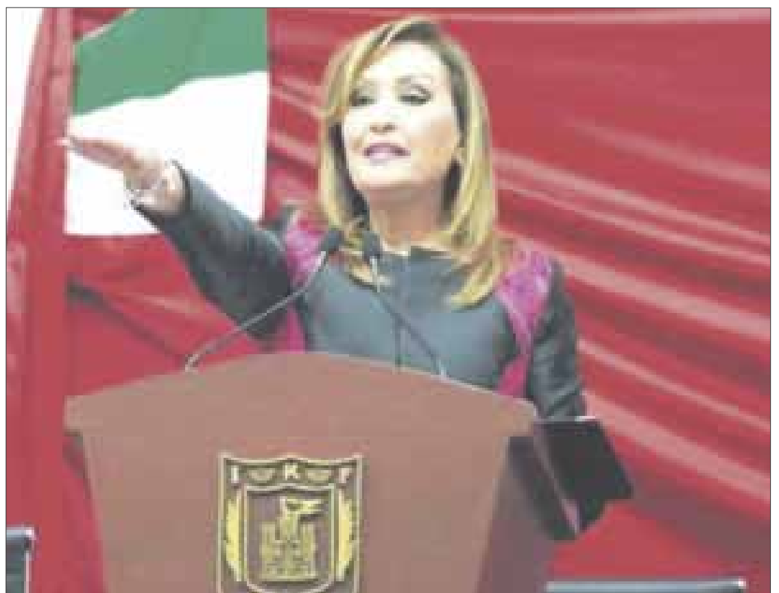
Lorena Cuéllar , nueva gobernadora de Tlaxcala.