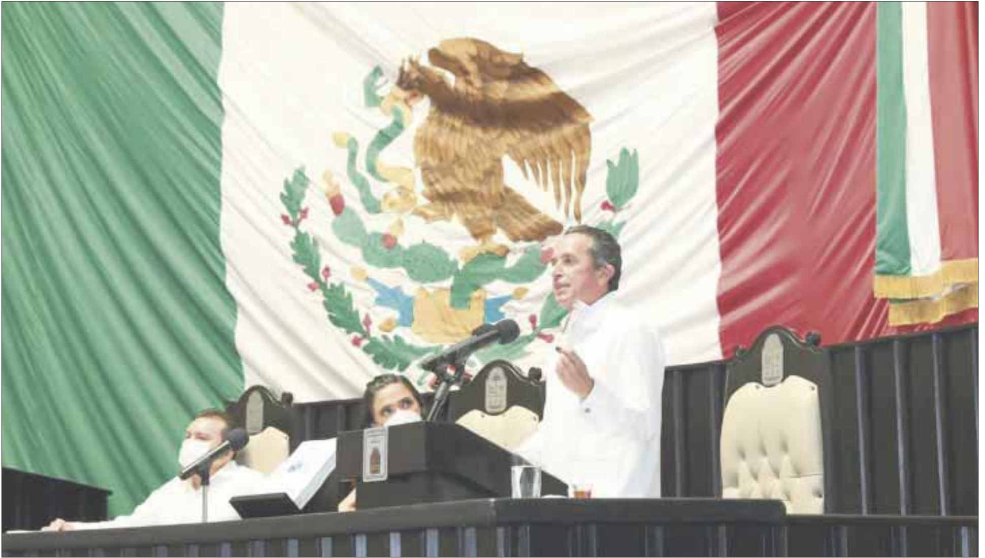
El gobernador Carlos Joaquín entregó ante los diputados de la LVI Legislatura del Congreso del estado su 5º Informe de rendición y fiscalización de cuentas que guarda la administración pública.