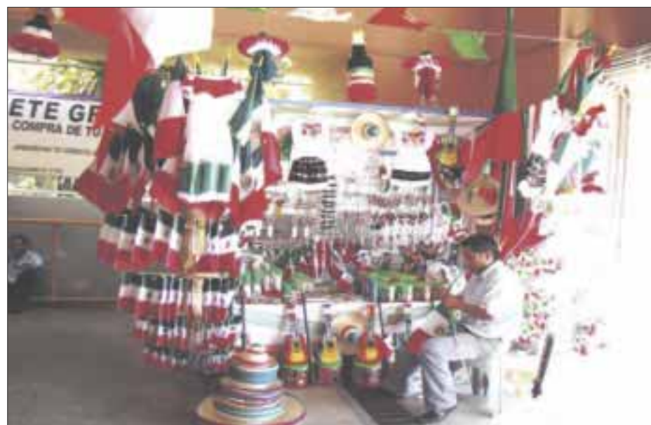
Comerciantes de Cancún , que venden artículos relacionados a las fiestas patrias, dicen que enfrentan la peor crisis en sus ventas.

Detallaron que los artículos que más se venden son entre otros, las banderas, trompetas, espumas, confeti, papel picado, moños para adornar, campanas, cadenas de papel, sin embargo, no han sido tan solicitados como antes, de hecho afirman que sus ventas también están relacionadas con las actividades escolares, no obstante, al continuar restringidas de forma presencial en la mayoría de las escuelas, las ventas no pudieron despegar.