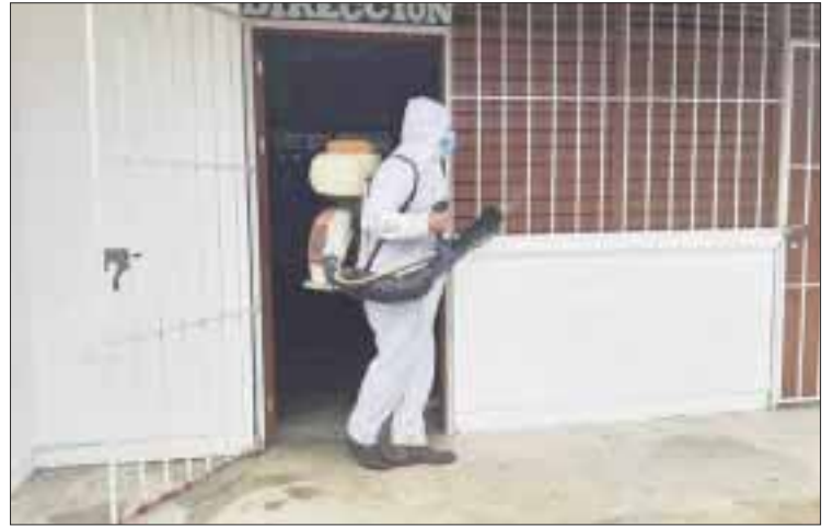
El sector empresarial informó que lograron la desinfección de 50 escuelas de nivel básico en la ribera del río Hondo.

De acuerdo con los reportes de la Secretaría de Salud (Sesa), actualmente hay casos activos en 11 de las 19 comunidades que conforman la ribera del río hondo; 2 en Sergio Butrón Casas, 2 en Carlos A. Madrazo, 1 en Sac-Xán, 2 en Álvaro Obregón, 2 en Javier Rojo Gómez, 3 en Pucté, 3 en Cacao, 1 en José N. Roviroa y 1 en la Unión.