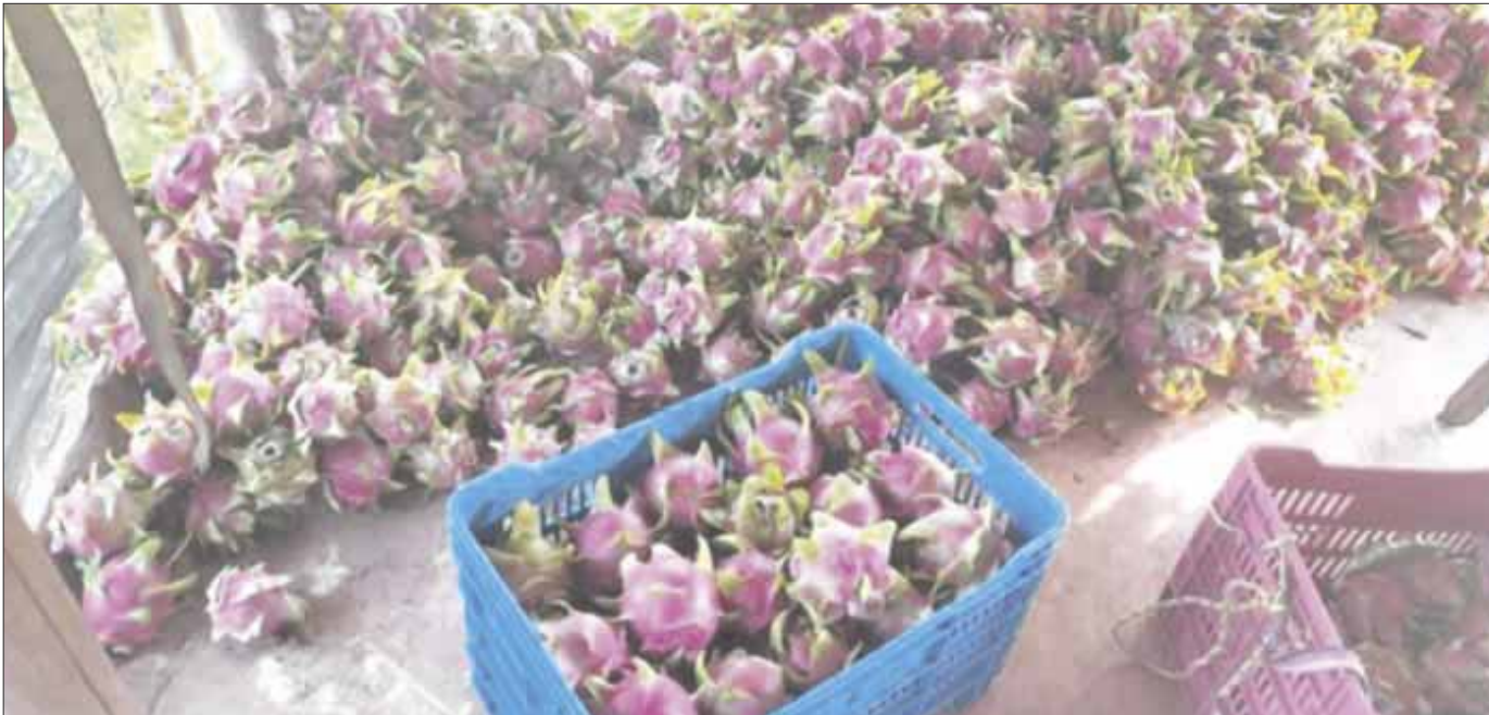
Productores agrícolas de pitahaya del municipio de Felipe Carrillo Puerto, envían primer cargamento del producto a Estados Unidos.

Productores en Chunya dieron salida a las primeras 36 toneladas de pitahaya hacia EU por parte de la empresa “Wuda”, este primer viaje es el inicio de 300 toneladas que se exportarán al país vecino, lo cual tiene una estimación en la derrama económica de 50 millones de pesos.