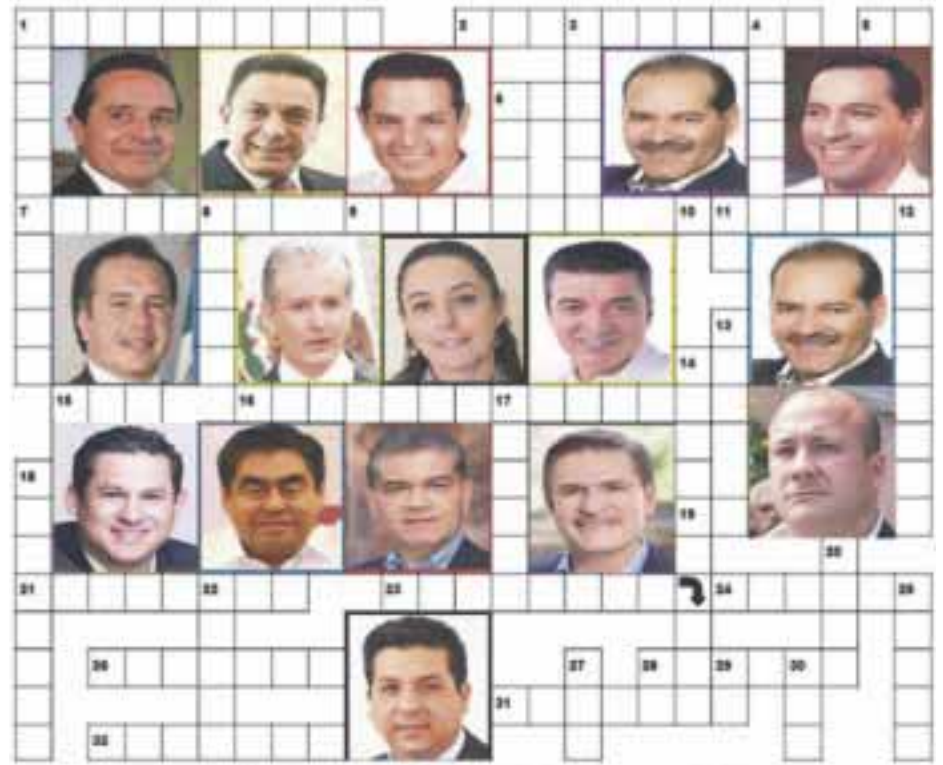
DATOS DE LA PÁGINA: https://es.wikipedia.org/wiki/Iniciativas_de_MPC/Naciones_de_2022-23-24

32.- Nombre del estado gobernado por el priista Omar Fayad Meneses hasta el próximo año y que por llevarse bien con el Primer Mandatario, su gente lo candidateaba para que dejara la gubernatura y se fuera a alguna secretaria, cosa que nunca pasó.