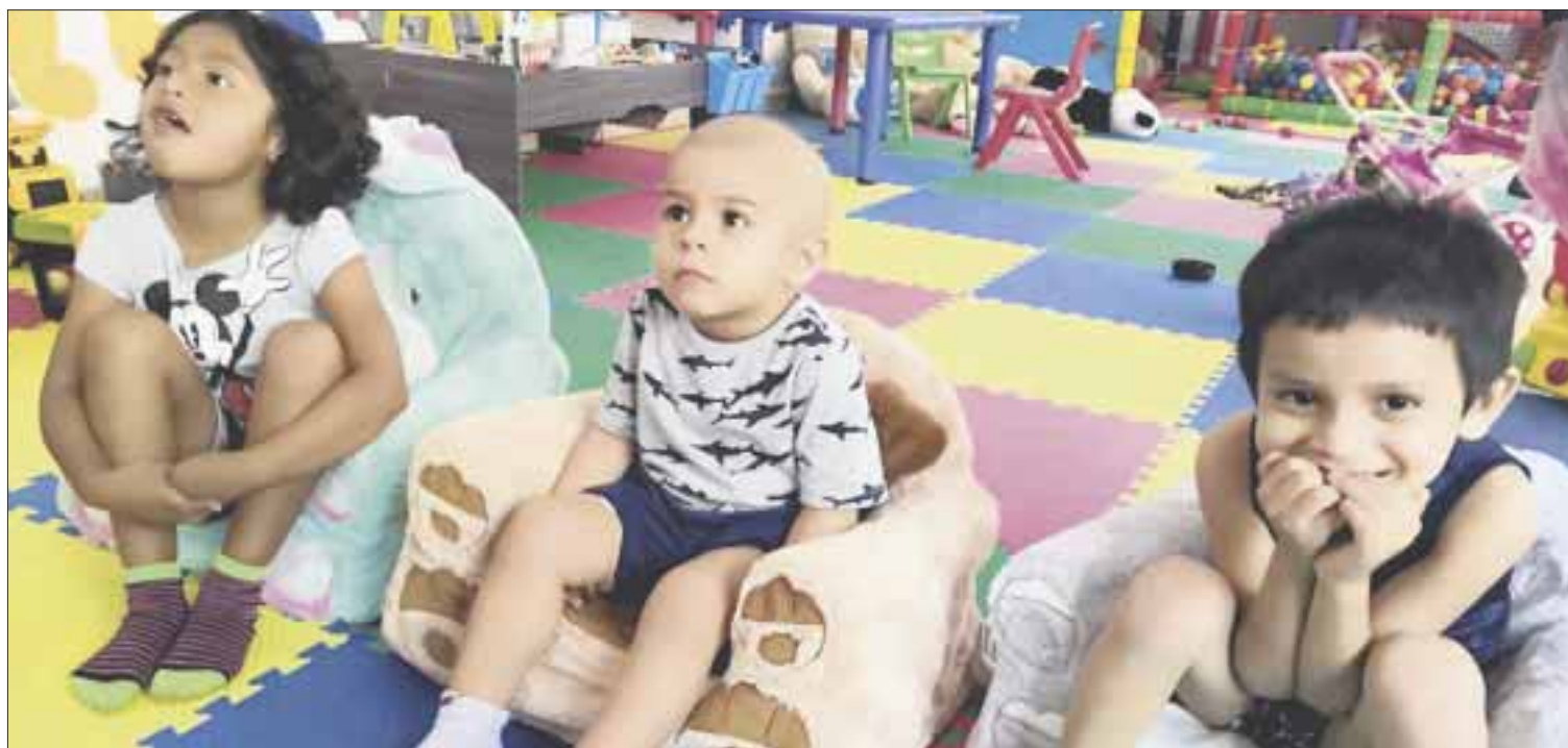
Familias de niños con cáncer recurren a las fundaciones, ante la falta de medicamentos por parte de las instituciones de gobierno.

Asimismo, detalla que el desabasto general de fármacos a nivel nacional no es un tema nuevo, sino que se viene su-