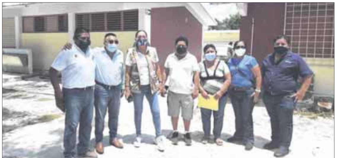
Tras 17 meses de inoperatividad en las escuelas, es mucho lo que se tiene que hacer para el regreso a clases presenciales, pero la indicación del gobernador Carlos Joaquín, es que los espacios educativos queden al cien por ciento, como antes de la presencia de la Covid 19.