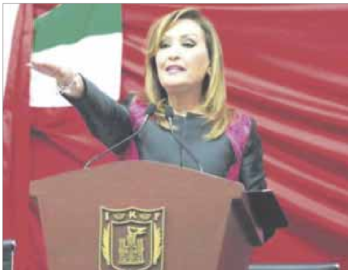
Lorena Cuéllar , nueva gobernadora de Tlaxcala.

Lorena Cuéllar es la segunda mujer gobernadora de Tlaxcala, que ha dado muestra de que la alternancia es un buen recurso para los ciudadanos inconformes con las malas gestiones de sus gobernantes, aunque en el caso preciso de esta entidad, los cuatro gobernantes que lo han hecho surgieron del PRI.