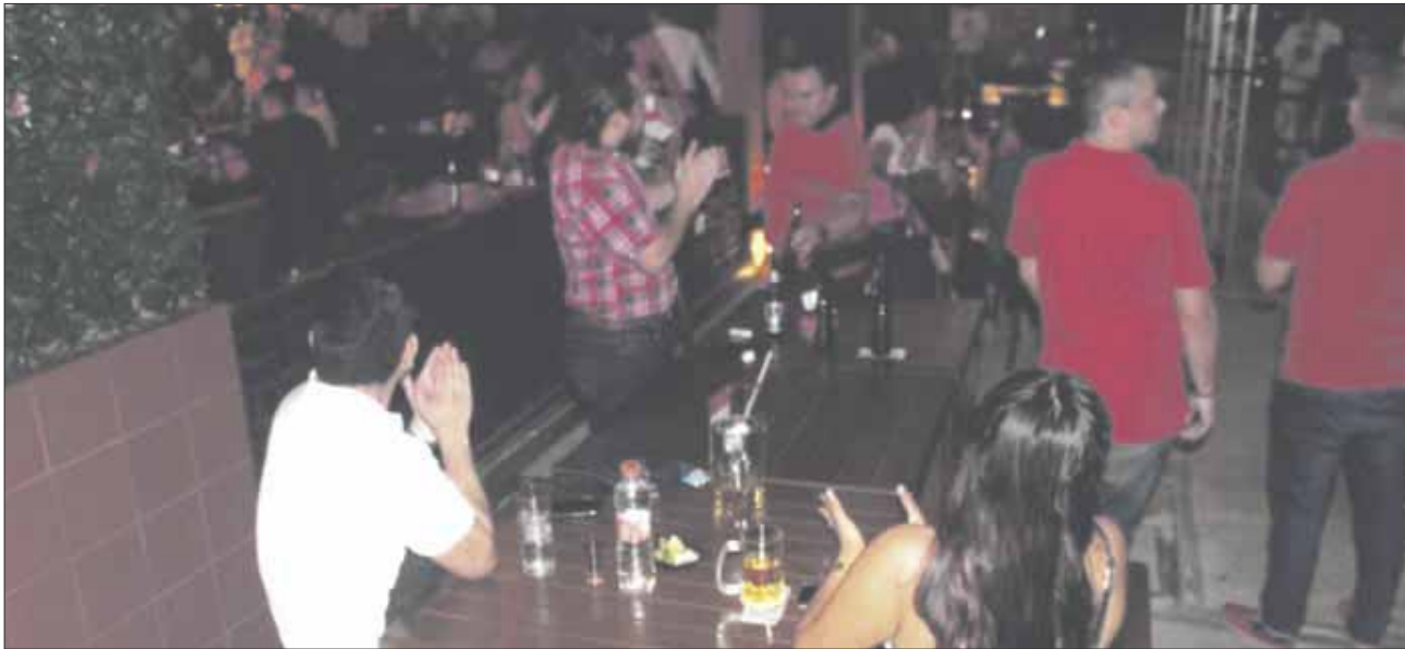
Restauranteros de Chetumal prevén que la ampliación de aforos y horarios beneficien a los establecimientos del Bulevar de Chetumal.

Los restaurantes difícilmente superan el aforo permitido de 60%, además de que la mayoría de sus ventas se realizan a través del servicio a domicilio, ya que al tener aforos limitados y horarios restringidos, la gente prefiere pedir la comida para llevar.