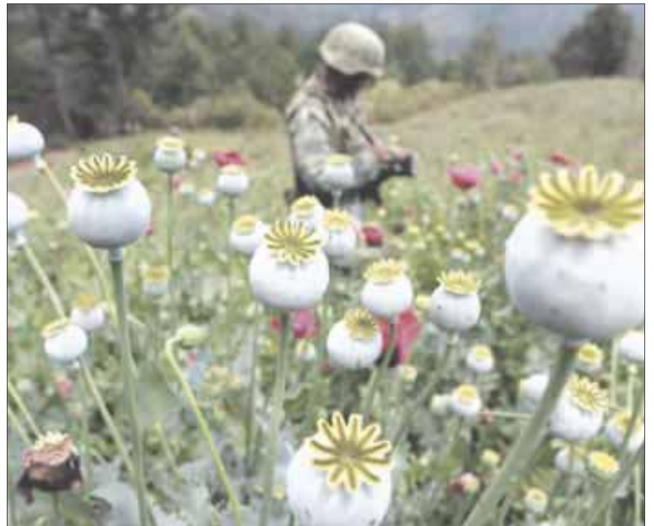
Joe Biden afirmó que México se mantiene como uno de los países principales de producción o tránsito de drogas.

Como hiciera el año pasado el entonces mandatario Donald Trump, Biden aclaró en el comunicado que la presencia de un país en esta lista, relativa al año fiscal 2021, “no es un reflejo de los esfuerzos antinarcóticos”