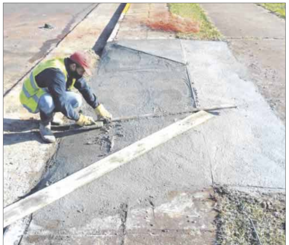
El nuevo reglamento de construcción de Cancún garantiza accesos para personas con discapacidad.

A lo anterior añadió que “El Manual de Normas Técnicas Complementarias de Accesibilidad Universal para el Espacio Público será un instrumento complementario a lo establecido en el Reglamento de Construcción para el Municipio de Benito Juárez y demás disposición en la materia, para normar los criterios que se seguirán durante el diseño, planeación, construcción y modificación en edificaciones, espacios, entornos y servicios de la ciudad de usos público o privado”.