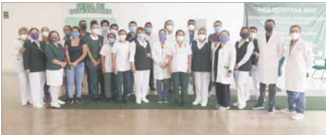
El IMSS en Q. Roo se sumó a la Jornada Nacional para la Recuperación de Servicios Médicos.

Finalmente, el IMSS en Quintana Roo invita a la población derechohabiente a acudir a sus unidades médicas en caso de tener consultas y cirugías pendientes, estas atenciones se realizan bajo estrictos protocolos de seguridad e higiene para evitar contagios de Covid 19.