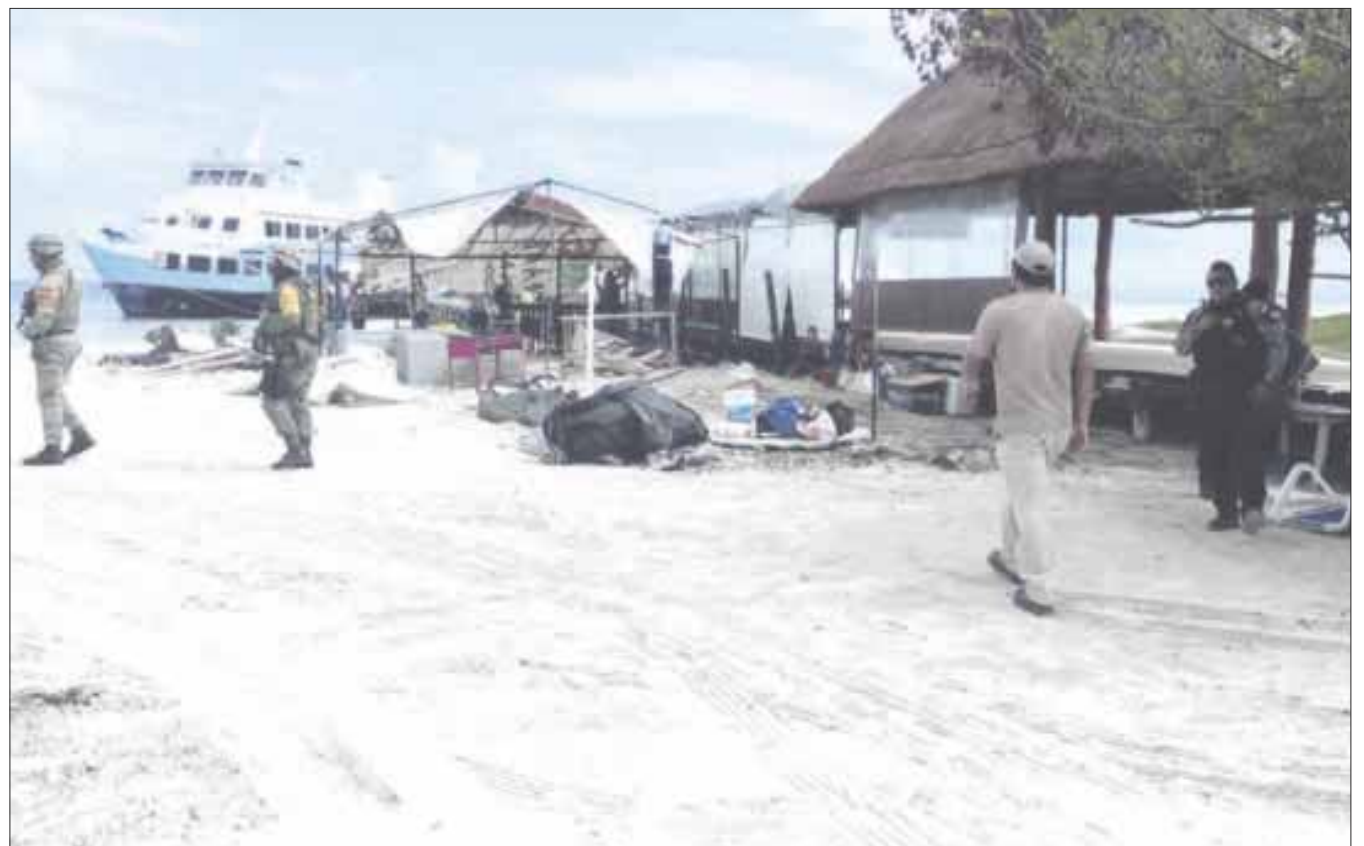
El Consejo Coordinador Empresarial del Caribe (CCE) emitió un pronunciamiento en el que reconocen la labor de las autoridades.

El operativo de “Playa segura” se implementó alrededor de las 09:00 horas del miércoles en Playa Delfines y Playa Langosta, hasta donde llegaron elementos de la Semar, Guardia Nacional, Fiscalía General del Estado y la Policía Quintana Roo, con la finalidad de liberar los arenales para el disfrute de los ciudadanos y turistas.