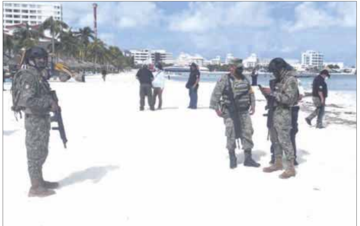
Para erradicar narcomenudeo y “cobro de piso”, el Ejército, en coordinación con los tres órdenes de gobierno, realizó un operativo en Playa Delfines y Playa Langosta.

Recordemos que estos operativos son coordinados desde la Mesa de Coordinación Estatal para la construcción de la paz y seguridad en Quintana Roo y han sido celebrados por los empresarios, quienes incluso han solicitado que se amplié a todas las playas públicas de la zona norte del estado, que han sido tomadas por el crimen organizado; y es que este tipo de operativos de seguridad en la zona hotelera de la ciudad son para evitar el narcomenudeo y la detección de armas prohibidas, así como el cobro de derecho de piso a prestadores de servicios y náuticos.