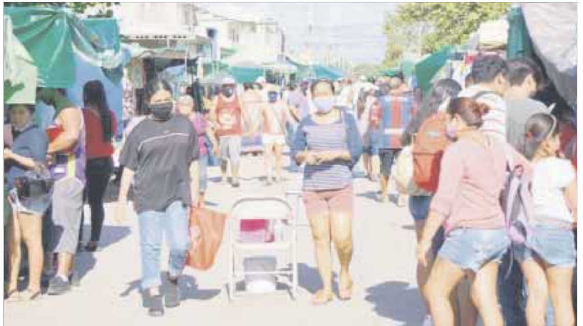
La Organización Ciudadanos Mayas Tianguistas, lanzó una propuesta al gobierno municipal de Benito Juárez (Cancún) para establecer otros tres tianguis.

plicó que legalmente no son ciudadanos, por lo que quedan excluidos de los derechos y servicios que ofrece el estado, asimismo, dijo: “Carecer de un acta de nacimiento es una violación al derecho humano de tener una identidad. Pese a las campañas de regularización que la dependencia ha realizado para acercar este servicio a las comunidades, no todos han acudido. Hasta ahora, se han logrado que 400 infantes tengan sus actas de nacimiento a través de estas campañas”.