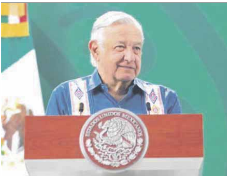
El presidente Andrés Manuel López Obrador acusó una actitud “demasiado rígida” en el Poder Judicial.

El presidente Andrés Manuel López Obrador declaró que le desespera “el burocratismo” que existe en los los tres Poderes de la Unión, tras señalar que intervendrá en el caso de un mujer presa que supuestamente sufrió tortura.