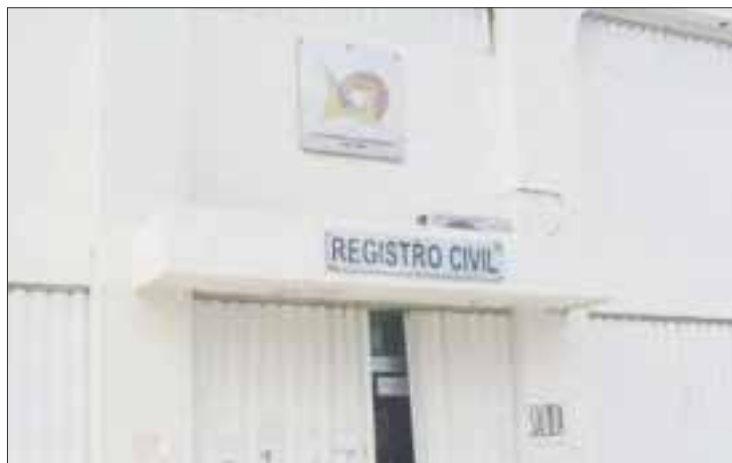
Según el Registro Civil de Quintana Roo, por lo menos mil 600 menores de edad no están registrados como ciudadanos quintanarroenses.

De los aproximadamente mil 600 infantes sin acta de nacimiento en el estado, el 10 por ciento son adolescentes, lo que significa que 160 adolescentes no han cursado su nivel básico educativo, quienes deberían de estar cursando el sexto grado de primaria e inclusive la secundaria, lo cual significa no sólo un atentado a su derecho de identidad, sino de educación.