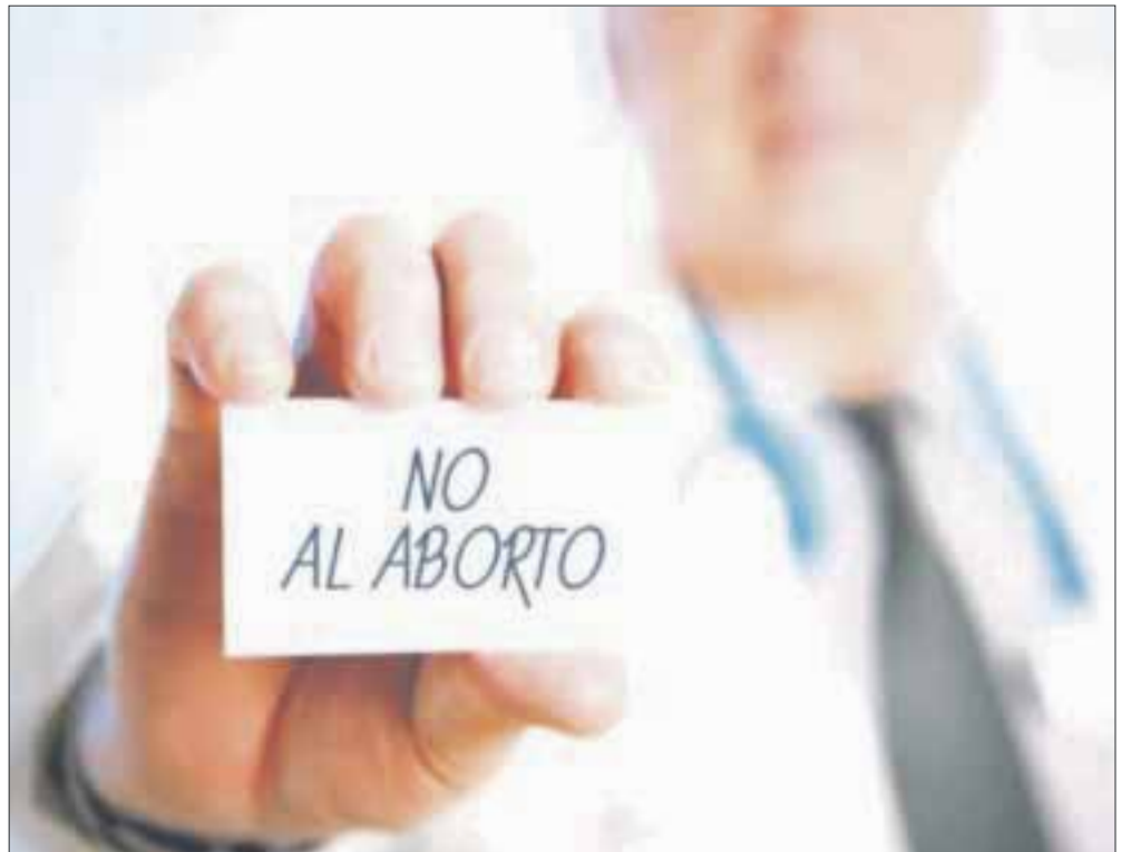
Ministros de la SCJN enviarán un exhorto al Congreso de la Unión para que corrija la Ley General de Salud, sobre objeción de conciencia.

Los ministros retomarán este martes el tema para establecer qué lineamientos deben incluir los legisladores federales y enviarán un exhorto al Congreso de la Unión para que corrija la ley.