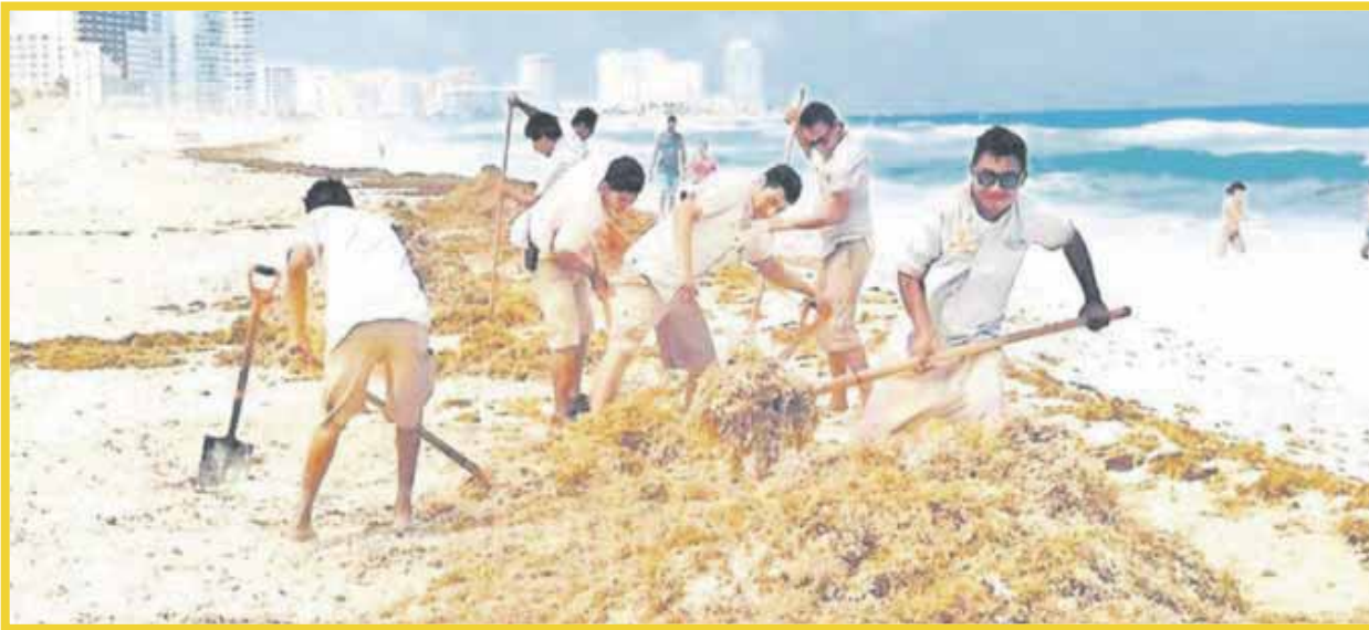
En el caso de Cancún, la Zofemat informó que lograron retirar más de 9 mil toneladas de sargazo de las costas.