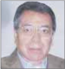
Por Roberto Vizcaino