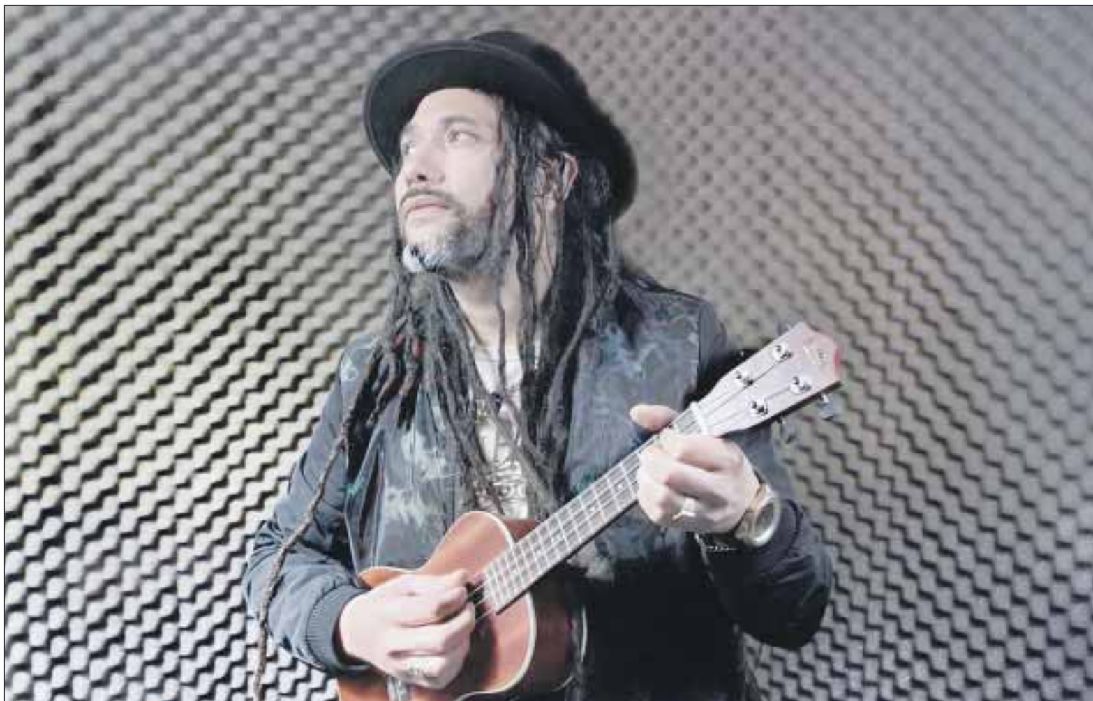
El exintegrante de Gondwana lanza su nuevo sencillo “Hasta que me olvides”, en el marco de su concepto de versiones a grandes iconos de Latinoamérica, y en este caso tocó un nuevo homenaje a Luis Miguel, con el tema en formato de reggae.

Finalmente adelanta que pronto espera reencontrarse con los escenarios y su público “efectivamente empezamos con ensayos, donde estamos montando los co-