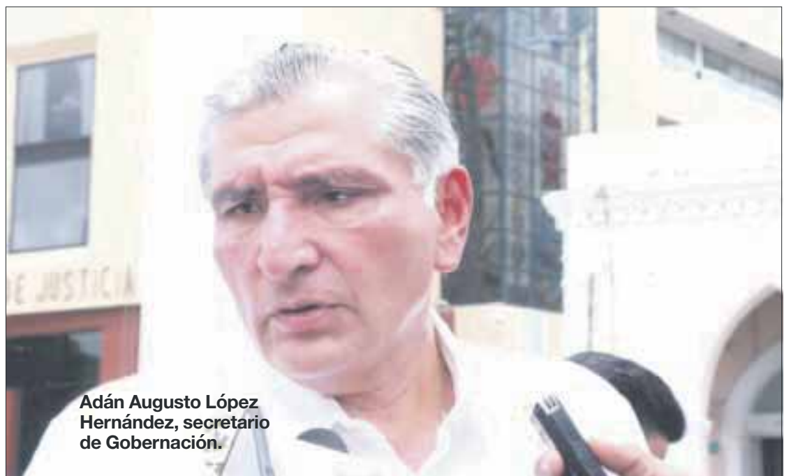
Adán Augusto López Hernández, secretario de Gobernación.