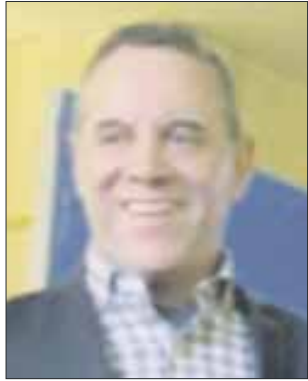
Por José Luis Montañez