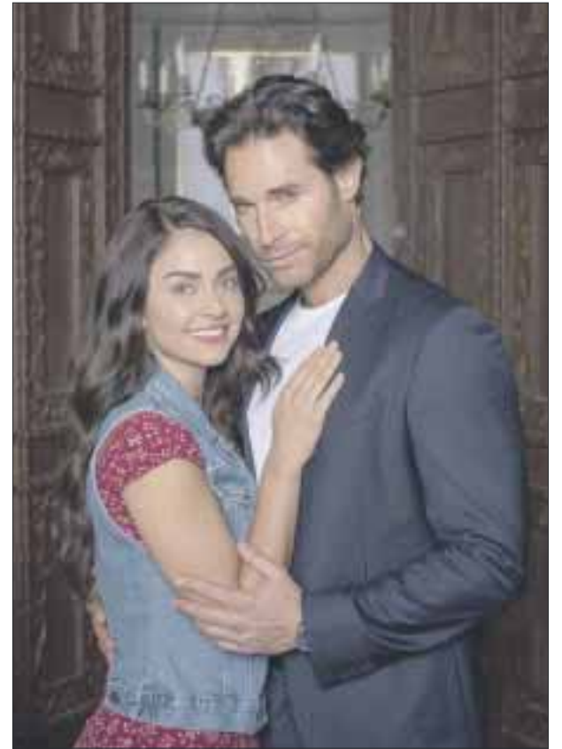
“Los ricos también lloran” con las actuaciones estelares de Claudia Martín y Sebastián Rulli estrenará por las estrellas en febrero de 2022, en el horario de las 21:30 horas.

“Los ricos también lloran” estrenará por las estrellas en febrero de 2022, en el horario de las 21:30 horas.