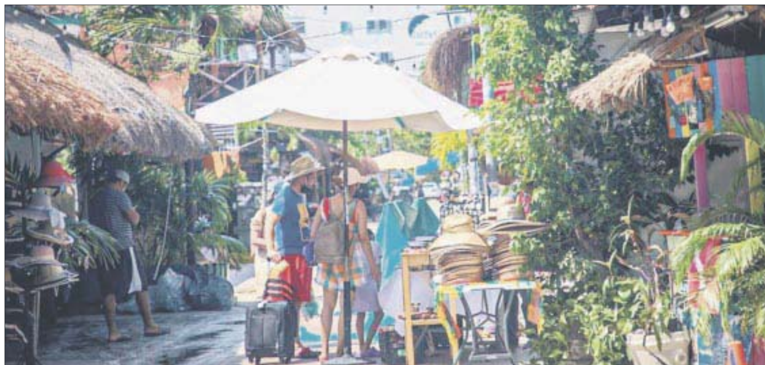
Sefiplan aseguró que el estado avanza en franca recuperación económica, pese a los estragos de la pandemia.

En ese contexto, explicó: “Esto nos demuestra que la economía quintanarroense está recuperando terreno a pasos