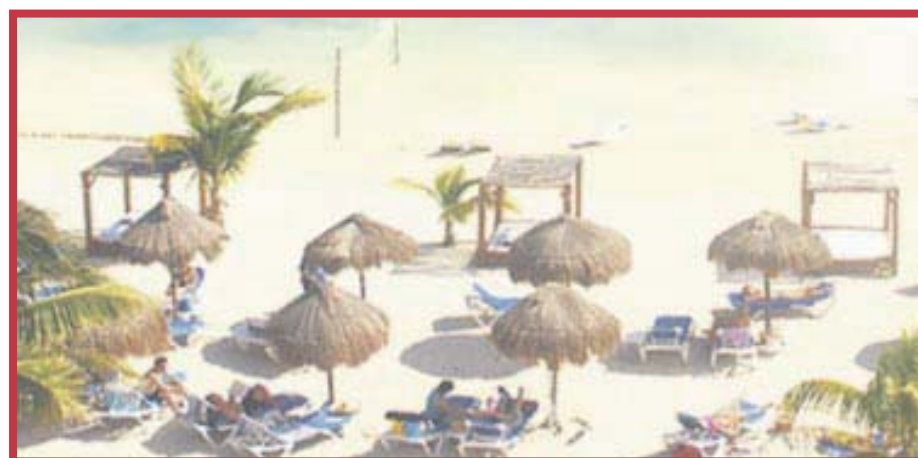
Grand Costa Maya no logró alcanzar sus expectativas en cuanto a la ocupación hotelera durante el presente mes patrio.

Y adelantó que para el mes próximo se podrán activar promociones más fuertes para atraer a los visitantes de otras ciudades de Quintana Roo y del país. "Por ejemplo noches gratis, tarifas aún más accesibles para las familias, incluso costos especiales de cuartos por noche para grupos de 10 viajeros o más. Y aunque se analizan las posibilidades de ampliar los beneficios para los huéspedes, hay un margen muy reducido; pero lo importante es la captación de ingresos monetarios para que los centros de hospedajes sigan en operaciones", dijo.