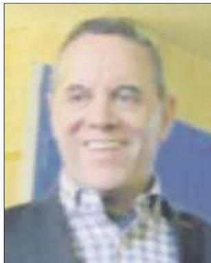
Por José Luis Montañez