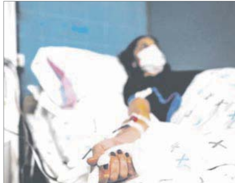
Después de una pésima racha de contagios al alza, por fin se lograron bajar a menos de 100 cada 24 horas.

Sobre los casos activos, la actualización apunta que hasta ayer eran 1 mil 790, de los cuales 1 mil 580 se encuentran en aislamiento social, enfrentando a la enfermedad sin síntomas de gravedad.