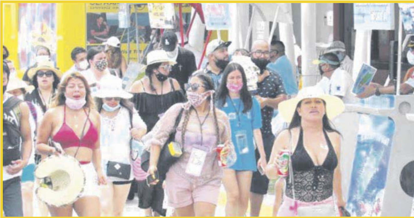
Cancún y Cozumel se ubican en los primeros lugares de recepción de viajeros que acceden a México

Cancún y Cozumel se han colocado durante el primer semestre de este año, en los primeros lugares de recepción de viajeros que acceden a México, tanto vía marítima como aérea, siendo una muestra clara de la recuperación turística.