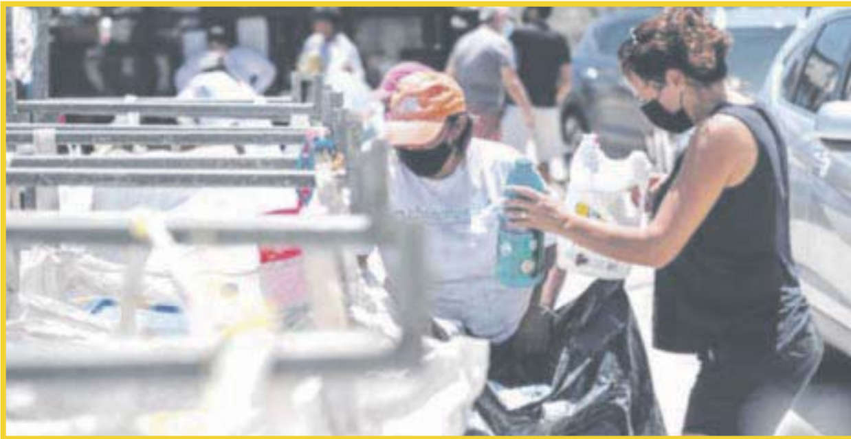
Se lograron 14 mil 940 kilogramos de desechos, recolectados a través del "Reciclatón".

El fin de semana se recibieron 14 mil 940 kilogramos de desechos recolectados a través del "Reciclatón", programa dedicado a la colecta de materiales que pueden ser reciclados; se logró un alza de 728 kilogramos, en comparación con la edición pasada.