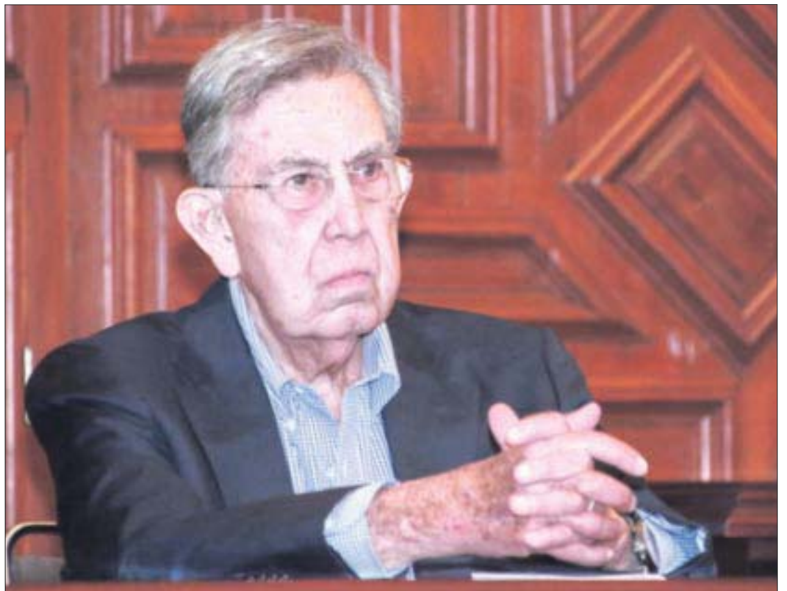
Cuauhtémoc Cárdenas , en su último intento, fue rebasado por López Obrador y ahora imparte conferencias.