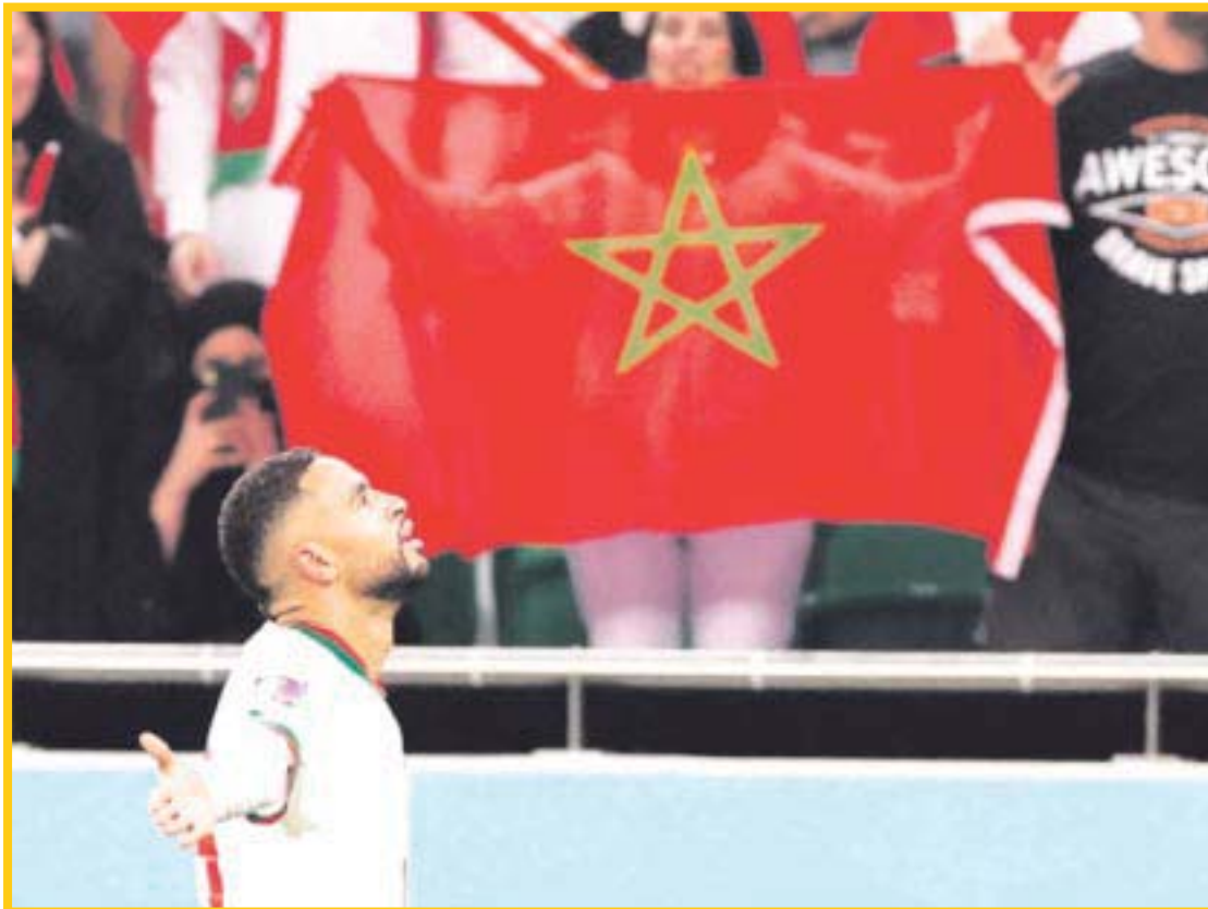
La Selección de Marruecos venció 1-2 a Canadá para sumar 7 unidades y ser líder del Grupo F del Mundial.

Marruecos despejó las dudas por haber designado a Regragui a tres meses del Mundial. El equipo norafricano se estrenó en Qatar con un empate ante Croacia y luego venció 2-0 a Bélgica, quizás el mejor resultado de su historia.