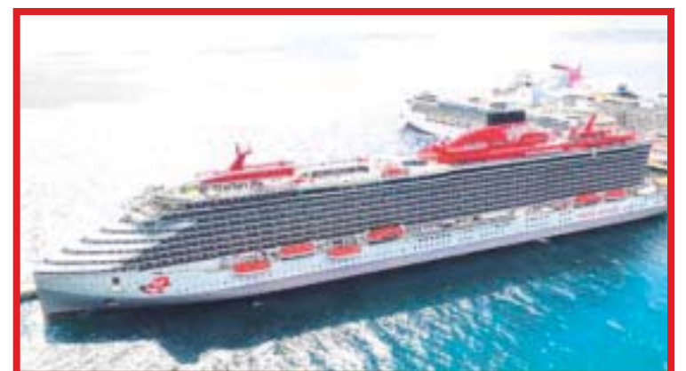
La "Isla de las Golondrinas" se consolida como uno de los puertos preferidos para el arribo de hoteles flotantes y confirma por qué fue reconocida como el Mejor Destino de Cruceros en México, en los Reader's Choice Awards.