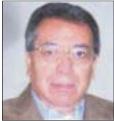
Por Roberto Vizcaíno