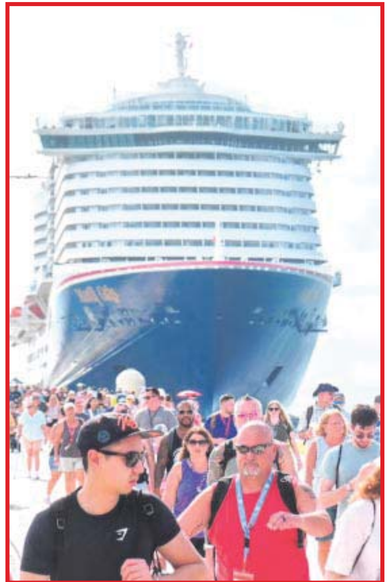
Al corte de noviembre la isla de Cozumel ha recibido más de 900 hoteles flotantes y a más de dos millones de pasajeros.

Por otra parte, la ruta internacional de Chetumal-San Pedro, Belice, que reinició operaciones el 6 de julio de este año, ya registró 162 arribos con cinco mil 197 pasajeros.