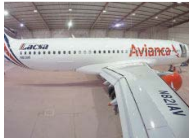
El avión de la colección vintage .

videña en Nueva York ya está New York; Lotte New York Pa-