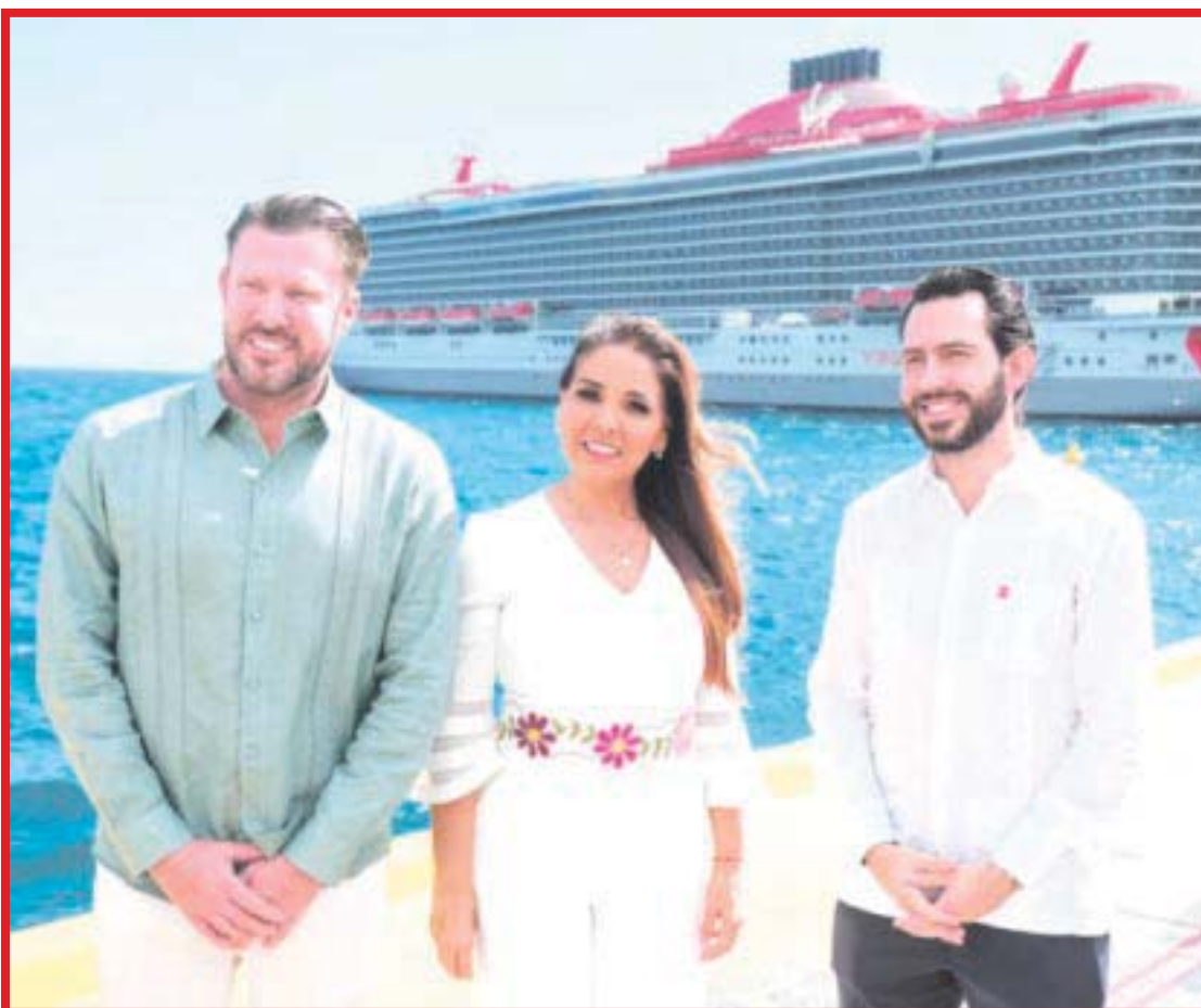
La gobernadora Mara Lezama reafirmó que una actividad de cruceros fuerte permitirá llevar prosperidad compartida y bienestar social a los hogares.