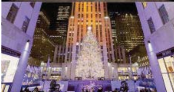
Museo de Broadway y el Árbol del Rockefeller Center.